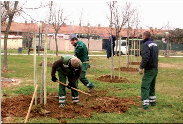
Operarios del Ayuntamiento plantando algunos de los nuevos ejemplares en el parque

El Ayuntamiento sustituye los almendros secos o enfermos por ejemplares de otras especies