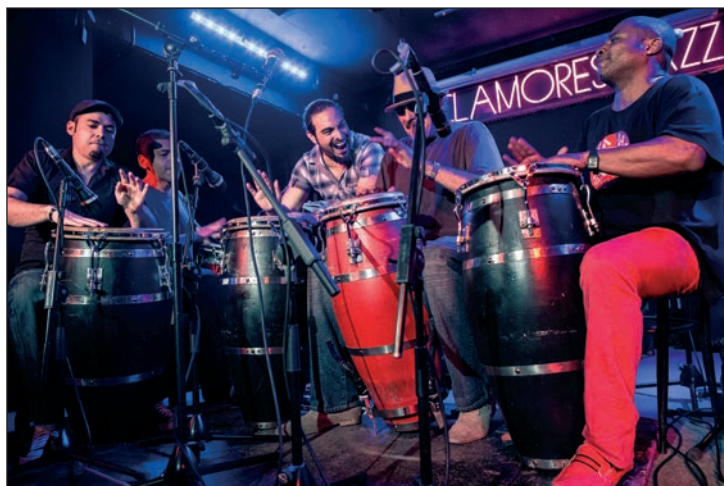
Una de las imágenes que se podrá ver del 1 al 28 de febrero en la Casa de la Cultura en la exposición 'Música para los ojos', de Jaime Massieu

el mes, del 1 al 28 de febrero, la Casa de la Cultura acoge dos exposiciones. Una de ellas, 'Música para los ojos', recoge fotografías tomadas por Jaime Massieu desde 2008 en salas de Madrid que acogen concier-