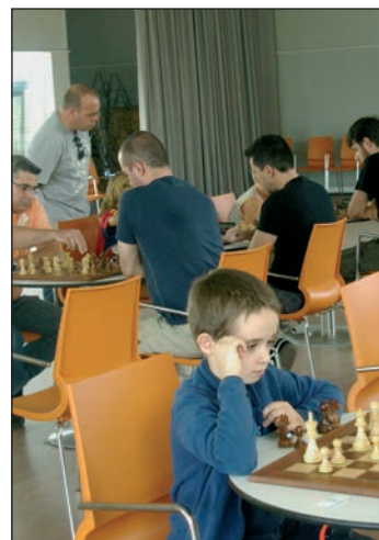
Torneo de ajedrez en el Centro de Ocio

Más información en el Club de Ajedrez de Azuqueca, que se reúne los miércoles y viernes, de 20 a 22 horas, en el El Foro.