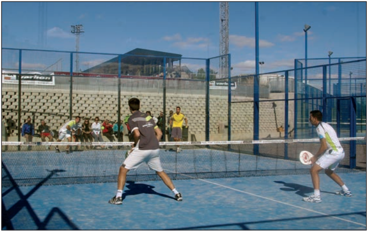
Los partidos se disputan en las pistas municipales del complejo San Miguel y de la zona deportiva Arroyo del Vallejo

Se han creado 14 grupos en la categoría Absoluta, dos en Mixta y uno en Femenina