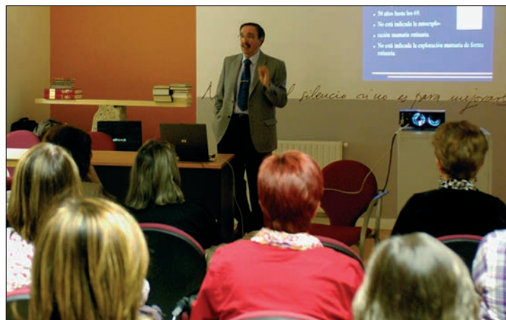
El programa del año pasado incluyó actividades culturales, deportivas e informativas. En la imagen, charla para la prevención del cáncer.

“También se va a organizar una jornada formativa a través del programa Escuela de Padres, además de la primera Jornada Deportiva por la Igualdad, que se celebrará