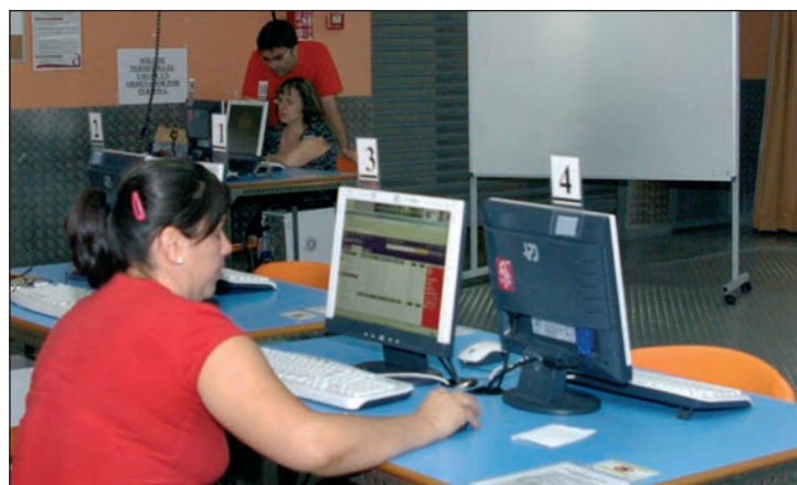
Los talleres se imparten por las mañanas en el Cibercafé de El Foro

éxito de esta iniciativa formativa. “El curso de febrero es la cuarta edición que se organiza y, además, contamos con más de un centenar de inscritas en la lista de espera, por lo que, mientras haya mujeres que quieran acercarse a las tecnologías,