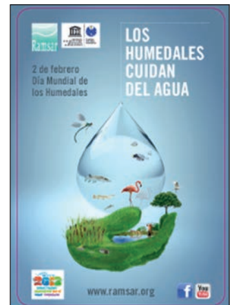
Cartel del Día Mundial de los Humedales

Los interesados en participar en la jornada deben acudir a la puerta del recinto (junto a la depuradora de agua), a las 10 de la mañana. Se recomienda llevar ropa y calzado cómodos y prismáticos. "Este es el momento de ver grandes grupos de aves que visitan este espacio en el invierno, como el cormorán, el pato cuchara, el porrón europeo o la garza real", explica el edil. En el último año, en este espacio protegido se han anillado 48 especies diferentes de passeriformes (aves de pequeño tamaño). "Se ha producido la curiosa circunstancia de que