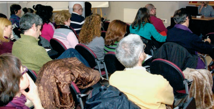
Alumnos en la primera sesión del curso impartido en enero