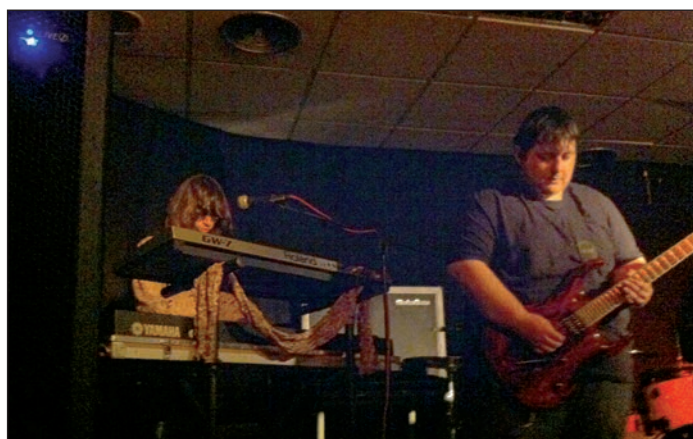
Un momento de la actuación que ofreció el grupo azudense Hyperboria el 25 de enero

Todas las actuaciones se graban en vídeo y los grupos o artistas reciben una copia de la grabación, "que les sirve para su promoción y también como herramienta de aprendizaje y autoanálisis", explica la responsable municipal de Juventud.