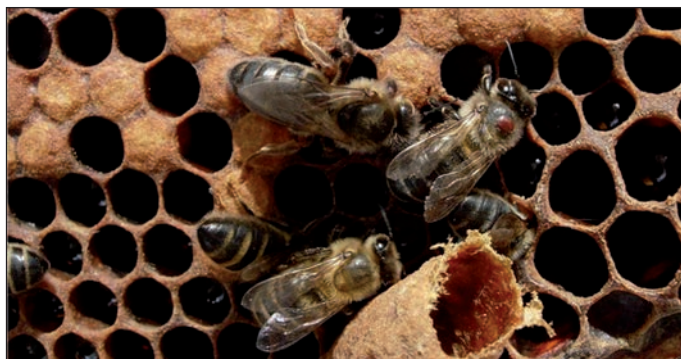
Fragmento de una de las imágenes premiadas en 2012

El portavoz del equipo de gobierno calificó de "intolerable" que se plantee la dimisión del primer edil que "se está dejando la piel para intentar que Cospedal se acuerde de Azuqueca y cumpla del Gobierno regional con los vecinos". Escudero también ha solicitado una vez más a los populares que "dejen de defender los intereses de su partido y empiecen a defender los de Azuqueca".