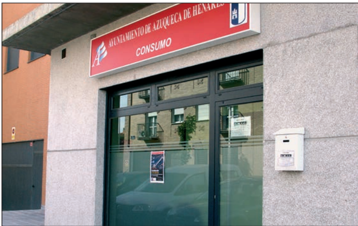
Fachada de la OMIC, en la calle Romero

La memoria de actividad de la OMIC refleja un aumento en el número total de consultas de casi el 14 por ciento con respecto a 2011. “Este incremento avala año tras año la utilidad de este servicio, que realiza una magnífica gestión, pese a los recortes aplicados por la Junta