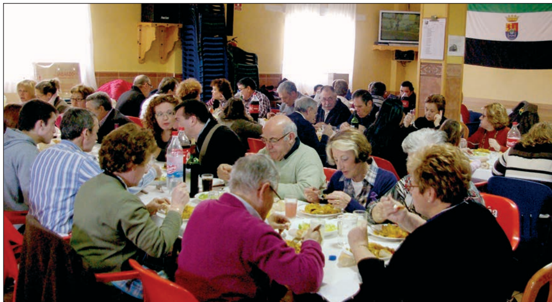
Los socios se reúnen los fines de semana para compartir la comida

El desarrollo industrial de Azuqueca de Henares atrajo en la década de los años sesenta del siglo XX a un gran número de trabajadores procedentes de distintos lugares de España. Muchos de esos nuevos vecinos procedían de Extremadura y, una vez asentados, la añoranza de su tierra les animó a fundar en 1997 la Casa de Extremadura, un lugar para compartir vivencias, recordar anécdotas y mantener tradiciones