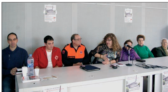
La concejala de Protección de la Salud, flanqueada por los representantes de los distintos colectivos que colaboraron en la organización

Tanto el alcalde, Pablo Bellido, como la concejala de Protección de la Salud, agradecieron "el trabajo que realizan los voluntarios, en beneficio de los demás. Cansado agradeció además la colaboración prestada en estas jornadas por las agrupaciones locales de protección Civil y Cruz Roja y los colectivos sanitarios que participaron: las asociaciones de Enfermos Reumáticos y Fibromiálgicos (AERFA) y de Enfermos del Corazón (AECAH) y de los grupos de ayuda contra la depresión Buscando una Esperanza y Luz en la Oscuridad. "Ayudan a todos, sensibilizando para un mejor conocimiento de sus patologías y la prevención de las mismas", destaca Cansado.