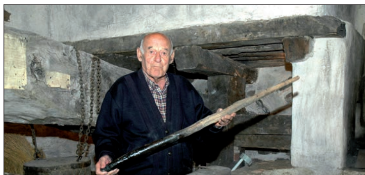
El lagar del Aula Apícola se inauguró coincidiendo con la sesión de Apistoria en Azuqueca en 2006