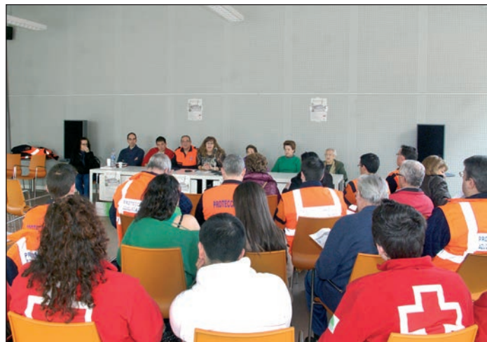
Las Jornadas se desarrollaron en el salón de actos del Centro de Ocio Río Henares

"La valoración que hicieron los participantes, al término de las jornadas fue muy positiva", afirma Cansado, que destaca que esta actividad sirvió para "además de aprender a conocer e identificar los peligros que tenemos en un lugar aparentemente seguro como es nues-