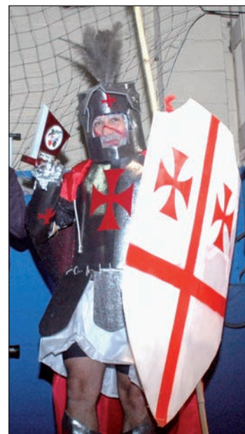
Ganador del premio al mejor disfraz de adultos en categoría individual del año pasado

El sábado de Carnaval se desarrollará el Desfile de Disfraces y el posterior concurso en el polideportivo de La Paz y la fiesta continuará para los más mayores con un Baile de Carnaval el domingo en el Centro de Ocio. Como colofón, el miércoles 13 tendrá lugar el Entierro de la Sardina. (Ver programa completo en cuadro inferior).