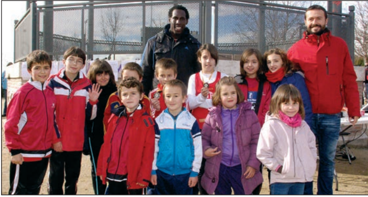
Parte de los alumnos de la Escuela Municipal participantes, junto al concejal de Deportes y su monitor

El parque de La Quebradilla acogió la segunda prueba del Campeonato Provincial en Edad Escolar