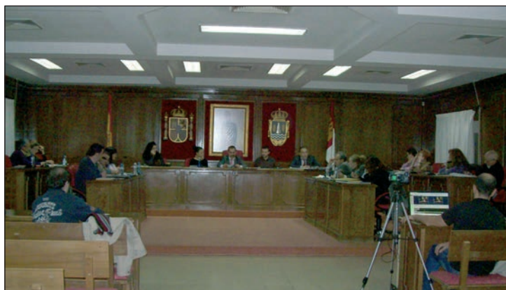
Un momento del Pleno en el que se aprobaron los presupuestos municipales para el año 2013

El alcalde, Pablo Bellido, definió el presupuesto como “realista y contenido, que apuesta por el empleo y dotado de un fuerte contenido social”. El primer edil destacó que las cuentas del Ayuntamiento experimentan una reducción de diez millones de euros con respecto a 2007, el último año antes del comienzo de la crisis. “Tenemos ahora en Azuqueca ocho mil vecinos más y diez millones de euros menos de presupuesto; las cifras las hemos cuadrado reduciendo los gastos del Ayuntamiento en todo, excepto en Cohesión Social, Personal y Desarrollo Económico y Empleo”, explicaba Bellido, que también recordó que la caída de ingresos se debe a la eliminación de programas y subvenciones de la Junta, a la disminución de la partida de Participación en los