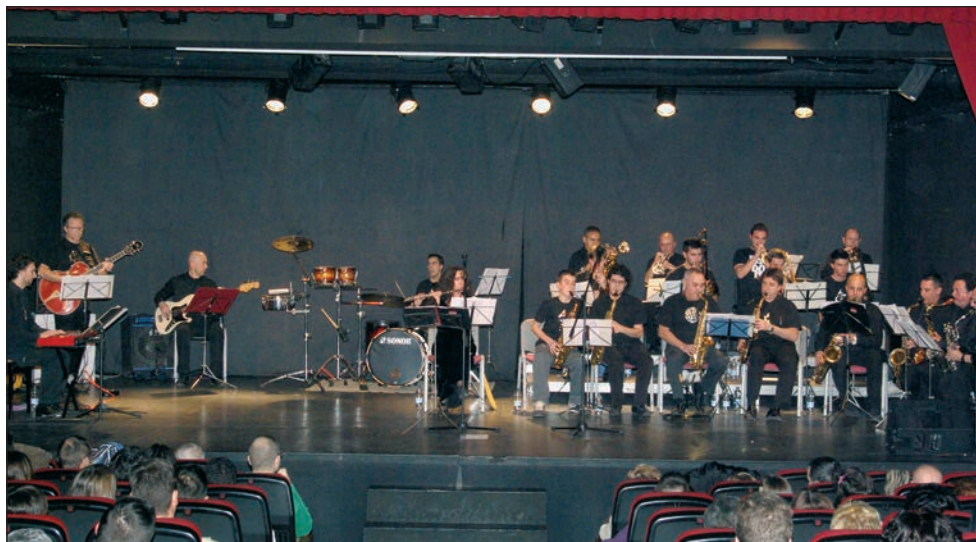
Imagen de archivo de uno de los conciertos de la edición del año pasado

Como novedad de esta edición, el Ayuntamiento ha programado actividades complementarias