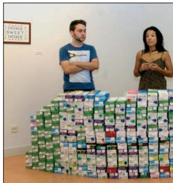
El autor y la concejala de Cultura en la inauguración de la muestra