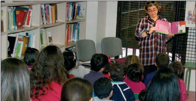
Las sesiones se celebran en la sala infantil de la Biblioteca

La Casa de la Cultura de Azuqueca de Henares acogió en enero tres representaciones teatrales. Por un lado, el día 12 se pudo ver el montaje ‘La ventana de Chygrynskiy’ (foto de la izquierda); mientras que el día 19, los títeres fueron los protagonistas con ‘Yen Shen’ (foto de la derecha) y ya el día 26, humor y música se dieron cita en ‘Con ganas... de reír’.