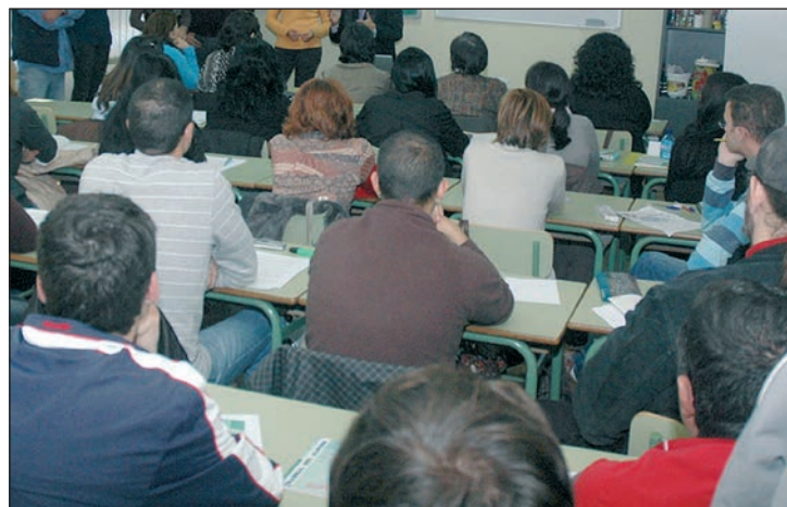
Imagen de archivo de un Taller de Empleo en Azuqueca tomada en noviembre de 2011

Los dos Talleres aprobados por la Junta para Azuqueca, 'Eficiencia energética de edificios' y 'Creación y gestión de microempresas', se dirigen a desempleados de más de 25 años, inscritos en las Oficinas de Empleo. Los seleccionados (ocho para cada uno de los proyectos) tendrán un contrato de formación y aprendizaje durante seis meses. "Entre los