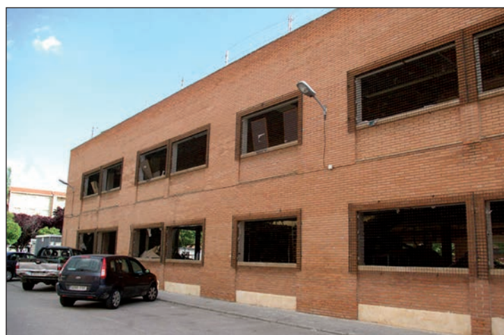
Exterior del Centro de Salud, tras la paralización de las obras

Para el primer edil, “es importante saber quien tomó la decisión de no hacer el Centro de Salud de Azuqueca, no por cuestiones políticas, sino porque de ello depende que se hagan las obras”. “Cospedal está buscando excusas para no hacer el Centro de Salud, y eso no voy a consentirlo. Espero que los