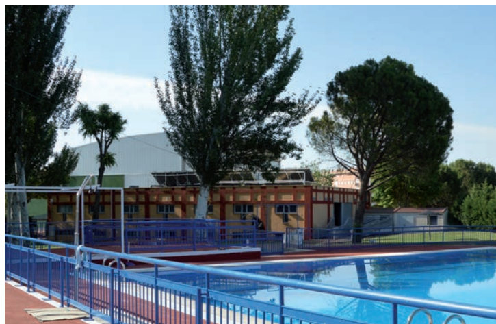
Las mejoras en la piscina se acometerán tras el cierre de la instalación

El proyecto, que ha sido adjudicado a la empresa Ceviam EPC S.L incluye además la rehabilitación del techo y el suelo de la sala de depuración de la piscina, así como la detección y reparación de posibles fugas en los tres vasos de la piscina municipal. Entre otros detalles menores, se incluye también la sustitución de sumideros, arquetas y otras reparaciones.