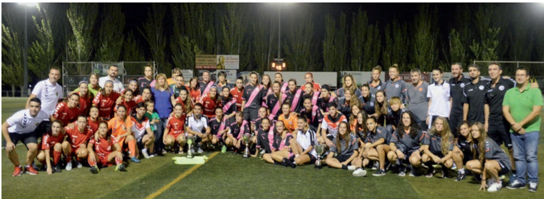
Foto de familia, al término del torneo disputado en el San Miguel

E l sábado 26 de agosto, se celebró en el campo de fútbol San Miguel el III Trofeo de Fútbol Femenino Ciudad de Azuqueca, en el que participaron dos equipos de la liga Iberdrola de Primera División, Rayo Vallecano y Zaragoza femenino y el Dínamo