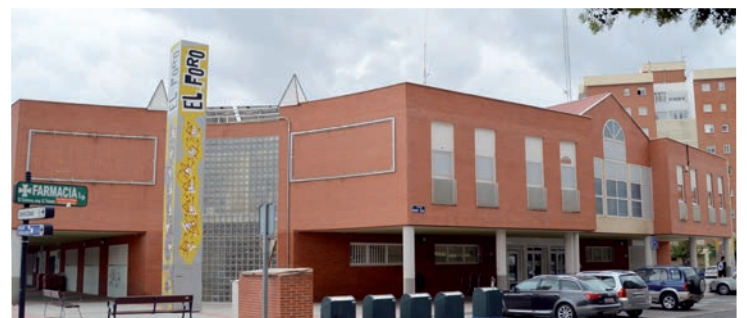
El aula de la UNED empezará a funcionar en la planta superior de El Foro

En el caso del Acceso a la Universidad, el plazo para formalizar la matrícula está abierto hasta el 20 de octubre. Las personas interesadas deben completar los trámites de manera telemática a través de la página