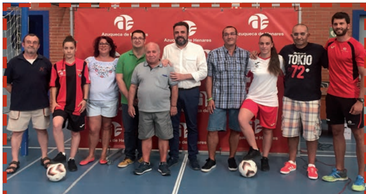
UNIÓN DEPORTIVA AZUQUECA FÚTBOL SALA

La aportación económica, que asciende a un total de 157.000 euros, se completa con la cesión de espacios municipales para que los diferentes equipos de cada club pueda entrenar y jugar los partidos de sus respectivas competiciones. Por su parte, los clubes se comprometen a la celebración de dos eventos deportivos y a colaborar con el Ayuntamiento en la celebración de actividades. •