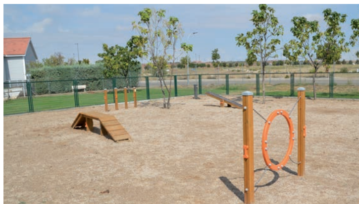
El nuevo parque canino dispone de elementos de juego y ejercicio