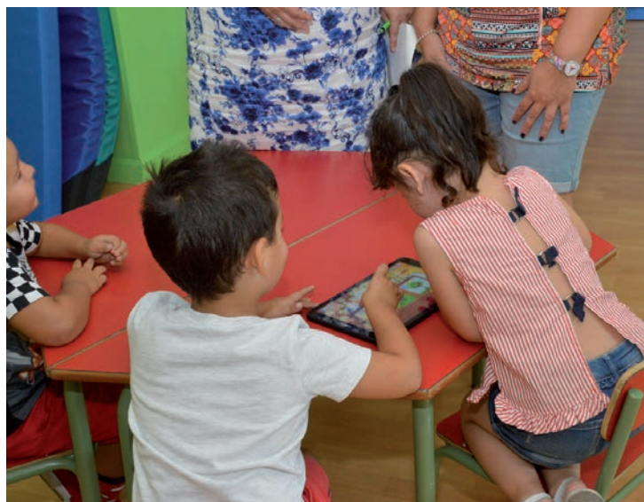
El alumnado de las Escuelas Infantiles ya ha empezado a utilizar los dispositivos