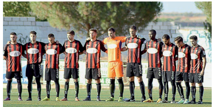
▲ Jugadores del CD Azuqueca, al inicio del primer partido de la temporada, en casa y frente al Marchamalo

En cuanto a la campaña de captación de socios, el Club ya suma supera las 1.200 altas y confía en poder alcanzar los 2.000 carnés. Las personas interesadas tienen hasta el 30 de septiembre para conseguir su pase de manera gratuita. Más información, en la página web cdazuqueca.es .