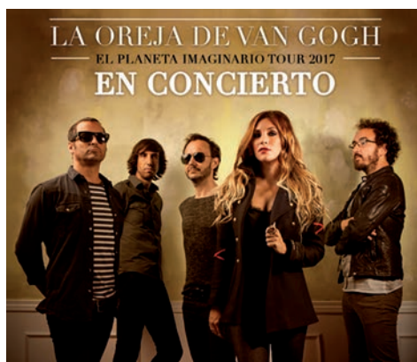
▲ La Oreja de Van Gogh

El cartel musical de las Fiestas se completa con dos citas más en el calendario. Ambas se van a desarrollar en el Recinto Ferial y tienen carácter gratuito. Por un lado, el sá-