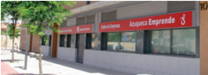
Las solicitudes se deben presentar en el Centro de Empresas

Al igual que en la primera fase, de la que se beneficiaron 135 desempleados, las personas contratadas percibirán el Salario Mínimo Interprofesional si su puesto no requiere cualificación, mientras que en los puestos con titulación media o superior, el Ayuntamiento suplementará la cantidad con 200 y 400 euros, respectivamente. Todos los contratos tendrán una duración de seis meses.