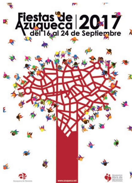
▲ Cartel de las Fiestas

“Hemos preparado para estos días música para todos, actividades para los