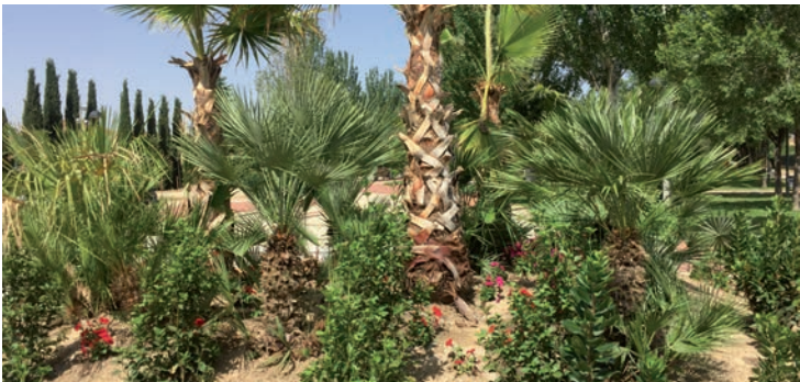
▲ Plantación en el parque del Norte

actuaciones realizadas. En el parque, se han hecho nuevas plantaciones en el acceso principal y se ha acondicionado una zona con con palmeras washingtonias -una especie de de crecimiento rápido y con pocas necesidades de riego-, mezcladas con flores de temporada. En la plaza de San Pedro, se han sustituido los árboles que se encontraban en malas condiciones por palmeras washingtonianas. "Como es habitual, la elección de las especies o de la decoración final responde a criterios de eficiencia y sostenibilidad", resalta el edil azudense •