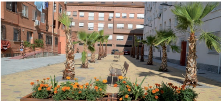
▼ Imagen de la plaza de San Pedro tras la actuación acometida