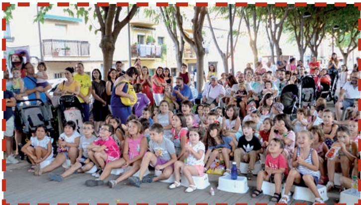
‘TITIRIQUECA 2017’ Y CINE DE VERANO

La primera sesión se celebrará el 5 de octubre y el plazo de matrícula estará abierto en la Casa de la Cultura del 4 al 30 de septiembre. El precio es de 30 euros por trimestre y de 80 por el curso completo.