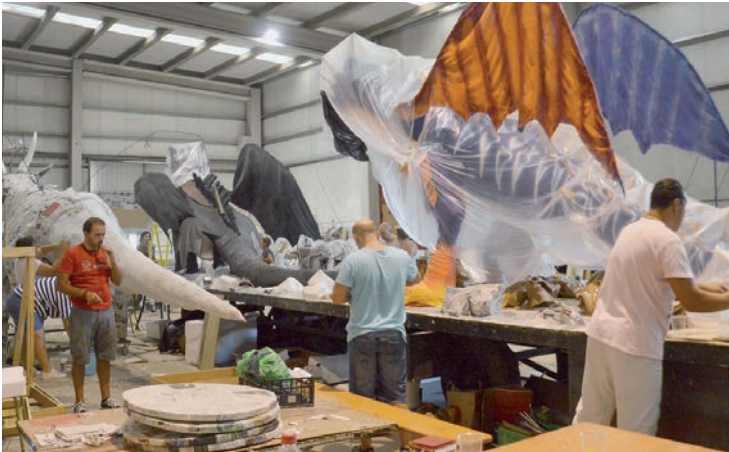
▲ Peñistas trabajando en la preparación del desfile