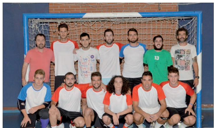
▲ Jugadores de la nueva plantilla