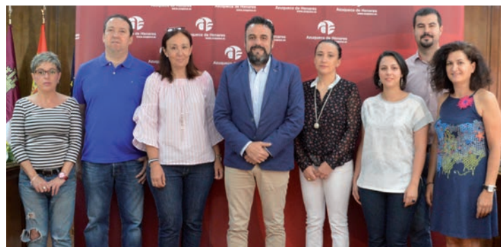
El alcalde, la concejala de Comercio y Consumo, con la Junta Directiva de ACEPA

El primer edil insiste en la importancia de los negocios locales porque “facilitan la vida diaria de los vecinos, que no necesitan desplazarse fuera de Azuqueca para realizar sus compras, generan riqueza, crean empleo y, además, ayudan a crear ciudad”.