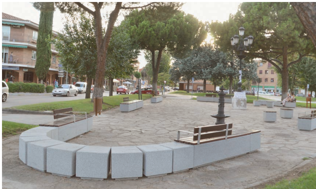
Imagen de la plaza con el nuevo mobiliario urbano instalado