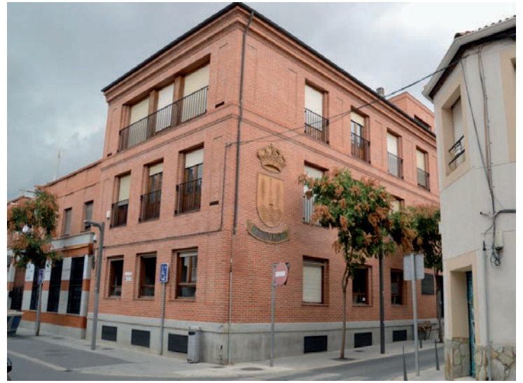
Fachada del edificio municipal al que se trasladan los servicios vinculados a la concejalía de Cohesión Social

La reapertura de este edificio permite liberar espacio suficiente en El Foro para albergar el aula de la Universidad Nacional a Distancia (UNED), que empezará a funcionar en octubre con el curso de acceso para mayores de 25 y 45 años. También se ubicará en El Foro la Escuela Municipal de Idiomas (EMIA). •