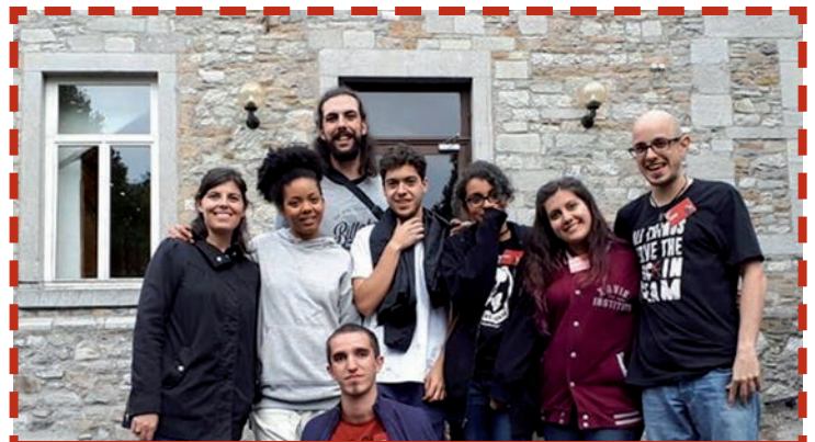
INTERCAMBIO CON VILLER SAINT GERTRUDE (BÉLGICA)