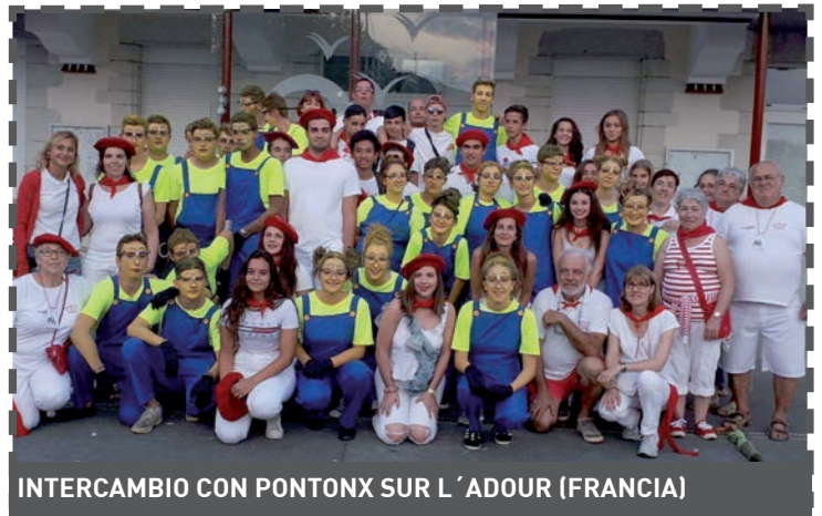
INTERCAMBIO CON PONTONX SUR L'ADOUR (FRANCIA)

La edil recuerda que el objetivo del Ayuntamiento con estos programas "es contribuir a reforzar el sentimiento de pertenencia a la Unión Europea y fomentar la reflexión sobre aspectos sociales, con concreto sobre los estereotipos relacionados con la juventud".