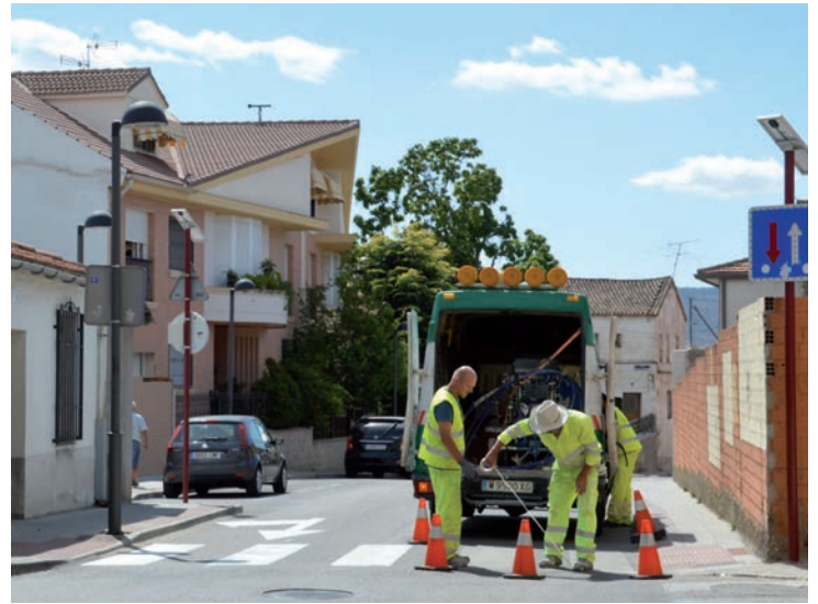
Operarios trabajando en un paso de peatones

Centro de Atención a la Diversidad Funcional. - El Ayuntamiento de Azuqueca ha acondicionado la planta superior de la Escuela Infantil Municipal La Noguera para su uso como Centro de Atención a la Diversidad Funcional (CADIF). En estas instalaciones, se ofrecen terapias y actividades para personas mayores de 18 años con diversidad funcional. El Ayuntamiento pondrá las instalaciones a disposición de la asociación Caminando para la organización de actividades y la prestación de terapias. En la imagen, el alcalde y la concejala, durante una visita a las obras.