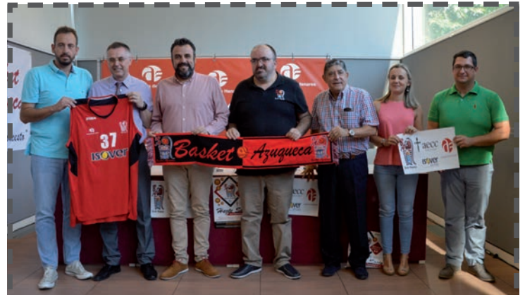
CLUB BASKET AZUQUECA

Una aportación económica de 17.000 euros y la cesión del polideportivo Arroyo del Vallejo vienen contempladas en el convenio suscrito entre el Ayuntamiento y este club, que fue presentado el 11 de julio (imagen superior).