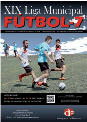
Cartel de la actividad

Está previsto que la competición comience en octubre y