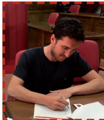
CLUB DEPORTIVO AZUQUECA