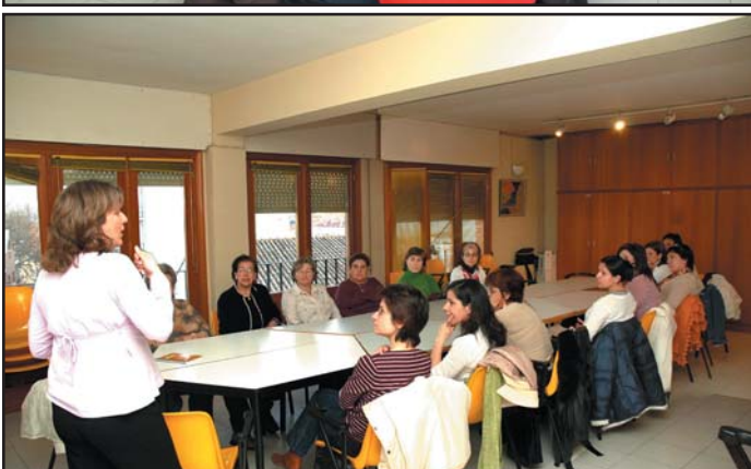
Los dos talleres de Servicios Sociales se imparten durante todos los martes, hasta el 28 de marzo