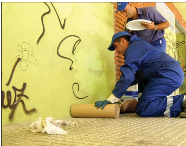
Imagen de archivo de la campaña de Limpieza Fachadas que desarrolló el Ayuntamiento el año pasado

Vicente García. Además de ampliarse en el número de horas, la intención del Ayuntamiento es hacer extensiva la iniciativa a edificios privados en esta ocasión. "Se exigirán una serie de requisitos, pero queremos actuar en fachadas públicas como hicimos el año pasado y también en fachadas particulares", añadía el responsable municipal de Servicios.