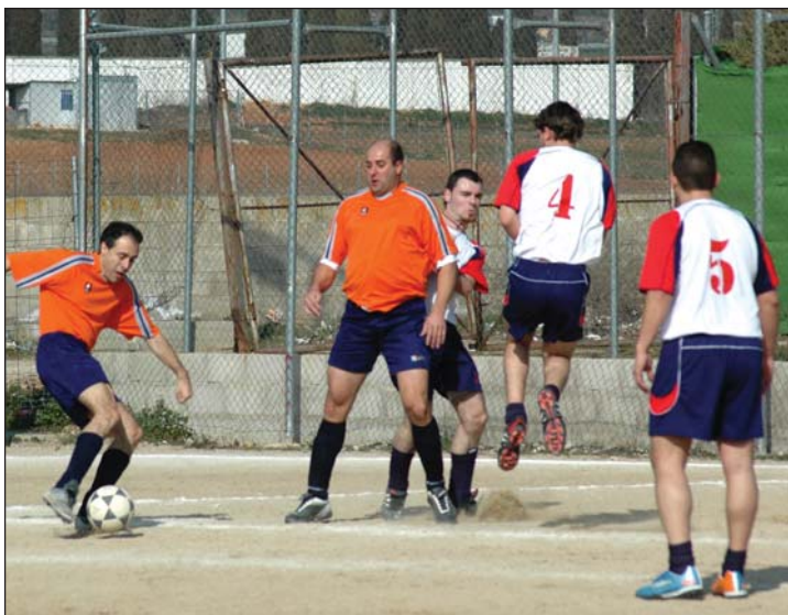
52 equipos de fútbol 7 de Azuqueca han disputado un campeonato alternativo, la competición de Copa.