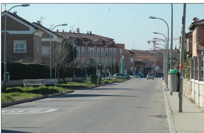
El ayuntamiento pretende remodelar la Avenida Virgen de las Nieves con el objetivo de ampliar las aceras, reubicar las farolas y modificar la calzada