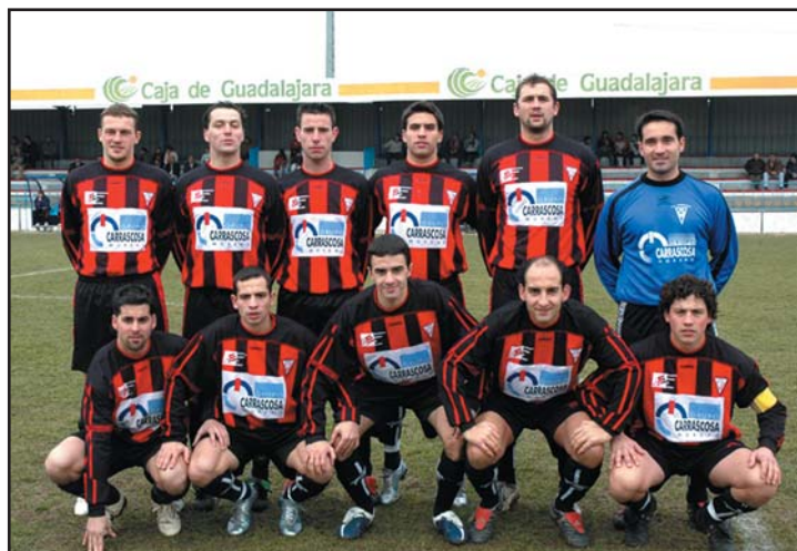
El presidente del Club Deportivo Azuqueca está convencido de que el equipo tiene calidad suficiente como para conseguir el ascenso a Tercera División