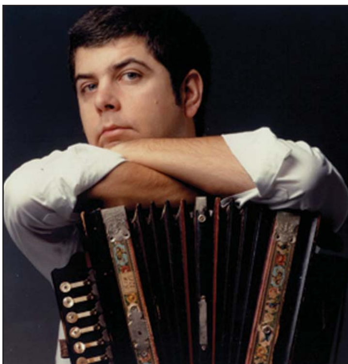
Kepa Junkera ya estuvo en Azuqueca

Kepa Junkera empezó bebiendo de las fuentes tradicionales pero pronto abandonó este ambiente por la fusión con el jazz y poco más tarde el jazz dejaría su sitio al folk-rock. En sus creaciones más reconocidas internacionalmente: "Bilbao 00:00h" y "Maren" han participado músicos de gran prestigio en el folk internacional. Giras por todo el mundo, dos discos de Oro y una nominación a los Latin Grammy Awards y el Latin Grammy Award al mejor álbum folk por su trabajo "K", son parte de la recompensa de Kepa Junkera.