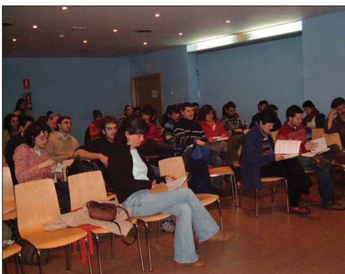
Asistentes a una de las charlas del "Foro por un comercio Justo"

Otras ideas comunes que comparten estas organizaciones son su oposición a la comercialización de