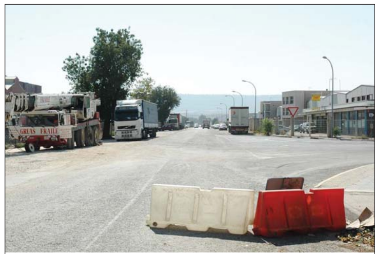
La avenida del Vidrio discurre entre la autovía y el antiguo paso a nivel