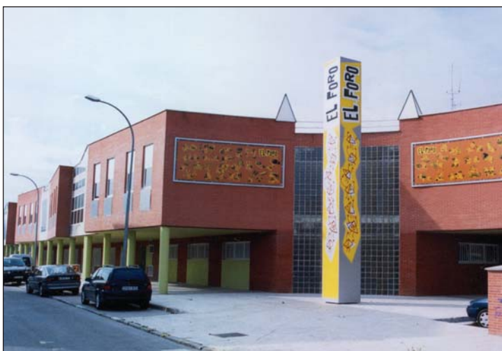
El Ayuntamiento pretende cubrir la pista central de El Foro