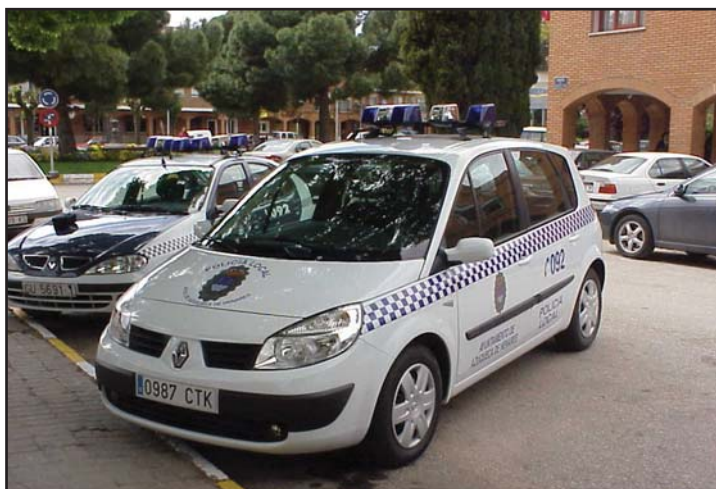
Agentes de la Policía Local de paisano participan en el dispositivo para garantizar el cumplimiento de la ordenanza

En los primeros fines de semana de aplicación de la ordenanza, policías de paisano han patrullado por las zonas frecuentadas por los jóvenes.