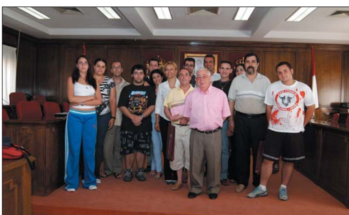
Imagen de Archivo del acto de clausura de la última edición del curso de Carretilleros, celebrado en julio de 2005

Según María José Naranjo la integración de los jóvenes en el mundo laboral resulta mucho más fácil porque "en el curso, además de aprender en las horas teóricas, cuentan con una parte práctica imprescindible en la que manejan todo tipo de carreti-