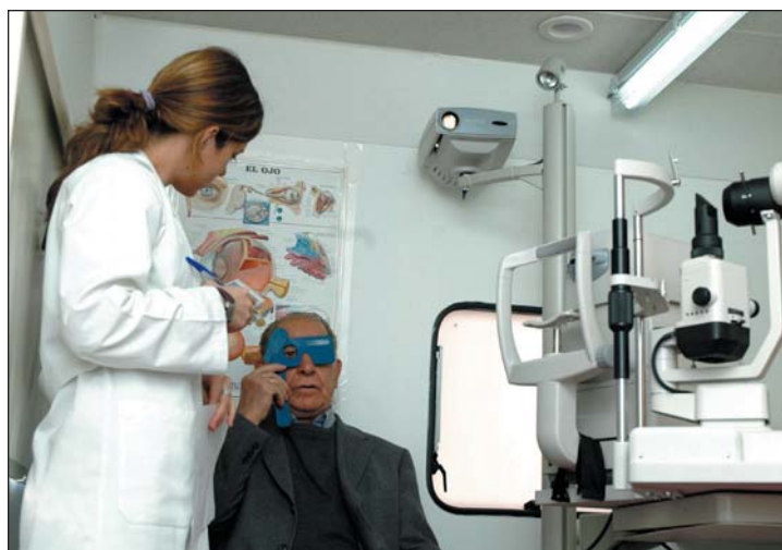
Examen oftalmológico en el interior de la unidad móvil que Vissum instaló en Azuqueca