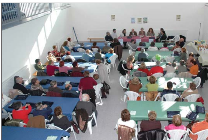
En la imagen superior, interior de la cocina del Centro de Adultos, debajo, los participantes en la jornada

recordó que con anterioridad ya se habían realizado actividades similares dirigidas a la población infantil. "Ahora se ha querido hacer llegar también a los adultos el mensaje sobre la impor-