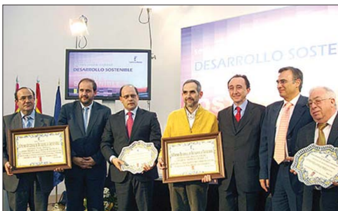
Arriba, la Reserva Ornitológica. Debajo, foto de familia de los premiados

máximo las riquezas medioambientales que tiene".