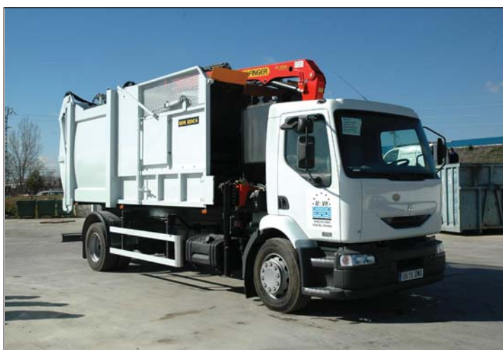
El camión que recogerá los contenedores amarillos ha costado 138.000 euros

Henares, el servicio de recogida era ya imprescindible "debido al aumento poblacional que se está experimentando en los municipios que forman parte de la Mancomunidad".