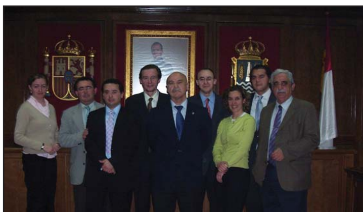
Los concejales del PP rechazaron el presupuesto elaborado por el equipo de gobierno

do una subida mayor". Para Alvarado, el aprobado en el pleno es "el presupuesto posible para este Ayuntamiento".