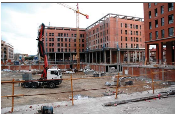
El aparcamiento estará terminado en ocho meses, según las previsiones