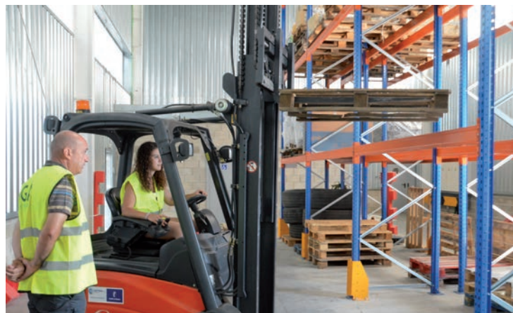
Imagen de archivo de un curso de formación para mejorar la empleabilidad de los jóvenes, celebrado en junio de 2017

Durante el desarrollo del itinerario formativo, el alumnado participante recibirá una beca de formación. Los tres itinerarios tendrán entre 320 y 350 horas de formación y orientación, más otras 100 horas de prácticas en entornos reales de trabajo y orientación posterior para la búsqueda de empleo.