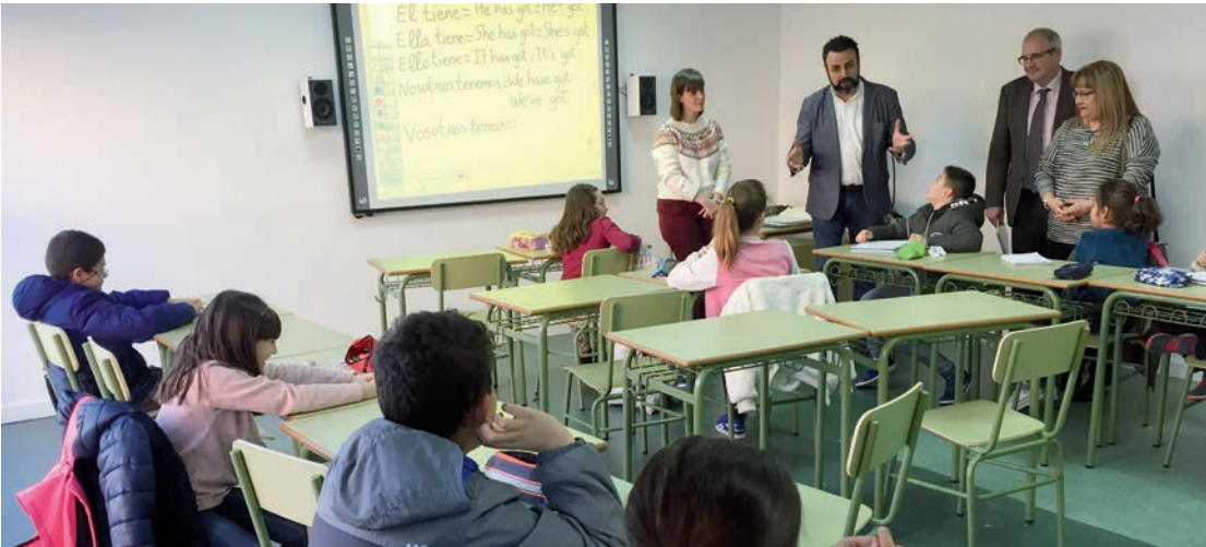
Una de las aulas de la EMIA, dotada con el equipamiento tecnológico que incluye pizarra digital

➤ Se han habilitado cinco aulas con pizarras digitales, ordenadores y equipos de sonido para el aprendizaje de idiomas