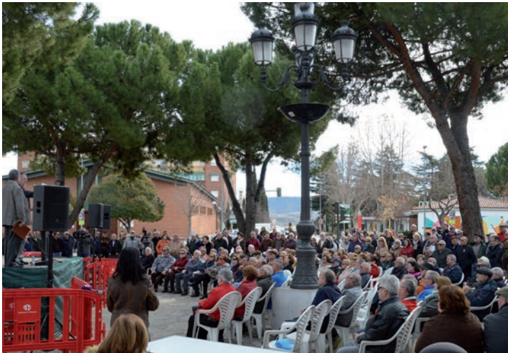
Imágenes tomadas durante la concentración del 19 de febrero para reclamar una mayor subida de las pensiones

El 15 de enero, se celebró un primer acto convocado por este colectivo, al que asistieron más de un centenar de personas y los organizadores han anunciado que la próxima cita será el 19 de marzo (tercer lunes de mes) en la misma plaza de La Constitución. •