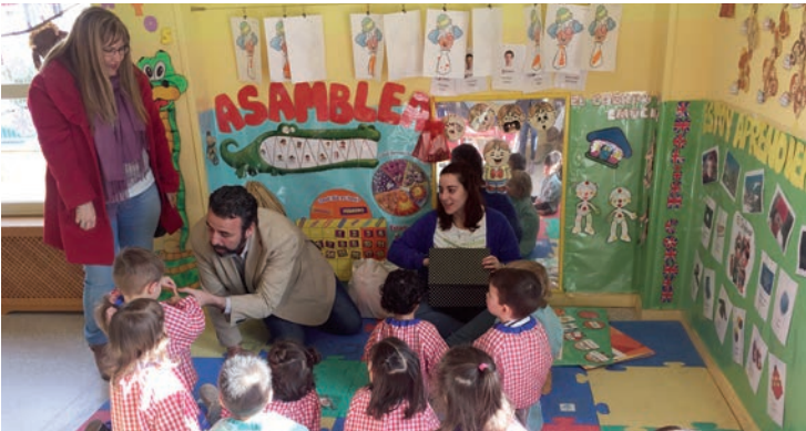
Sesión en una Escuela Infantil

> Para la enseñanza de inglés y francés, dentro del Programa Municipal de Apoyo al Plurilingüismo