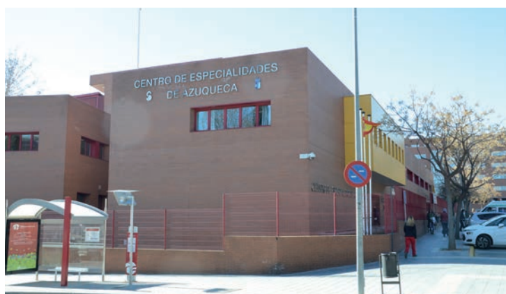
Imagen exterior del Centro de Especialidades de Azuqueca

La actividad en el CEDT ha aumentado, con 4.000 consultas más que en 2016, según Fernández, que aseguró que en Cirugía Mayor Ambulatoria se han hecho 244 intervenciones más que en 2016. Por lo que respecta a técnicas diagnósticas, el consejero resaltó un incremento del 25 por ciento con respecto al año anterior y destacó que desde que en febrero de 2017 se reinició la actividad de TAC se han realizado 606 pruebas. En cuanto a las pruebas de Holter cardíacos, en 2017 se realizaron 322, el doble que el año anterior. Además, la recuperación de Ecocardiografía ha permitido realizar 217 técnicas. Por último, Fernández aseguró que en 2017 se