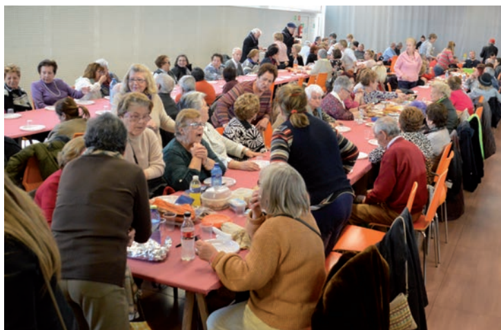
Mayores participando en la fiesta organizada en el Centro de Ocio con motivo del Jueves Lardero

Las personas interesadas en este nuevo programa pueden solicitar su incorporación, junto con la documentación requerida, del 2 al 16 de marzo en el Servicio de Atención a la Ciudadanía (SAC) del Ayuntamiento. Más información, en el edificio de los Servicios Sociales municipales, ubicado en la calle Las Eras, s/n, y en el número de teléfono 949 27 73 48.