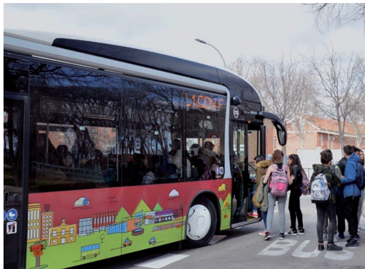
Usuarios subiendo a uno de los autobuses urbanos que prestan servicio en Azuqueca

"El transporte colectivo evita desplazamientos en vehículos pri-