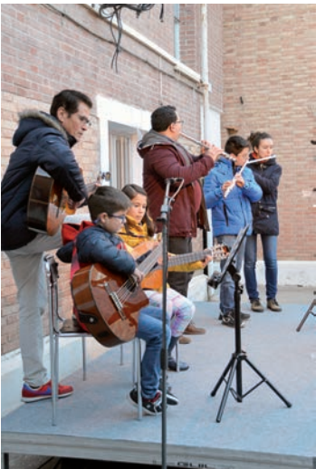
Alumnos y profesores de los talleres municipales de Cultura pusieron música al acto de colocación de la primera piedra del nuevo espacio cultural