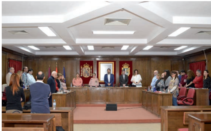
El Ayuntamiento volvió a condenar la violencia machista con un minuto de silencio al inicio de la sesión

En la propuesta, se solicitan medidas de prevención de la violencia