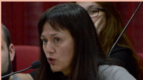
Silvia García, portavoz de Ciudadanos