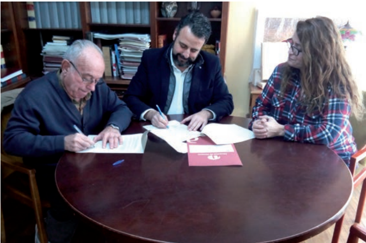
De izquierda a derecha, el presidente de la Hermandad, el alcalde y la concejala de Fiestas y Cohesión Social, durante la firma del convenio

San Isidro en mayo y en las de Septiembre”, recuerda el primer edil. “La Hermandad, al igual que otros colectivos y asociaciones de Azuqueca, ayuda a que la ciudad siga creciendo y mejorando”, aseguraba Blanco, tras la firma del convenio.