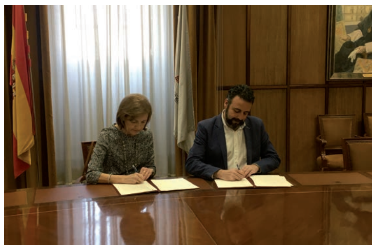
La vicerrectora y el alcalde, durante la firma del contrato para la realización del trabajo de investigación