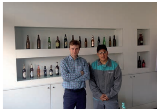
Cuatro de los beneficiarios de la primera edición de las prácticas internacionales, en sus centros de trabajo en distintos países de la Unión Europea

Formación Profesional de Grado Medio, y estar inscritos en el Sistema Nacional de Garantía Juvenil y en Iniciativa Puente. El objetivo de estas becas es que los participantes mejoren sus competencias lingüísticas en inglés. Se trata de un programa de inmersión lingüística de ocho semanas, en régimen de alojamiento y pensión completa en familias, y con los gastos de