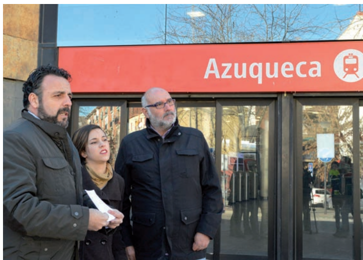
El alcalde, acompañado de los concejales de Juventud y Urbanismo y Desarrollo Sostenible, en la estación de tren, en una imagen de archivo

Blanco, que conoce en profundidad el funcionamiento de los Cercanías tras más de 30 años como trabajador de Renfe (buena parte de ellos en la línea C2),