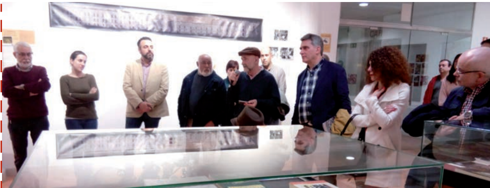
Fuerte de San Cristóbal. Hasta el 7 de marzo, se puede visitar en la Casa de la Cultura de Azuqueca de Henares ‘Que aflore lo enterrado. El Fuerte de San Cristóbal’, una exposición sobre el denominado ‘campo de exterminio’ de este fuerte, ubicado en Pamplona y que impulsa la asociación Txinparta y miembros de la Recuperación de la Memoria Histórica. En la imagen, un momento de la inauguración, celebrada el 23 de febrero.

Con una inversión cercana a los 50.000 euros, se han ampliado los espacios disponibles para la acogida de perros. Como novedad, se han montado dos grandes jaulas de 24 metros cuadrados cada una para la acogida de gatos. Además, el espacio de recreo se ha dividido en tres áreas cercanas a los 100 metros cuadrados para poder sacar varios animales a la vez para su adiestramiento y ocio.