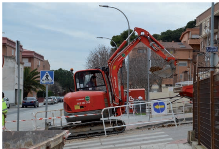
Una máquina trabajando en la calle Cifuentes

En todos los casos, el proyecto contempla también que la empresa adjudicataria reponga los pavimentos afectados, tanto en el caso de aceras, como en los aparcamientos o calzadas, así como la señalización horizontal de todas las calles en las que se actúe.