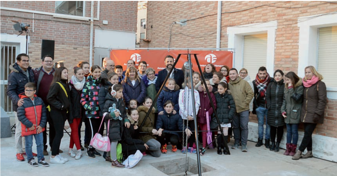
Foto de familia tomada en el patio del cuartel tras la colocación de la primera piedra de la nueva Casa de la Cultura, en la que participaron representantes del Ayuntamiento, alumnos y profesores de los talleres municipales de Cultura y el director de la Banda

> Se instalarán allí los talleres municipales de Cultura y el edificio será también la sede permanente de la Banda de Azuqueca