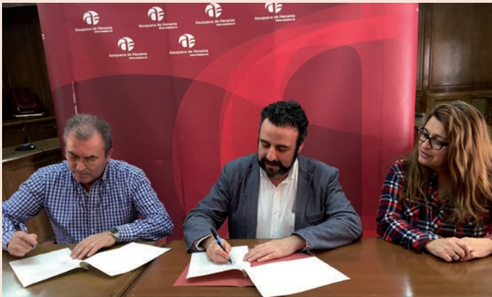
Arriba, un momento de la firma del convenio con la Casa de Andalucía. Debajo, imagen tomada tras la firma del acuerdo con la Casa de Extremadura.

El día 28 de febrero, la Casa de Andalucía celebra el Día de esta región con un acto en su sede, en la avenida de la Técnica. Por su parte, la Casa de Extremadura celebrará sus jornadas en torno a la matanza entre el 9 y el 11 de marzo en el complejo San Miguel. •