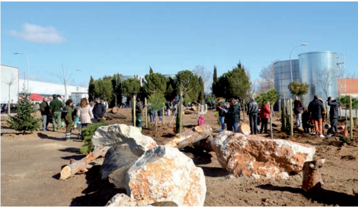
Vista general de la plantación del 28 de enero en la avenida de la Industria