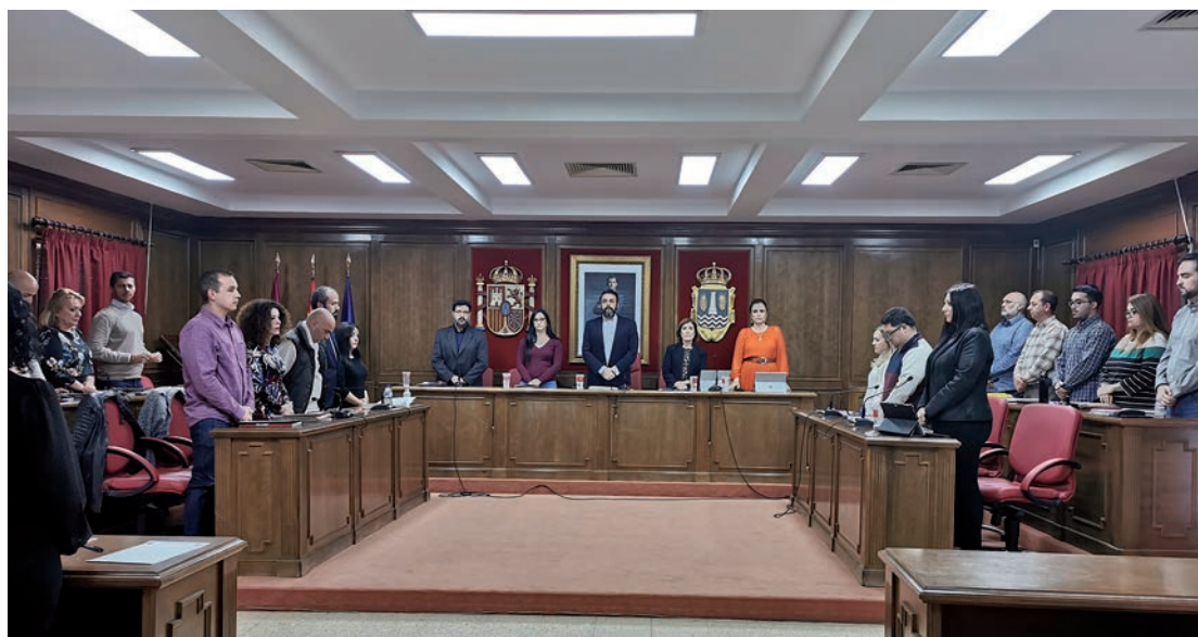
Al inicio de la sesión del 27 de febrero, se guardó, como es habitual, un minuto de silencio para condenar la violencia de género

En el texto de la moción se incluye la exigencia al gobierno de Es-