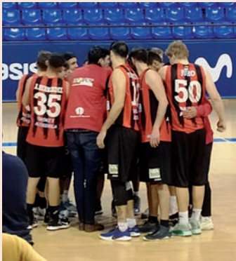
en la séptima plaza de la clasificación de la liga EBA.

Posteriormente, los chicos de Jorge Lorenzo ganaron 84-80 a “un gran Náutico Tenerife” y en un encuentro “con dos equipos que lo dieron todo en la cancha”. Por último, cayeron 85-69 en su visita al Zentro Basket Madrid por “un mal primer cuarto” al que no consiguieron dar la vuelta. Con esta derrota, el Isover Basket Azuqueca se sitúa