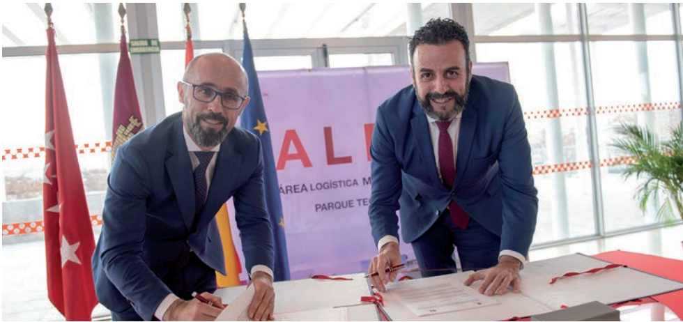
Los alcaldes de Meco y Azuqueca, durante la firma del protocolo de colaboración

El primer edil azudense aseguró también que ALMA Henares “va a cambiar el concepto de superficie logística” y destacó que será un proyecto sostenible medioambientalmente y que apostará por el empleo de calidad. •