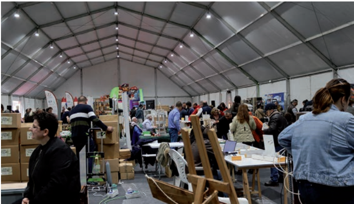
Sobre estas líneas, vista de la Feria de Productos y Material Apícola, en la carpa junto al Centro de Ocio; debajo, la cerería Ortiz, trasladada desde Madrid al Aula Apícola Municipal

El concejal de Buen Gobierno también pone en valor que “estas Jornadas y Feria ayudan a dinamizar la actividad económica, cultural y social de la ciudad”. En este sentido, el Aula Apícola Municipal acogió talleres infantiles -pintacaras, globoflexia, pintapiedras y manualidades- y para adultos -en la cerería Ortiz, trasladada desde Madrid -. Además, siete establecimientos hosteleros participaron en la tercera FERIA de la Tapa con Miel. •