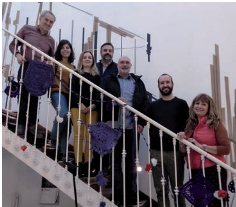
Los representantes azudenses, con los responsables del Centro Europa Joven Madrid, después de la visita

“La visita al servicio madrileño nos ha permitido compartir e intercambiar experiencias