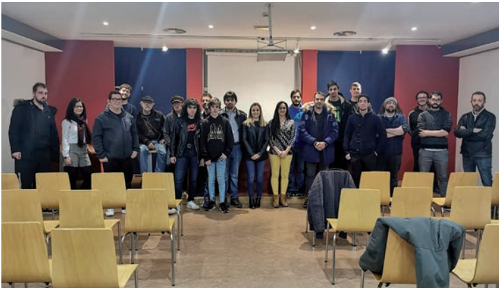
Los músicos, junto a la primera teniente de alcalde y la concejala de Igualdad, tras la firma de los convenios

El pabellón Ciudad de Azuqueca acogió el 29 de febrero el primer Torneo del Henares de Fútbol Sala Inclusivo , en el que participó el equipo de la asociación local ADA, así como dos conjuntos del Ínter Movistar (Alcalá de Henares), dos de la asociación Las Encinas de Guadalajara, y dos de la fundación Madre de la Esperanza de Talavera de la Reina (Toledo).