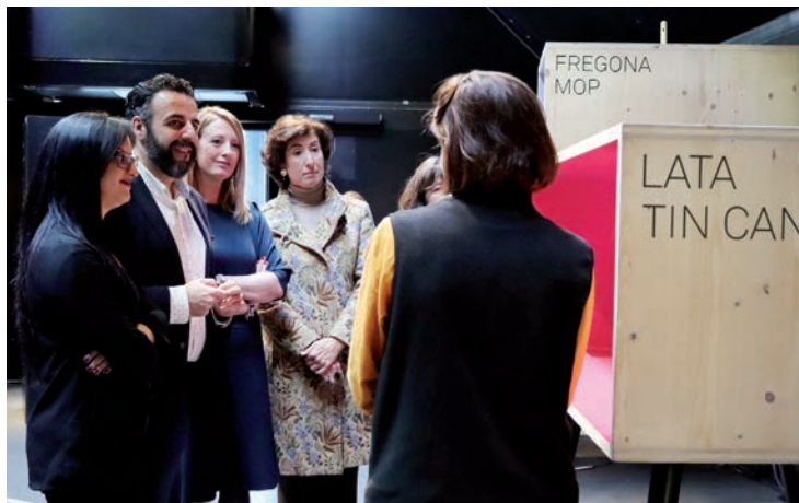
Responsables municipales y de laCaixa en el interior de la exposición