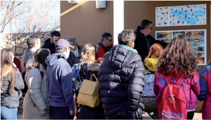
Los estudiantes de la Universidad de Alcalá, en las instalaciones de la Reserva