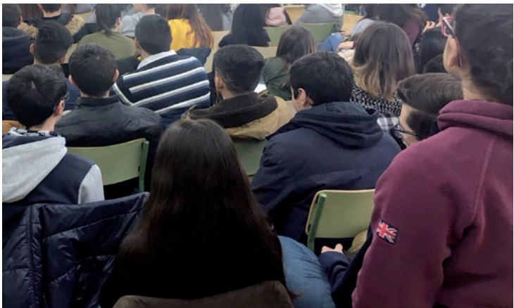
Imagen de archivo de estudiantes de Secundaria de Azuqueca

“Prendemos fomentar la participación y la colaboración de los y las jóvenes y adolescentes azudenses”, explica la concejala de Igualdad de Oportunidades, Piedad Agudo, quien añade que “cada uno de los centros contará con cuatro corresponsales, por lo que, en total, habrá doce”.