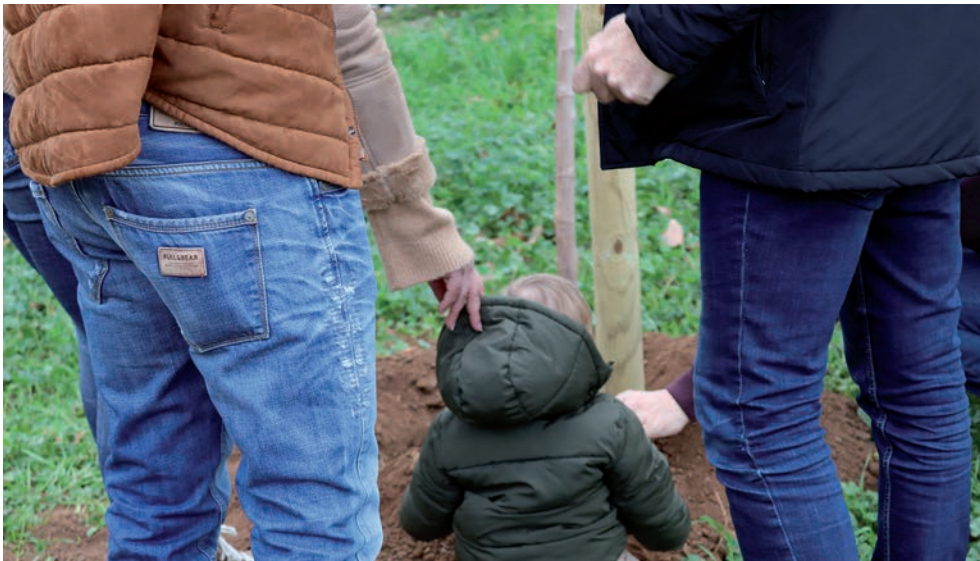
Arriba, plantación del día 9 de febrero. Debajo, participantes en la convocatoria del 23 de febrero

“El objetivo de ‘En Azuqueca nace un bebé, nace un árbol’ es doble: por un lado, se ayuda a crear y a afianzar el sentimiento de pertenencia a la ciudad, ya que cada niño o niña recibe un título de enraizamiento con sus datos y los del árbol y, por el otro, permite aumentar el número de árboles de Azuqueca, con todos los beneficios que eso conlleva”, apunta el primer edil. Entre esos beneficios, se encuentra la absorción del dióxido de carbono para mitigar el cambio climático, promover la biodiversidad urbana, producir oxígeno, regular el flujo de agua o reducir la contaminación acústica, entre otros. Desde que este programa se puso en marcha, en el año 2017, Azuqueca cuenta con 2.000 árboles más en distintos puntos de la ciudad y del polígono industrial.