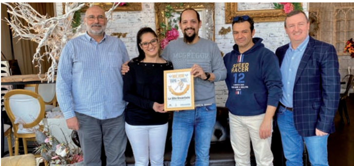
‘Pucherito a la miel de naranja’, propuesta de ‘La silla encantada’, fue reconocida por los clientes como la Mejor Tapa de la Ruta de la Tapa con Miel organizada por ACEPA y el Ayuntamiento. El jurado profesional votó por la croqueta de El Segoviano.