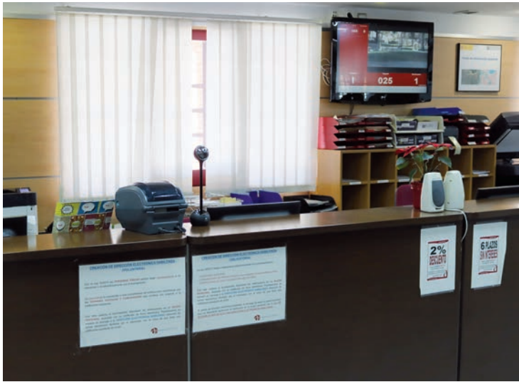
La tramitación de las solicitudes debe reallizarse en el Servicio de Atención a la Ciudadanía (SAC) del Ayuntamiento

Se ofrece un contrato de 6 meses de duración no prorrogables, con una jornada de 35 horas semanales. El Ayuntamiento suplementa el salario bruto mensual en aquellos puestos que requieren cualificación. En ese sentido, el salario oscila entre los 1.372,11 euros para