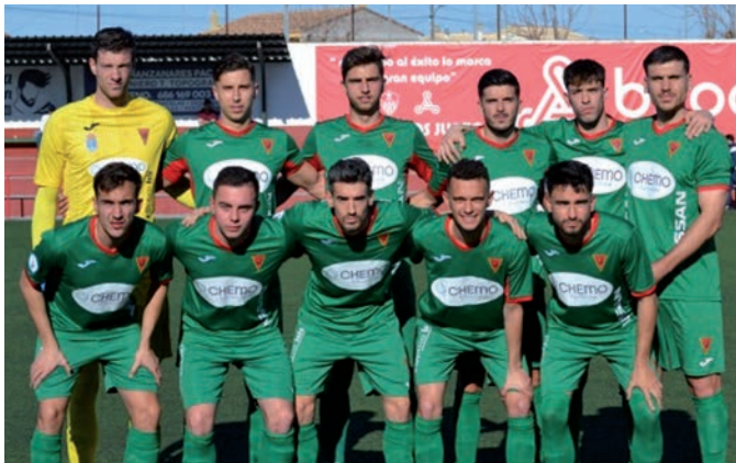
Equipo de Tercera División del CD Azuqueca.