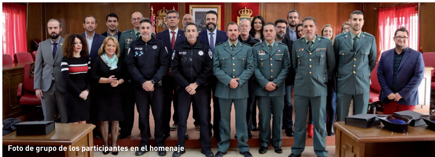
Foto de grupo de los participantes en el homenaje

➤ En el Salón de Plenos del Ayuntamiento, con presencia del subdelegado del Gobierno en Guadalajara y el teniente del Puesto Principal de Azuqueca