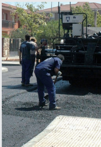
Imagen de archivo de trabajos de asfaltado en Azuqueca