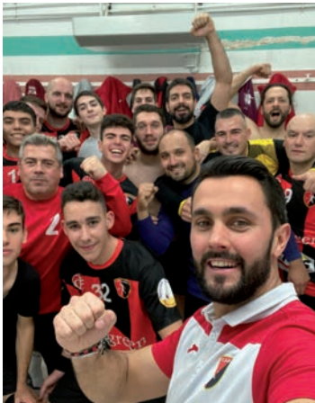
Los azudenses, celebrando en el vestuario la victoria ante el Cuenca.

En cuanto al conjunto Juvenil masculino de Segunda Territorial, también encabeza la tabla y, una vez jugada la jornada 14, acumulan 22 puntos. En los últimos partidos, se ha impuesto al Manzanares (14-24), al Cabanillas (37-11) y al Caserío Pío XII (26-28).