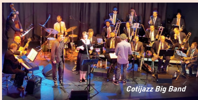
Cotijazz Big Band