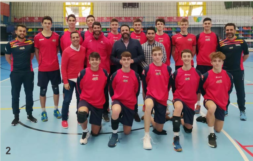
El alcalde de Azuqueca y el concejal de Retos Deportivos visitaron a las selecciones de Balonmano, junto con alumnado del CEIP Giovanni Antonio Farina (foto 1), y Voleibol (foto 2). El edil azudense, con los finalistas del Campeonato Infantil de Taekwondo de Castilla-La Mancha (foto 3).

Además, el 9 de febrero, se disputó en el polideportivo Ciudad de Azuqueca el Campeonato Infantil de Taekwondo de Castilla-La Mancha , que reunió a cerca de 120 niñas y niños en las categorías Benjamín, Alevín, Infantil y Cadete. Durante la jornada, se celebró una exhibición con un centenar de menores de Guadalajara y se presentó el proyecto ‘Sóller 2020’, una iniciativa de la Federación Castellano-Manchega de Taekwondo para la promoción deportiva que cuenta con el apoyo del Ayuntamiento de Azuqueca, entre otras instituciones.