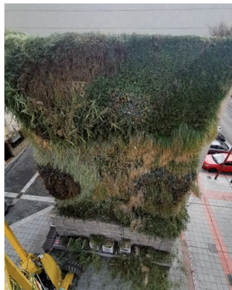
Vista del jardín vertical

En las instalaciones de riego del jardín, "la empresa revisó y ajustó el sistema de recirculación con el calibrado de las sondas de pH y conductividad y la limpieza de filtros y depósitos", detalla Antonio Expósito. "El jardín vertical utiliza un sistema eficiente que permite el aprovechamiento del agua sobrante del riego y, para ello, dispone de un sistema de control y gestión de la calidad del agua, monitorizado en tiempo real", destaca. •