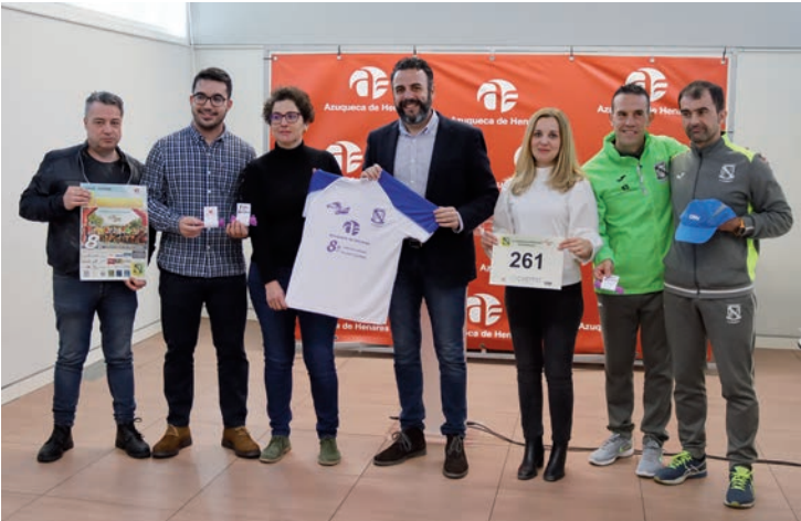
El alcalde, la concejala de Igualdad de Oportunidades y el edil de Retos Deportivos, con representantes del Club Navarrosa y la asociación Caminando, en la presentación de los actos del 8 de Marzo

> Para conmemorar el Día Internacional de las Mujeres en Azuqueca