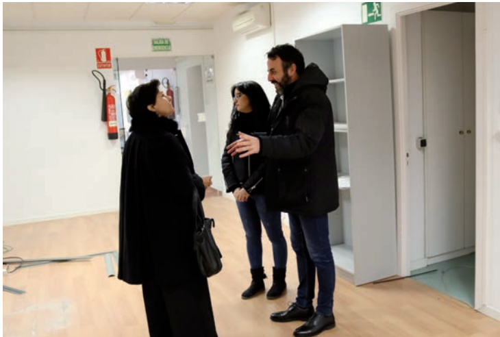
Un momento de la visita realizada al edificio municipal en el parque de La Constitución por la presidenta de la Audiencia Provincial de Guadalajara junto con el alcalde y la primera teniente de alcalde

Valoración positiva La presidenta de la Audiencia