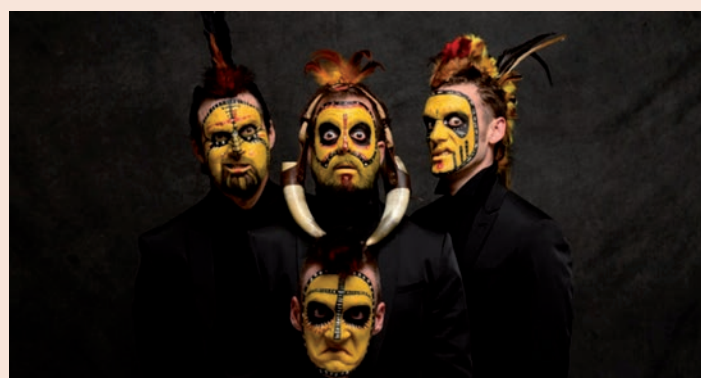
Imagen promocional del montaje 'The Primitives'

Sala infantil: de lunes a viernes, de 16 a 20 h.