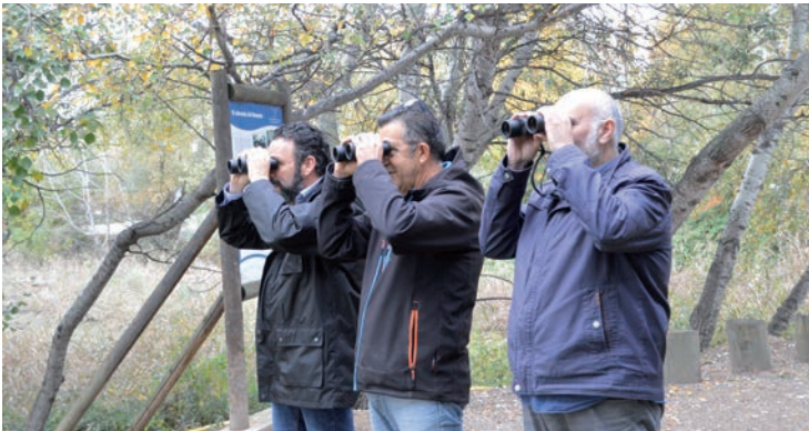
El alcalde, el concejal de Desarrollo Sostenible y el técnico de la ROM prueban los nuevos prismáticos

El Punto de Venta Integral 38130 de Azuqueca de Henares, en la avenida de Guadalajara, validó uno de los siete boletos acertantes de segunda categoría (5 números más complementario) en el sorteo de la Lotería Primitiva celebrado el sábado 24 de noviembre. El premio de cada boleto asciende a 34.632 euros.