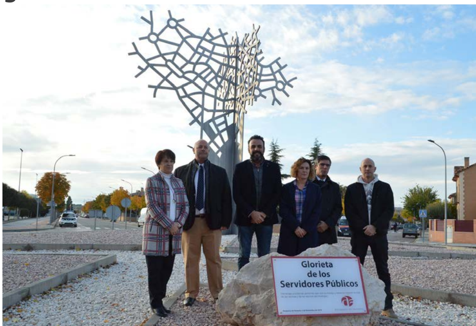
► Un momento del acto de nombramiento de la Glorieta de los Servidores Públicos ► Asistentes al acto escuchan a los intervinientes

Tras descubrir la placa, el alcalde aseguraba que se hacía un "merecido homenaje a quienes trabajan cada día para prestar servicios a la ciudadanía", al tiempo que reivindicaba los servicios públicos "como eje transversal" de las políticas del gobierno municipal, que "apuesta por garantizar la igualdad de oportunidades a todos y a todas, al margen de sus posibilidades económicas". El alcalde agradeció a IU la iniciativa y destacó la "profesionalidad y humanidad" de los trabajadores públicos y su disposición a "estar al lado del que más lo necesita".