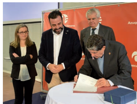
A la izquierda, el alcalde y la concalaja de Promoción de la Salud, con el grupo de la sede de la AECC en Azuqueca. Sobre estas líneas, firma del convenio de colaboración entre el Ayuntamiento y la asociación.

Después de un año en funcionamiento, ha sido elevada a Junta Local