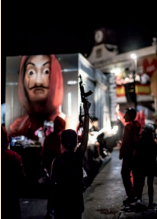
▲ 1º premio (500 euros): ‘Mujeres al poder’