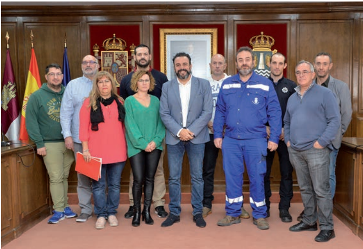
El alcalde, los concejales que han participado en la negociación y los representantes del Comité de Empresa, de la Junta de Personal y de los sindicatos, tras la firma