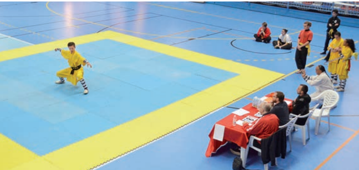
Artes Marciales Chinas. El polideportivo Ciudad de Azuqueca acogió el 24 de noviembre el IV Campeonato Internacional de Artes Marciales Chinas, organizado por la Federación Nacional. La competición englobó las disciplinas Taolu (formas y katas) y Combate.

El Club Triatlón Caracoles Azuqueca, en colaboración con el Ayuntamiento, organiza el sábado 5 de enero dos pruebas de relevos en la piscina climatizada municipal. En la competición 100x100, van a participar 12 equipos compuestos por 10 personas que deberán completar 100 veces 100 metros a nado en el menor tiempo posible, mientras que el 50x50 habrá 12 equipos de 5 personas para hacer 2.500 metros.