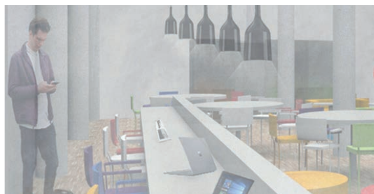
Recreación de la futura sala de estudio de la Biblioteca Municipal

Con la ampliación, la Casa de la Cultura dispondrá de 180,47 metros cuadrados más dedicados al estudio. "El proyecto contempla un mobiliario con distintos tipos