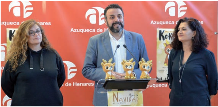
Desde la izquierda, la concejala de Fiestas, el alcalde y la vocal de ACEPA, durante la presentación de las actividades de Navidad

ne forma de reno [antes era un pingüino], escondido en los escaparates de los establecimientos participantes -la inscripción se mantiene abierta hasta el 10 de diciembre- para conseguir un sello, con un máximo de cuatro por día. Cuando completen la cartilla con sellos en las 20 casillas, recibirán de regalo un peluche de Keka. Además, entre las cartillas depositadas en los buzones disponibles en las tiendas, se sortearán 1.200 euros en tarjetas de 100 euros para gastar en los comercios participantes. •