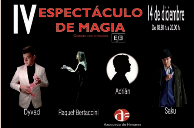
Carteles de las actividades programadas en diciembre en el EJE

Viaje al Pirineo aragonés Por otra parte, se mantiene abierta la inscripción en el