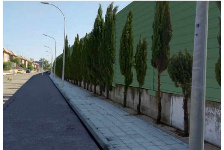
Recreación virtual de las pantallas previstas junto a la vía del tren

El alcalde ha recordado que hace ya meses desde el Ayuntamiento se encargó un informe acústico de la zona -elaborado por la empresa PyG-, atendiendo las continuas quejas de las vecinas y vecinos que residen en la zona