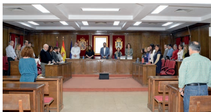
Al inicio de la sesión de noviembre, se guardó un minuto de silencio en recuerdo de las dos mujeres asesinadas por la violencia machista desde el Pleno de octubre

El Pleno apoyó de manera unánime la modificación puntual número 8 del Plan de Ordenación Municipal (POM) y las actas adicionales de la línea de límite ju-