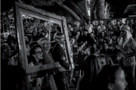
▲ 2º premio (300 euros): ‘TV plana’ ▼ 3º premio (150 euros): ‘Entre tinieblas’