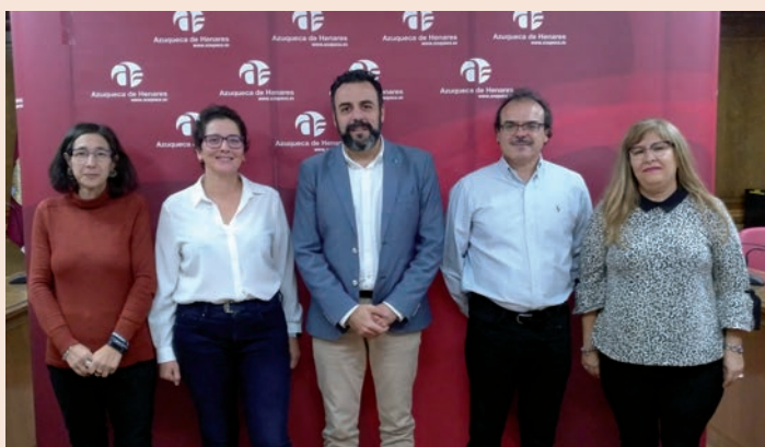
El alcalde y la concejala de Cohesión Social, con representantes de las asociaciones Caminando y Omega

➤ Con las asociaciones Caminando y ASL Omega Global Socio/Sanitaria