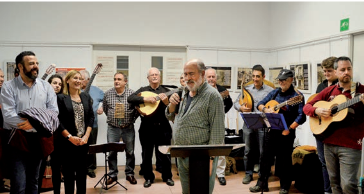
El acto de inauguración de la exposición contó con la participación de la Ronda de Azuqueca