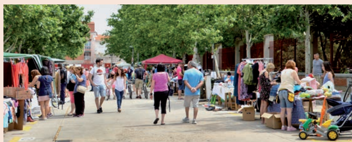
Imagen de archivo del mercadillo de segunda mano celebrado en junio

“Es una propuesta dirigida a particulares mayores de edad empadronados en Azuqueca y a asociaciones sin ánimo de lucro, que quieran vender todo tipo de productos y objetos usados, siempre en buen estado”, recuerda la edil, quien destaca que se han agotado las plazas disponibles (30 puestos).