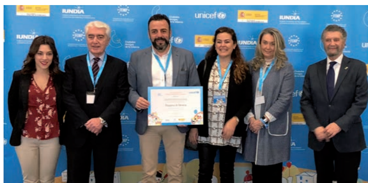
El alcalde y la concejala de Juventud, en la entrega del sello de CAI

“Con la renovación del sello CAI, UNICEF pone en valor las políticas que desarrollamos desde el Ayuntamiento para atender y dar respuesta a las necesidades