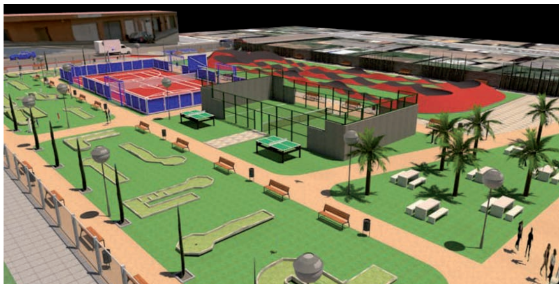
Imagen diseñada por ordenador del parque lúdico que el Ayuntamiento ha proyectado en la avenida Senda de Enmedio

➤ Concebido como un espacio de ocio intergeneracional