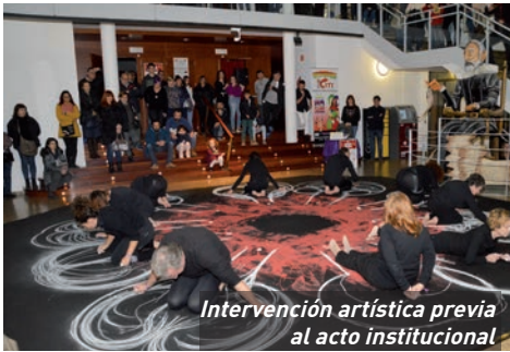
Intervención artística previa al acto institucional