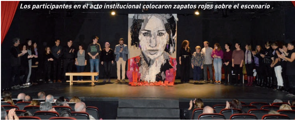
Los participantes en el acto institucional colocaron zapatos rojos sobre el escenario

Concentración Además, el sábado 24, se convocó una concentración en la plaza de La Constitución, con la participación del Colectivo de Mujeres Artistas de Guadalajara. Se leyó un manifiesto y se presentó una acción artísti-