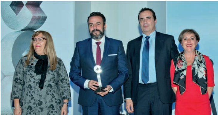
El alcalde, la concejala de Educación y de Cohesión Social y la edil de Igualdad, posan con el premio.

nas que cada día ayudan al Ayuntamiento a avanzar hacia una Azuqueca inclusiva y adaptada". Este programa, dotado con 80.000 euros, "persigue adaptar los recursos y las actividades municipales a las necesidades específicas de este colectivo", recordó Blanco, en referencia a los campamentos urbanos, que disponen de personal técnico de apoyo; las escuelas infantiles municipales, los juegos y parques infantiles o las actividades deportivas municipales.