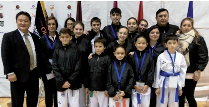
Taekwondo. Deportistas de Azuqueca de Henares participaron en el II Open Internacional Don Quijote de Taekwondo que se celebró el 24 y 25 de noviembre en Ciudad Real.