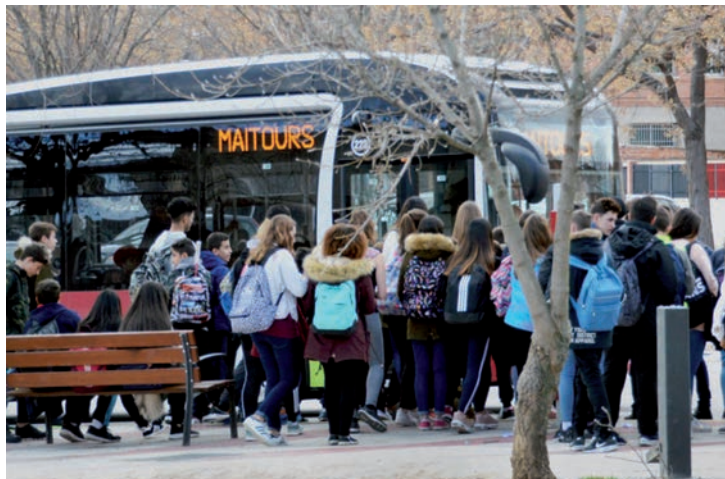
Imagen de archivo de usuarios a punto de subir a uno de los autobuses urbanos

Blanco se ha mostrado “muy satisfecho” con las cifras de utilización de este servicio. “Un autobús urbano gratuito no solo beneficia a la economía doméstica de las familias, que se ahorran este gasto, sino que también facilita la movilidad por la ciudad a todos los colectivos, en especial a jóvenes y mayores, y tiene ventajas medioambientales porque ayuda