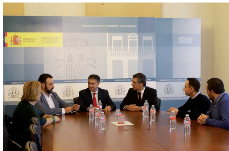
De izquierda a derecha, la alcaldesa de Alovera, el primer edil de Azuqueca de Henares, el delegado y el subdelegado del Gobierno y los regidores de Cabanillas del Campo y Chiloeches, durante la reunión celebrada el 6 de noviembre en la Subdelegación del Gobierno en Guadalajara

En septiembre, la Demarcación de Carreteras del Ministerio de Fomento anunció que iba a recalcular el número de vehículos,