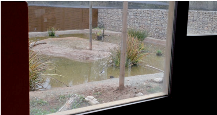
El diorama en vivo puede observarse a través de los cristales espía del Centro de Interpretación

En cuanto a los prismáticos, el alcalde agradeció la donación de este material, "muy útil porque la observación de aves no siempre es fácil porque son pequeñas o se encuentran alejadas o escondidas", señaló. •