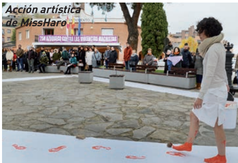
Acción artística de MissHaro