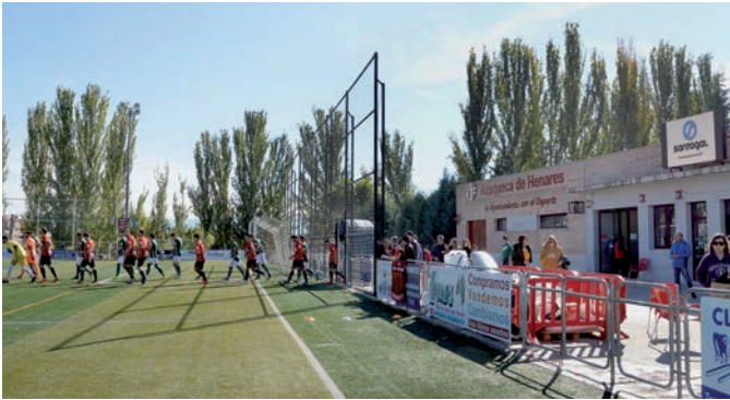
Momento de la salida al campo de los equipos del CD Azuqueca y el Marchamalo, partido en el que se estrenó el videomarcador