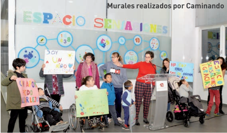
Murales realizados por Caminando

con un partido de baloncesto inclusivo entre el CD ADA y el equipo femenino del Club Basket Azuqueca. Además, del 2 al 9 de diciembre, se puede visitar en la Casa de la Cultura la exposición