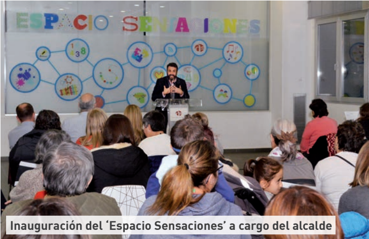
Inauguración del 'Espacio Sensaciones' a cargo del alcalde