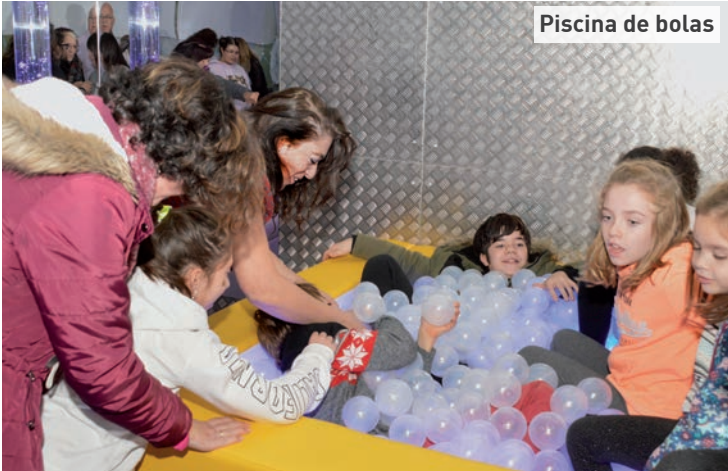
Piscina de bolas

La conmemoración de esta fecha comenzó el 1 de diciembre