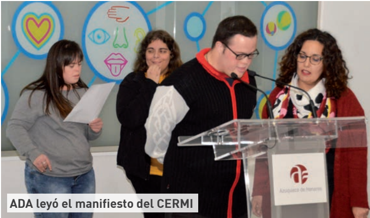
ADA leyó el manifiesto del CERMI