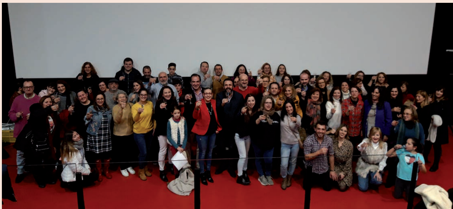
Asistentes a la presentación del vídeo hacen un brindis simbólico por el comercio local, tras la proyección en la sala de cine del EJE, el pasado 14 de diciembre

➤ Presentado por el Ayuntamiento de Azuqueca de Henares y ACEPA, la Asociación de Comerciantes, Empresarios y Profesionales