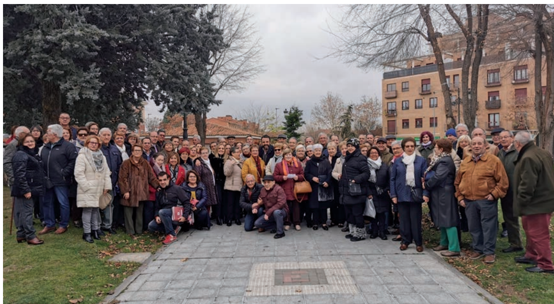
Participantes en la salida cultural navideña a Madrid organizada por el Ayuntamiento, junto al alcalde y la concejala de Igualdad de Oportunidades

El primer edil comunicó este reconocimiento de la OMS el mismo día que llegó al Ayuntamiento, el 18 de diciembre, al grupo de mayores que participaron en la tradicional salida navideña a Madrid que organiza el Ayuntamiento para este colectivo. Un total de 113 personas se sumaron a esta propuesta, que incluía la visita al mercadillo navideño de la plaza Mayor de la capital, un chocolate con churros y la entrada al espectáculo de teatro 'Invencible', en el Teatro Alcázar.