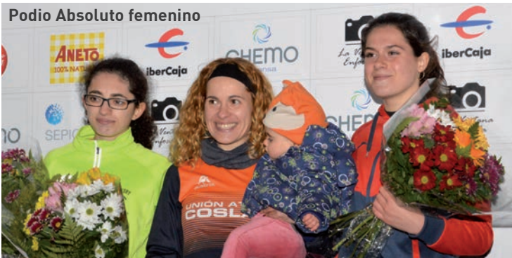
Podio Absoluto femenino