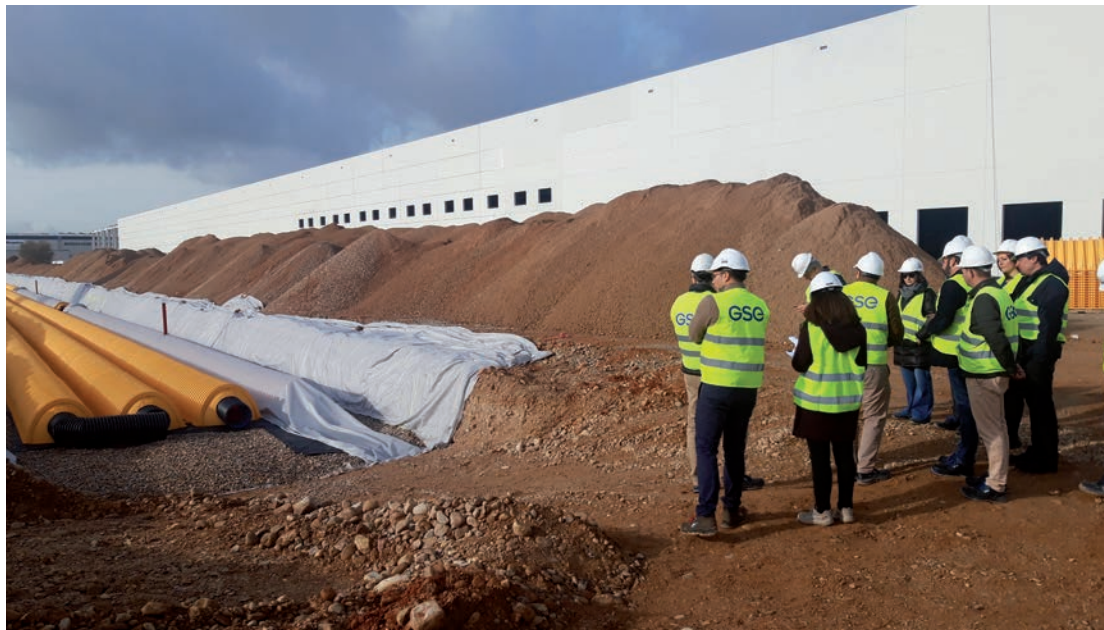
Técnicos y responsables municipales, durante la visita de seguimiento de las obras de los drenajes

➤ En la nave que está construyendo Merlin en Miralcampo para Carrefour