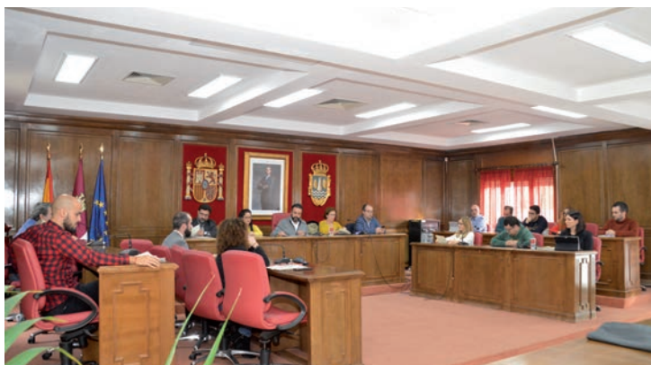
Imagen tomada al inicio de la sesión plenaria celebrada el pasado 20 de diciembre

Los portavoces de los grupos de la oposición cuestionaron la urgencia de la sesión y aseguraron que respondía a la falta de diligencia por parte del gobierno municipal, al tiempo que pusieron en duda la validez del acuerdo y aseguraron que el modo de convocar el