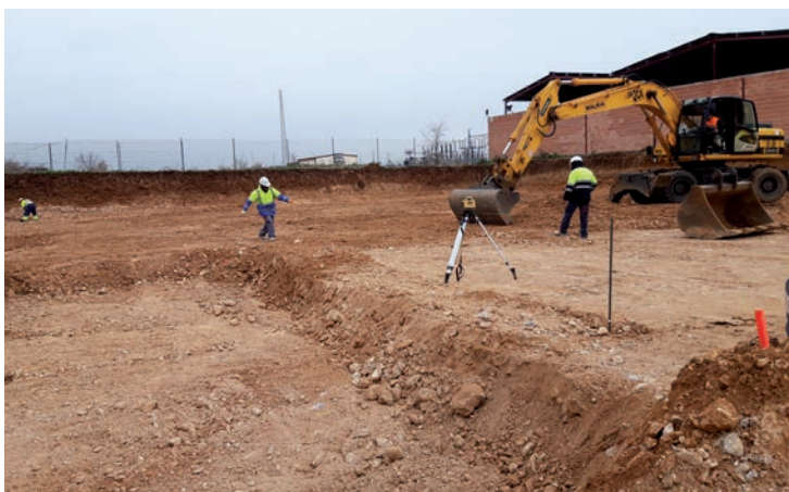
Las obras se están desarrollando en el sector SUR R6, en la carretera de Villanueva