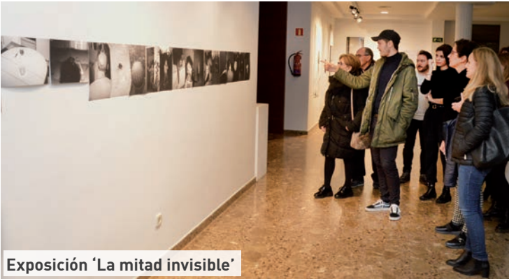
Exposición 'La mitad invisible'

fotográfica 'La mitad invisible', de Marius Ionut Scarlat y las proyecciones en versión original con subtítulos de los 'Miércoles de cine' del mes diciembre se centraron en la discapacidad. •