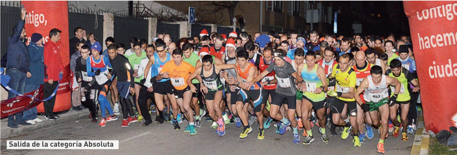
Salida de la categoría Absoluta

> En su edición número 33, la prueba reunió a cerca de 900 dorsales