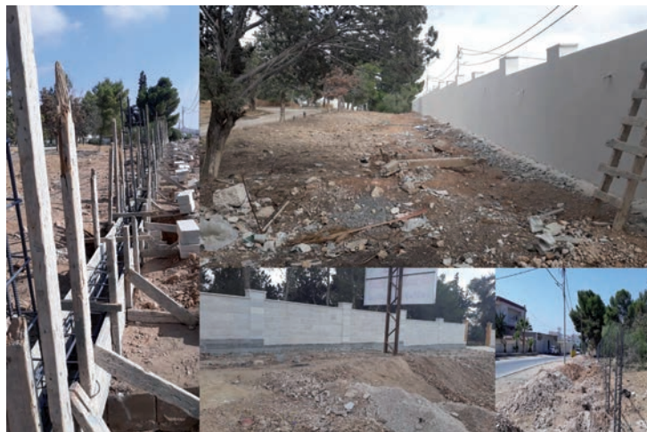
Imágenes de varias de las actuaciones en Al-Ramtha ejecutadas con ayuda del Ayuntamiento de Azuqueca de Henares

"Además de todo el conocimiento en la gestión que les estamos aportando, nos parecía importante ayudarles a financiar algunos trabajos de obra pública en servicios básicos, como las redes de saneamiento o el asfaltado de caminos", ha explicado