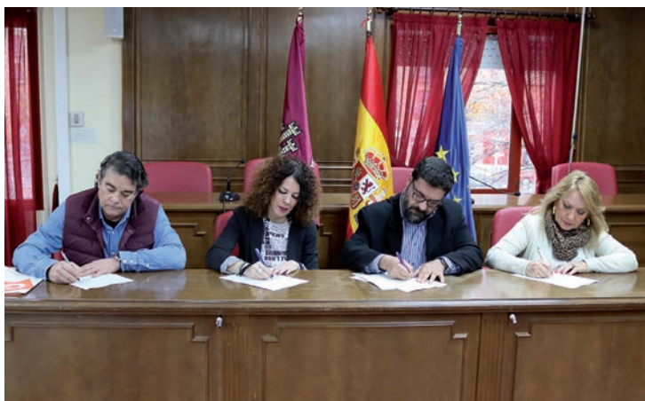
De izquierda a derecha, los portavoces de Ciudadanos; IU, PSOE y PP firman el texto conjunto de la moción