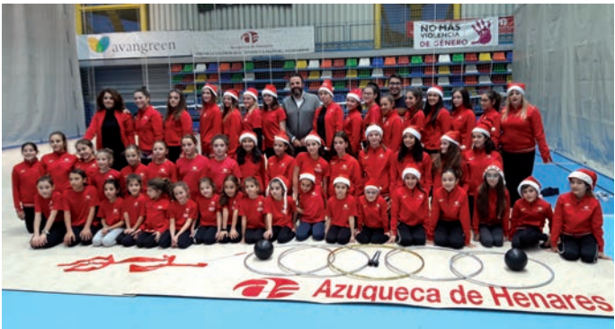
El alcalde y el concejal de Retos Deportivos, junto al alumnado de la Escuela Municipal de Gimnasia Rítmica, en el nuevo tapiz

Después de siete jornadas de victorias consecutivas en la Liga Sénior de Segunda Territorial, el Avangreen Balonmano Azuqueca perdió su imbatibilidad en su visita al Villarrobledo, que se impuso por 29 a 25. A pesar de la derrota, los locales siguen liderando la clasificación con 14 puntos, cuatro más que el segundo, precisamente, el Villarrobledo.