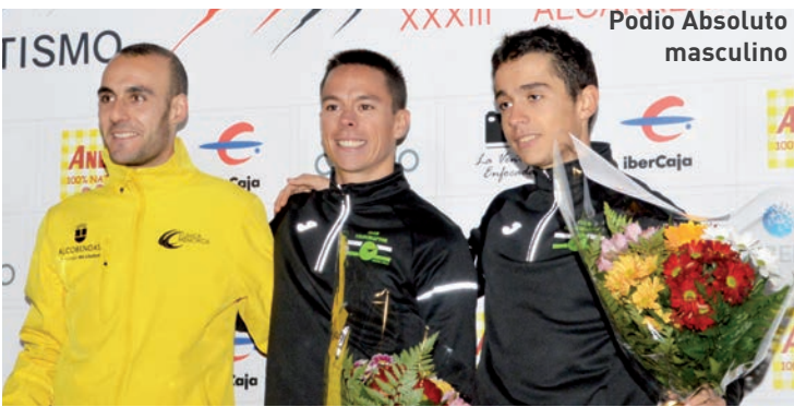
Podio Absoluto masculino

Solidaria con ADA y Cruz Roja Un año más, la prueba tuvo carácter solidario y una parte de la cuota de inscripción -5 euros para mayores de 15 años y 1 euro para menores de 14 años- se destina a ADA (Asociación de Padres, Familiares y Amigos de Personas con Discapacidad Intelectual y/o del Desarrollo de Azuqueca), que también va a recibir un donación de Ibercaja. Asimismo, se recogieron en la carpa de la zona de meta productos de higiene personal para adultos y bebés, así como productos de limpieza que se van a entregar a la Asamblea Local de Cruz Roja. •