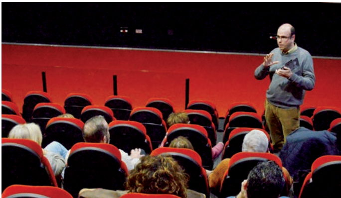
Algunas sesiones se imparten de los cursos de UNED Senior se imparten en la sala de cine del Espacio Joven Europeo

D e cara al segundo cuatrimestre del curso académico 2019/2020, el Aula de la UNED (Universidad Nacional de Educación a Distancia) en Azuqueca de Henares acoge dos nuevas propuestas de UNED Senior sobre ‘Mindfulness’ y ‘Oriente en la mirada: películas del Far East II’.