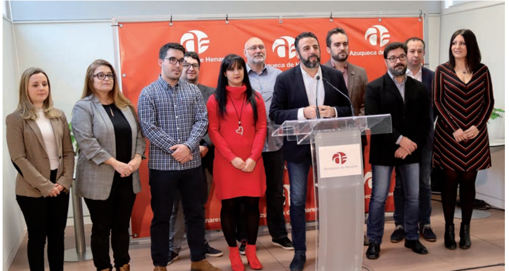
El alcalde y los concejales del equipo de gobierno, durante la presentación del presupuesto municipal para 2020

El alcalde de Azuqueca de Henares, José Luis Blanco, acompañado por los diez concejales del equipo de Gobierno (PSOE), presentó el 3 de enero el proyecto de presupuestos municipales para el año 2020, cuyo debate en Pleno está previsto para el martes 7 de enero. Blanco definió el documento como “realista y transformador” y aseguró que se busca un triple objetivo: “mejorar la calidad de los servicios públicos que se prestan a la ciudadanía; destinar recursos suficientes para que Azuqueca sea una ciudad más cohesionada, más igual y con más oportunidades; e invertir en innovación urbana para impulsar una ciudad más sostenible”. “Con este presupuesto, Azuqueca seguirá avanzando con seguridad hacia el futuro y las personas que viven en Azuqueca dispondrán de una ciudad más sostenible, más habitable y más amable”, señaló.