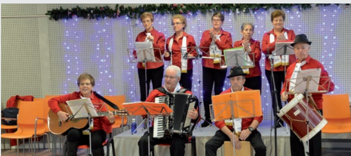
El Centro de Ocio Río Henares albergó un baile de Reyes (foto de la izquierda) y una fiesta navideña con villancicos de la Ronda de Las Acacias (foto superior).