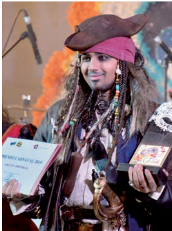
Disfraz ganador en la categoría Adulto individual del año pasado

cesidades de las personas con diversidad funcional”. Como es habitual, el Jueves Lardero, que se celebra el 20 de febrero, marca el inicio del Carnaval y viene acompañado del Concurso de Tortillas en el Centro de Ocio. El programa se completa con el desfile y concurso de disfraces del sábado 22, el baile para mayores del domingo 23 y el entierro de la sardina del 26. •