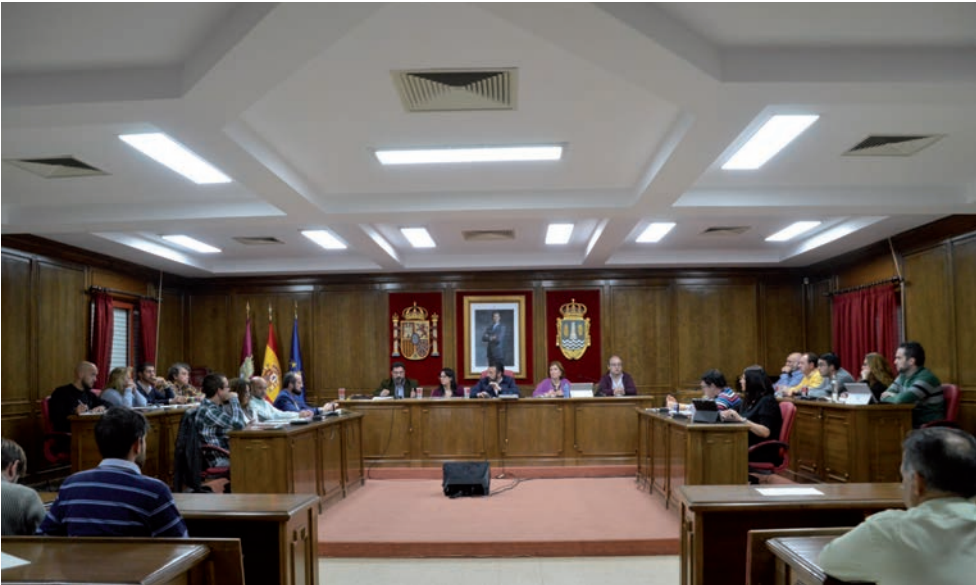
Un momento del Pleno celebrado el 7 de enero, en el que se aprobaron los presupuestos municipales para 2020

El alcalde destacó también los proyectos de Innovación Urbana que se van a desarrollar con el apoyo de Fondos Europeos a través de la EDUSI, como el Learning Center en El