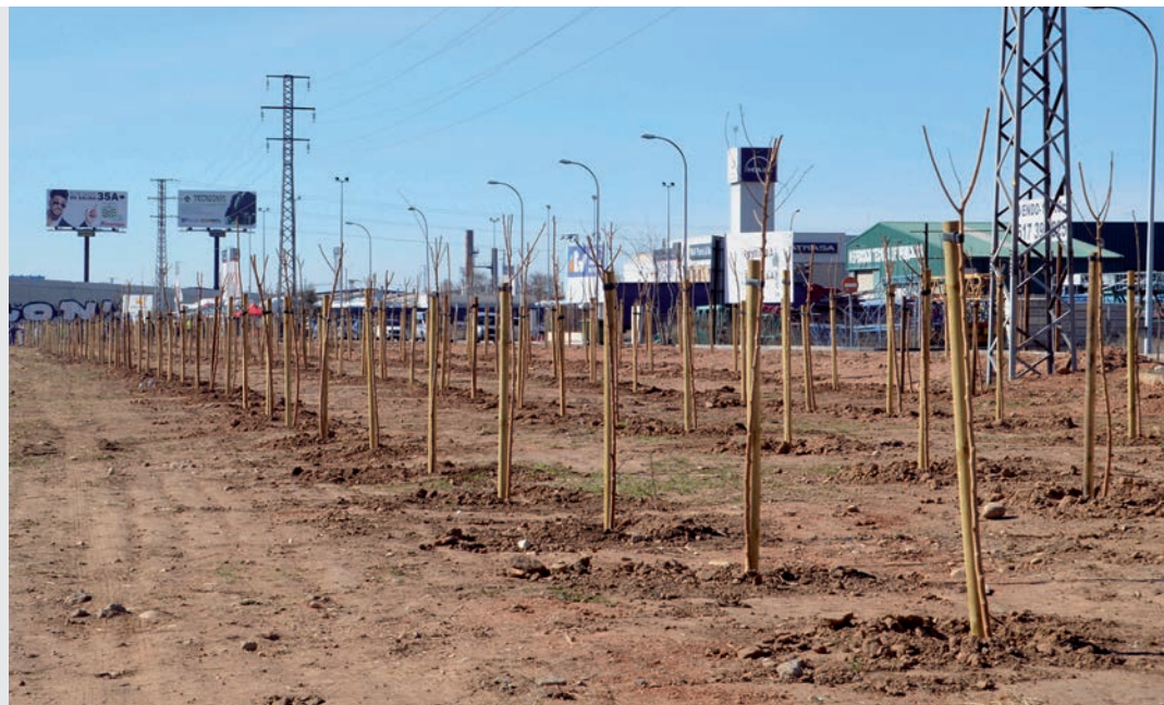
Imagen de archivo, tras la plantación en el polígono Comendador en 2019

"A nivel local, los ecosistemas terrestres, tanto los naturales como los creados por el hombre, como es el caso de las plantaciones, son los mayores contribuidores a la reducción del CO2 en la atmósfera y por