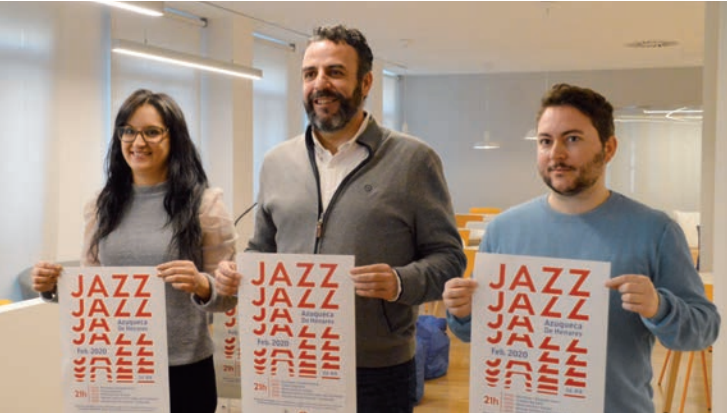
La concejala de Educación Global, el alcalde y el técnico de Cultura, en la presentación del XIX Mes del Jazz