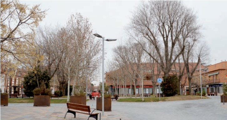
Imagen actual de la plaza General Vives

que el Ayuntamiento ha impulsado en los últimos años, destaca la creación de sumideros de carbono en polígonos industriales con el programa ‘En Azuqueca nace un bebé, nace un árbol’, la gratuidad del transporte público para personas empadronadas, la incorporación de vehículos eléctricos e híbridos y la puesta en marcha del primer edificio municipal de consumo energético casi nulo, el EJE, con climatización por geotermia.