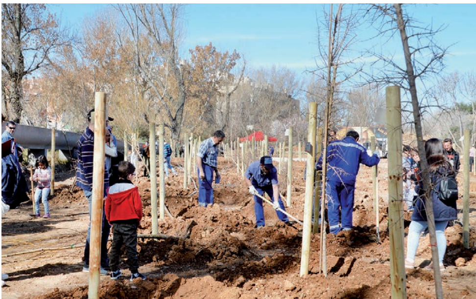
Participantes en una de las plantaciones de la temporada pasada, junto al Arroyo del Vallejo

Esta temporada, el Ayuntamiento va a plantar otros 700 árboles de especies elegidas, como hasta ahora, por los técnicos municipales, en función de la zona de plantación y