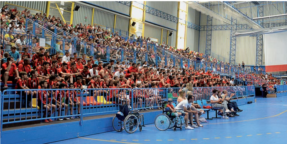
Fiesta de clausura de la temporada deportiva 2018/2019 de las Escuelas Municipales

Fútbol concentra 1 de cada 3 inscripciones En cuanto a la demanda, Fútbol es la disciplina con mayor número de inscripciones: “suponen cerca del 34 por ciento del total, es decir, que 1 de cada 3 alumnos se decanta por este deporte”, detalla. A continuación, se sitúan Tenis (13 por ciento del total), Baloncesto (11 por ciento), Gimnasia Rítmica (8