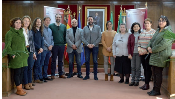
Sobre estas líneas, recepción en el Ayuntamiento de Azuqueca de Henares y debajo, sesión de trabajo en la biblioteca del antiguo convento de San Gil en Toledo, sede de las Cortes de Castilla-La Mancha

El proyecto, que comenzó el año pasado y se prolonga hasta 2021, persigue la creación de un museo digital de institutos históricos de Europa y cuenta también con la participación de 'Agrupamento de Escolas nº 2', de Beja (Portugal), y 'Liceo Science Umane A. Sanvitale', de