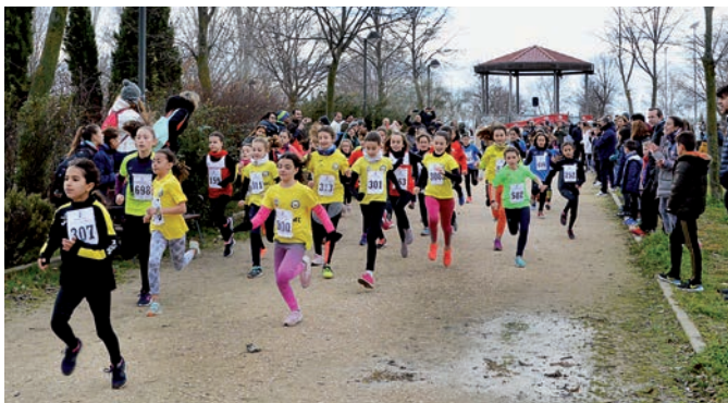
Salida de una de las carreras de la prueba de Campo a Través

> En el marco del programa regional Somos Deporte 3-18