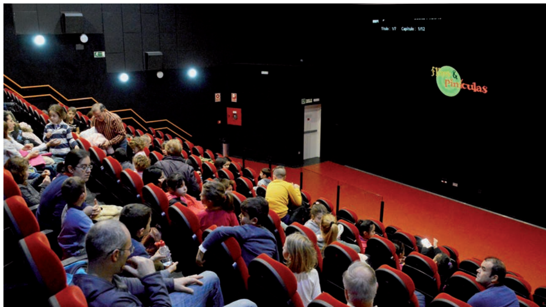
Vista de la sala de cine del Espacio Joven Europeo, durante una proyección en Navidad

➤ En la sala de proyecciones del Espacio Joven Europeo (EJE), a través de la programación municipal, por tres euros