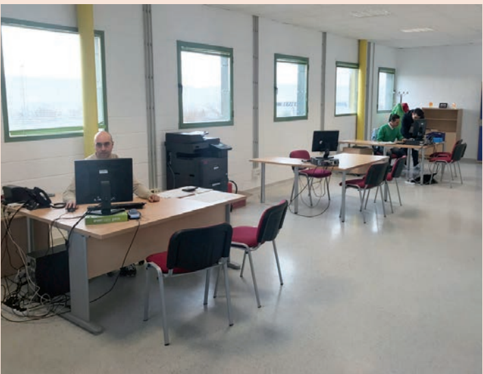
Oficina del Servicio Municipal de Deportes, en la primera planta del polideportivo Ciudad de Azuqueca

primera planta del polideportivo Ciudad de Azuqueca (c/ Ana María Matute, s/n). El horario de atención es de lunes a viernes, de 10 a 13:30 horas y los lunes