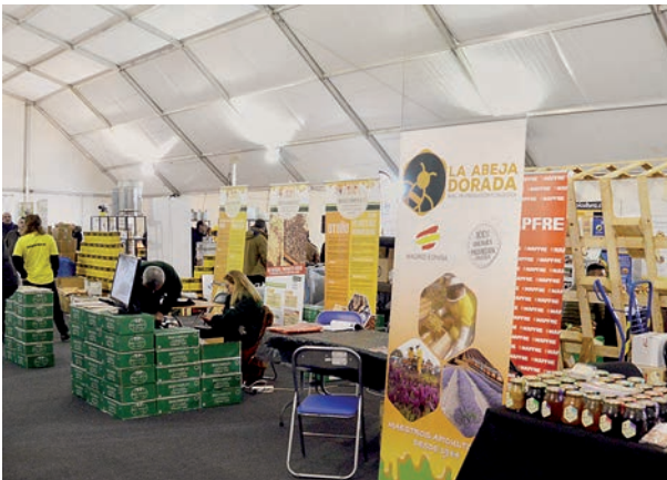
Vista de la Feria Apícola celebrada el año pasado