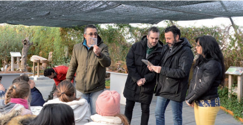
El alcalde, junto con la concejala de Educación Global, el edil de Buen Gobierno y el responsable del Aula de la Naturaleza, durante una visita escolar a este equipamiento

➤ El Ayuntamiento de Azuqueca impulsa un programa de Educación Ambiental en estos tres equipamientos municipales