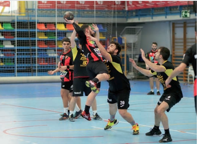
Un momento del partido entre el Avangreen BM Azuqueca y el BM Ciudad de Puertollano.

Dentro de las competiciones del programa regional de Deporte en Edad Escolar, el BM Azuqueca es octavo en la competición de Cadete masculino (3 victorias, 1 empate y 6 derrotas) y sexto en Infantil masculino (4 victorias, 1 empate y 4 derrotas). •