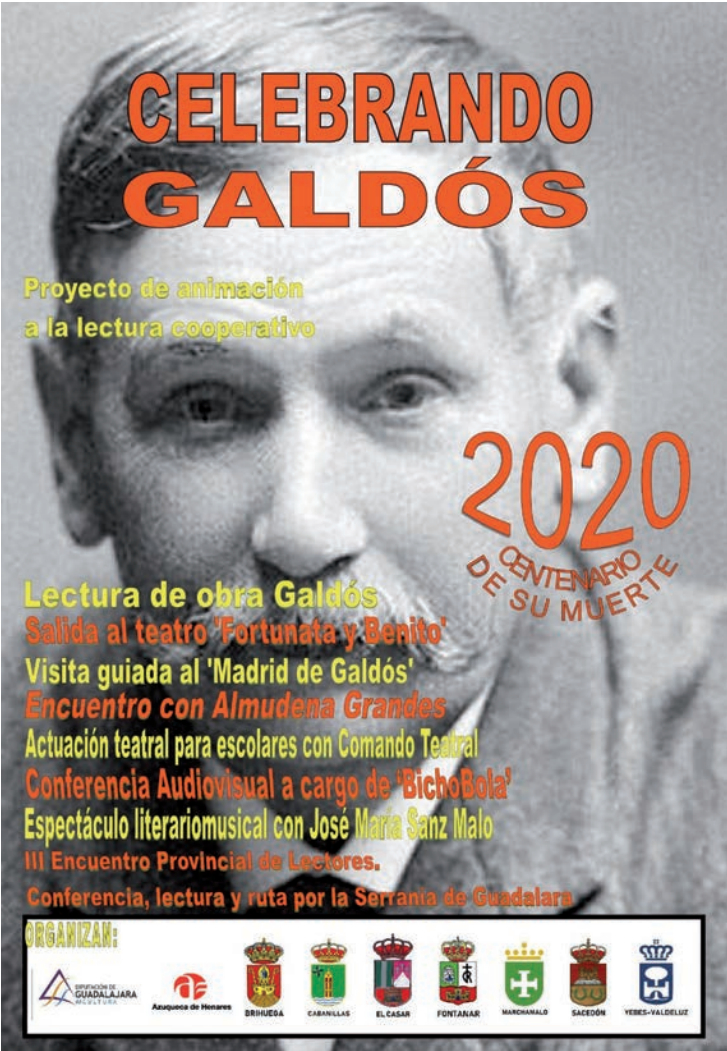
Cartel del programa de animación a la lectura

La edil destaca que Azuqueca será, el día 22 de mayo, la sede del encuentro de Almudena Grandes con todos los clubes de lectura de las bibliotecas participantes. “La escritora que da nombre a nuestra Biblioteca municipal siempre ha reivindicado a Pérez Galdós como uno de sus autores de cabecera”, recuerda Susana Santiago. ‘Celebrando Galdós’ también ofrecerá desde marzo un espectáculo de Comando Teatral en torno a Galdós.