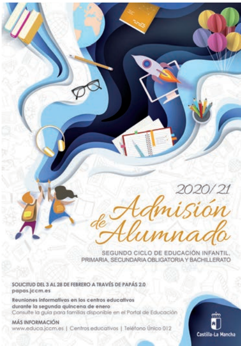
Cartel informativo del proceso de admisión de alumnado para el curso 2020/2021

Más información, en la web www.educa.jccm.es , en las secretarías de los centros educativos o en los teléfonos 012 (Castilla-La Mancha) o 925 274 552 (fuera de la región).