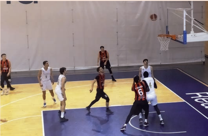
Un momento del partido que enfrentó al Isover Basket Azuqueca y al Real Madrid.