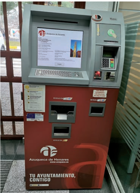
Cajero ciudadano situado en el Ayuntamiento

Cuevas avanza que “en las próximas semanas, se licitará la contratación de una nueva página web, incluyendo un gestor de contenidos, su implantación, formación, diseño, migración de los contenidos del actual portal municipal y la creación de una APP”. Con este nuevo planteamiento, el Ayuntamiento quiere ofrecer una web municipal más accesible, con un diseño y funcionalidades modernas, adaptada a personas con distintas capacidades y en varios idiomas. “Vamos a poner