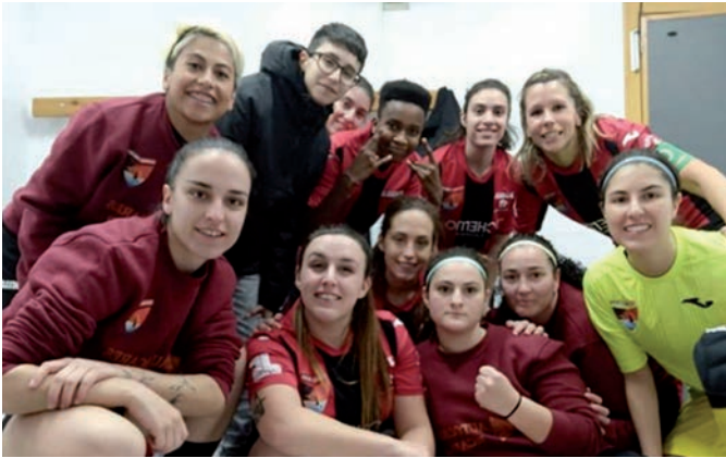
Equipo de la UD Azuqueca FS que milita en la liga de aficionados de Guadalajara.

> El equipo local acumula 22 puntos, con un balance de 6 victorias, 4 empates y 6 derrotas