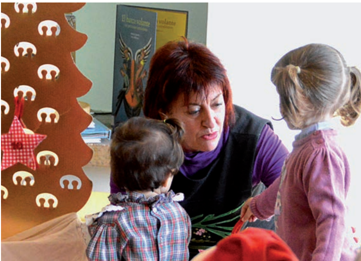
Imagen de archivo de una de las sesiones del programa

El precio por participante es de 30 euros para las personas titulares de la Tarjeta Ciudadana