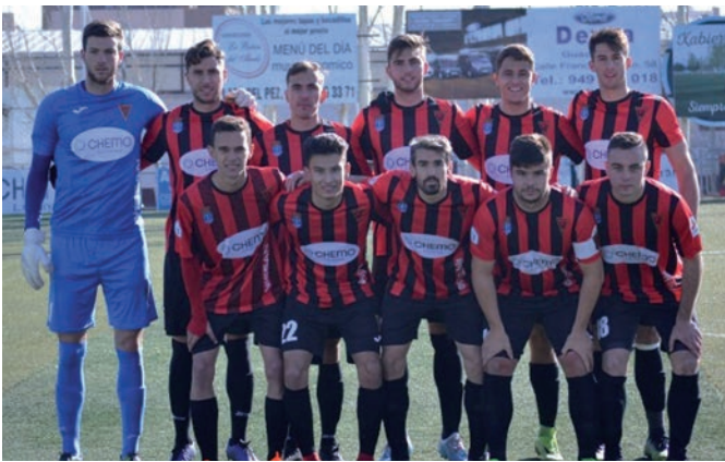
Jugadores del CD Azuqueca.

> En las citas más recientes, se ha impuesto al Atlético Ibañés y al Almagro