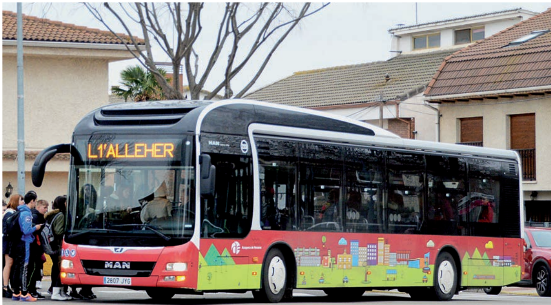
Uno de los autobuses que presta el servicio urbano en Azuqueca de Henares

➤ El Ayuntamiento de Azuqueca de Henares mantiene desde 2017 la gratuidad para los titulares de la Tarjeta Ciudadana