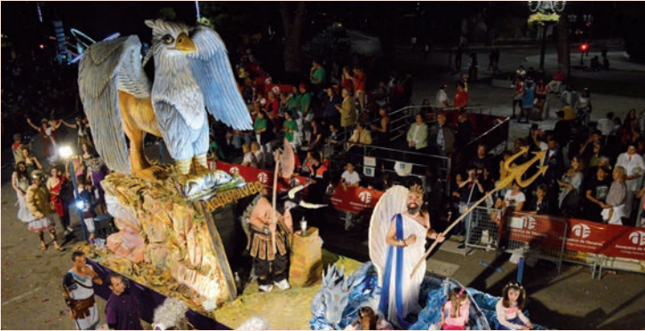
'Mitología griega' (El Pendón)