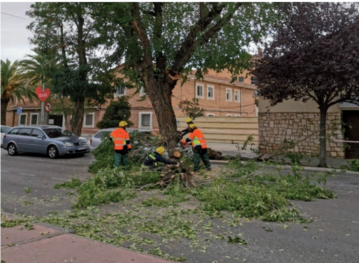
En la avenida de Francisco Vives, la rama de un árbol se desprendió por el viento y causó daños en un vehículo.