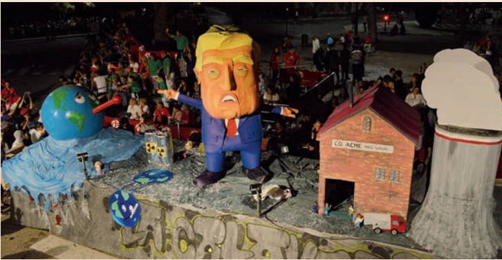
'Trump y su indiferencia con el cambio climático' (La Calavera)