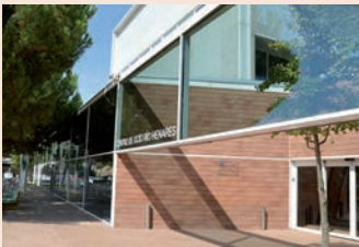
Fachada del Centro de Ocio

CapacitaTIC +55 es un programa de capacitación digital dirigido a las personas mayores de 55 años de Castilla-La Mancha, tanto desempleadas como trabajadoras o autónomas. Es una iniciativa del