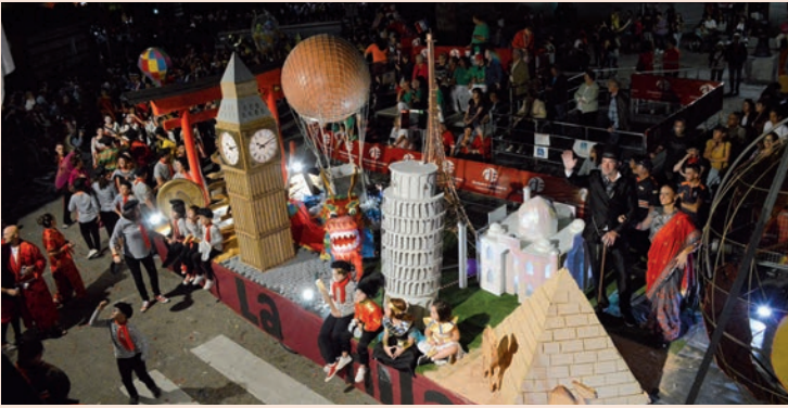
'V centenario de la vuelta al mundo' (La Chilaba)