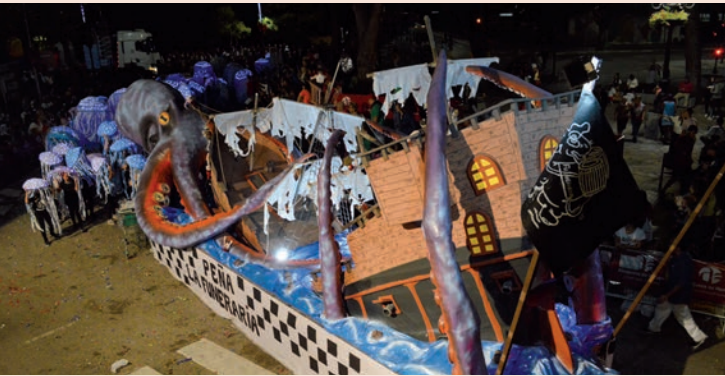
'Kraken' (La Funeraria)