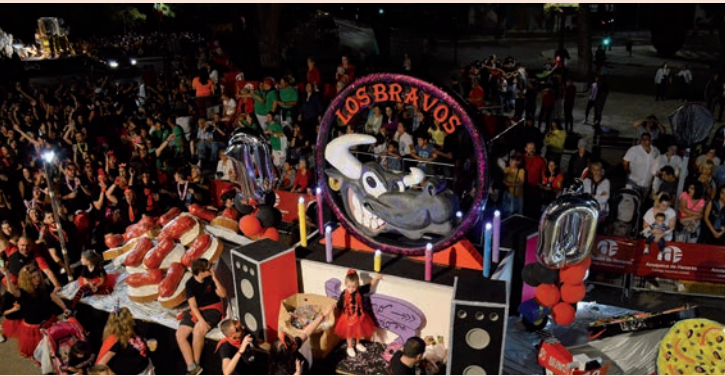
'10º aniversario' (Los Bravos)