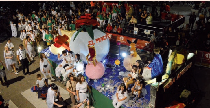
'El Principito' (La Amistad)