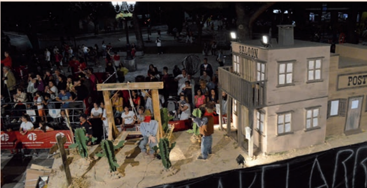
'El Oeste' (El Akellarre)