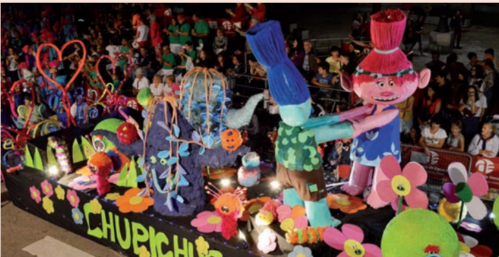
'Trolls' (Los Chupichusky's)

Programas de televisión, aniversarios, la literatura, tradiciones, la música o el cine volvieron a servir de inspiración a los peñistas, que acompañaron sus carrozas con disfraces, caracterizaciones y coreografías relacionadas con el tema escogido.