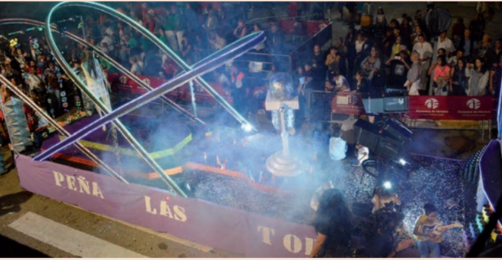
'Eurovisión' (Las Torres)