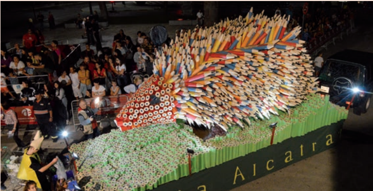
'Puercoespín de lapiceros' (Alcatraz)