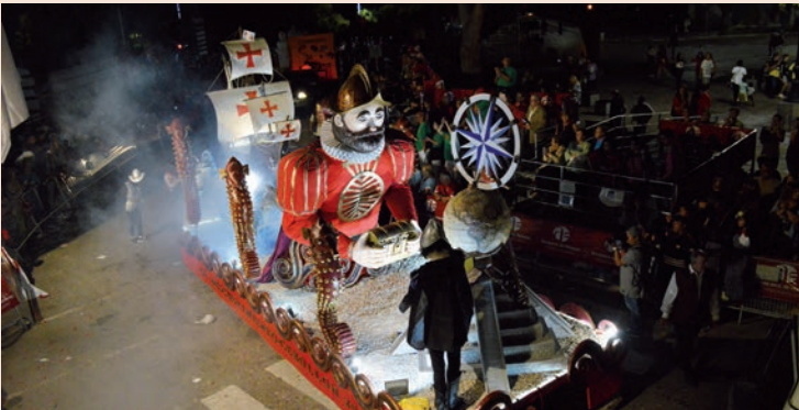
'El descubrimiento' (El Cebollón)