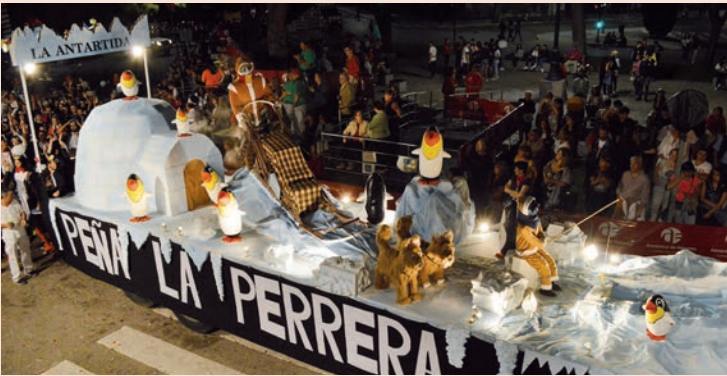
'La Antártida' (La Perrera)