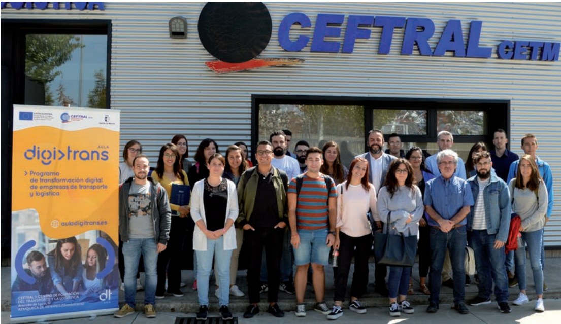
Foto de familia tomada en las instalaciones de CEFRAL el día que empezó la formación

> Se trata de un máster sobre la transformación digital de las empresas de transporte y logística