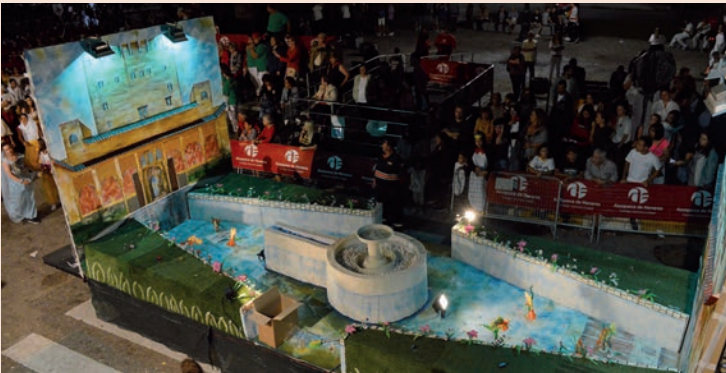
'Moros y cristianos' (Azikuékanos)