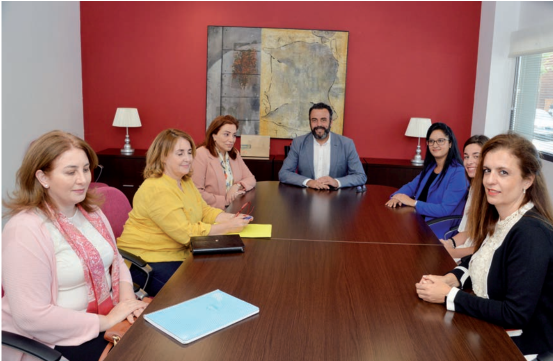
Un momento de la reunión entre la delegación jordana y los responsables del Ayuntamiento de Azuqueca de Henares

El regidor azudense señaló que el encuentro permitió “conocer el desarrollo práctico de este memorándum, al tiempo que se