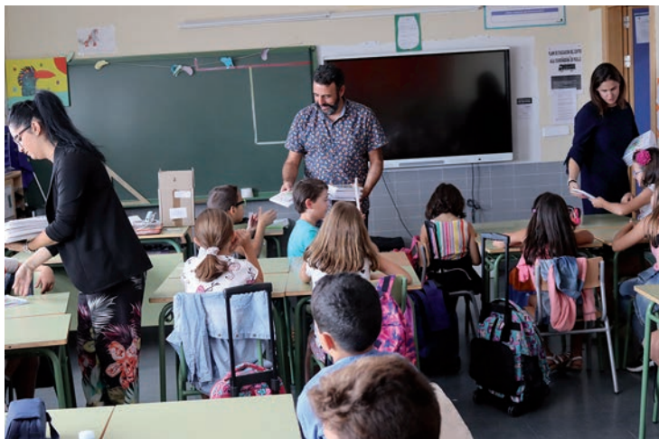
La concejala de Educación Global, el alcalde y la directora de La Paloma reparten el material en un aula de 4º de Primaria