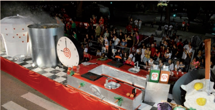
'Master Chef' (El Palike)