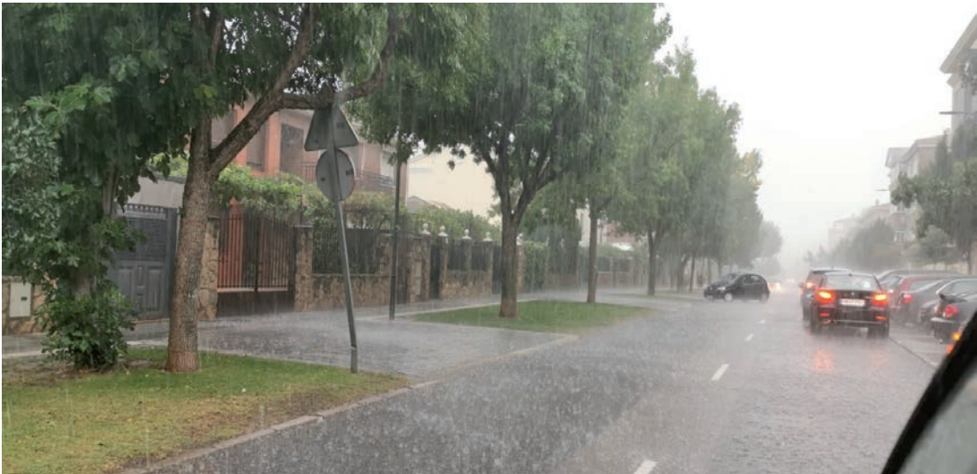
Las tormentas han descargado agua con intensidad en varias jornadas. En la imagen, la carretera de Alovera el día 14

Los días 10 y 14 de septiembre, el viento y la lluvia intensa provocaron daños y causaron problemas en varias calles y viviendas de la ciudad. El viento hizo caer ramas de dos árboles en el bulevar de Las Acacias y en la avenida de Francisco Vives (sobre un vehículo estacionado) y la tormenta registrada en la tarde del sábado 14 provocó algunas inundaciones. •