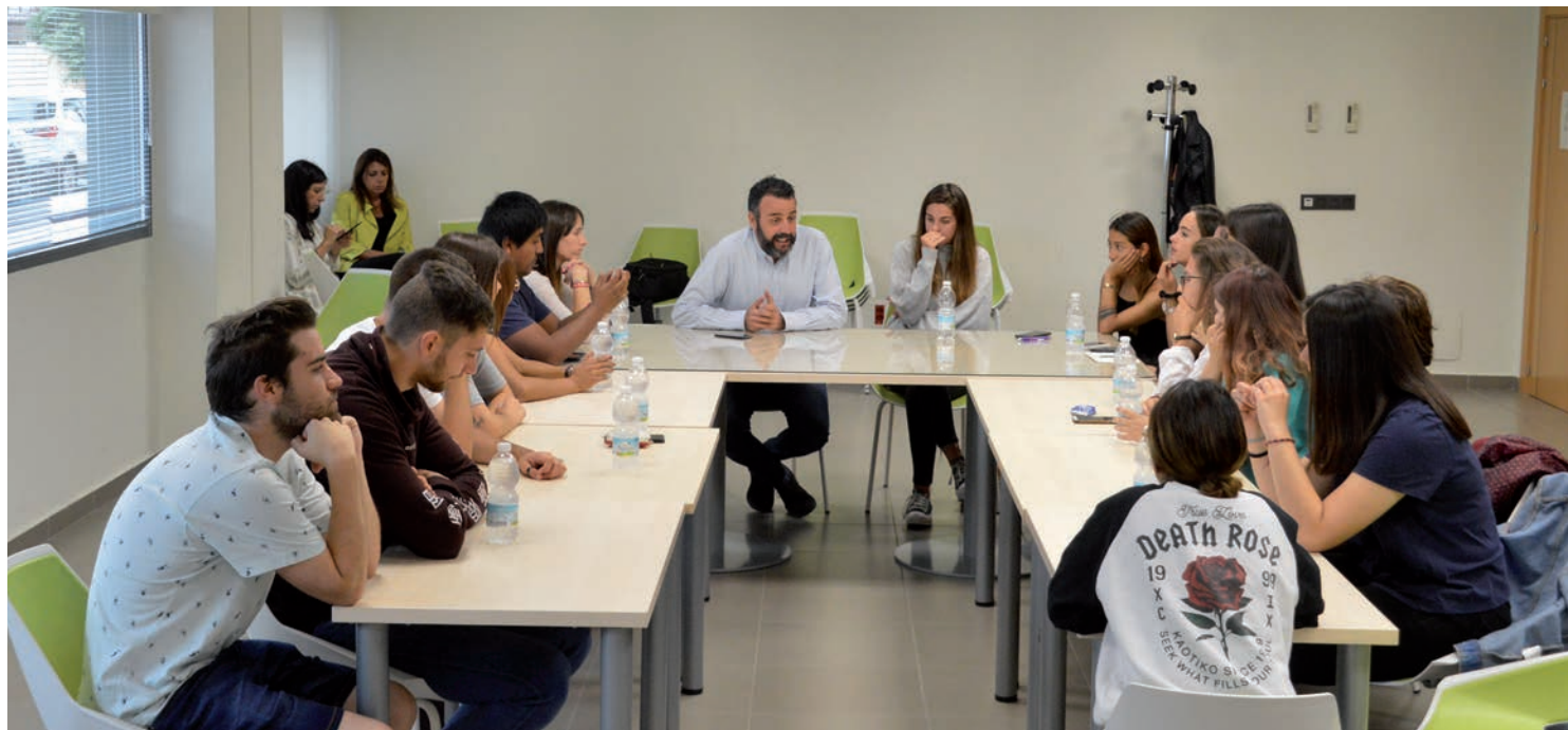
El alcalde y la concejala durante el encuentro con parte de los participantes en el programa de becas lingüísticas, en el Centro de Empresas

➤ Son jóvenes de entre 18 y 30 años que han pasado ocho semanas en Inglaterra e Irlanda mejorando su nivel de inglés, con todos los gastos pagados