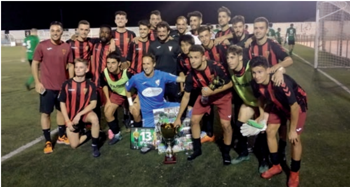
El equipo rojinegro se impuso en el Trofeo de las Fiestas de Horche 2019 al vencer por 0-5 al ACDM Horche.