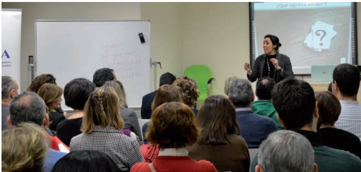
Imagen de archivo del Desayuno Formativo celebrado el pasado mes de febrero