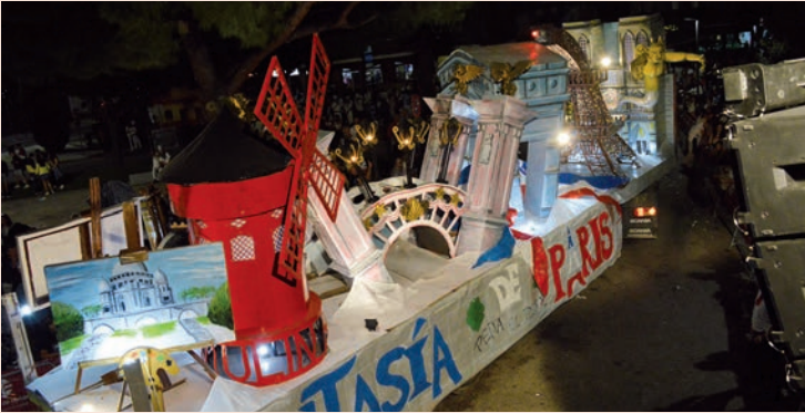
'Fantasía de París' (El Trébol)