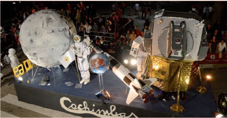
'50 años de la llegada a la luna' (Los Cachimbas)