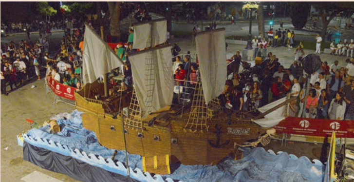
'Galeón pirata' (La Mosca'Gao)