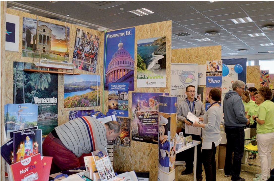
Expositores participantes en la III edición de la Feria, celebrada en octubre de 2018

Las plazas son limitadas y la inscripción definitiva de cada participante se hará por orden de entrega de la documentación requerida: solicitud de inscripción, justificante de abono de la fianza (50 euros), copia del DNI o NIF del solicitante y copia del último recibo de autónomos o documento que acredite que desarrolla su actividad en