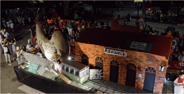
'Azuqueca es un pueblo importante por...' (El Bollo)