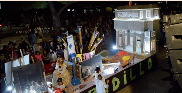
'Bicentario del Museo del Prado' (Felpudillo)