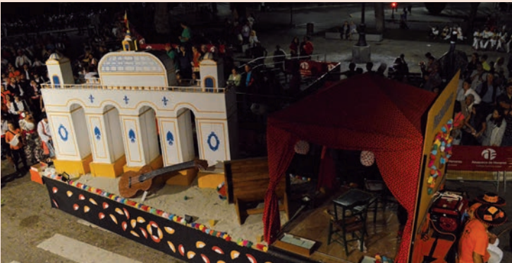
'Feria de Abril' (El Psiquiátrico)