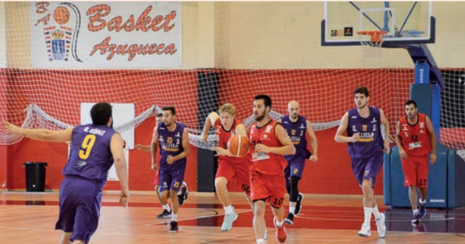
Un momento del partido de cuartos de final del Trofeo de la Junta de Comunidades disputado el 7 de septiembre en el polideportivo La Paz, donde el Isover Basket Azuqueca cayó ante el Guadalajara Basket por 66 a 71.

La campaña de captación de socios puesta en marcha por el club Isover Basket Azuqueca para la nueva temporada tiene como novedad principal la posibilidad de que los socios paguen su abono a través de la página web del club, www.basketazuqueca.es . Quienes opten por el abono en metálico, tienen a su disposición las oficinas del club. Los precios para renovación (novedad) son 40 euros individual y 70 familiar, y, para general 50 euros individual y 90 familiar. Se aplicará un descuento de 5 euros a titulares de la Tarjeta Ciudadana, jubilados y desempleados. Tendrán acceso gratuito a los partidos los menores de 16 años y las personas con discapacidad. •