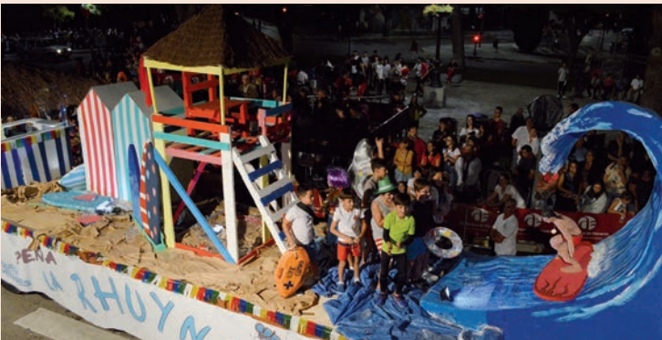
'Rhuyna Beach' (La Rhuyna)