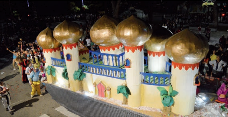
'Aladdin' (Los Dalton)