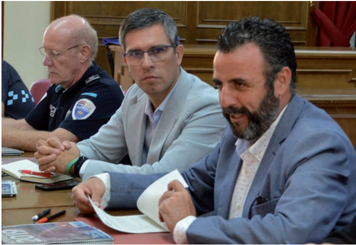
En primer plano, el alcalde, junto al delegado del Gobierno en Guadalajara y el jefe de la Policía Local de Azuqueca de Henares

Afrontar con determinación “Es necesario seguir trabajando para continuar en esta línea