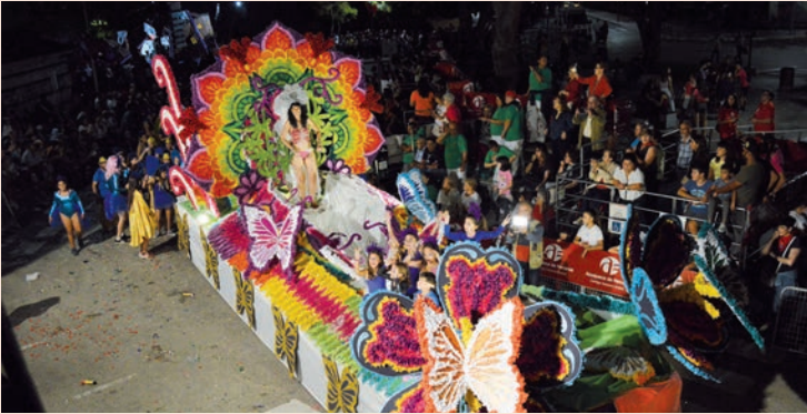
'Carnaval de Río' (La 22)