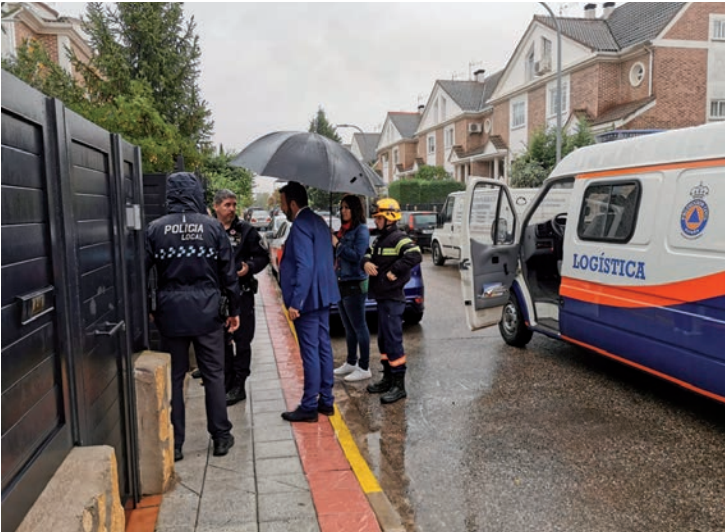
Operarios del dispositivo de emergencias y el alcalde visitaron las zonas más afectadas