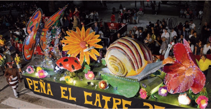
'Fiesta de la primavera' (El Catre)