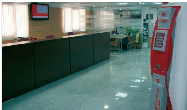
El Servicio de Atención a la Ciudadanía (SAC) se ubica en la planta baja del Ayuntamiento de Azuqueca de Henares

Con el fin de facilitar la relación de los vecinos con el Ayuntamiento