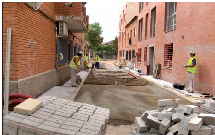
En el barrio de Alovera han empezado los trabajos de adoquinado

La remodelación del barrio de Pobos también ha dado comienzo, con un plazo de ejecución de cinco meses.