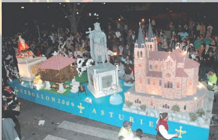
Arriba, el Cebollón obtuvo el primer premio en el Desfile de Carrozas del año pasado, con su recreación de Asturias. Debajo, varios detalles del desfile de 2009

El próximo domingo 19 a las 21 horas, las peñas públicas de Azuqueca exhibirán sus creaciones en la XXXV edición del Desfile de Carrozas, la segunda desde que recibió la consideración de Fiesta de Interés Turístico Regional que concede la Junta de Comunidades. Esta tradicional cita de la Semana Grande de Azuqueca es, en palabras del alcalde, Pablo Bellido, "fruto del esfuerzo continuado de las peñas durante todas estas ediciones y del gran ambiente que se genera cada año en las calles en torno a este evento". Y es que, se trata de un espectáculo que cada edición logra reunir a numerosos espectadores: el año pasado superaron la cifra de 15.000 asistentes. Los preparativos del desfile comienzan unos meses antes. Tal y como recuerda el concejal de Fiestas, Santiago Casas, "el Ayuntamiento pone a disposición de estos auténticos artistas locales dos naves para que, desde el 1 de julio, puedan trabajar en su carroza". "Es una muestra más del apoyo de este Ayuntamiento a las peñas y al gran espectáculo de imaginación que es nuestro desfile de carrozas".