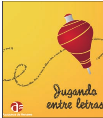
Detalle del folleto informativo de las jornadas

Los ponentes de las jornadas son escritores, investigadores de técnicas de animación a la lectura, narrado-