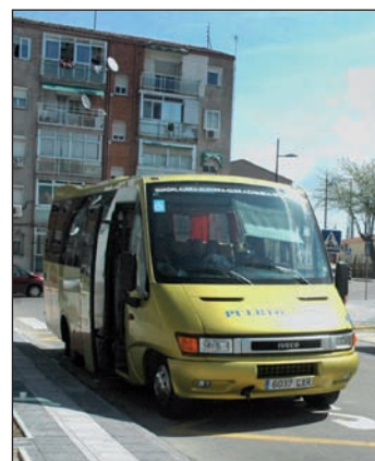
Autobuses del Plan Astra en la parada de la estación de tren

“No es verdad que se multe a estos autobuses porque las paradas supongan un riesgo para la seguridad, ya que antes de que entrara en funcionamiento el ASTRA otros autobuses paraban en el Hospital y no se sancionaba a sus conductores; no es verdad tampoco que las sanciones respondan a la aplicación de la ordenanza municipal de Tráfico, porque cada día en el entorno del Hospital hay muchos vehículos estacionados en los arcones, de manera indebida y la policía no les multa”, argumenta el alcalde. “Se está haciendo una selección intencionada con el único deseo de dañar al Astra, un servicio muy útil para los vecinos de Azuqueca