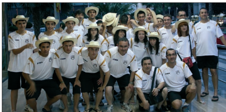
Participantes en el Torneo Internacional Costa Dorada Cup, donde el equipo Juvenil del CFS Azuqueca se proclamó subcampeón

Por otra parte, el Azuqueca B ha ascendido de categoría y el próximo curso jugará en Primera Preferente, aprovechando la vacante dejada por el Tomelloso.