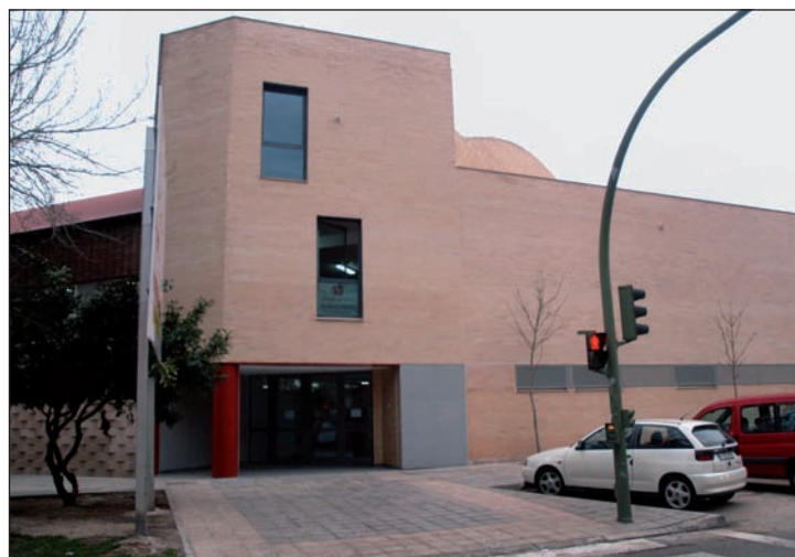
El polideportivo de La Paz es una de las instalaciones municipales donde el Ayuntamiento instalará placas de energía solar fotovoltaica

Los cinco proyectos aprobados por el Ayuntamiento suman una