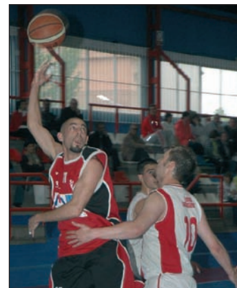
Un momento del partido del Club Basket contra el Puertollano de la temporada pasada

Los locales recibirán en la primera jornada de la liga al Almansa. “Va a ser un año difícil, pero lucharemos por llegar a lo más alto”, afirman desde el Club.