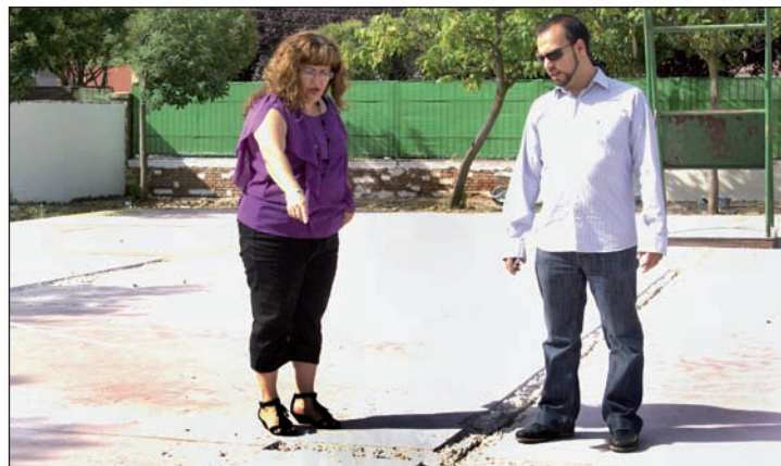
La concejala y el alcalde visitaron en agosto las obras de La Paz

Para la realización de estas reformas, que cuentan con una partida económica en los presupuestos municipales de 350.000 euros, se ha contratado a varias empresas, "un ejemplo del compromiso del Ayuntamiento azudense por el fomento del empleo y la creación de puestos de trabajo",