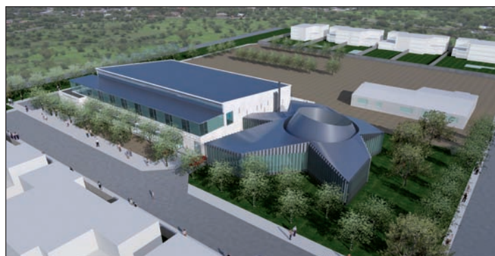
Infografía de Vahos Arquitectura que muestra el aspecto que lucirá el exterior de la piscina climatizada una vez finalizadas las obras