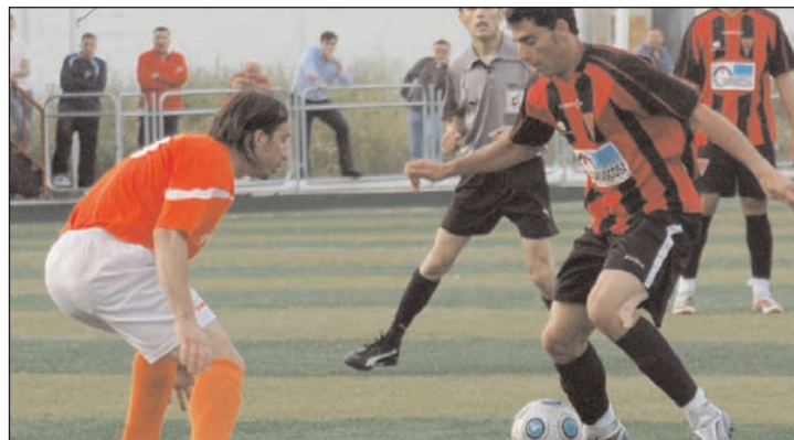
Imagen de archivo del último partido de liga que disputó el CD Azuqueca en el San Miguel la pasada temporada

Al cierre de esta edición de AZUCAHICA, la plantilla, que aún no estaba cerrada a la