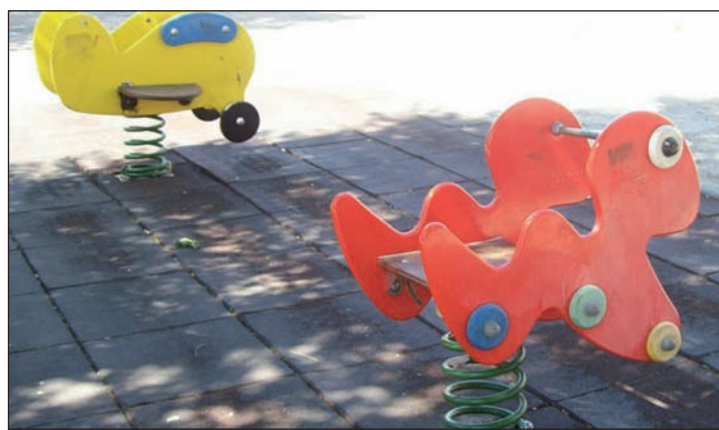
Azuqueca cuenta en la actualidad con 34 zonas de juegos infantiles

En total, el Ayuntamiento colocará más de un centenar de nuevos elementos en las 34 áreas de juego infantiles distribuidas por el municipio. "Además, una de las mejoras que hemos previsto en el