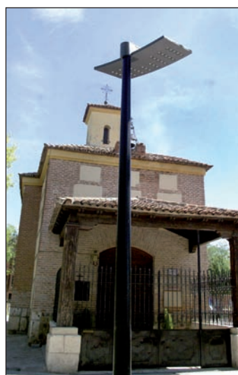
Nueva farola en el parque de La Ermita

Estos tres proyectos se financian con cargo al Fondo