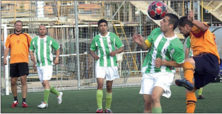
Imagen de la final de la Copa de Fútbol 7 disputada en junio

La documentación debe presentarse en la conserjería de El Foro