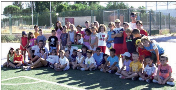
Participantes del Campus Multideportivo que se impartió durante la segunda quincena de julio en el San Miguel

Se desarrolló durante los meses de julio y agosto