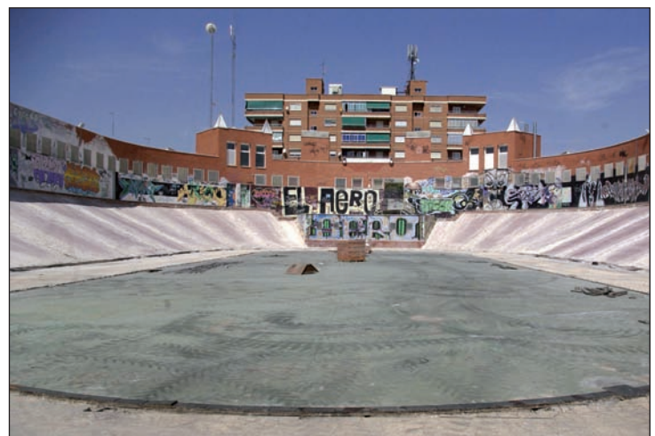
Imagen actual de la parte trasera de El Foro, donde está previsto construir unas pistas polivalentes y habilitar una zona verde

“Las pistas deportivas no se adaptarán a las medidas reglamentarias, pero servirán para jugar partidos, por lo que daremos respuesta a una demanda de los jóvenes del municipio, que nos pedían un lugar para realizar actividades al aire libre”, añade la