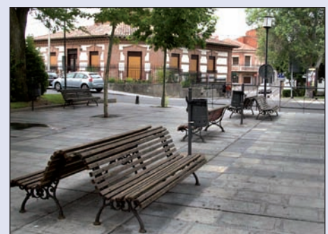
Vista actual de la plaza del General Vives