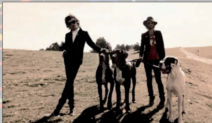
El sábado 18, en el pabellón multiusos 'Ciudad de Azuqueca'