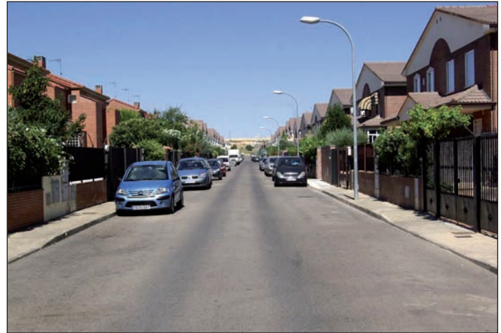
Imagen de una de las calles contempladas en la segunda fase de las obras de pavimentación en el barrio de Vallehermoso

El proyecto va a permitir completar el tramo de la calle Chueca que quedó pendiente en la primera fase. Además, se actuará en las calles Chapí, Barbieri, Granados, Sorozábal, Guerrero y Rodrigo. “Ahora mismo, las aceras son de hormigón y los trabajos consistirán en la demolición de ese hormigón, el ensanchamiento en el lado