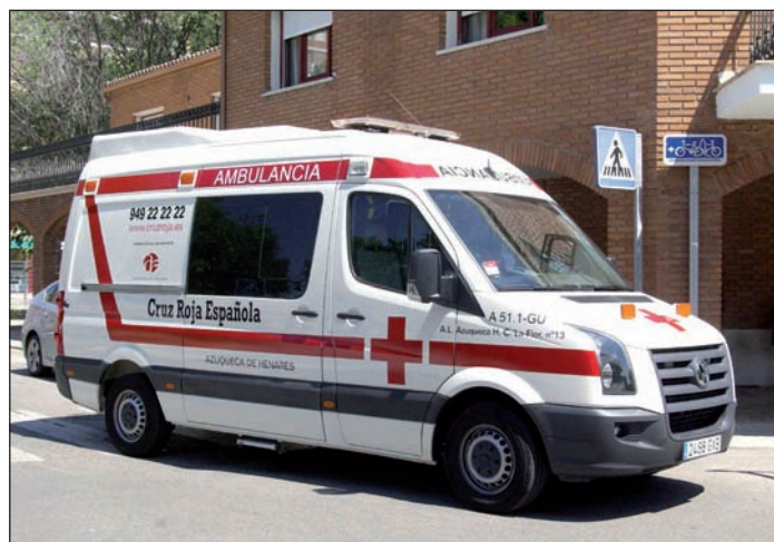
Cruz Roja y Protección Civil colaborarán con los Cuerpos y Fuerzas de Seguridad

las Fiestas de Septiembre, por lo que extraordinariamente se suspende la actividad, al igual que se viene haciendo desde el año pasado, cuando se decidió trasladar los puestos del mercadillo a la avenida de Alcalá, por donde discurren los encierros".