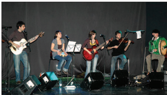
En la imagen superior, dos de los componentes del grupo local Gnothach's. Debajo, la formación al completo