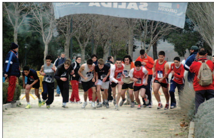
Un momento de la carrera disputada en el parque de La Quebradilla