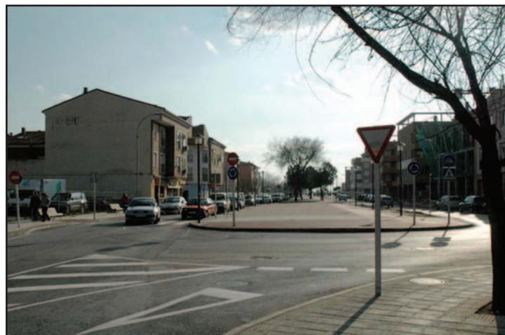
Un tramo de la avenida de Alcalá

Cuando el proyecto de la primera fase esté listo, el Ayuntamiento lo presentará a la Junta para cerrar el convenio de financiación. Tras la firma del oportuno convenio, se pondrá en marcha la licitación de las obras, según las previsiones del concejal de Urbanismo.