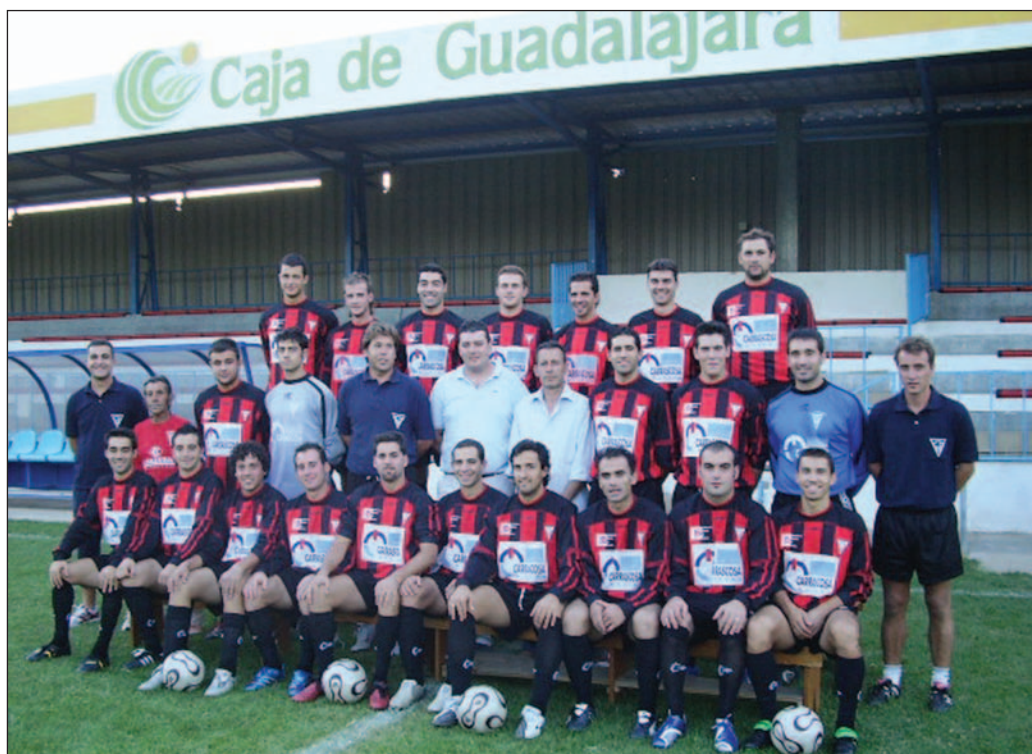
Desde el inicio de la temporada, el Club Deportivo Azuqueca ha anunciado que su objetivo es conseguir el ascenso a Tercera