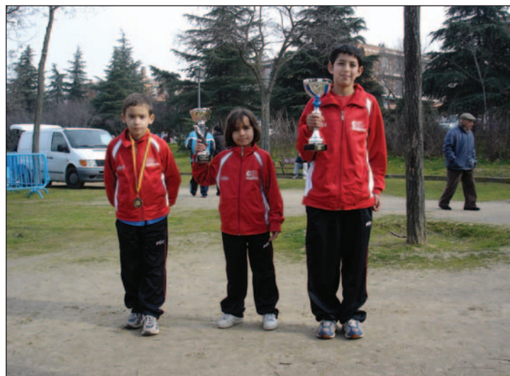
La EM de Atletismo de Azuqueca estuvo presente en 48 Trofeo Marathón de Campo a Través y en el X Gran Premio Villa de Madrid.