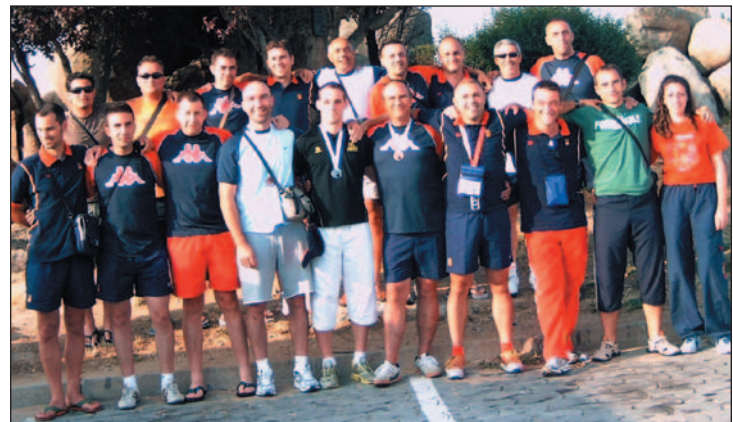
Imagen de archivo de la expedición azudense que se desplazó a Galicia para participar en los Juegos Europeos de Policías y Bomberos el pasado verano

Un grupo de Policías Locales de Azuqueca ya participó el pasado verano en los Juegos Europeos de Policías y Bomberos, que se celebraron en Galicia.