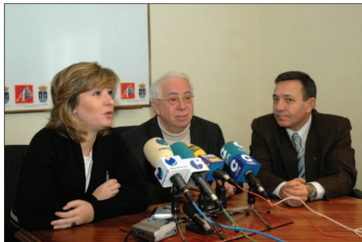
La consejera de Administraciones Públicas, el alcalde azuquense y el delegado de la Junta en Guadalajara, explican a la prensa el contenido del convenio de colaboración para la ampliación de las dependencias de la Policía Local