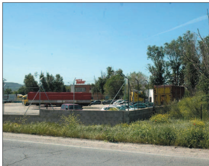
El futuro vial enlazará la avenida del Conde de Romanones y la avenida del Sur, atravesando los terrenos de Tudor

Por otra parte, la concejalía de Obras e Infraestructuras ha invertido alrededor de 3.000 euros en mejorar la señalización horizontal en varias calles de Azuqueca.