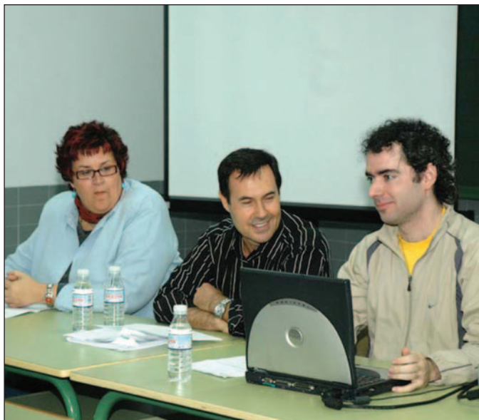
Presentación del curso