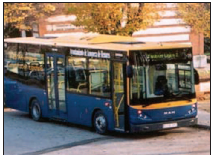
Imagen de archivo de uno de los autobuses urbanos que dan servicio en Azuqueca de Henares

Servicios destaca asimismo las cifras de viajeros registradas durante el periodo escolar, ya que durante los meses de marzo, mayo, octubre y noviembre la