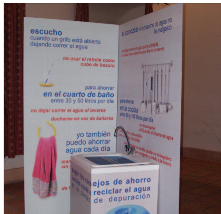
Uno de los paneles de la exposición sobre el agua

mas derivados de la falta de agua, un elemento primordial para la consecución de los Objetivos de Desarrollo del Milenio, ya que no solamente afecta a la Sostenibilidad Ambiental, sino que directa o indirectamente se relaciona con el resto de objetivos”. Para el edil, es imprescindible que la sociedad tome conciencia de la necesidad de un uso racional del agua y de una buena gestión de este recurso, así como de las consecuencias negativas que sobre el medioambiente tiene la disminución de recursos hídricos.