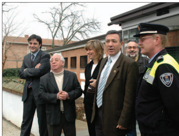
Representantes de la Junta y del Ayuntamiento, a las puertas de las nuevas dependencias de la Policía Local de Azuqueca de Henares

Los agentes se incautaron de 1.200 gramos de hachís