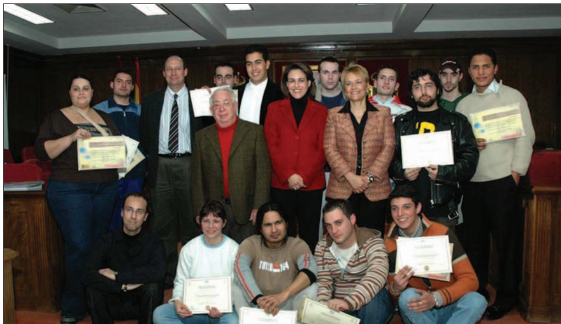
Los jóvenes posan con sus diplomas, acompañados de la consejera, el alcalde, la concejala de Servicios Sociales y el delegado de Trabajo y Empleo