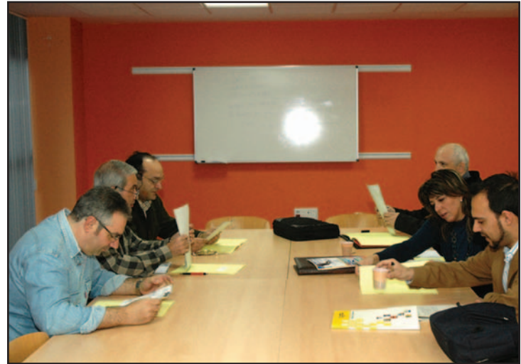
Reunión entre el Ayuntamiento y Acasa celebrada el pasado 22 de febrero

"La idea es organizar además actividades para niños, con el fin de que a través de ellos acudan los padres y que éstos conozcan la variedad y la