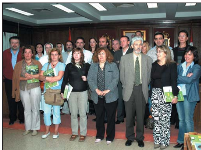
Presentación del proyecto Atlántida en el salón de plenos del Ayuntamiento de Azuqueca, el pasado mes de octubre