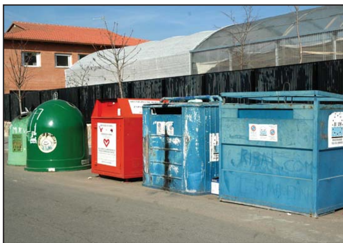
Contenedores para la recogida selectiva instalados en Azuqueca por la mancomunidad Vega del Henares

en la entrega de un camión adquirido para la recogida de los residuos que se depositan en los contenedores amarillos es lo que está impidiendo que en Azuqueca y en el resto de los municipios de la Mancomunidad empiece a funcionar el reciclado de envases. Vega del Henares tiene dispuestos los contenedores amarillos para este tipo de residuos desde hace muchos meses, pero el camión no llega. Los contenedores, cedidos por la Junta de Comunidades para la implantación de este servicio, se almacenan en el