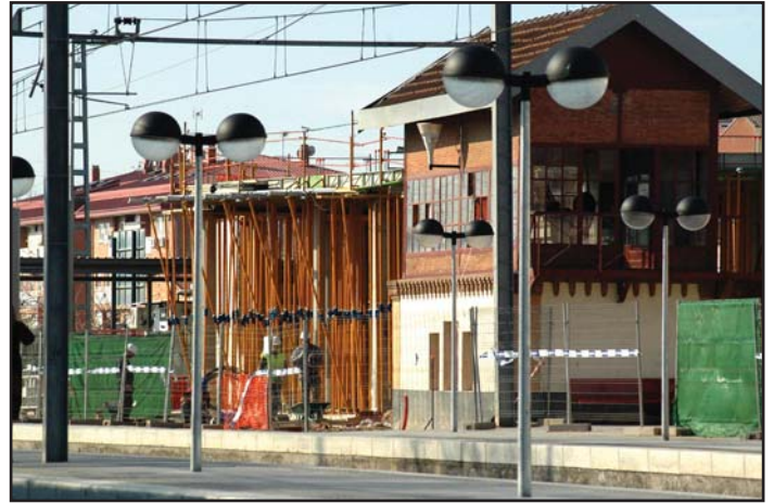
Situación actual de las obras en la estación de Renfe de Azuqueca.

En cuanto a las obras del edificio central de viajeros, Guerrero afirma que se están finalizando los forjados y que durante los próximos meses se dará paso a la distribución inte-