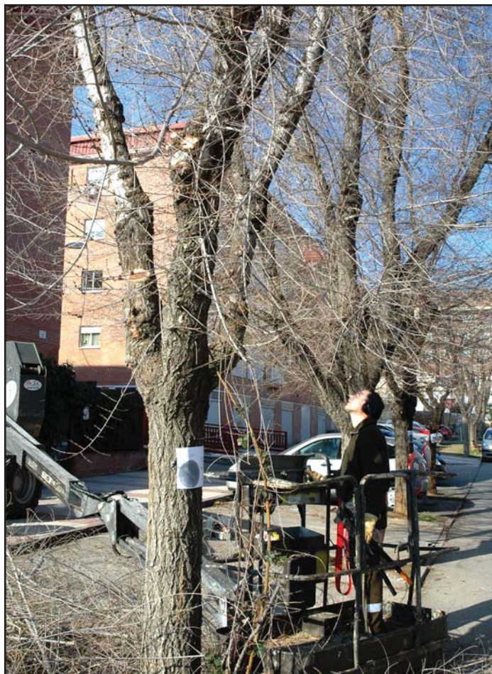
La época de plantación coincide en el tiempo con la de la poda

Antes de que finalice la época de plantación, Azuqueca contará con más de 600 nuevos árboles. “En los parques y zonas verdes haremos algunas sustituciones, pero la mayor parte de las plantaciones se están haciendo en los nuevos desarrollos: alrededor de 460 ejemplares van a estos nuevos sectores y otros 200 se corresponden con reposiciones”, detalla el concejal de Parques y Jardines, Victorio Calles. En total, la inversión del Ayuntamiento para plantaciones en esta temporada supera los 30.000 euros. “Las especies son variadas y se adaptan a la ubicación, de modo que los árboles de gran porte se colocan en avenidas y calles anchas, mientras para las vías más estrechas se buscan especies más menudas”. También en estos momentos se está trabajando en tareas de poda. Según el concejal de Parques y Jardines, se van a talar los árboles que están en mal estado o que suponen graves perjuicios “como los chopos de la avenida de la Constitución que están cerca de la iglesia de La