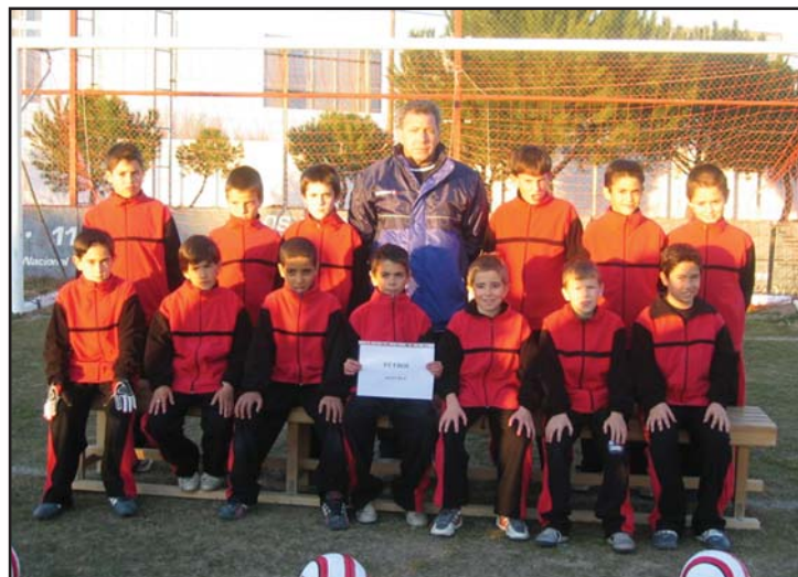
Alumnos del curso pasado de la Escuela municipal de fútbol de Azuqueca

Según Torres, el número de usuarios de las instalaciones deportivas de Azuqueca ha ido creciendo de manera sostenida en los últimos años hasta alcanzar las 5.000 personas en estos momentos. “Ese dato supo-