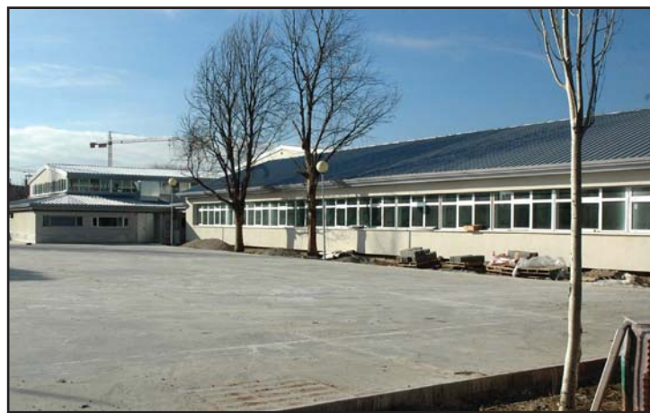
El Eco-Museo estará en la parte municipal del Centro de Adultos

proyecto de la Reserva Ornitológica (ver información en esta página) y, en relación con el parque del Lavadero, el concejal de Medio Ambiente ha anunciado que se acometerá en varias fases.