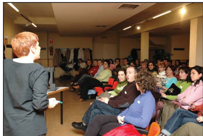
Imagen de la primera jornada del taller “¿Cómo hacer más felices a tus hijos?”

La participación en este curso es gratuita y Servicios Sociales ofrece a los participantes un servicio gratuito de guardería. El programa está cofinanciado por la Consejería de Bienestar Social, dentro de un convenio con el Ministerio de Trabajo y Asuntos Sociales, que aprobó el Consejo de Gobierno de Castilla-La Mancha el pasado 23 de noviembre “justamente para la realización de actividades de apoyo a familias en situaciones especiales, de riesgo, desfavorecidas y monoparentales, en varias localidades de la región entre las que nos encontramos”, recuerda la edil.