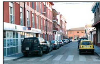
La calle La Flor es una de las incluidas en el proyecto de renovación de redes

El edil de Obras e Infraestructuras asegura que