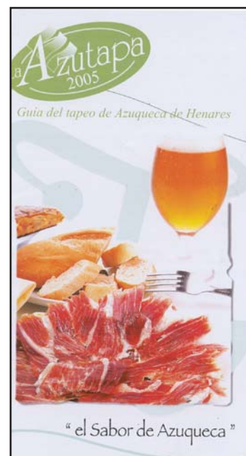
Imagen de promoción de la primera edición de "La Azutapa"