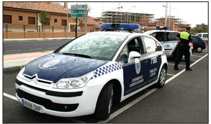
La Policía Local ha realizado en los últimos meses varias incautaciones de droga a menores

Juan Pablo Herranz, subdelegado del Gobierno en la provincia de Guadalajara: "Es fundamental que los jóvenes tomen conciencia de las graves secuelas que sobre su organismo tiene el consumo de este tipo de sustancias. Este plan se refuerza además con otro dispositivo que se centra en las zonas de ocio y diversión, que también ha empezado a funcionar en el mes de enero".