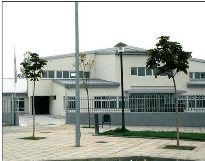
Nuevas instalaciones del Centro de Adultos Clara Campoamor que reabrieron sus puertas el pasado 9 de enero

Las clases comenzarán el 16 de febrero, son clases oficiales y gratuitas con las que se consigue el título de graduado en Educación Secundaria, a las que se puede acceder sin título alguno y con turnos de mañana y tarde. Estos cursos son cuatrimestrales, así que los que comienzan ahora finalizarán en junio.