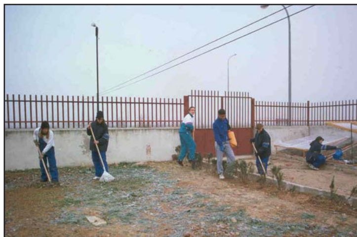
Uno de los programas tradicionales de los Planes de Empleo es el de Jardinería

Como novedad este año, destaca la previsión de contratar a un captador de empresas y a un promotor solidario. "Mantenemos también programas tradicionales -añade el edil- como los de