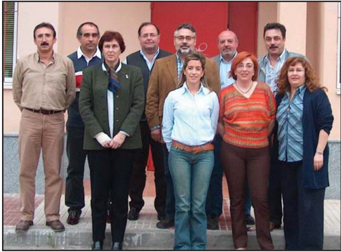
Foto de familia de la Asamblea de Vega del Henares

Luz verde para el pliego de condiciones del servicio a partir de 2007