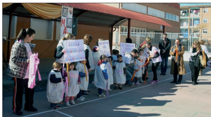
Un momento del acto celebrado el 28 de enero