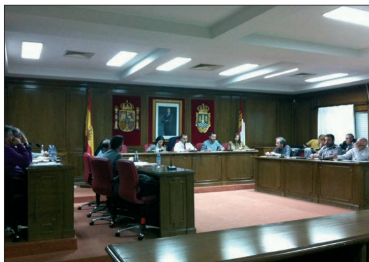
Un momento de la sesión plenaria del 29 de enero