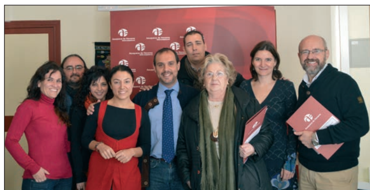
El alcalde y la concejala de Cooperación al Desarrollo, con los representantes de las organizaciones que han recibido una subvención

Para el desarrollo de iniciativas en Honduras, India, Ecuador, Bolivia y Azuqueca