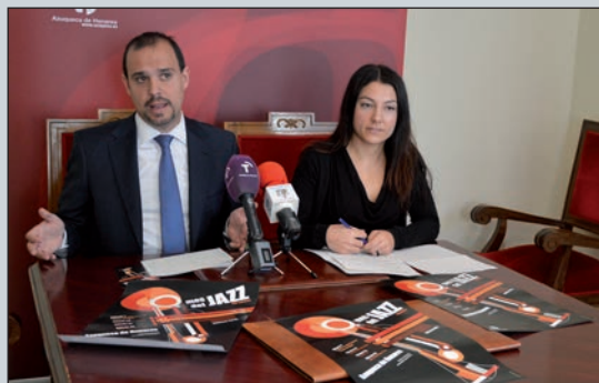
El alcalde y la concejala de Cultura, durante la presentación del programa del XIV Mes del Jazz de Azuqueca