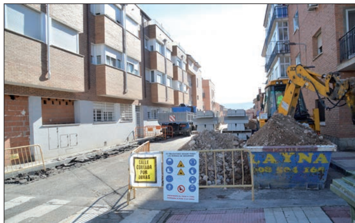
En la imagen superior, obras en el barrio de El Vallejo. Debajo, inicio de los trabajos programados en la calle Río Escabas

La obra programada en la calle Río Escabas también supone una actuación integral. "Se renovarán el asfalto y las aceras, se eliminarán los setos para mejorar la accesibilidad a las viviendas y se sustituirá el alumbrado público y las redes de saneamiento; además, se ha previsto una conexión para que las bajantes del agua pluvial de los edificios no viertan a la calle, sino que desemboquen en la red de saneamiento", detalla la edil. En ese caso, la inversión municipal asciende a 55.000 euros.