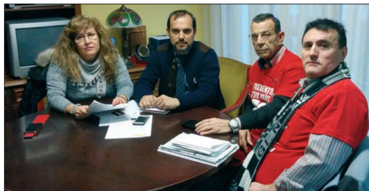
Un momento de la reunión

Por su parte, la concejala de Protección de la Salud, ha