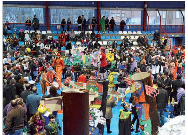
El polideportivo La Paz volver  a llenarse de disfraces el s bado 14 de febrero (imagen de la fiesta de 2014)

La actividad central de estas fiestas volver  a ser el Desfile de Carnaval del s bado, que saldr  desde la plaza de La Constituci n y terminar  en el polideportivo La Paz, donde se celebrar  el ‘baile de m scaras’ y se entregar n los premios a los mejores disfraces en las categor as individual, pareja, grupo y comparsa.