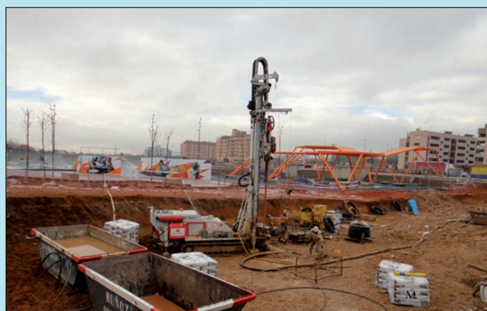
Fotografía tomada en enero de 2014 de las máquinas realizando las perforaciones para la instalación de la geotermia

Se trata del primer edificio del municipio que utilizará el calor del subsuelo de la tierra para la climatización del edificio, tanto la calefacción como la refrigeración. Para hacer esto posible, por debajo