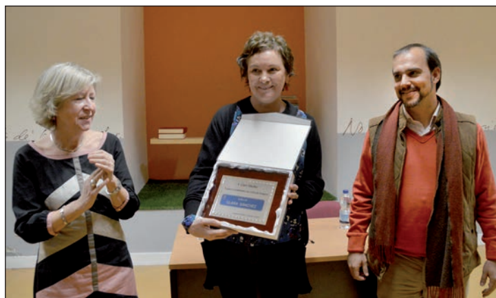
La autora, flanqueada por la directora de la Biblioteca y por el alcalde, muestra la reproducción de la placa de la calle que lleva su nombre

Red de Lectores Libro y Manta. – La Red de Lectores Libro y Manta (un programa de animación a la lectura de la Biblioteca Municipal dirigido a familias) ha ampliado a dos sus sesiones semanales (se celebran los jueves de, de 16:30 a 17:30 horas y los viernes, de 11:30 a 12:30 horas). Más información, en la Biblioteca.