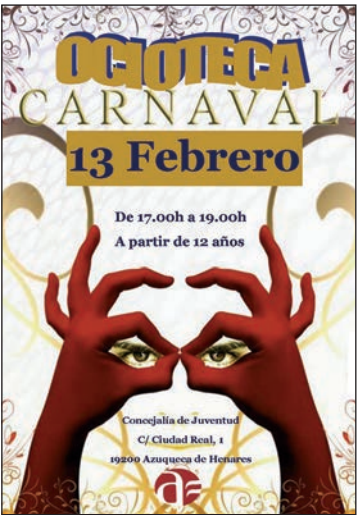
Carteles de la Ocioteca: a la izquierda, Fiesta de Carnaval y a la derecha, de las sesiones de juegos digitales