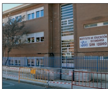
Sobre estas líneas, obras en la calle Poeta Manuel Martínez. A la derecha, nueva acera en la calle La Noguera. Debajo, el tramo renovado en la calle Cuenca.

En la calle La Noguera, está muy avanzada la nueva acera, cuya construcción ha sido posible tras el convenio alcanzado con los propietarios de una parcela y que ha permitido ensanchar este vial. "Mejoramos la seguridad de