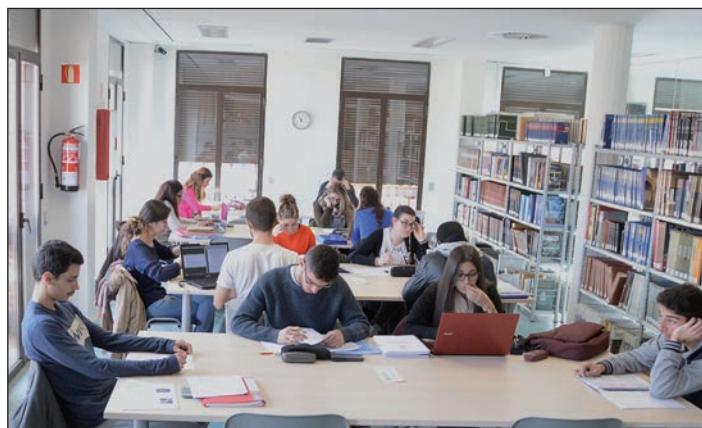
En las dos primeras semanas de funcionamiento del horario extraordinario, utilizaron la sala de estudio casi 600 personas

Los usuarios de la sala durante el horario extraordinario tienen a su disposi-