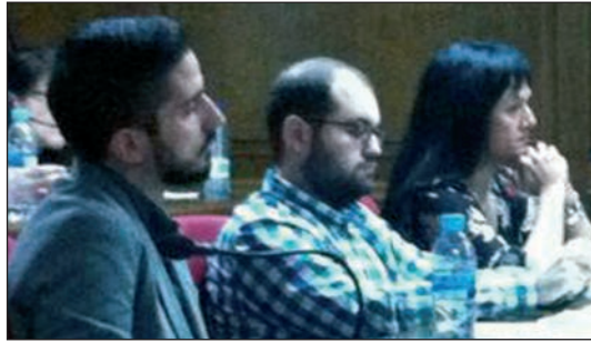
Los tres concejales No Adscritos, durante el Pleno del 29 de enero.

En su despedida, los tres ediles agradecieron "al alcalde, al equipo de Gobierno y al grupo municipal de IU el apoyo prestado en