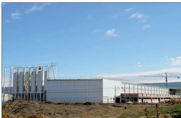
Las instalaciones de Bimbo están muy avanzadas

Tanto la fábrica de Bimbo como el almacén logístico forman parte del Plan de Transformación Industrial 2020 de la compañía, presentado públicamente el año pasado. De hecho, según la empresa, la actuación en Azuqueca constituye el primer paso de la estrategia diseñada por la compañía