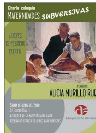
Cartel de la actividad