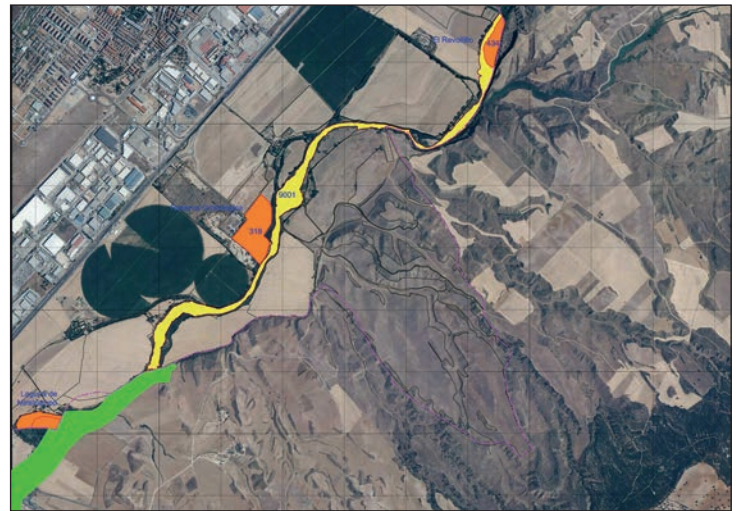
Plano de las zonas de Azuqueca que se han incorporado al Lugar de Importancia Comunitaria 'Riberas del Henares'

En marzo de 2014, el Ayuntamiento de Azuqueca de Henares solicitó a la Junta de Comunidades la declaración como Lugar de Importancia Comunitaria (LIC) 'Riberas del Henares' de la totalidad de la laguna de Miralcampo, de la Reserva Ornitológica, la finca municipal El Revoltillo y el bosque de ribera de titularidad de la Conferencia Hidrográfica del Tajo. "Estos espacios –explica Blanco– acogen una excelente representación del hábitat de