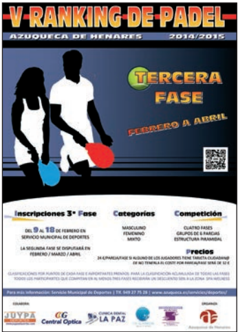
Cartel de la tercera fase del Ranking de Pádel

El Ranking de Pádel, que organiza el Ayuntamiento de Azuqueca de Henares, celebra su tercera fase entre los meses de febrero a abril. La competición, que alcanza su quinta edición, cuenta con las categorías Masculino, Femenino y Mixto. Las personas interesadas pueden formalizar su participación en el Servicio Municipal de Deportes (SMD) entre el 9 y el 18 de febrero. La cuota de inscripción por pareja es de 24 euros, si alguno de los jugadores es titular de la Tarjeta Ciudadana, y de 32 euros, para el resto. Además, se ofrecen precios reducidos para quienes se inscriban en dos categorías (femenina y mixta o masculina y mixta) y un descuento del 50 por ciento en la zona spa-wellness de la piscina climatiza-