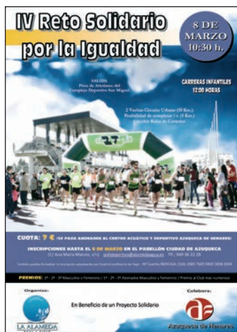
Cartel de la carrera

La prueba, con salida a las 10:30 horas en la pista de atletismo del complejo San Miguel, consiste en completar 10 kilómetros por un circuito urbano (dos vueltas), aunque se ofrece la posibilidad de dar una vuelta (5 kilómetros) y recibir igualmente la bolsa del corredor. A las 12 horas, se celebrarán carreras infantiles.