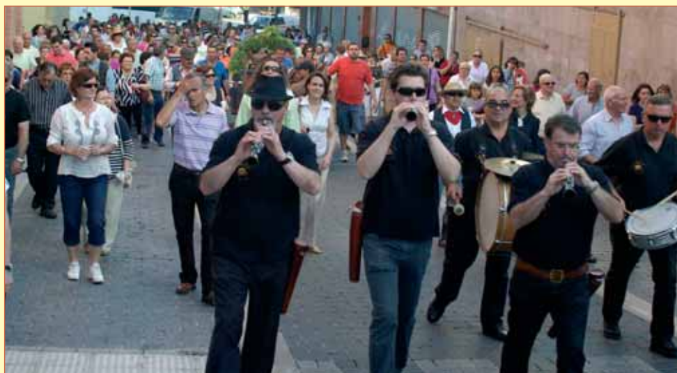
La Fiesta de la Espiga, declarada el año pasado de Interés Turístico Provincial, volvió a reunir a un gran número de vecinos