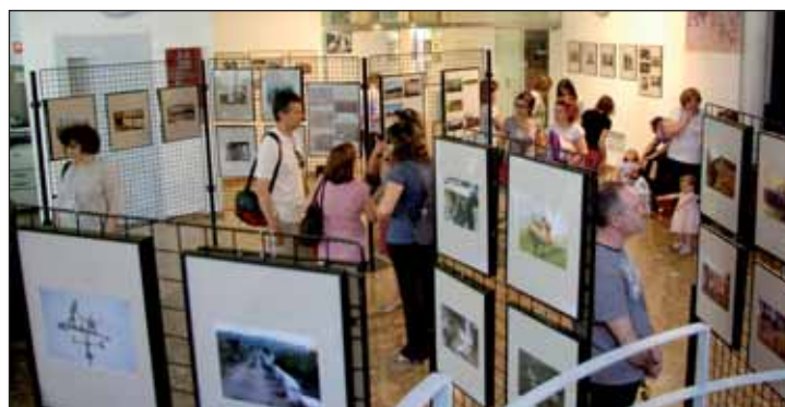
La entrada de la Casa de la Cultura acoge una exposición con las imágenes premiadas y seleccionadas por el jurado

El acto sirvió también para inaugurar la exposición