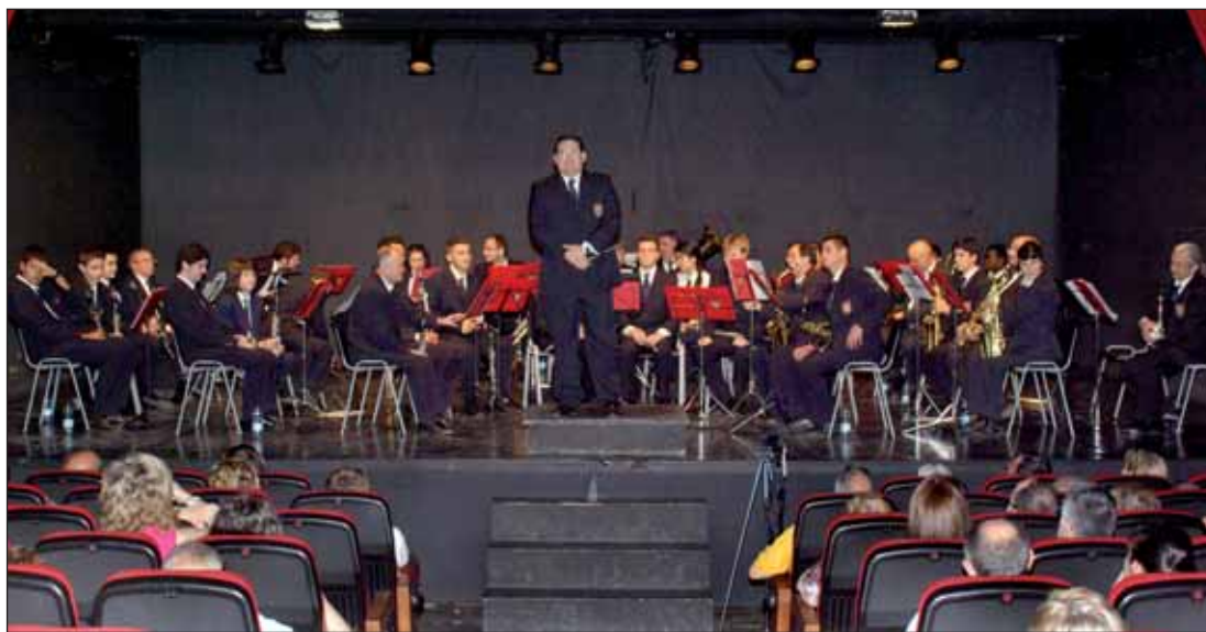
El salón de actos de la Casa de la Cultura acogió el 13 de mayo el concierto que la Banda de Música ofreció en las Fiestas de San Isidro

En mayo de 1999, la Banda de Música de Azuqueca de Henares subió al escenario de la Casa de la Cultura en la que fue su primera actuación. Entonces, estaba formada por una docena de músicos que interpretaron cuatro piezas. Hoy, ronda los 40 integrantes y tiene un repertorio con unos 120 temas de todo tipo