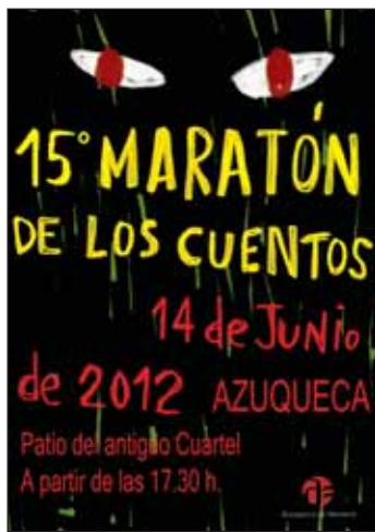
Cartel promocional del Maratón de los Cuentos

Las personas interesadas pueden inscribirse en la Biblioteca Municipal, o bien en el teléfono 979 34 84 67 y en el correo electrónico biblioteca@azuqueca.net .