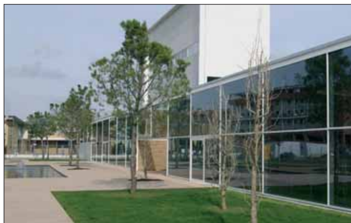
Fachada del Centro de Ocio Río Henares, uno de los edificios en los que se van a instalar placas de energía solar fotovoltaica

En el verano de 2010, el Ayuntamiento solicitó al Ministerio de Industria y Energía la inclusión del municipio en el Registro de Preasignaciones de Energía Fotovoltaica (PREFO), dado que la producción de energía