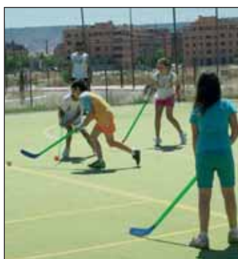
Imagen de archivo del campus multideporte de 2011

En la edición de 2012, se van a impartir cinco actividades deportivas, que suman cerca de 500 inscritos y se desarrollan en cuatro quincenas: del 2 al 13 y del 16 al 27 de julio, del 30 de julio al 2 de agosto y del 20 al 31 de agosto. "Como en años anteriores, el campus multideporte, para alumnos de 6 a 16 años, así como el pádel y el tenis, tanto para niños como para adultos, son las disciplinas con mayor