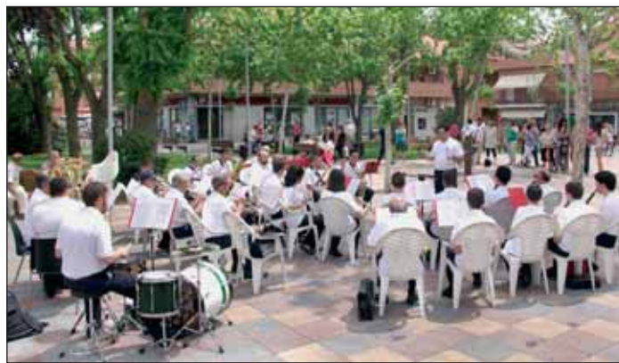
La actuación de la Banda de Música de Azuqueca en la plaza del General Vives abrió el programa de actividades organizadas por el Ayuntamiento para dinamizar el comercio local

Por otra parte, el Ayuntamiento está trabajando, en colaboración con los comerciantes, en la celebración de una jornada especial, que tendría lugar el último viernes de junio, el día 29. Bajo el lema 'Los