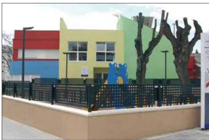
La formalización de la matrícula en las Escuelas Infantiles se realizará en los propios centros entre el 18 y el 25 de junio. En la imagen, fachada de la guardería La Curva

El precio público en las Escuelas Infantiles por estancia y comida es de 262,10 euros al mes, cantidad que, hasta ahora, se reduce en 109 euros por la subvención comprometida por la Junta de Comunidades de Castilla-La Mancha. “Si el dinero de la