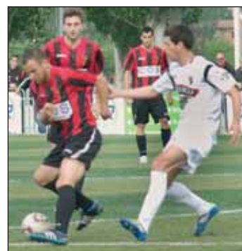
Partido de la fase de ascenso contra el Tudelano

De cara al próximo curso, la presidenta reconoce que "las perspectivas son peo-