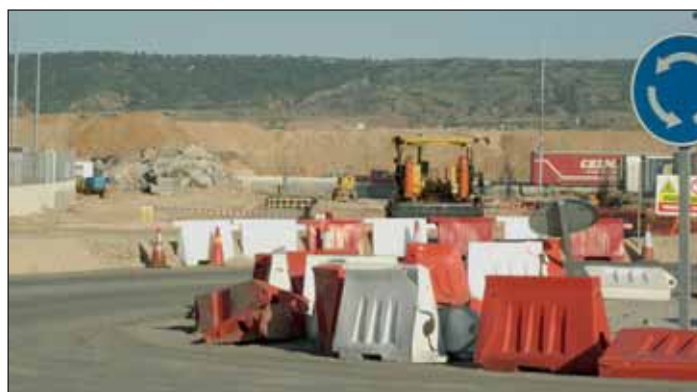
El anterior puente ya ha sido demolido y han comenzado los trabajos para la construcción de uno nuevo