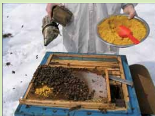
Segundo premio (600 euros): 'Pasięka BARC Kamian-na', de Jacek Nowak (Polonia)