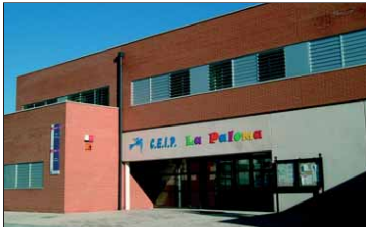
El programa se desarrollará en las instalaciones del colegio La Paloma

El programa diseñado por el Ayuntamiento se prolongará durante todas las vacaciones escolares, aunque se ofrecerá a las familias la posibilidad de solicitarlo por semanas. Tendrá lugar en las instala-