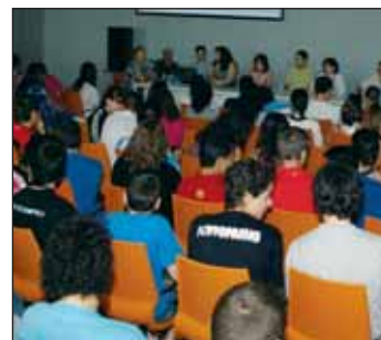
Un momento de la jornada

En este sentido, la convocatoria de admisión en los