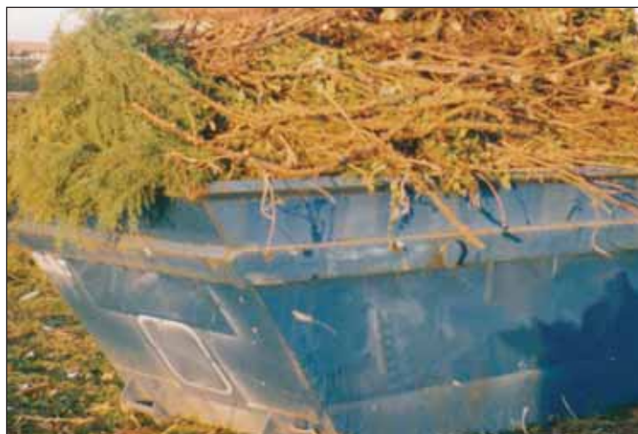
Azuqueca cuenta con once contenedores de recogida de restos de poda

Con estas modificaciones del servicio, "el Ayun-