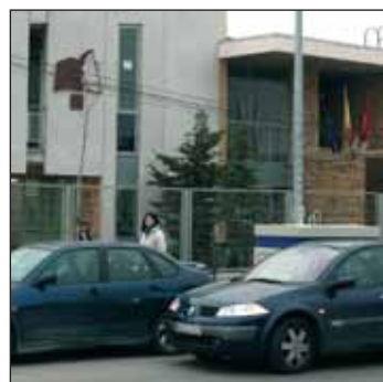
La EMIA se ubica en el IES Profesor Domínguez Ortiz

En este sentido, la edil ha lamentado que la Junta decidiera no renovar el convenio por el que aportaba 60.000 euros anuales para el funcionamiento de la escuela. “Seguiremos el próximo curso