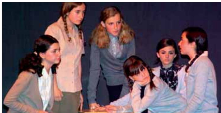
Un momento de la exhibición realizada el 23 de mayo por los alumnos del primer nivel del taller municipal de Interpretación

Participan los alumnos de Pintura, Escultura, Danza, Música, Interpretación y Coro Infantil