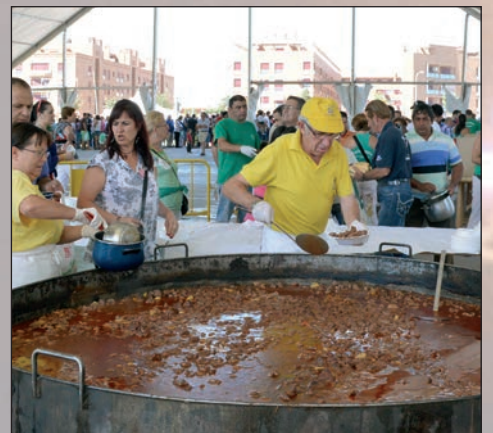
En la comida popular se repartieron unas 4.000 raciones de caldereta