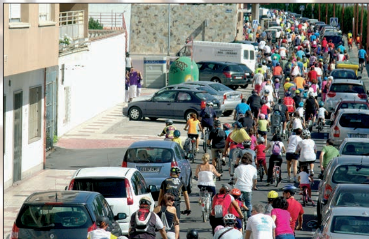
DÍA DE LA BICICLETA.- Unas 3.000 personas, en su mayoría familias, se sumaron el domingo 22 de septiembre al Día de Bicicleta, con salida y llegada a la plaza 3 de Abril, donde se procedió al sorteo de regalos. En la imagen, los participantes a su paso por la avenida del Ferrocarril.

COMIDA POPULAR.- Como es habitual, en el último día de las Fiestas, la carpa del ferial se transformó en una cocina para preparar la comida popular. Este año se repartieron 4.000 raciones de caldereta.