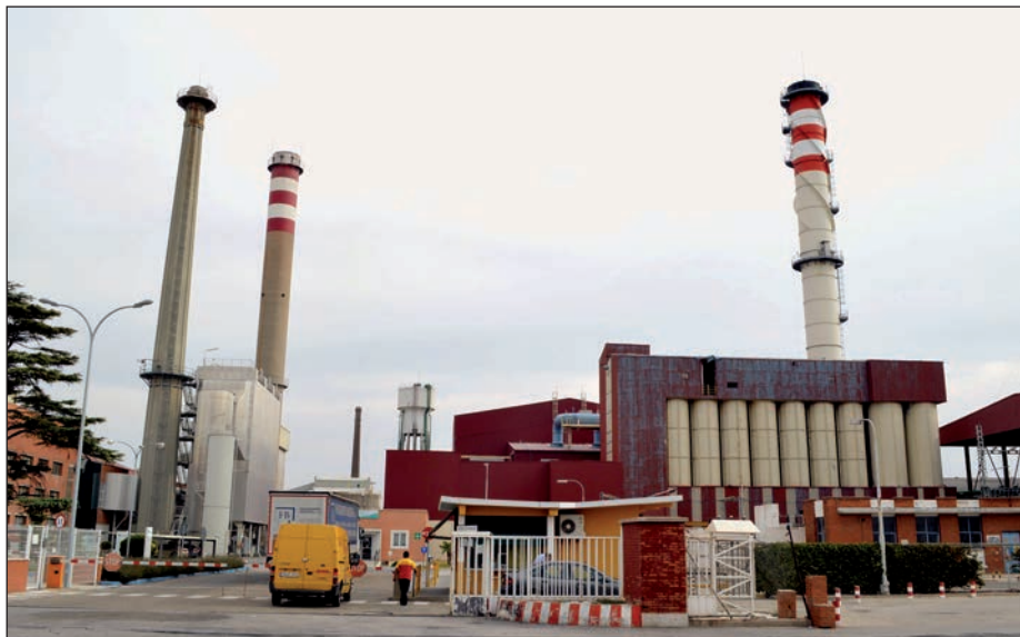
Imagen del complejo de Cristalería, integrado hoy por Verallia, Isover y Bormioli Rocco.

En 1963, comenzó la producción en la fábrica de vidrio de Azuqueca y con ella la transformación económica y social de un municipio que dejó de mirar al campo y se convirtió en un núcleo industrial.