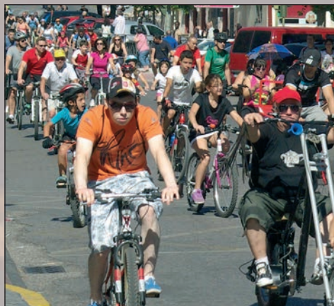
Participantes en el Día de la Bicicleta a su paso por la avenida de La Constitución