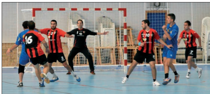
Un momento del partido amistoso que jugó el Avangreen Azuqueca contra el Coslada

El equipo azudense, que comenzó el 2 de septiembre los entrenamientos, se presentó ante la afición el día 21 con un partido contra el Coslada. Los visitantes se impusieron con un marcador de 28-32.