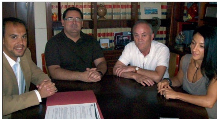
El Ayuntamiento azudense renovó en septiembre los convenios de colaboración con la Banda de Música (foto superior) y con la Asociación de Agricultores (foto inferior).