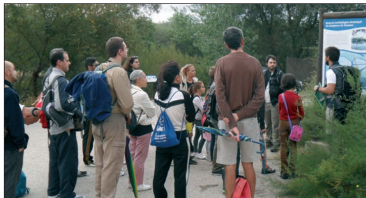
Voluntarios de la Salida de Campo del 28 de septiembre

Ya el sábado 26, entre las 9 y las 13:30 horas, se va a desarrollar una plantación de árboles y arbustos de especies autóctonas. La inscripción se puede realizar hasta el 25 de octubre en la oficina de Agenda 21 o escribiendo un correo a agenda21@azu-