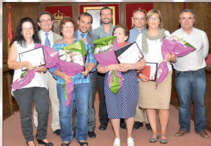
Las representantes de las cuatro asociaciones sanitarias, en primer plano; detrás, el alcalde junto a portavoces de los tres grupos municipales y el concejal de Fiestas

El día anterior, en el transcurso del Pleno Extraordinario celebrado en el Ayuntamiento para entregar la placa de Popular, el alcalde, Pablo Bellido, afirmaba que “con este reconocimiento se hace justicia”. “Los cuatro colectivos merecerían por sí solos el nombramiento”, afirmaba el alcalde tras