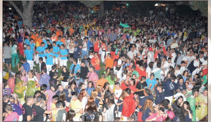
Vista de la plaza de La Constitución en la apertura oficial de las Fiestas, con el pregón y el chupinazo, el sábado 14 de septiembre