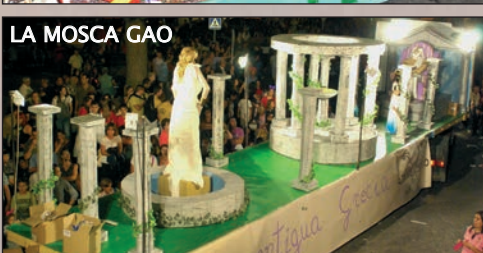
LA MOSCA GAO