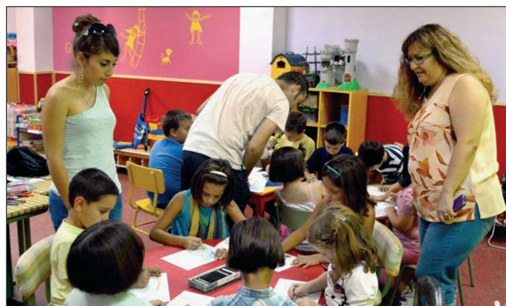
El Centro de Atención Integral a la Infancia organizó unas jornadas de puertas abiertas en la última semana de septiembre

Las actividades educativas se centran en el inglés y en el apoyo al estudio, mientras que el programa terapéutico