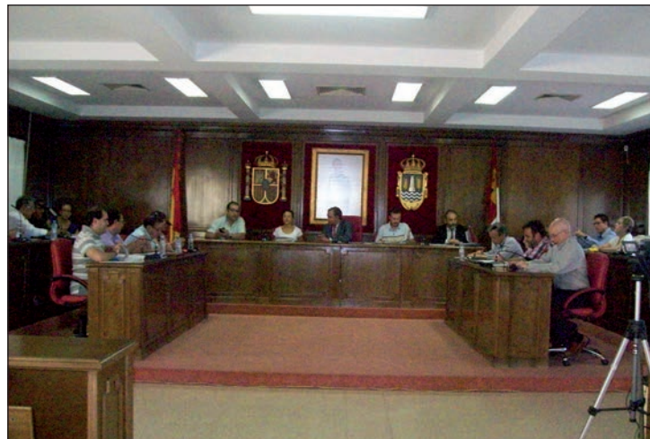
Un momento de la sesión plenaria celebrada el 26 de septiembre