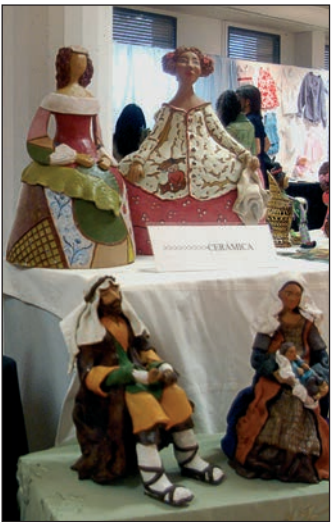
Primer plano de la muestra de final de curso del taller de Cerámica

a 11 y de 11 a 12 horas. Además, en Manualidades se ha abierto una lista de espera por si se produce alguna baja a lo largo del año. Las personas interesadas pueden informarse en la conserjería del propio centro. Precisamente, el taller de Manualidades, con 6 grupos de 9 alumnos cada uno, es el más numeroso, seguido de las sesiones de Gimnasia para Mayores, con 3 clases y 42 matriculados,