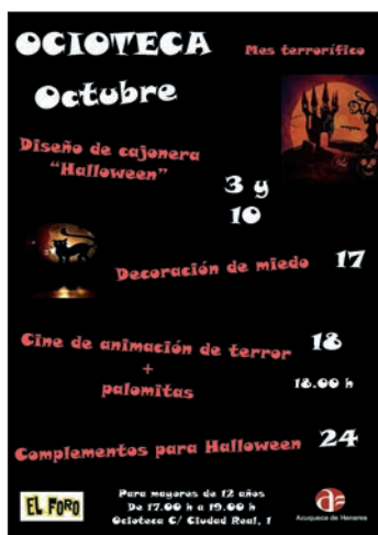
Cartel con las actividades

Como cierre de este mes temático, el 31 de octubre, coincidiendo con la celebración de Halloween , se organiza el pasaje 'Hotel Terror', que se podrá visitar entre las 17:30 y las 22:30 horas en El Foro. El precio es de 2 euros y las entradas se podrán