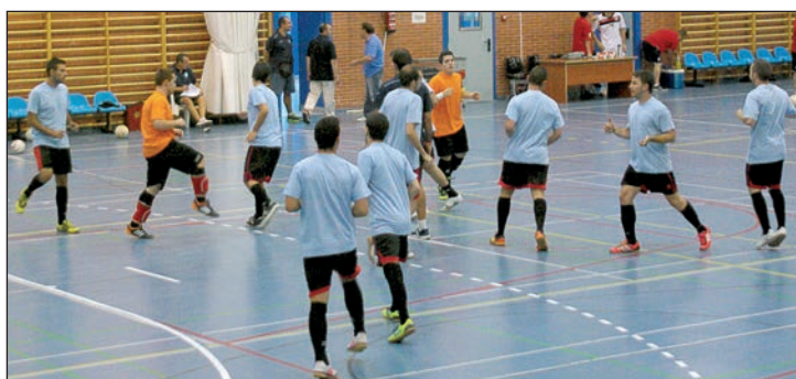
Calentamiento previo al partido del Memorial Kako, celebrado el 17 de septiembre

En cuanto a los equipos juveniles, está previsto que la liga comience el 13 de octubre, cuando el Azuqueca B recibe al Villanueva y el Azuqueca A viaja a Yunquera.