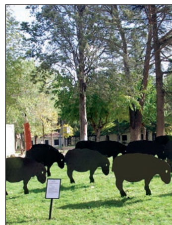
El parque de La Constitución acogió 'Black Sheeps', una de las intervenciones del año pasado

Hasta el viernes 18 de octubre, se mantiene abierto el plazo de presentación de los proyectos, que pueden