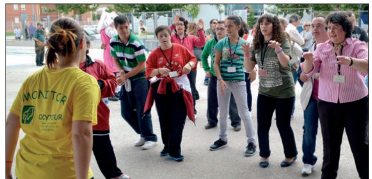
Arriba, un momento de la inauguración del Encuentro de Familias. Sobre estas líneas, actividades de ocio realizadas en el colegio Siglo XXI.

deben mucho dinero y hay compromisos imprescindibles que no se están cumpliendo, como la obra del segundo centro de salud. Pero hoy lo que quiero pedir es que el consejero exprese el compromiso de la Junta con ADA", señaló el alcalde, que añadió que "no recortar lo recortado no es suficiente. No se puede dar ni un paso atrás. Hay que ir a más".