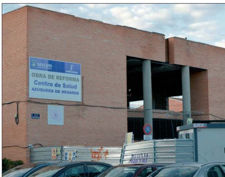
El alcalde de Azuqueca ha vuelto a exigir al Gobierno de Castilla-La Mancha que retome las obras del segundo Centro de Salud

Las jornadas se completaron con conferencias y charlas, así como con un programa de ocio y tiempo libre para el que el Ayuntamiento de Azuqueca puso a disposición de FEAPS distintos espacios municipales, como el colegio Siglo XXI o los equipamientos ambientales.