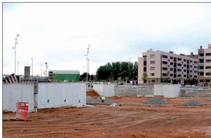
Imagen actual de las obras

Como en años anteriores, el Ayuntamiento ha previsto asimismo el funcionamiento de un equipo de megafonía para facilitar el seguimiento del responso que se celebrará el día 1 y de la misa de difuntos del día 2.