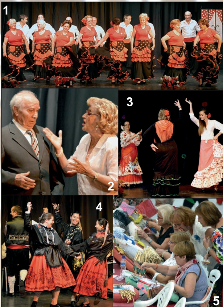
CITAS CULTURALES: 1.- Grupo rociero Nuevo Amanecer. 2.- El grupo de teatro de jubilados Nueva Ilusión representó 'Cuñado viene de cuña'. 3.- Actuación del grupo La Blanca Paloma. 4.- Grupo Folclórico Rondalla del Vallejo. 5.- II Encuentro Nacional de Bolillos.