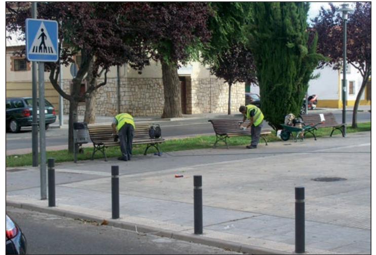
Trabajadores del Plan, pintando bancos en la plaza frente a la Casa de la Cultura

El Ayuntamiento de Azuqueca ha vuelto a pedir a la Junta de Comunidades de