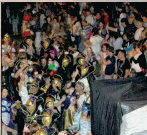
Público y peñistas en el Desfile de Carrozas en la plaza de La Constitución

El edil recuerda que “este equipo de gobierno ha optado por contener el gasto en Fiestas con el objetivo de impulsar medidas que ayuden a paliar la situación de las familias que peor lo están pasando en la localidad como, por ejemplo, el Plan de Empleo Municipal y el programa de apoyo nutricional en los colegios”. “Al PP no le gusta que se ahorre en la semana de Fiestas para no recortar en Servicios Sociales o políticas de Empleo durante el resto del año, porque este partido quiere hacer justo lo contrario”, concluye.