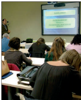
En el marco de este programa, se han progrado nueve jornadas formativas

En cuanto a la formación, está previsto que se impartan nueve sesiones. "Se abordarán aspectos que nos han planteado los propios jóvenes como, por ejemplo, demandas actuales del mercado de trabajo y perspectivas de futuro, trabajo en el extranjero y convalidación de títulos, búsqueda creativa de empleo, análisis de ideas de negocio y fuentes de financiación o la nueva ley de emprendimiento", avanza la