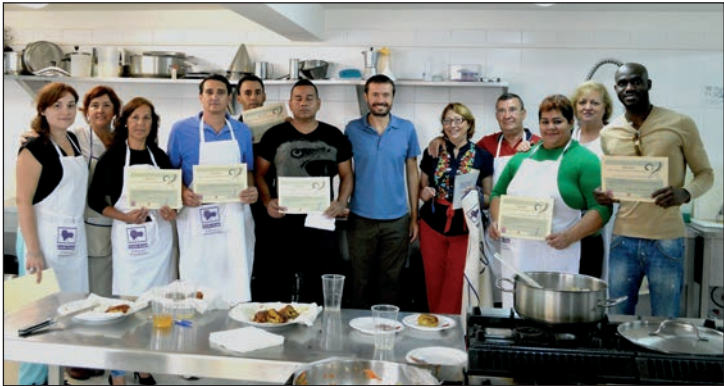
El concejal de Cohesión Social e Integración acudió a la clausura del curso de Cocina Internacional

aprendieron a preparar platos típicos, tanto salados como dulces, de Marruecos, Perú, Nigeria, Colombia y España, al tiempo que se explicaba su origen y sus posibles vinculaciones con celebraciones o tradiciones. “Más allá de las cuestiones ligadas a la gastronomía de manera directa, lo importante de ésta y de otras actividades interculturales es