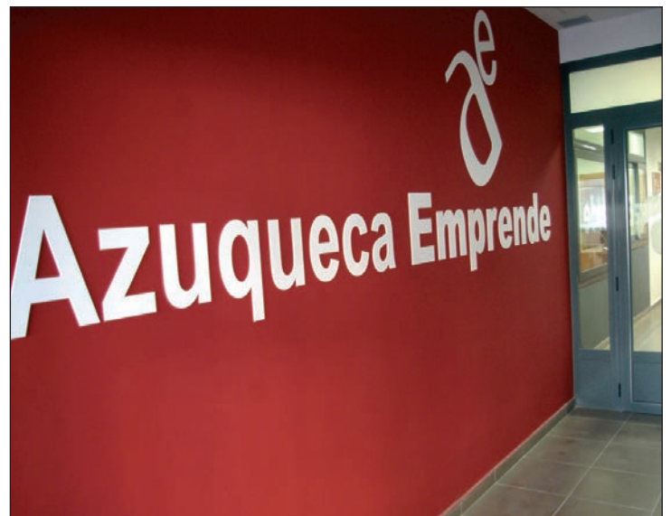
Imagen del acceso al Centro de Empresas de Azuqueca

Los interesados pueden formalizar su inscripción hasta el día 9, a través de la oficina virtual de la Consejería de Empleo y Economía de la Junta de Comunidades, que subvenciona el curso. Está previsto que la selección de los aspirantes se lleve a cabo el día 11 de octubre.