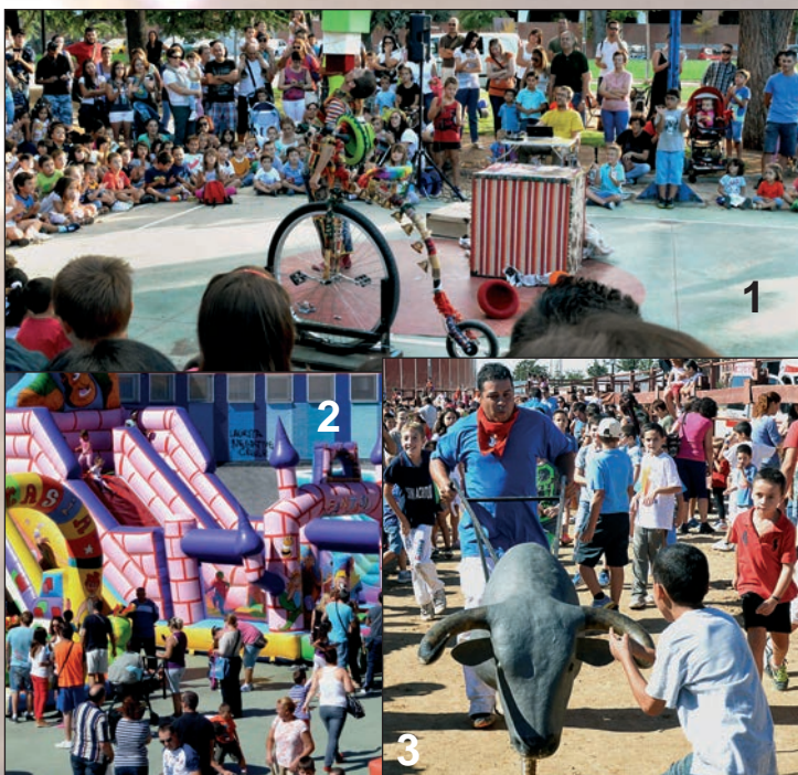
PROPUESTAS INFANTILES: 1.- Espectáculo L'Caja-Ja. 2.- Hinchables en El Foro. 3.- Encierro con carretones.