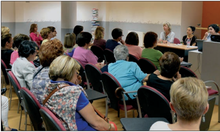
Un momento del acto de inauguración de la nueva temporada de los Clubes de Lectura de Azuqueca

Participan en ellos alrededor de 150 personas