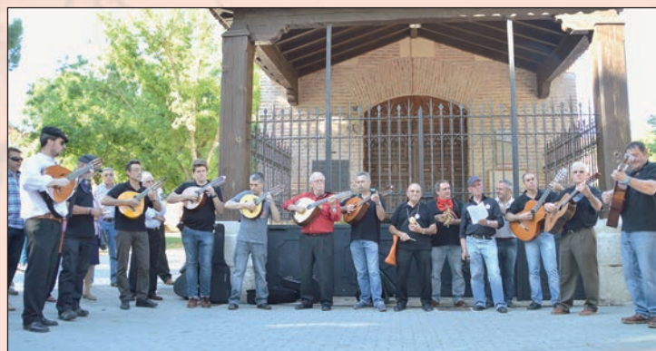
Integrantes de la Ronda frente a La Ermita, en las fiestas de San Isidro