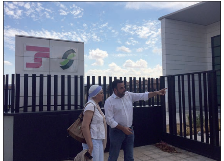
La diputada y el alcalde, junto al edificio construido por el INSS en la avenida de Meco