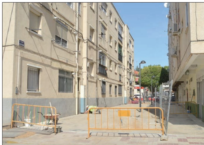
Estado de las obras, al cierre de esta edición de AZUCAHICA

La obra se ha aprovechado además para instalar un tramo nuevo del colector de recogida de aguas pluviales en la plaza y para sustituir la antigua conducción de agua potable, de fibrocemento, por una de polietileno, con el fin de reducir el riesgo de averías por rotura.