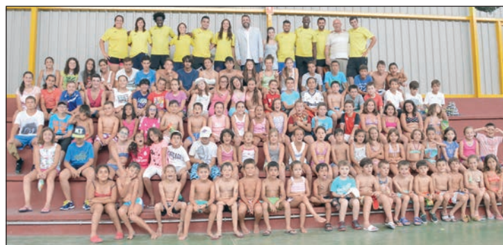
Foto de familia del Campus Multideporte de la primera quincena de julio con el alcalde y el concejal de Deportes

En cuanto a las actividades acuáticas, que se desarrollaron en la piscina climatizada, se inscribieron 460 personas. Los cursos intensivos de natación infan-