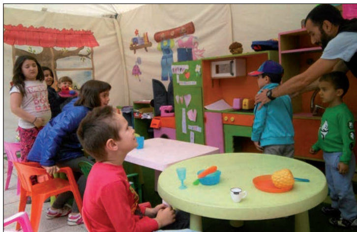
El 'Poblado de la Igualdad' ofrece distintas actividades dirigidas a los más pequeños.

"Los niños y niñas reflexionarán sobre la división del trabajo por sexos, sobre el reparto de las tareas domésticas y sobre los estereotipos transmitidos por los cuentos tradicionales y, por extensión, nos harán reflexionar a los mayores sobre estas cuestiones", sostiene Luque.