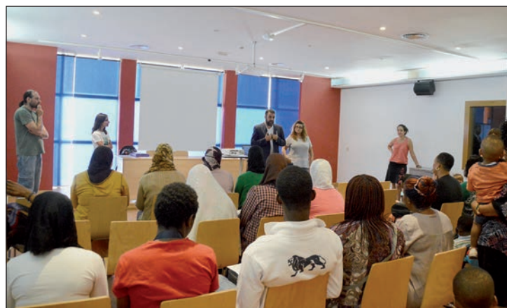
Acto de clausura del taller que ha impartido Guada Acoge

En la valoración de las solicitudes, se tendrá en cuenta que los colectivos formen parte del Registro Municipal de Asociaciones, el número de personas asociadas, la gratuidad de las actividades, la colaboración con otras asociaciones o con el Ayuntamiento en el último año, la participación en actividades organizadas por el Ayuntamiento para asociaciones, que sus actividades sean complementarias a la programación municipal y el hecho de que no dispongan de otros espacios. Además, el Ayuntamiento prioriza la cesión de uso a “las entidades cuyo fin primordial sea la igualdad de oportunidades, no discriminación, accesibilidad universal de las personas con discapacidad u otros proyectos de intervención social”.