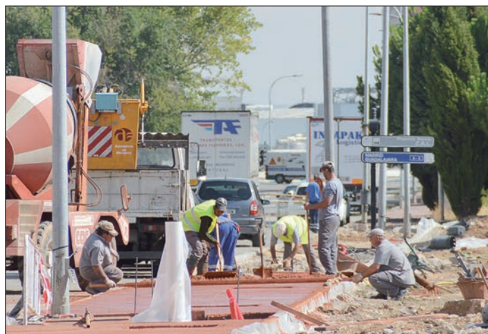
Operarios del Plan Municipal de Empleo, en una de las obras que se ha acometido este verano, en la avenida de la Industria

El primer edil ha destacado además que "los puestos de trabajo generados a través de esta iniciativa tienen consecuencias positivas