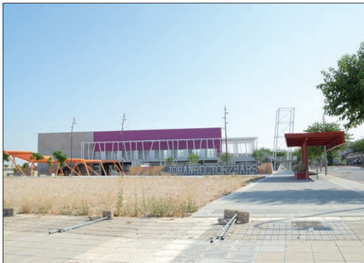
Parcela sobre la que se ha proyectado la construcción del restaurante, junto al Espacio Joven Europeo