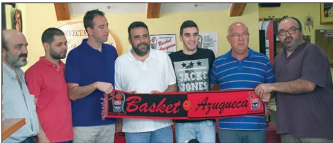
El alcalde y el concejal de Deportes mostraron su apoyo al Club Basket Azuqueca en una rueda de prensa celebrada en julio

El club, que este año cuenta con el apoyo de las empresas locales Chemo-Licons y Autocares Ricardo, entre otras, ha lanzado una nueva página web, www.cdazuqueca.es , para informar de la actualidad rojinegra.