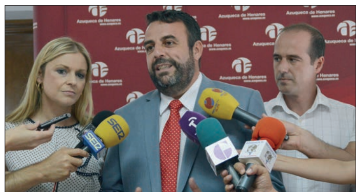
El alcalde, entre la consejera de Fomento y el delegado provincial de la Junta

“Considero que las acciones que ponga en marcha el Ayuntamiento han de ser las que determinen las organizaciones y profesionales que poseen el conocimiento técnico necesario para abordar acciones de ayuda y cooperación”, explicó el alcalde, “por eso, antes de poner en marcha cualquier tipo de iniciativa, he convocado a las asociaciones y ONG’s que trabajan con inmigrantes y refugiados para que sean quienes determinen las actuaciones más eficaces”.