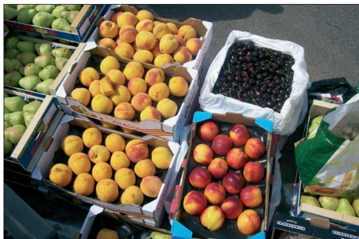
Fruta decomisada en el control realizado el 2 de septiembre

En los últimos operativos llevados a cabo, la Policía Local de Azuqueca ha localizado e identificado a varias personas que ofrecían sin la correspondiente licencia distintos productos que fueron decomisados. “La mayoría de las incautaciones se corresponde con alimentos perecederos, aunque también se ha retirado ropa falsificada, juguetes o pilas, entre otros materiales”,