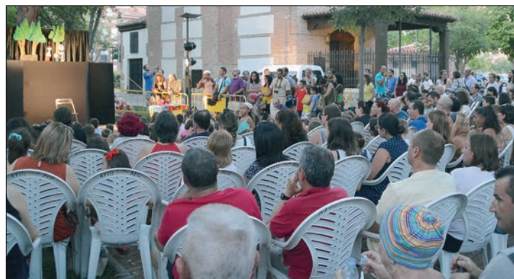
Público en la última función del festival, en el parque de La Ermita

Por otra parte, estos talleres van a arrancar durante la primera semana de octubre, a partir del lunes día 5.