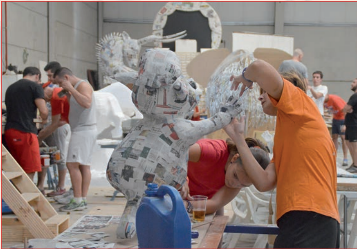
Peñistas trabajando en la preparación del que será el 40 Desfile de Carrozas de Azuqueca de Henares

Concurso fotográfico Coincidiendo con este 40 Desfile, se celebrará además la octava edición del concurso fotográfico convocado por el Ayuntamiento y la empresa Saint Gobain Isover. En esta ocasión, los premios se incrementan y serán de 500, 300 y 150 euros respectivamente, para los tres primeros clasificados (bases del concurso, en el programa de fiestas).