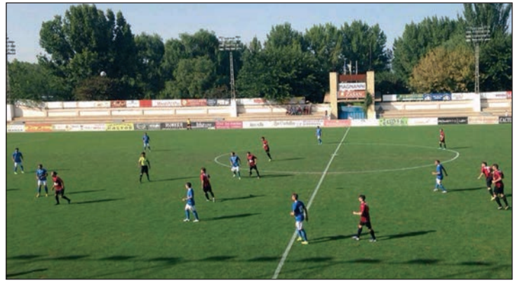
Imagen del partido en el que el CD Azuqueca se impuso 0-1 al Almansa

El club también ha lanzado su campaña de captación de socios. Se mantienen los precios de temporadas pasadas: 50 euros, el abono familiar (pareja) y 30 euros, el individual (a partir de 16 años). Hay descuentos para personas desempleadas, titulares de la Tarjeta Ciudadana y jubilados. La entrada es gratuita para personas con discapacidad y el alumnado de las Escuelas Municipales. Más información, en el polideportivo La Paz, de 20:30 a 22 horas.