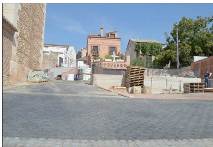
Dos perspectivas de los trabajos que se están ejecutando