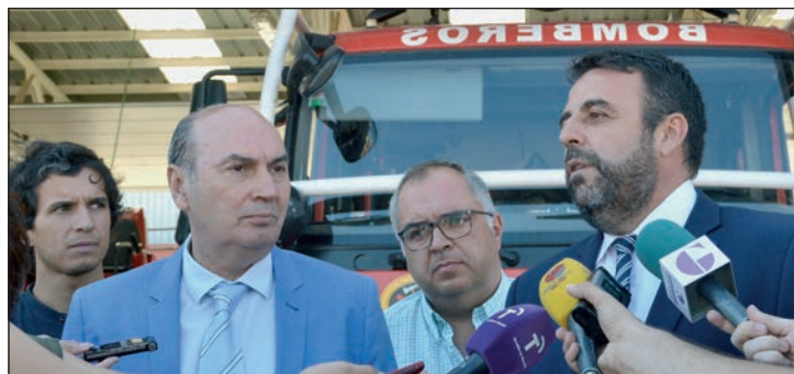
El alcalde y el presidente de la Diputación, en la atención a los medios