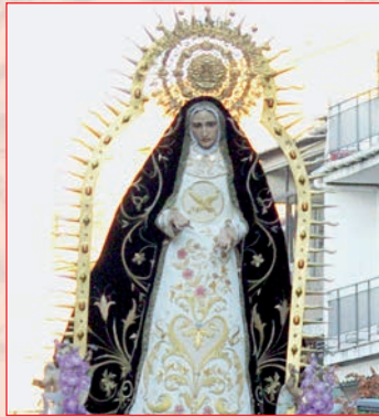
Imagen de la Virgen en una procesión el año pasado

El tercer sábado de septiembre, día 19, las peñas de Azuqueca de Henares acompañarán la imagen de la Virgen en la tradicional procesión desde la iglesia de San Miguel (salida a las 19 horas), hasta la de la Santa Cruz. Al día siguiente, a las 12, se celebrará la misa solemne en la Santa Cruz y por la tarde, a las 19 horas, se desarrollará la procesión desde la Santa Cruz a San Miguel.