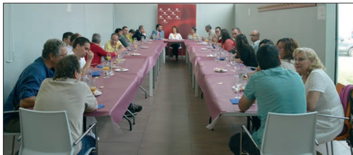
Un momento del desayuno que la consejera de Bienestar Social y el alcalde mantuvieron con la directiva, trabajadores y chicos de ADA

A continuación, la consejera de Bienestar Social se desplazó a El Foro para mantener una reunión con el área municipal de Servicios Sociales y, por último, se acercó a la empresa Isover.