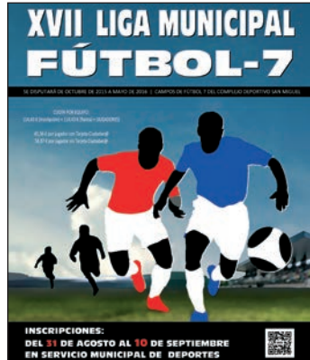
Cartel de la actividad

Está previsto que la competición, que se disputa en los campos del complejo