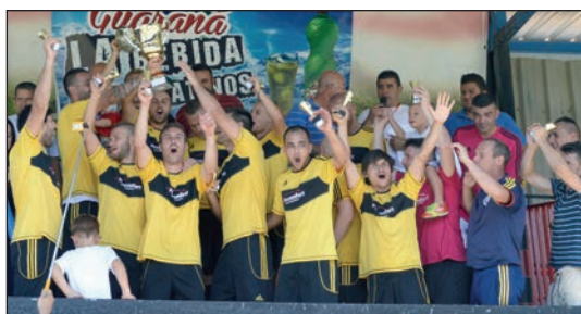
Arriba, la selección de Rumanía recogiendo la Copa como campeona del Mundialito y debajo, pasillo de los ganadores al equipo de Guinea Ecuatorial