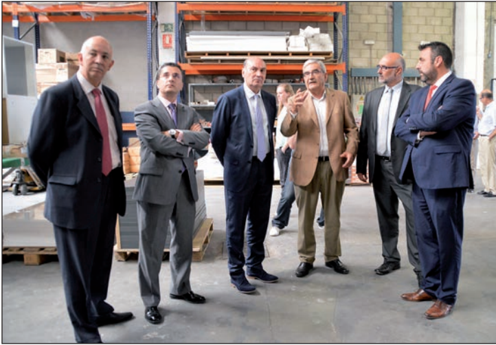
Un momento de la visita a las instalaciones de la empresa ABS (American Building System)

Durante su visita a la empresa local ABS junto al presidente de Diputación