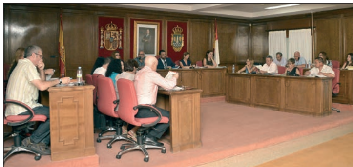
Un momento del Pleno celebrado el 30 de julio

En el apartado económico, el Pleno aprobó una modificación del anexo de Inversiones del presupuesto 2015 y una transferencia de crédito. Ambos puntos contaron con el apoyo de PSOE, PP, Ciudadanos-Partido de la Ciudadanía (C's) y Ganemos-PTE-Hartos.org, mientras