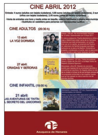
Cartelera del mes de abril

Las entradas se pueden adquirir el mismo día del pase, en la taquilla de la Casa de la Cultura, una hora y media antes del inicio, o bien, de manera anti-