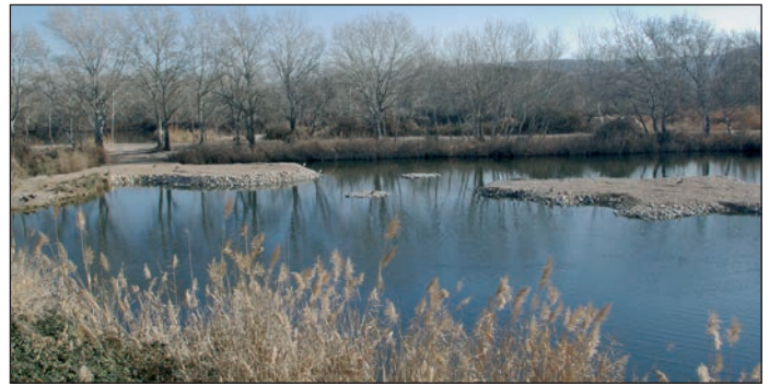
Vista de una de las lagunas de la Reserva Ornitológica Municipal

Estos ejemplares se suman a otro medio centenar de árboles que se han plantado en los últimos meses, en distintos puntos del municipio. "También se han retirado algunos árboles, en torno a una decena, que estaban enfermos o que provocaban problemas en conducciones o aceras", concluye el edil.