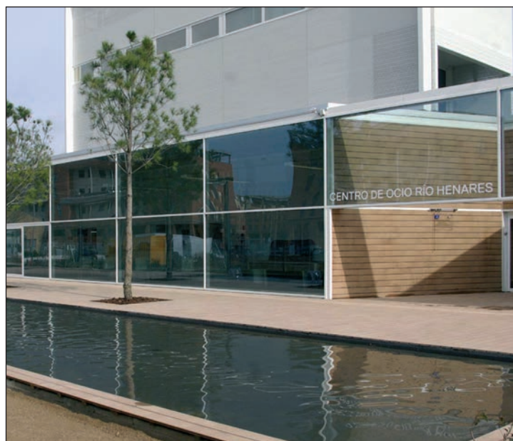
Exterior del Centro de Ocio 'Río Henares', que abrió sus puertas el 26 de marzo de 2011

El Centro, que suma una superficie de casi 1.600 metros cuadrados, centraliza la mayor parte de sus dependencias en la planta baja, para facilitar su accesibilidad. Por las distintas salas (de juegos, de billar, de internet, de prensa y el gimnasio) pasa cada día una media de 140 personas, a las que se suman distintas asociaciones y colectivos culturales o sociales que hacen uso de la instalación para celebrar sus