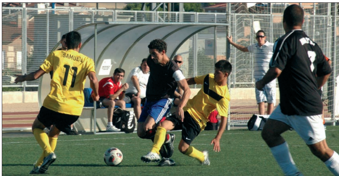
Liga Municipal de Fútbol 7 de Azuqueca de Henares

Desde hace trece años, goles, pasión, deportividad y buenos momentos se dan cita en los partidos de la Liga Municipal de Fútbol 7 que organiza el Ayuntamiento de Azuqueca de Henares cada fin de semana en el Complejo San Miguel. Esta temporada, se han inscrito más de mil jugadores, repartidos en 84 equipos y siete divisiones, pero todo empezó en 1999 con 270 personas, 21 equipos y una única división