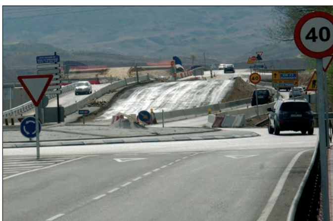
Estado de la obra en el enlace situado a la altura de la N320