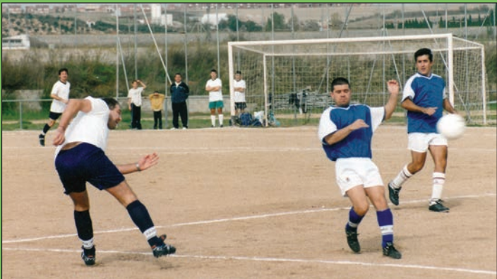
Una década separan estas imágenes. Arriba, un partido de la temporada 2000/2001 y debajo, de la edición de 2010/2011