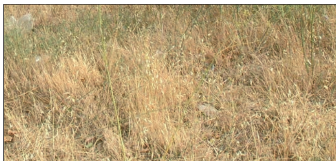
Esta medida pretende reducir el riesgo de incendio