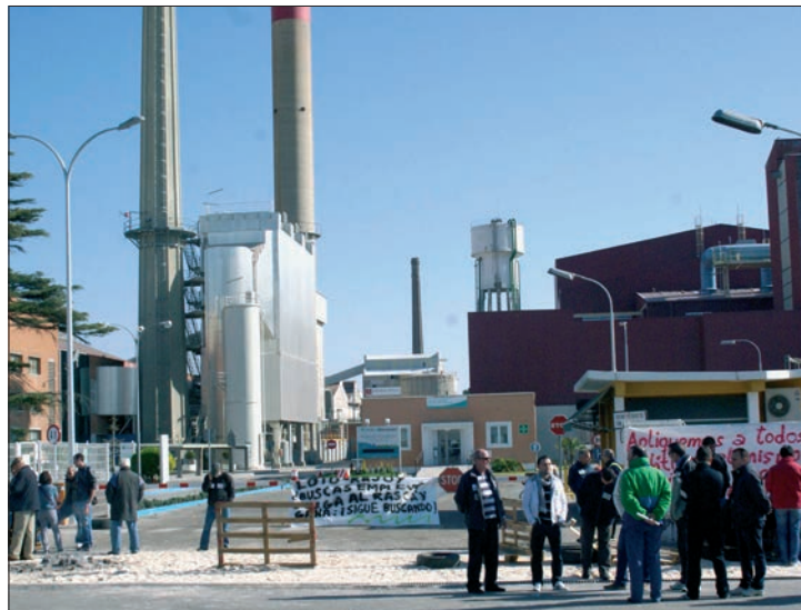
Piquetes informativos, en la jornada de huelga

Por la tarde, CC.OO y UGT convocaron una manifestación en Guadalajara, entre el Palacio del Infantado y la