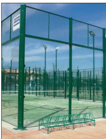
Pistas de pádel de la zona deportiva Arroyo del Vallejo

En este sentido, la segunda fase, que comenzó en enero y está previsto que finalice el 1 de abril, cuenta con 135 parejas repartidas en 18 grupos, incluido uno exclusivamente femenino, que se creó "a petición expresa de las jugadoras del