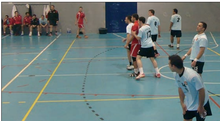
Un momento del partido entre el Almagro y el Club Deportivo Balonmano Azuqueca

Con un balance de 3 victorias, 1 empate y 8 derrotas