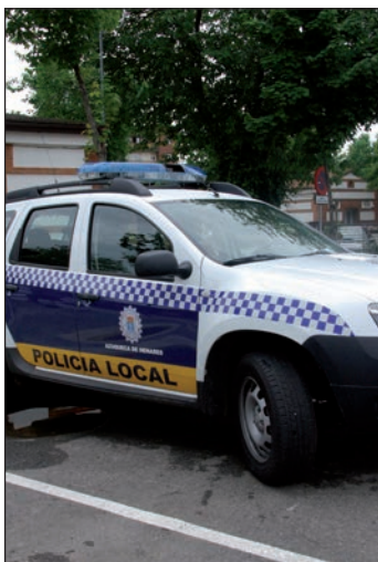
Vehículo de la Policía Local

La Ley sobre Tráfico, Circulación de Vehículos a Motor y Seguridad Vial establece como infracción grave,