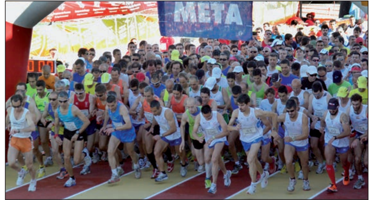
La Media Maratón tiene la salida y la meta en la pista de atletismo del Complejo Deportivo San Miguel

Como en años anteriores, "para un mejor y más rápido control de los tiempos, se va