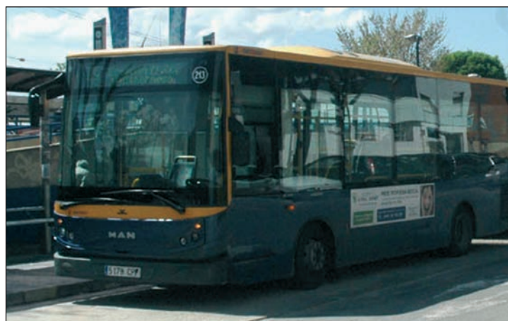
La modificación de las líneas entrará en vigor el día 16 de abril