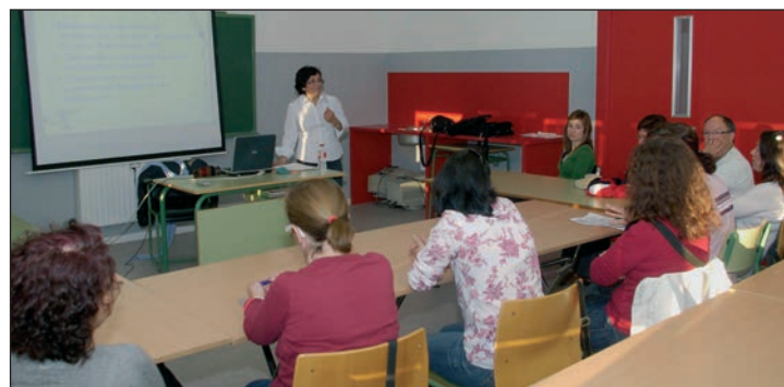
Imagen de una de las charlas impartidas en marzo