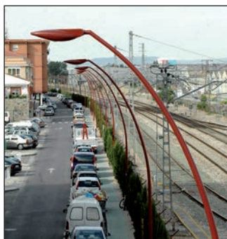
Farolas de la avenida del Ferrocarril