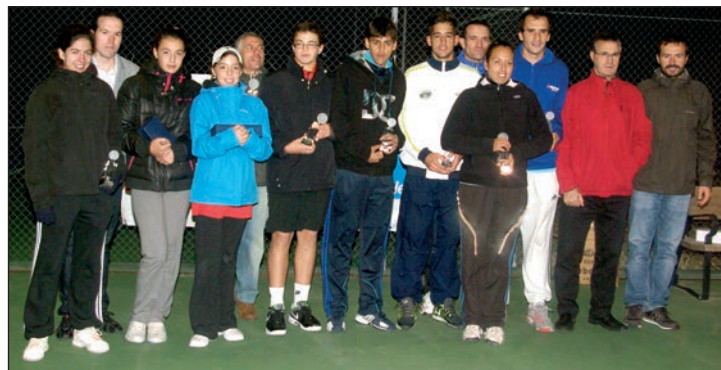
Finalistas de las diferentes categorías del Open de Otoño