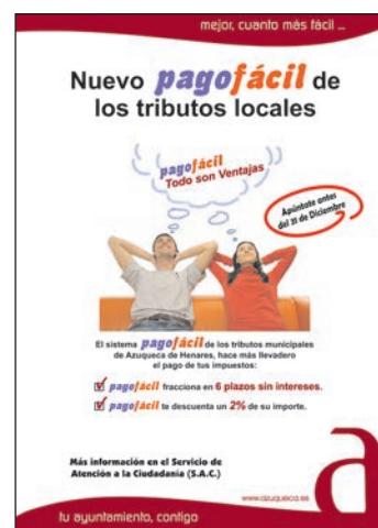
Cartel del pago fraccionado

Por otra parte, al cierre de esta edición de AZUCAHICA, estaba en marcha el procedimiento para adjudicar la colaboración con los servicios municipales en la recaudación ejecutiva. El concejal de Hacienda ha explicado que el objetivo es "incrementar los ingresos, mejorando el nivel de recaudación ejecutiva municipal, con un sistema que no supone ningún