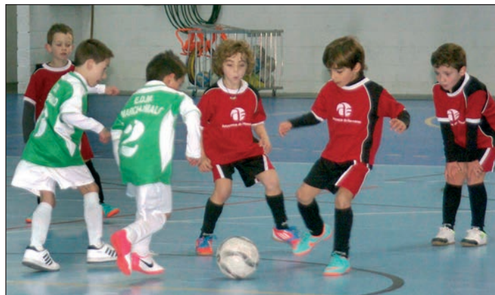
El pabellón Ciudad de Azuqueca acogió la segunda jornada de la liga 'Futuros Campeones'

'Futuros Campeones' suma un total de 20 equipos y, en el caso de Azuqueca, participan 49 alumnos de la Escuela Municipal de Fútbol Sala, repartidos en cuatro conjuntos -dos benjamines y dos prebenjamines-. Por categorías, en Benjamín compiten 12 equipos, en Prebenjamín, 6 y en Chupetín, 2.