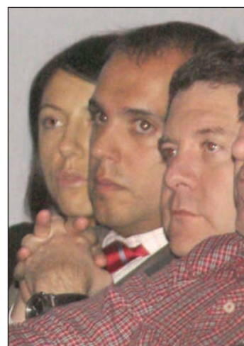
García-Page disfrutó junto al alcalde y la concejala de Cultura del concierto de Santa Cecilia.