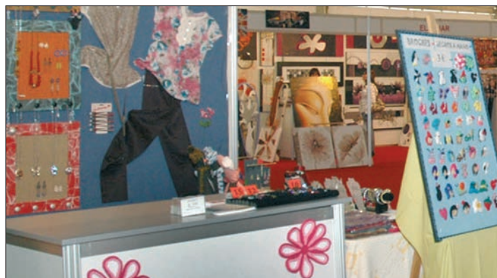
Los visitantes se van a encontrar con todo tipo de productos