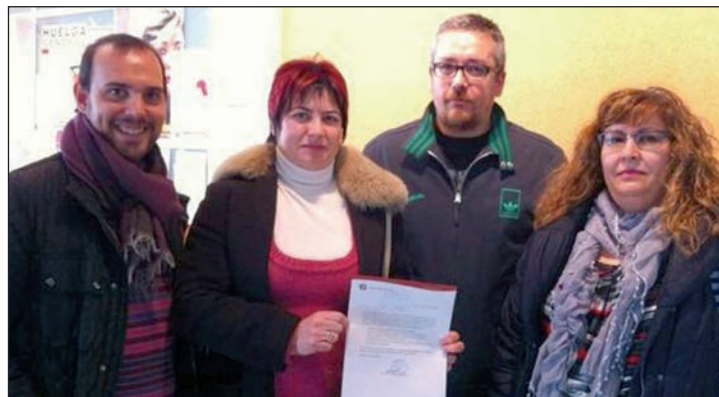
El alcalde estuvo acompañado por la concejala y dos representantes de la Plataforma contra los recortes en Educación

Lunes 17 de diciembre, 17 h., en el colegio Maestra Plácida Herranz. Los asistentes, hasta un máximo de 20, podrán conocer este método natural que proporciona relajación, bienestar y equilibrio.