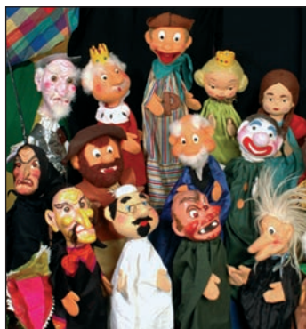
Títeres de la obra 'Peneque, el Valiente: la canción del pirata'

El programa cultural de diciembre se completa con la exposición 'Ojo digital' , que organiza la red social del mismo nombre para conmemorar su décimo aniversario. La muestra, que recoge obras de 54 aficionados a la fotografía, se puede visitar del 5 al 28 de diciembre.