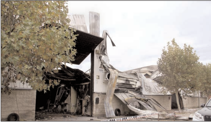
Las estructuras de las naves se vinieron abajo como consecuencia de las altas temperaturas