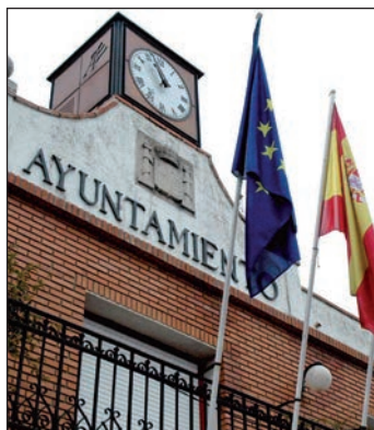
El Plan forma parte del proceso de Agenda 21 Local impulsado por el Ayuntamiento