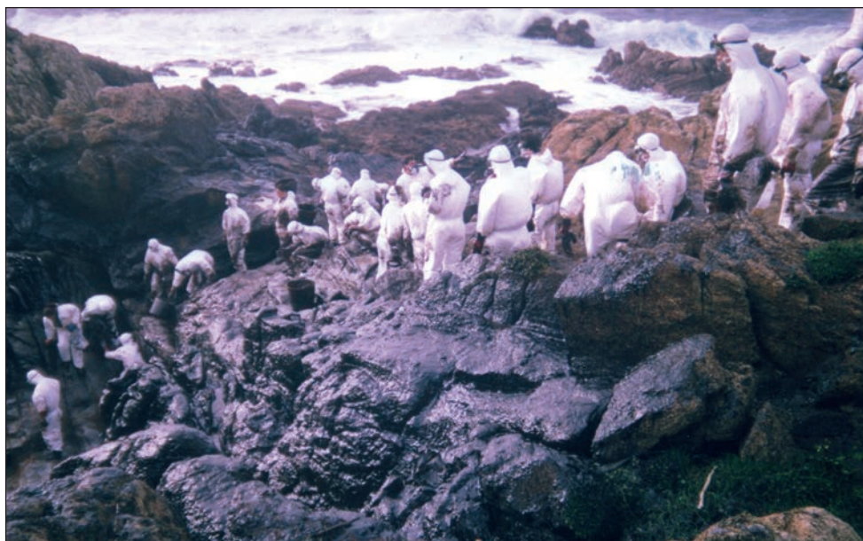
Las imágenes que acompañan a este reportaje, tomadas en 2002 en Corme, han sido cedidas por voluntarios azudenses que participaron en la limpieza de la costa

Cientos de anécdotas, miles de experiencias y un millón de recuerdos. Hace unos días, el 19 de noviembre, se reunieron en la Casa de la Cultura algunos de los voluntarios que viajaron a Galicia para colaborar en la limpieza de la costa tras el hundimiento del petrolero 'Prestige'. Ha pasado el tiempo, diez años, una década, dos lustros... pero eso no ha servido para borrar la memoria. Quienes viajaron a Galicia desde Azuqueca recuerdan la motivación que les hizo unirse a la marea blanca y la impotencia al ver el mar teñido de negro. Y siguen teniendo presente el grito de 'Nunca Mais'.