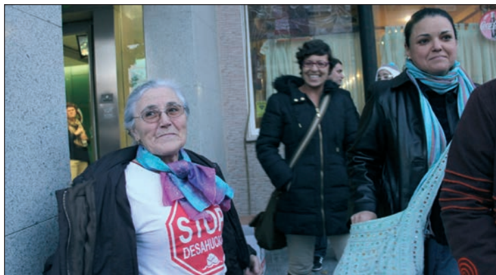
Imagen de una de las acciones de la PAH en Azuqueca

El Ayuntamiento cede ese espacio y aporta un servicio de atención jurídica a personas afectadas