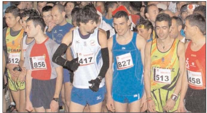
Momento de la salida de la San Silvestre Alcarreña de 2011

Los participantes podrán entregar alimentos no perecederos para el Banco de Alimentos