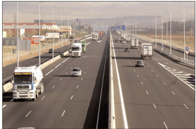
Imagen de la autovía con los tres carriles en cada sentido, tomada desde el nuevo puente a la altura de Tudor