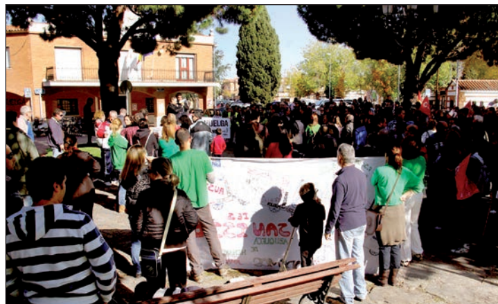
Concentración en la plaza de La Constitución el día de la huelga.

Sin embargo, según la Delegación del Gobierno en Castilla-La Mancha, los trabajadores del sector privado de la provincia de Guadalajara que secundaron la huelga fueron solo el seis por ciento del total y, según la misma fuente, en los ayuntamientos la media regional del seguimiento fue del 10,66 por ciento. No se ofrecieron datos particulari-