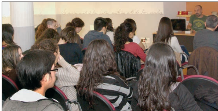
Las sesiones se impartieron en la Casa de la Cultura

Está prevista la celebración de una segunda edición