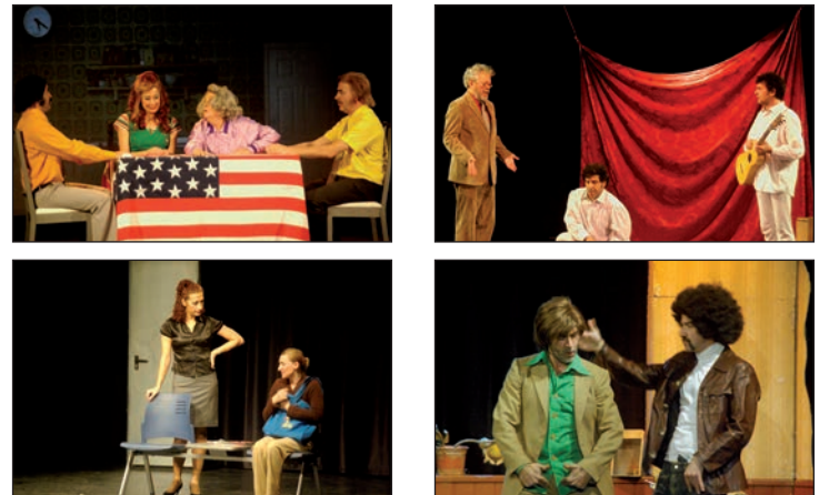
Imágenes de las representaciones 'Una comedia americana', 'Shakespeare para ignorantes' (arriba), 'Locas' y 'Qué pelo más guay', las cuatro incluidas en la XXIX Espiga de Oro

La responsable municipal de Cultura ha resaltado además de la edición de este año el programa 'Espibares', un ciclo de tres espectáculos de humor en otros tantos establecimientos hosteleros de Azuqueca. "Ha sido una experiencia nueva, que aporta un plus a la muestra, con espectáculos de índole bien distinta a los que se pueden ver en la Casa de la Cultura y para los que el Ayuntamiento ha contado con la colaboración de los bares participantes", valora Yagüe, que ha agradecido a los locales su apuesta por la Cultura.