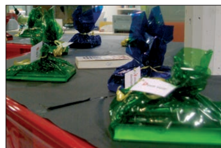
Lotes ofertados el año pasado

Para acabar, los más pequeños van a poder disfrutar el 3 de enero, a las 18 horas, de 'Samabá Samadé', un montaje que permite conocer la cultura africana a partir de su música y danza, así como de elementos visuales.