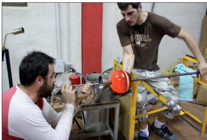
La elaboración artesanal de cada pieza de vidrio artístico que sale del Estudio Martín Rojas pasa por distintas fases. Arriba, dos imágenes tomadas en el taller. Debajo, dos de los hermanos Martín desarrollando en el horno una pieza mediante la técnica del soplado

entre dinero a este negocio es la cristalería en general, las mamparas de baño, la enmarcación. Eso es lo que posibilita la creación artística, algo que en realidad es una tarea romántica porque requiere de mucho esfuerzo y no te da de comer. A pesar de las dificultades, estamos teniendo mucha suerte, porque estamos exponiendo y moviendo nuestra obra en distintas galerías, en distintos países.