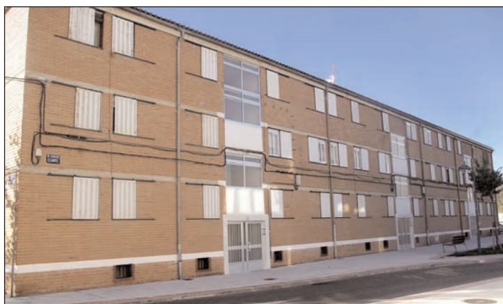
Inmueble de la calle Clavel incluido en el programa ARI

Se han cumplido los objetivos del convenio de 2010