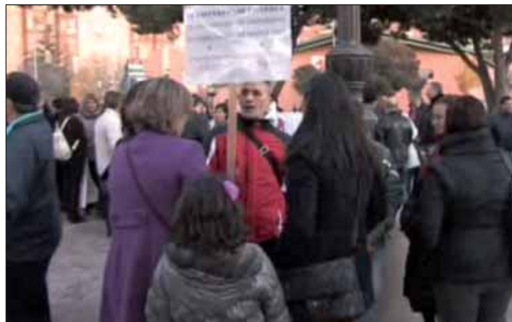
Trabajadores municipales se concentraron frente al Ayuntamiento el 15 de diciembre

los servicios a los que estaban vinculados. En Azuqueca, a diferencia de en la mayoría de lugares, el Ayuntamiento ofreció un ERTE (Expediente de Regulación Temporal de Empleo) en lugar de la extinción definitiva de contratos pero, por alguna razón que no alcanzo a entender, la representación sindical no estuvo de acuerdo desde el inicio”. El teniente de alcalde del área de Personal señala que la propuesta del Equipo de Gobierno “pensaba en los trabajadores y en los usuarios. En toda Castilla-La Mancha los empleados de competencia regional en una situación similar se manifestaron contra el Gobierno regional, pero en Azuqueca prefirieron hacerlo contra el Ayuntamiento, que era quien estaba buscando soluciones a pesar de no tener las competencias”. José Luis Blanco ha mostrado su satisfacción “porque finalmente se alcanzó un acuerdo”, aunque afirma no entender “las manifestaciones previas, porque la propuesta del Ayuntamiento fue la misma desde el primer momento”. De dicho acuerdo emanó un comunicado conjunto entre Ayuntamiento y trabajadores en el que se recoge textualmente la petición al Gobierno regional de