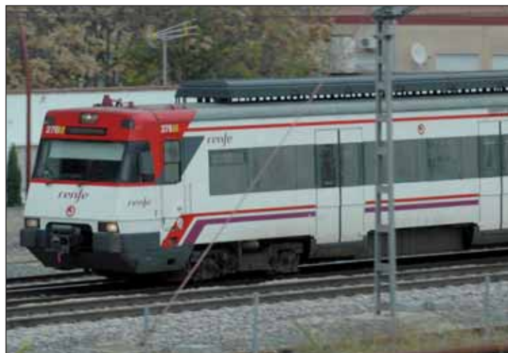
Imagen del tren de Cercanías a su paso por el municipio de Azuqueca de Henares

institucional en la que PSOE, PP e IU piden la renovación de los acuerdos entre Madrid y Castilla-La Mancha que posibilitan la utilización del abono y también que se aplique a Azuqueca de Henares la tarifa C2 del abono transporte por razones de kilometraje. El cambio supondría una rebaja de 10 euros en el abono mensual normal y de 14 euros en el joven.