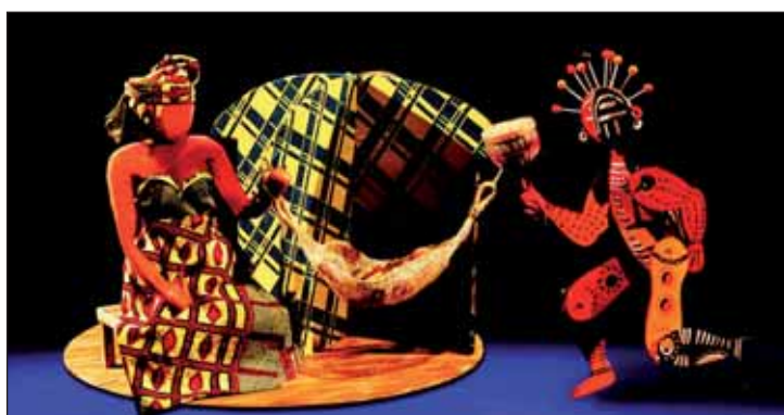
Los títeres de 'El niño que soñaba'

La Casa de Cultura contará también entre el 16 y el 30 de enero, con una exposición. La Asociación Cultural Foto-Flu mostrará una colección de fotografías, bajo el título 'Retratos', que se podrá visitar de lunes a sábado, en horario de 17 a 21 horas.