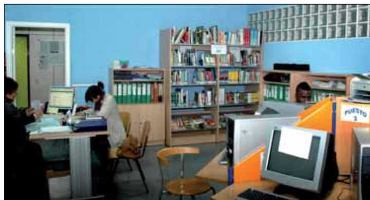
La Oficina Municipal de Información Juvenil, ubicada en El Foro.

La información disponible en la Oficina Municipal se traslada también a los institutos de Azuqueca, a través de los puntos de información juvenil. Para ello, el Ayuntamiento cuenta con la figura de los corresponsales juveniles, que