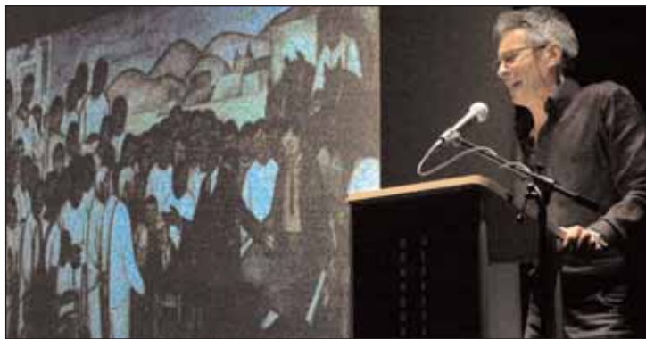
Imagen de la celebración del Paseo Poético, en noviembre de 2010