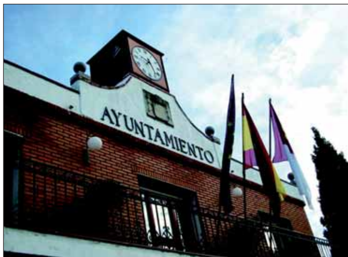
Imagen de archivo del Ayuntamiento de Azuqueca de Henares