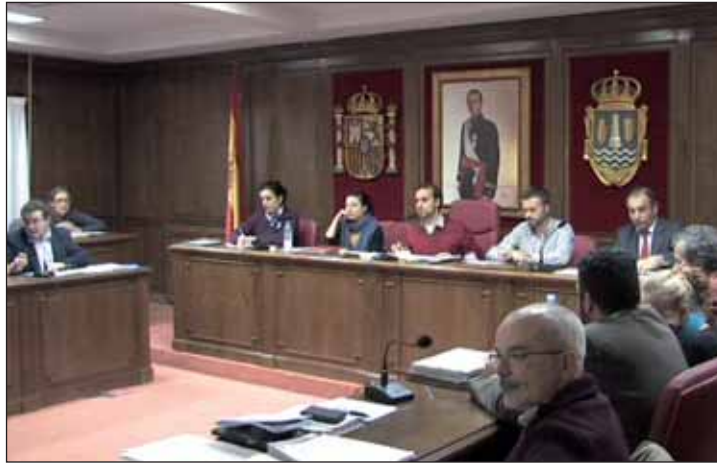
Un momento de la sesión plenaria del Ayuntamiento de Azuqueca de Henares celebrada el 15 de diciembre

La modificación de las tasas fue debatida y adoptada en el Pleno celebrado el 15 de diciembre. Se aprobó por unanimidad la tasa del servicio de ayuda a domicilio "ya