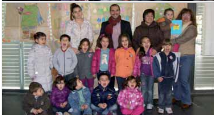
El alcalde y la concejala de Educación azudenses posaron con los alumnos del campamento en las fotos que los niños y niñas utilizaron para la actividad de elaboración de un calendario