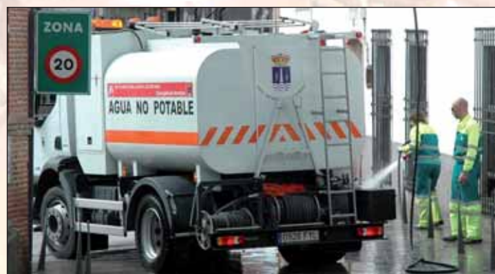
Imagen de archivo del camión municipal de baldeo en la plaza de General Vives

Además, las noches del 24 y 25 de diciembre, así como el día 31 de diciembre y 1 de