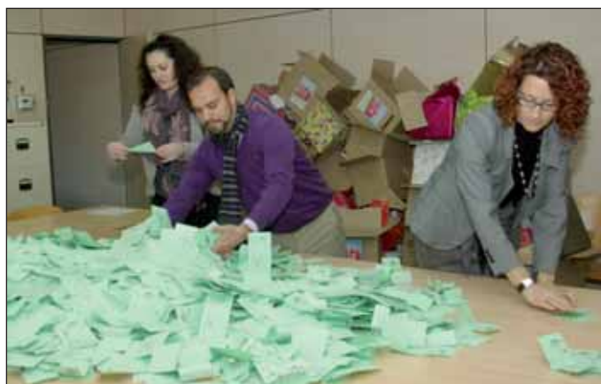
El alcalde, acompañado por la concejala de Desarrollo Económico, Industria y Comercio, y la representante de Fedeco, durante el sorteo celebrado el 10 de enero en El Foro

El personal de la residencia 'La Alameda' comienza a cobrar nóminas atrasadas. - El personal de la residencia 'La Alameda', de competencia regional y de gestión público-privada, decidió suspender los paros parciales convocados como consecuencia del impago de las nóminas, después de cobrar el mes de noviembre. Aunque quedan por abonar las pagas extra de verano y Navidad, la plantilla no continuó con la protesta "en señal de buena voluntad", según el comunicado remitido por el sindicato UGT. En este centro trabajan 72 personas, en su mayoría mujeres, y el número de usuarios se sitúa en unos 120, a los que hay que unir otros 20 más del Centro de Día.