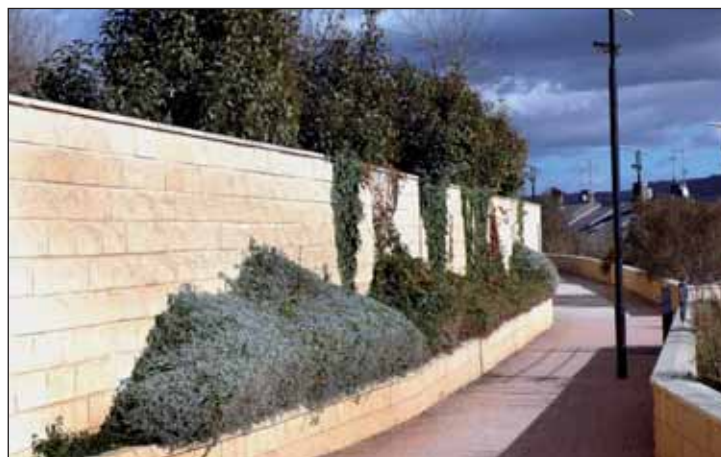
Imagen del paseo del Lavadero

Con los 10 nuevos agentes, serán ya 42 los policías locales con los que cuenta Azuqueca, algo que la concejala de Seguridad Ciudadana, Sagrario Bravo, valora "muy positivamente, ya que supone un incremento muy sustancial de la plantilla que redundará en un mejor servicio al ciudadano".