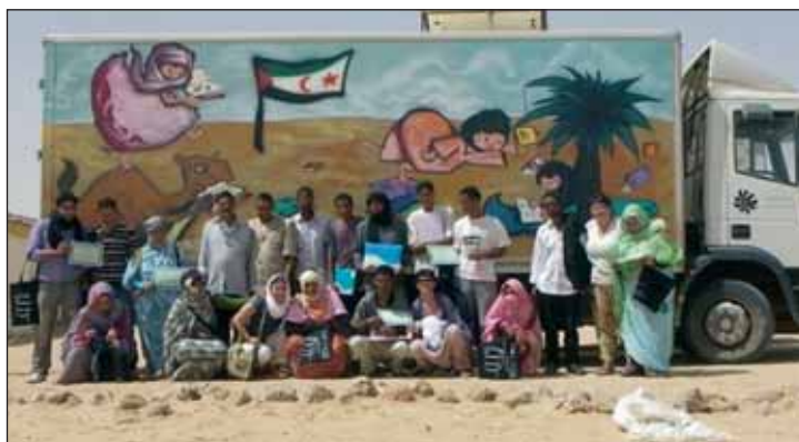
Imagen del bibliobús del proyecto 'Bubisher'.

El proyecto Bubisher cuenta con una página web ( www.bubisher.com ) donde se informa de los avances de la iniciativa y de la intención de seguir abriendo bibliotecas y llevando el bibliobús itinerante a otros campamentos de refugiados.