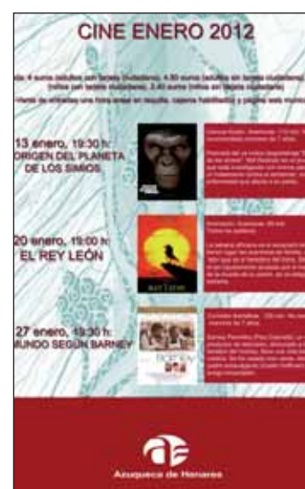
Cartel de la programación de cine de enero

'PROYECTO BUBISHER', La asociación 'Escritores por el Sáhara. Bubisher' presenta el viernes 27 de enero a las 18 horas esta iniciativa con la que han acercado la lectura a distintas comunidades del Sáhara. Durante el acto, el Ayuntamiento entregará el dinero recaudado en el mercadillo solidario de libros de Navidad.