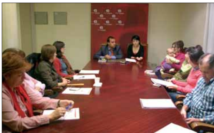
Acto de constitución del Consejo Municipal de Igualdad, celebrado en noviembre

Según marca el reglamento, aprobado por unanimidad en el Pleno de diciembre, el Consejo está compuesto por un representante político de cada grupo municipal del Ayuntamiento, así como de los sindicatos CC.OO. y UGT, las organizaciones empresariales, el sector educativo, y varias asociaciones azuden- ses que trabajan, directa o indirectamente, en el ámbito de la Igualdad de género, en concreto, ACCEM, AERFA, AMIDA, AMSYD, DiDeSUR, Lactavida y Equilibra, así como por tres personas inde-