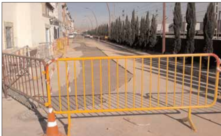
El tramo del colector sustituido en la avenida del Ferrocarril tiene 40 metros de longitud

Mientras se ejecutan los trabajos en el colector, la circulación por la avenida del Ferrocarril permanecerá desviada en el tramo comprendido entre las calles Pobos y Libertad. Como alternativa, los coches que circulen por la avenida del Ferrocarril pueden continuar por la calle Ciudad Real y el Bulevar de las Acacias.