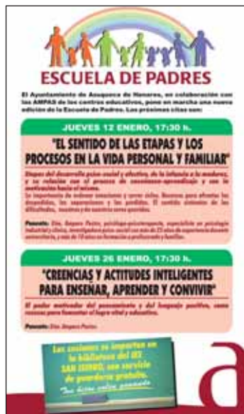
Cartel de la Escuela de Padres