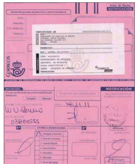
Acuse de recibo de la última carta enviada a la presidenta de CLM solicitándole una reunión.

todos los alcaldes que piden reunirse conmigo los recibo”. Bellido respondió a las afirmaciones haciendo públicas las cartas enviadas y los acuses de recibo de las mismas y afirmó que “además de intentar el contacto telefónico, le he enviado tres cartas a ella y a los consejeros y consejeras de su Gobierno, pero la respuesta siempre ha sido la misma: el silencio. Espero, de verdad, que la situación cambie”. El alcalde azuquense ha recordado también que los portavoces de los tres grupos municipales -PSOE, PP e IU- suscribieron junto a él “una carta en la que le pedíamos a Cospedal respuestas y el mantenimiento de servicios básicos para los ciudadanos”.