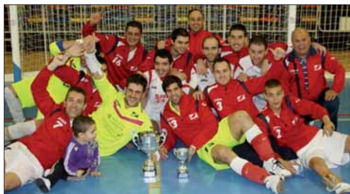
Los jugadores del Sepicat FS Sepiolsa posan con la Supercopa