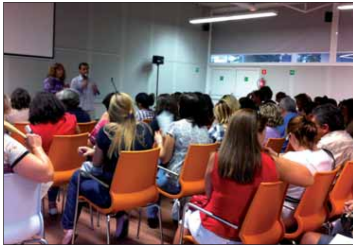
El alcalde y la concejala de Educación durante la reunión con los alumnos.

En dicha reunión, el alcalde de Azuqueca, Pablo Bellido, expuso lo que suponía la retirada del apoyo económico del Gobierno regional: “la enseñanza de idiomas es competencia de la Junta, que es la administración a la que el Estado le otorga el dinero necesario para prestar el servicio. El Ayuntamiento no puede asumir los servicios que otras administraciones dejan de prestar, porque eso