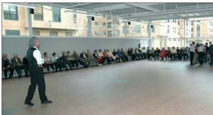
El salón de actos recibe luz natural a través de las cristaleras y dispone de una superficie de 350 metros cuadrados