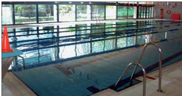
Interior de la Piscina Climatizada, ubicada en la calle Zurbarán, 1

El curso de las actividades acuáticas empieza el 10 de octubre