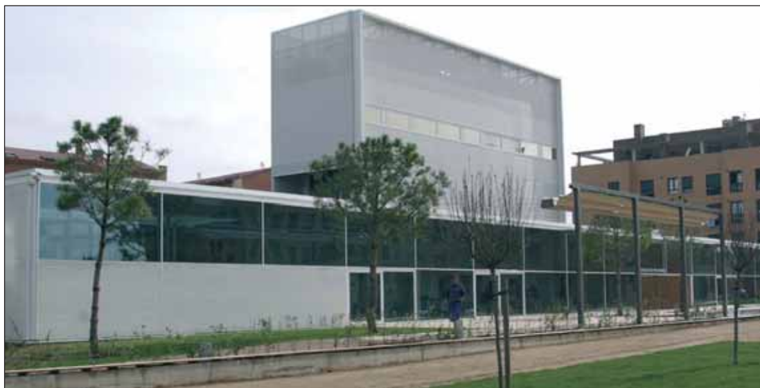
Fachada principal del Centro de Ocio 'Río Henares'

Con el nuevo curso, el Centro de Ocio Río Henares abre a los usuarios la sala de ordenadores, y programa nuevas actividades de temporada