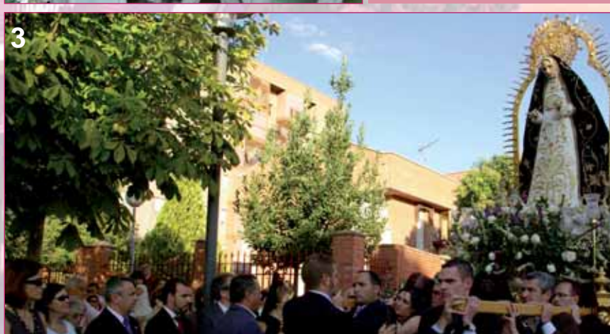
Actos religiosos: 1.- Las peñas acompañaron a la Virgen de la Soledad en la procesión entre las iglesias de San Miguel y la Santa Cruz. 2.- Momento de las ofrendas a la Virgen durante la Misa Solemne. 3.- Salida de la Virgen de la iglesia de la Santa Cruz, camino de la de San Miguel.