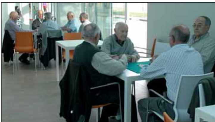
Algunos usuarios disfrutan de la sala destinada a los juegos de mesa, que comunica con la cafetería

amplia cristalera y patios interiores que permiten aprovechar la luz natural al máximo. También cuenta con placas solares para la obtención del agua caliente sanitaria y una cubierta ecológica.