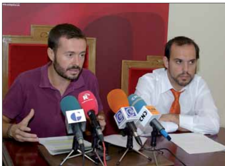
El portavoz del equipo de Gobierno, a la izquierda, junto al alcalde de Azuqueca, en una rueda de prensa reciente

En materia de Educación e infancia, el portavoz del Gobierno municipal ha destacado la inversión de más de 100.000 euros en obras de mejora de los centros educativos o el desarrollo de programas de atención a la infancia durante el periodo estival.