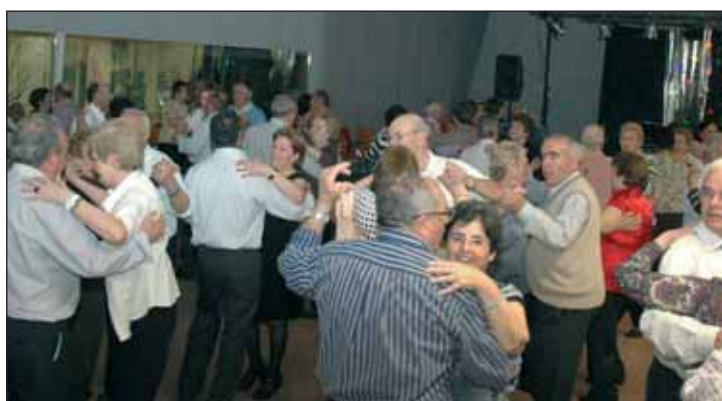
El edificio tiene sobre la planta baja un techo ecológico, que hace las veces de aislante natural