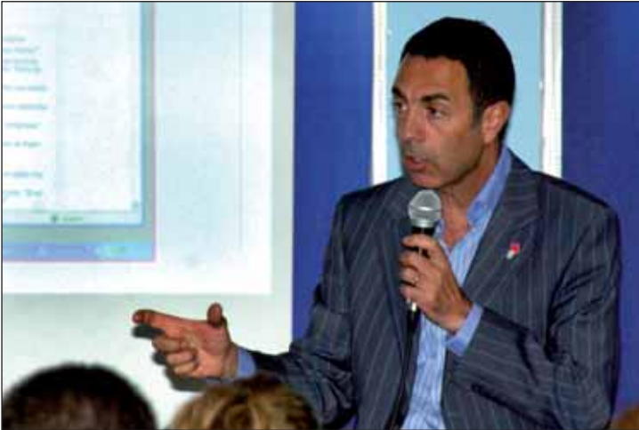
El delegado del Gobierno para la Violencia de Género estuvo acompañado por el alcalde y la subdelegada del Gobierno en la provincia