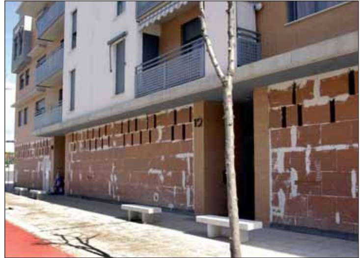
El local destinado a Centro de Empresas se ubica en la avenida de Los Escritores y dispone de 700 metros cuadrados.

Empresas de Azuqueca contempla la creación de nueve oficinas de 13,50 metros cuadrados equipadas con mobiliario y conexión ADSL, una sala de reuniones y otra de formación, y un salón de actos.