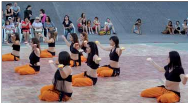
Como fin de curso, los alumnos participan en una muestra. En la imagen, actuación del taller de danza de vientre del pasado mes de junio

zado, se admiten nuevas incorporaciones en el grupo de iniciación de funky y en el taller de batería, donde que-