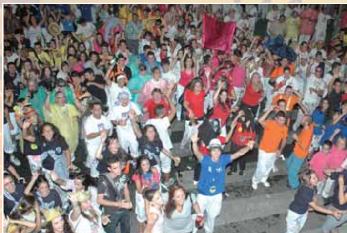
Arriba, los peñistas momentos antes del inicio de las Fiestas. Bajo estas líneas, a la izquierda el alcalde y el concejal de Fiestas durante el pregón, y a la derecha las pregoneras de este año

Sobre la Feria Taurina, el concejal de Fiestas destacó que, este año, “ha combinado calidad y entretenimiento a partes iguales”. En este sentido, el edil apuntó que entre las 4 novilladas se cortaron 15 orejas y un rabo, al tiempo que destacó la última novilla-