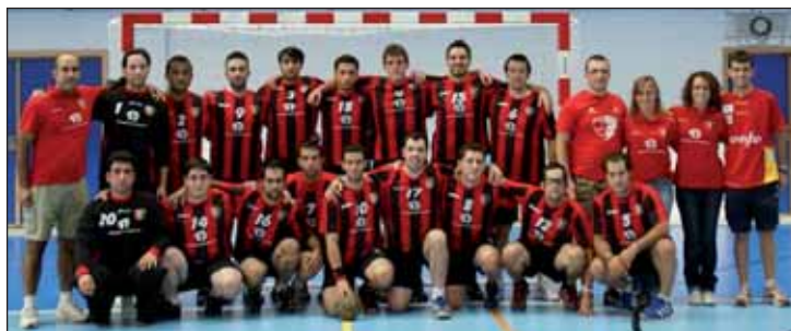
Equipo Sénior del CD BM Azuqueca

En septiembre, los locales jugaron un partido de preparación con el Madrideo, de una categoría superior, y perdieron 18-25.