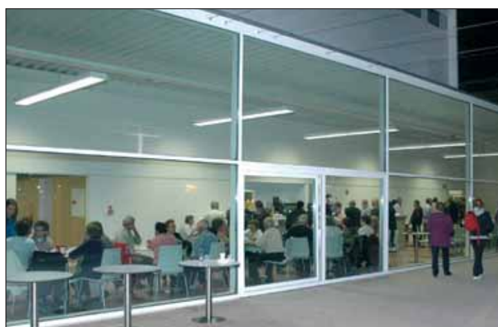
La cafetería restaurante cuenta con una terraza en el exterior

Entre las novedades, está prevista la apertura de la sala de internet, equipada con cuatro equipos. "Los usuarios podrán utilizar libremente los ordenadores de consulta y navegar por la red", apunta el concejal. La sala funcionará durante el horario de apertura del centro: de lunes a domingo de 8 a 22 horas. "El centro no cierra durante la semana y además tiene un horario muy amplio, para el disfrute de todos los usuarios", añade el responsable municipal del área de Mayores.