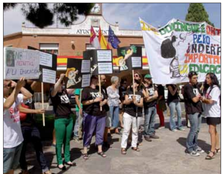
Algunos de los docentes durante la concentración contra los recortes.

Junto a los profesores, representantes de las tres AMPAS de los institutos de Azuqueca, padres y madres a título individual y alumnos asistían a la concentración con una camiseta que decía “S.O.S. Educación”. A la pro-