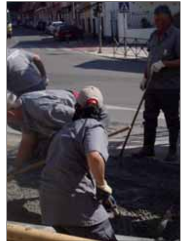
Imagen de archivo de trabajadores de anteriores ediciones de la Acción Local

Los 168 trabajadores contratados se han incorporado en tres fases. El primer proceso de selección se abrió entre el 16 de febrero y el 4 de marzo, con 94 personas contratadas. La segunda fase se abrió entre el 8 y el 17 de junio, y en ella se contrató a 41 trabajadores. Los 16 trabajadores que restan, fueron seleccionados entre el 8 y el 20 de septiembre, y trabajarán en los proyectos asignados hasta final de año. "En función del proyecto, se han ofrecido contratos de tres o