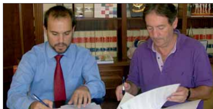
En las imágenes, momento de la firma de los convenios de colaboración con la Asociación de Padres de Discapacitados (arriba) y con la Fundación Proyecto Hombre (debajo).

personas con distintas patologías dentro del programa de atención a drogodependientes, gestiona un centro