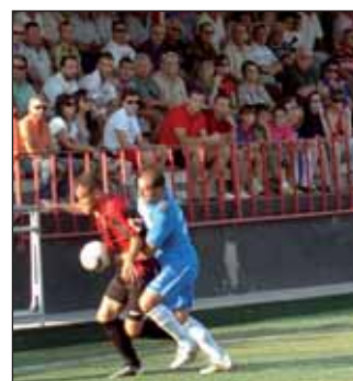
Las gradas del San Miguel se llenan para ver al CD Azuqueca

Al margen de la liga, el 29 de septiembre se disputó el II Trofeo Diputación de Fútbol, donde jugaron los locales, el Marchamalo, que también juega en Tercera División, y el De-