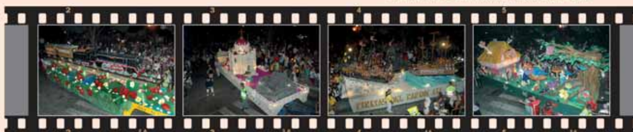
EL TREBOL Segundo Premio