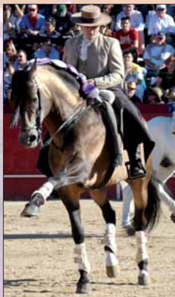
Las entradas para asistir al festival de danza ecuestre se podrán comprar el mismo día 24 en la plaza de toros

El resto del cartel se completa con cuatro novilladas, una corrida de rejones, el concurso de recortadores, ocho encierros -uno de ellos, en la tarde del miércoles-, y tres sueltas de vaquillas en la madrugada del lunes 19, martes 20 y jueves 22 de septiembre. "Además, los más pequeños también podrán correr su particular