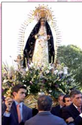
Un momento de la procesión del año pasado

El lunes día 19 habrá dos nuevas citas. En concreto, a las 11:30 horas se oficiará la misa solemne de difuntos en la iglesia de San Miguel y, a continuación, a partir de las 12:30 horas, se