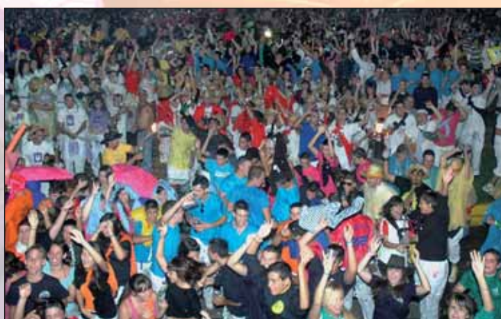
El pregón de fiestas y el posterior chupinazo desde el balcón del Ayuntamiento convoca a un gran número de vecinos

El pregón y el posterior chupinazo desde el balcón del Ayuntamiento abrirán de