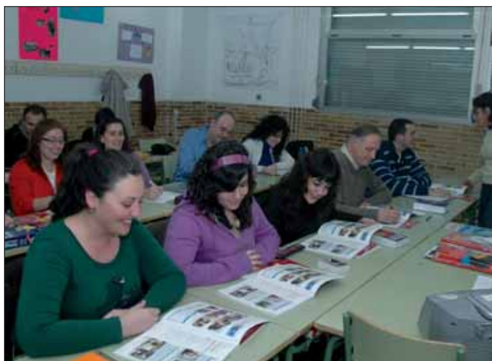
La Escuela Municipal de Idiomas se ubica en las dependencias del Instituto Profesor Domínguez Ortiz

La responsable azudense de Educación ha recordado que la Escuela Municipal de Idiomas de Azuqueca entró en funcionamiento en el año 2010, gracias a un acuerdo de financiación en virtud del cual el Gobierno regional aportaba 60.000 euros al año. "Desde el Ayuntamiento vamos a hacer todo lo posible por mantener este servicio