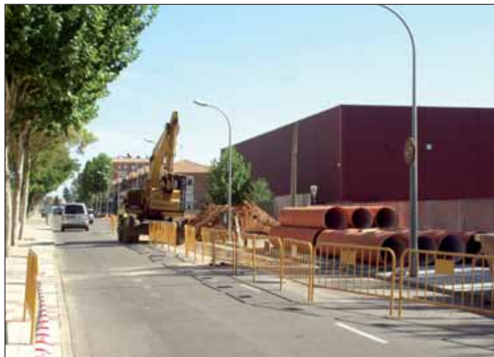
Obras del desdoblamiento del colector a la altura de la calle Poeta Manuel Martínez.