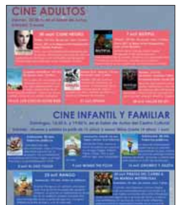
Detalle del cartel con las próximas proyecciones de cine

La cinta ' Cisne negro ' será la encargada de abrir el 30 de septiembre este ciclo dentro de la cartelera para adultos, con pases los viernes a las 20:30 horas. La oferta se completa con ' Biutiful ' (7 de octubre), ' Los chicos están bien ' (día 14), ' Ispansi ' (día 21) y ' Valor de Ley ' (día 28).