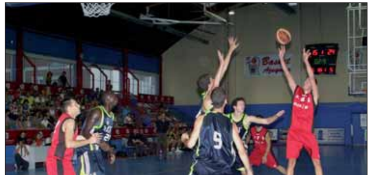
Imagen del amistoso celebrado el 24 de agosto entre el Alza Basket Azuqueca y el Real Madrid EBA y que ganaron los locales 66-63