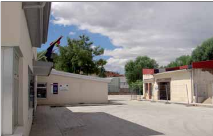
El edificio exterior del Centro de Adultos Clara Campoamor comenzará el curso totalmente reformado