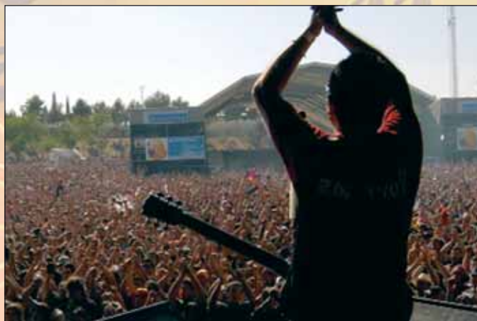
Cartel promocional de la página web del grupo Porretas

Por otra parte, el sábado 24, a las 20 horas, el grupo de teatro de jubilados de Azuqueca de Henares 'Nueva Ilusión', pondrá en escena la obra 'Un drama en el quinto pino', original de Tono y Manzanos, en la Casa de la Cultura. Las entradas costarán 2 euros y se podrán adquirir una hora antes en taquilla.