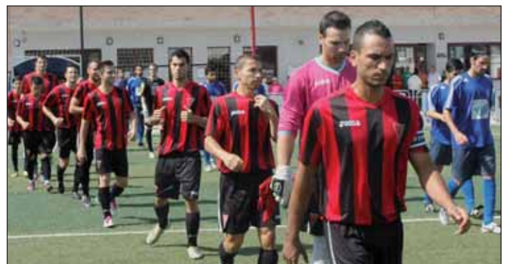
Los jugadores rojinegros saltan al campo del San Miguel en el primer partido de la liga ante el Torrijos (0-1)