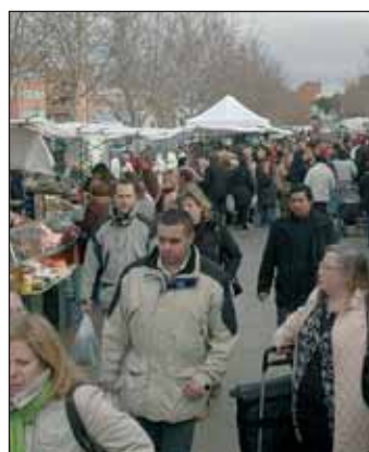
Imagen de archivo del mercadillo semanal de Azuqueca

El último mercadillo antes de las Fiestas será el día 7 y, después, se volverá a montar a partir del miércoles 28.