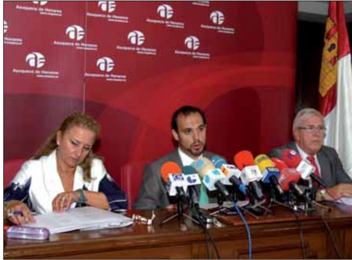
La subdelegada del Gobierno, el alcalde de Azuqueca, y el director provincial del INSS ofrecieron los detalles del nuevo servicio

La subdelegada del Gobierno especificó que el nuevo servicio tendrá las mismas funciones que la oficina de Guadalajara, en su doble vertiente como Oficina del Instituto Nacional de la