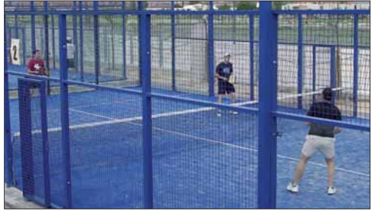
Como novedad de esta temporada, a las clases de pádel para adultos se suman sesiones para niños a partir de la categoría infantil