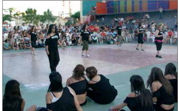
Exhibición de fin de curso del taller de funky

La edil recuerda que durante el verano, "no ha cesado la actividad de los grupos en las salas de ensayo, ni tampoco en la OMIJ, que mantiene su horario habitual de martes a viernes de 10 a 14 horas, y de lunes a viernes de 17 a 20 horas.