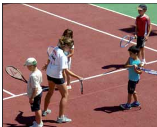
Arriba, un momento de la clausura del cuarto Curso de Perfeccionamiento de Fútbol impartido en el Complejo San Miguel. A la izquierda, clase de Tenis, una de las actividades más demandadas en el 'Azuverano'.

Henares", explica el responsable municipal de Deportes. En este sentido, el 'Azuverano' sumó en agosto más de 330 usuarios.