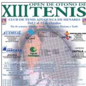
Detalle del cartel del Open de Otoño

Los campeones y subcampeones de cada categoría recibirán un trofeo que, en el caso de Absoluto, se acompañará de un premio en metálico de 240, 120, 60 y 30 euros para el primer, segundo, tercero y cuarto clasificados, respectivamente. Además, el mejor jugador