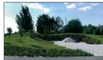
Estado actual de la rotonda de la Plaza de Asia.

El concejal de Mantenimiento Urbano, Rubén Carbajo, ha afirmado que "Azuqueca cuenta con más de 400.000 metros cuadrados de zonas verdes y más de 11.000 árboles en buen estado de mantenimiento y conservación pero, lamentablemente, el PP se esfuerza por encontrar lo negativo". De este modo el responsable municipal de Mantenimiento Urbano ha respondido al grupo municipal del PP, que se quejaba del mal estado de algunas zonas verdes del municipio "es inevitable que las temperaturas extremas del verano afecten a algunas plantaciones y para actuar sobre ellas tendremos que esperar a que pase el verano, según