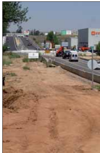
Las obras del tercer carril llegaron a Azuqueca en febrero