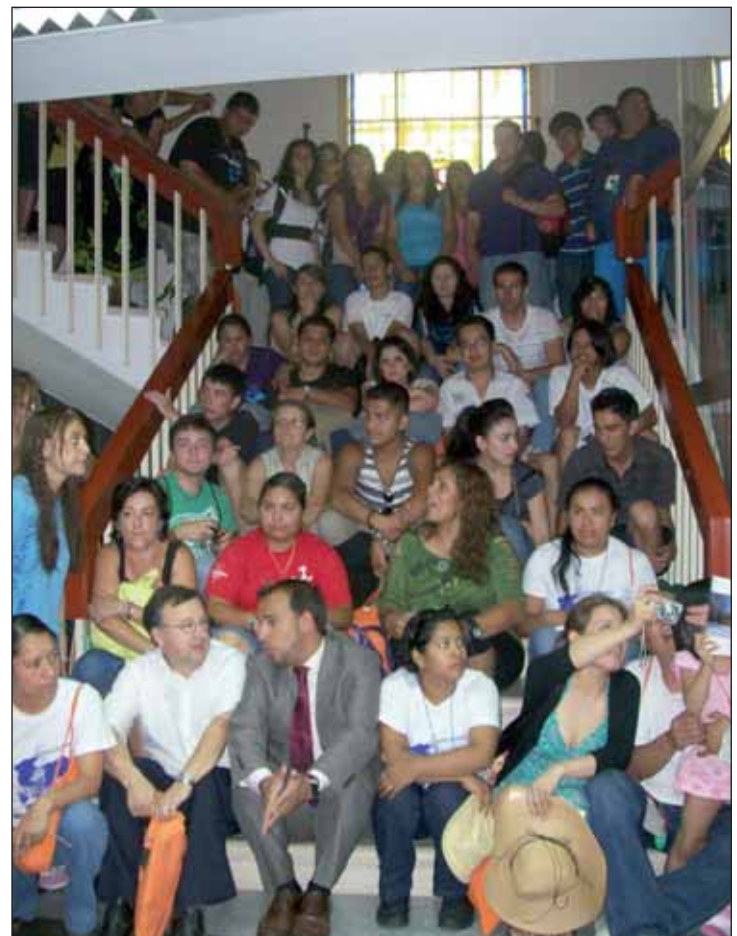
Los jóvenes posaron para el alcalde en las escaleras de entrada al Ayuntamiento para una foto de familia

Los jóvenes, que llegaron al municipio procedentes de Ecuador, México, California y Dubai, se alojaron entre familias azudenses y además de desplazarse a Madrid durante la visita del Papa Benedicto XVI, conocieron otros puntos de la provincia como Guadalajara o Sigüenza.