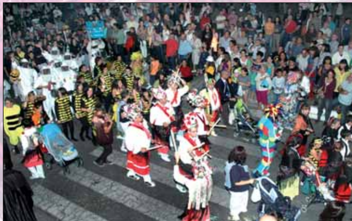
Los peñistas cuidan todos los detalles, incluidos los disfraces. En la imagen, integrantes de El Cebollón, que el año pasado participó en el desfile con una carroza inspirada en la provincia de Guadalajara

Casas también se refiere al carácter artesanal de estos trabajos, pues "las carrozas se elaboran a mano a partir de todo tipo de materiales, desde madera y cuerpos de hierro para montar la estructura, a papel, pintura y muchos otros para crear las figuras y los detalles".