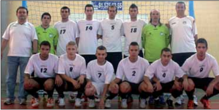
Equipo de Tercera División Nacional del Club Fútbol Sala Azuqueca