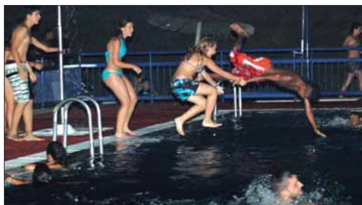
Sobre estas líneas, la piscina de verano durante las sesiones 'Los viernes a la luna'.

de agosto, los participantes disfrutaron del humor de Fernando Moraño, ( Paramount Comedy ) y de la red de voleibol que se colocó en