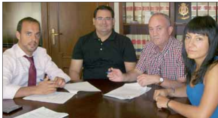
Momento de la firma del convenio entre el alcalde y el presidente de la Banda de Música, acompañados por la concejala de Cultura y el director de la Banda

quincena de actuaciones a lo largo del año, en procesiones y pasacalles de las Fiestas de San Isidro, los festejos taurinos, la actuación de Navidad y Santa Cecilia, y durante las Fiestas de Septiembre. Por su parte, el Ayuntamiento azuquense provee los instrumentos musicales y proporciona a los músicos el local de ensayo.