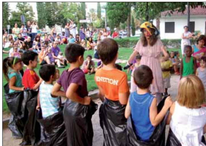
Una de las actividades del programa 'Cultura en la calle' fue el espectáculo de títeres 'Historias y leyendas' que se representó en el parque de La Constitución el 20 de agosto