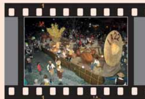
LA VEINTIDÓS. Primer Premio año 2010