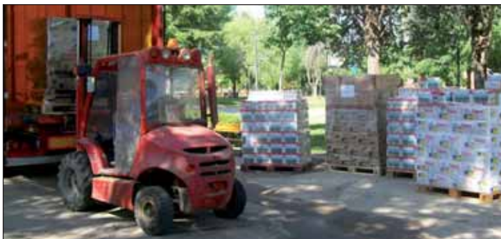
Los alimentos se descargaron en el parque de La Constitución

El Ayuntamiento se ocupó de la gestión y descarga, y una empresa local, del transporte