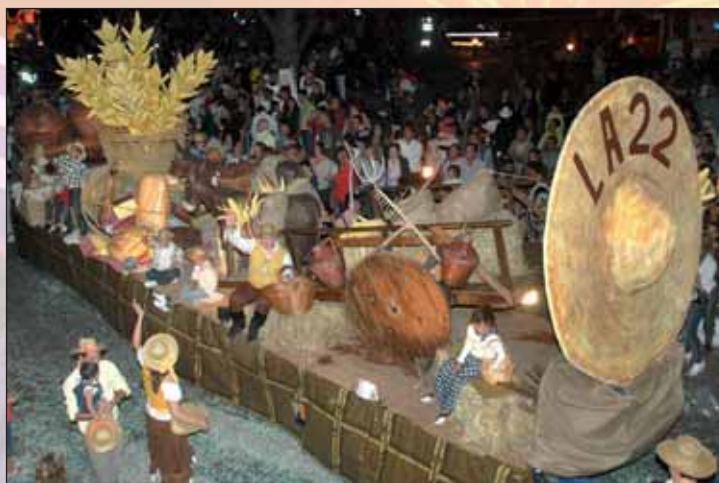
La peña La 22 fue la ganadora del desfile del año pasado con una carroza que rendía homenaje al mundo del campo