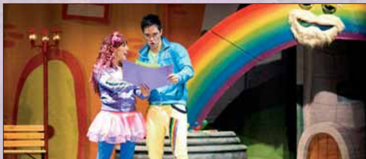
'Ciudad Arcoiris' deleitará a los asistentes con 'Misión Ilusión'

Como colofón, el sábado a las 17 horas, en el parque de La Constitución, los niños encontrarán un parque infantil e hinchables, y podrán disfrutar al final de la fiesta de la espuma.