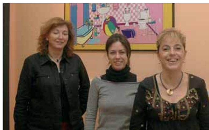
La concejala de Consumo (a la derecha), junto a parte de los trabajadores del Centro. Debajo, imagen de la campaña "El futuro en tu mano"

"Hay que tener en cuenta que todas y cada una de las actividades formativas redundan en beneficio del conjunto de la sociedad, a través de la formación de