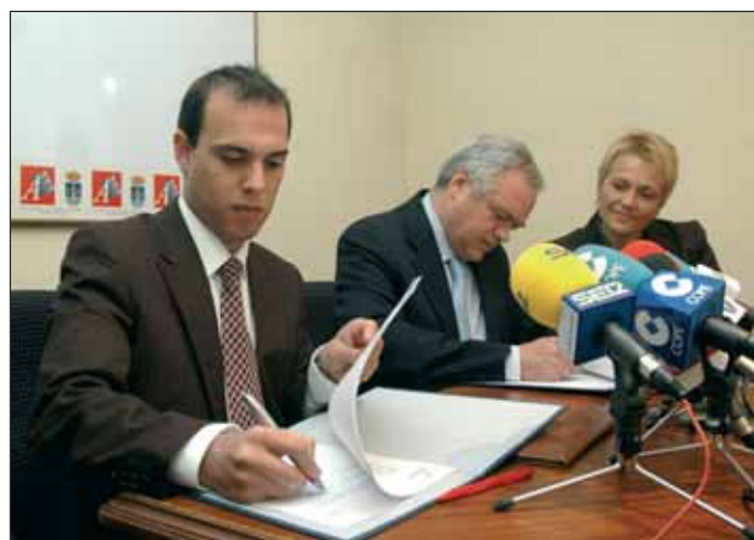
El alcalde y el consejero firmaron el convenio en presencia de la concejala de Servicios Sociales. Debajo, el alcalde explica sobre el terreno al consejero y al delegado de Bienestar Social, detalles del proyecto del Centro de Ocio para mayores

Precisamente, el consejero aprovechó su presencia en Azuqueca para visitar los terrenos de la avenida de