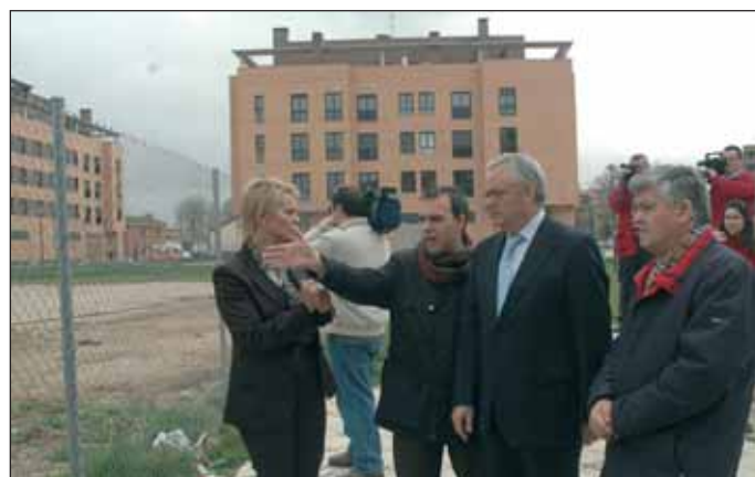
Dinamarca reservados por el Ayuntamiento para construir el Centro de Ocio de Mayores. El proyecto está siendo supervisado por Bienestar Social y "en los próximos meses se aprobará", según Mañas.

[El pleno del Ayuntamiento aprobó por unanimidad el pasado 31 de enero el convenio con la Junta para la construcción del CAI y el proyecto técnico de las obras del Centro de Ocio].