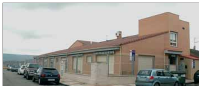
Arriba, la guardería 'La Noguera'; debajo la primera municipal que entró en funcionamiento en Azuqueca, la situada en el barrio de Asfain, '8 de marzo'