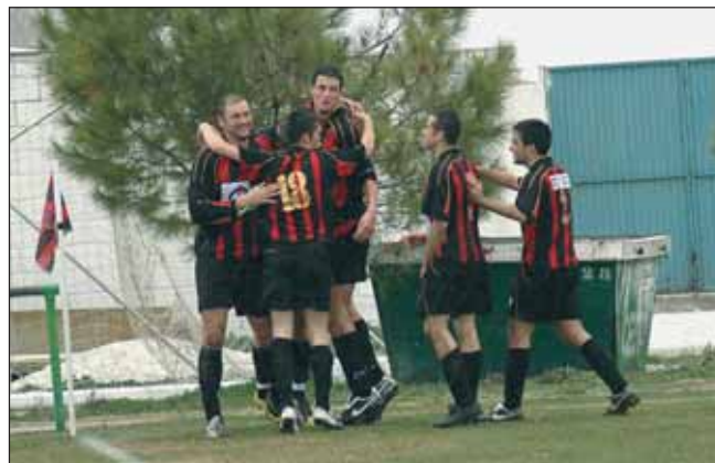
Los jugadores del Azuqueca celebran un gol en el encuentro en casa frente al Daimiel

Por su parte, los junior son segundos en la tabla, a solo dos victorias del líder de la categoría: el conjunto toledano del Illescas.