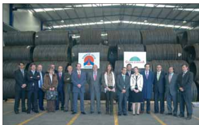
La consejera y el alcalde, junto a responsables de Puerto Seco Azuqueca y otras autoridades, durante la visita a las instalaciones de la terminal logística