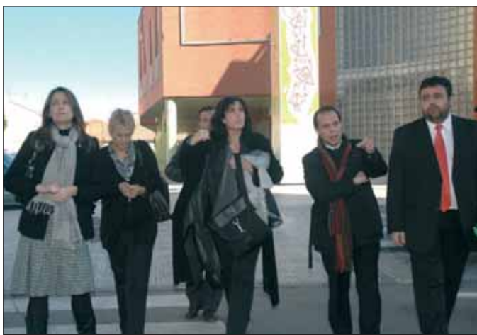
El alcalde, acompa ado de varios concejales del Equipo de Gobierno, explic  a la consejera (en el centro) el proyecto del Ayuntamiento para actuar en el barrio de Castilla.

Durante su estancia en Azuqueca, la consejera,