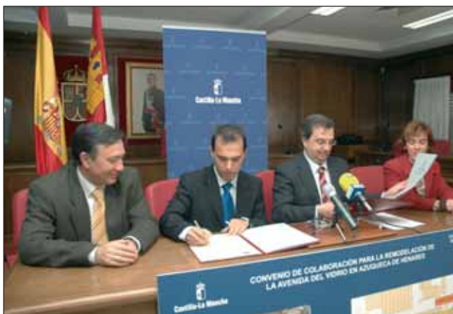
Firma del acuerdo para la remodelación de la avenida