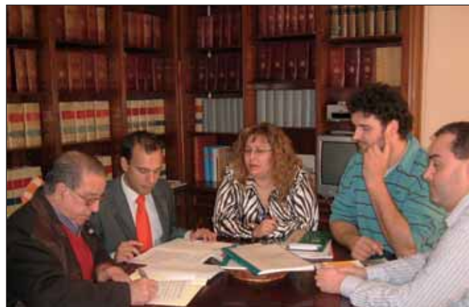
De izquierda a derecha, el presidente Local de Cruz Roja; el alcalde; la concejala de Sanidad; el responsable de Juventud y el de Programas de Cruz Roja