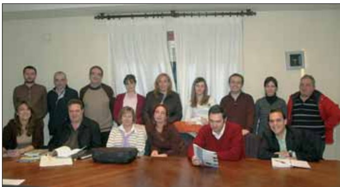
Los miembros del consejo de Cooperación, con los representantes de Manos Unidas y de la contraparte boliviana