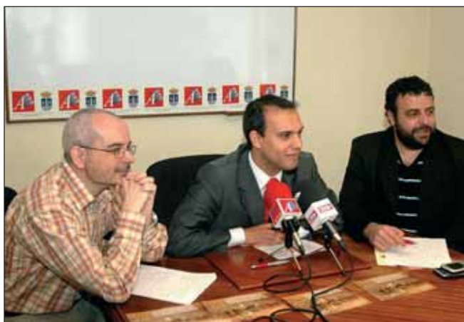
El alcalde (en el centro), junto a los concejales de Cultura y Desarrollo Sostenible, durante la presentación del concurso

El plazo de entrega de originales se cerrará el día 30 de abril