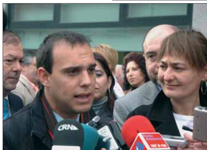
El alcalde y la consejera de Trabajo y Empleo, durante la inauguración de la oficina de empleo azudense. Arriba, momento en el ambos descubrieron la placa conmemorativa en el exterior del edificio