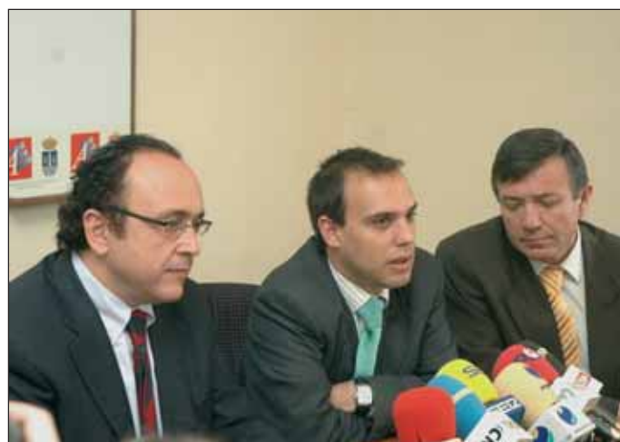
El consejero, el alcalde y el delegado de la Junta en Guadalajara

Además, Junta y Ayuntamiento trabajan en el diseño definitivo del Plan de Dinamización del Comercio de Azuqueca. Según Díaz-Salazar, este plan -para el que ya existe consignación presupuestaria por parte de la Junta de Comunidades- mejorará la competitividad de los 650 establecimientos comerciales de la localidad. "Se destinarán ayudas directas a los comerciantes para la mejora de sus establecimientos, y para la modernización y adaptación a los hábitos de los consumidores actuales". El consejero mostró además su deseo