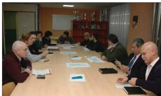
Los miembros del Consejo de Sostenibilidad se reunieron el 26 de febrero para avanzar en la preparación del plano

Sostenibilidad, en su última reunión, analizaba el 26 de febrero el boceto del plano y decidía además buscar estrategias para tratar de fomentar el uso de la bicicleta para los desplazamientos en el munici-