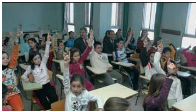
Los alumnos del Maestra Plácida compartieron aula con el consejero, el alcalde y otros responsables educativos

Domínguez Ortiz'), se ha ampliado el IES 'San Isidro' con la puesta en marcha de un nuevo aulario y se ha completado la remodelación integral del Centro de Adultos, 'Clara Campoamor'.