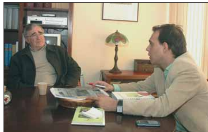
Un momento de la primera reunión del nuevo titular del Juzgado de Paz azudense con el alcalde, el pasado día 6 de febrero