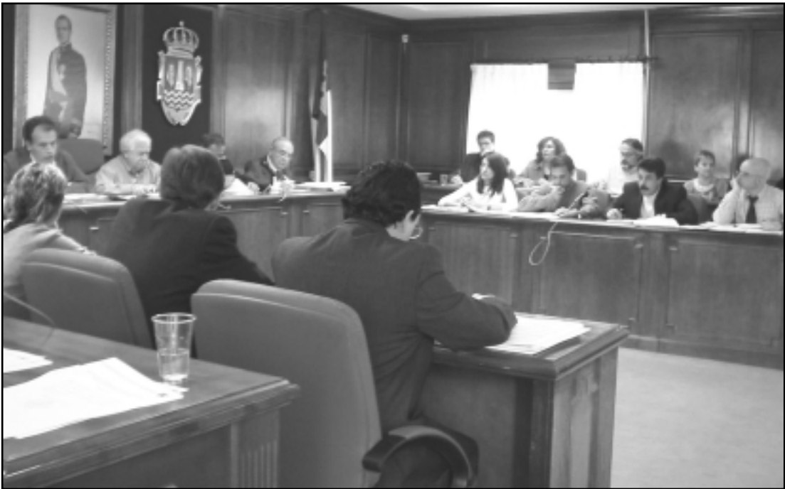
El presupuesto se aprobó en el Pleno con los votos a favor de PSOE e IU, y en contra del PP.

Azuqueca contará este año con un presupuesto de casi 22,8 millones de euros. Así se aprobó, con los votos a favor de PSOE e Izquierda Unida en el Pleno celebrado el día 23 de marzo. El Partido Popular votó en contra y presentó una enmienda a la totalidad del presupuesto, que fue rechazada por el Equipo de Gobierno. Al final, los presupuestos salieron adelante, y en ellos se contemplan partidas destacadas como la remodelación de la Casa de la Cultura o la adquisición de suelo para viviendas protegidas