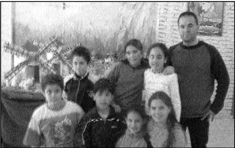
ESTE TRABAJO HA SIDO REALIZADO POR: ESTEFANIA HIDALGO CASTRO, SERGIO GALLEG0 SÁNCHEZ-BLANCO, FRANCISCO DAVID LÓPEZ TEJEDOR, ÁLVARO DEL BARRIO MÁRQUEZ, ISABEL MOLINA AGUILAR, SOFÍA GARCÍA AYUSO Y OLGA TERMIS MORENO. 5º A

NUESTRO colegio está situado en la calle Chueca de Azuqueca de Henares, dentro de la urbanización de Vallehermoso. Es un barrio bonito lleno de unifamiliares y todas las calles tienen nombres de compositores españoles. Por las mañanas tiene mucho tráfico, aunque los guardias ayudan a solucionar los atascos. De todas formas la mejor manera de colaborar es ir andando o en bicicleta. El resto del día es una calle tranquila, pero los perros y sus amos se empeñan en ensuciarlo todo. Nos gusta pasear entre los árboles del camino de Alovera y escuchar a los pájaros, pero el ruido de los coches estropea nuestro paseo. Ah, se nos olvidaba, nuestro colegio se llama "Maestra Plácida Herranz". Es un cole muy grande en el que hacemos muchas cosas: francés, tapiz, medio ambiente, reciclado, informática y teatro. Nos gusta este cole, esta calle y este pueblo. La calle Chueca es "guay".