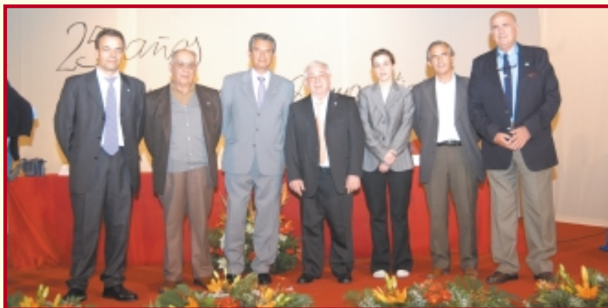
Los portavoces de la primera legislatura democrática, acompañados de los actuales y del alcalde.