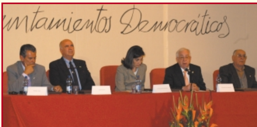
La defensora del Pueblo, el alcalde, y los portavoces de la primera legislatura presidieron el acto.