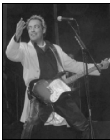
De arriba a abajo y de izquierda a derecha: Alex Ubago (10 de sept.), Café Quijano (18 de sept.), Seguridad Social (25 sept.) y Juan Pardo (19 sept.)