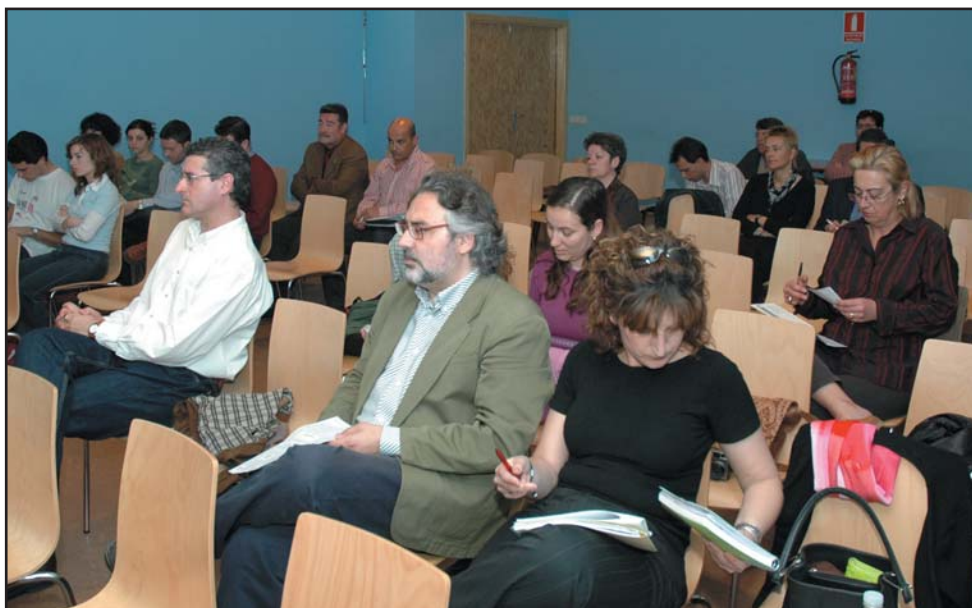
En el último foro ciudadano se dio a conocer a los vecinos el Plan de Acción Local.

Azuqueca cuenta desde el día 15 de marzo con un Plan de Acción Local. Se trata de un documento en el que se recogen las actuaciones que llevará a cabo el Ayuntamiento en los próximos años enmarcadas dentro del proceso de Agenda 21. El documento, aprobado en Pleno con la unanimidad de los tres grupos municipales, incluye propuestas técnicas, ciudadanas y también del propio Equipo de Gobierno; en total 14 acciones que se llevarán a cabo durante el año 2005.