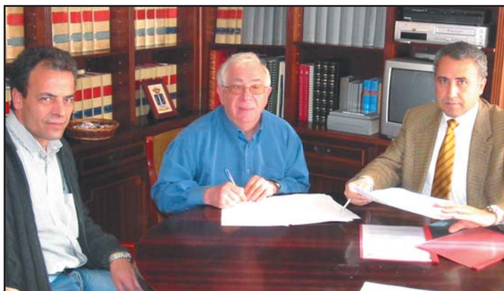
El Pleno ratificó de manera unánime el convenio firmado en febrero.

Esta infraestructura tendrá un coste de 1.228.000 euros –incluido el proyecto y la dirección de obra–, de los que el Ayuntamiento de Azuqueca financiará el 52 por ciento