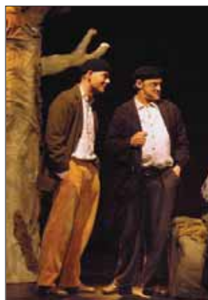
"Qfwfq. Una historia del universo", de la compañía Teatro Meridional