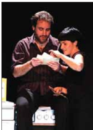
El domingo 11 de noviembre, Teatro del Zurdo puso en escena "Un momento dulce. La felicidad"