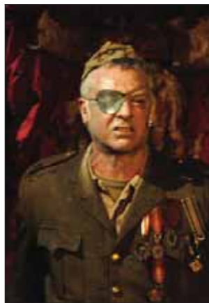
El domingo 4 de noviembre fue el turno de la compañía K Producciones con "Cantando bajo las balas"