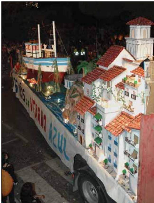
Carroza ganadora del Desfile este año