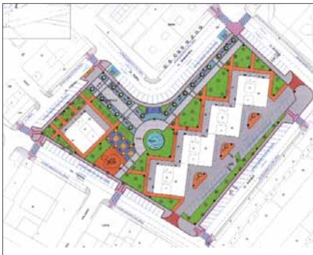
Imagen del proyecto de remodelación de la zona

En el diseño de la futura plaza se ha previsto la instalación de juegos infantiles, pequeños espacios ajardinados y una fuente con un surtidor central y varios