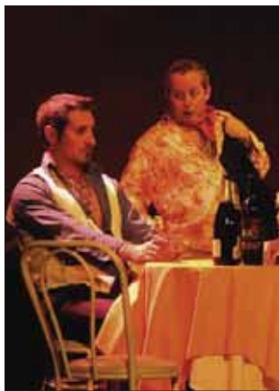
"El casamiento", de la compañía Histrión Teatro fue la obra que abrió la XXIV edición de "La Espiga de Oro"