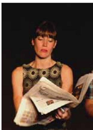
La Compañía Cuarta Pared participó en esta muestra con "Rebeldías posibles"