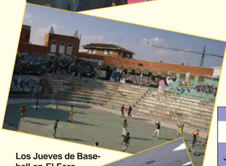
Los Jueves de Base-ball en El Foro