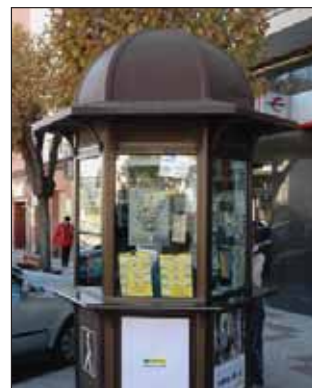
Los nuevos quioscos serán iguales al que está en la avenida de la Constitución

En los nuevos quioscos trabajarán los dos vendedores del cupón que ejercen ya la venta