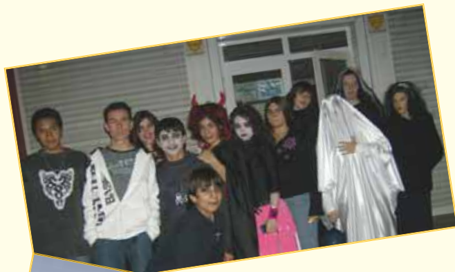
Fiesta de Halloween y Pasaje del Terror en El Foro 29-10-07