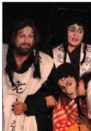
La compañía azuense Tragaleguas teatro participó en esta edición con "La injusticia contra Dou E"