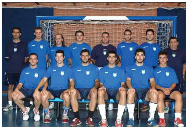
La plantilla del primer equipo al completo

También los Juveniles del club están demostrando su nivel esta temporada y son segundos, a sólo dos puntos de distancia del primero de la tabla en Liga Nacional Juvenil (el Albacete).