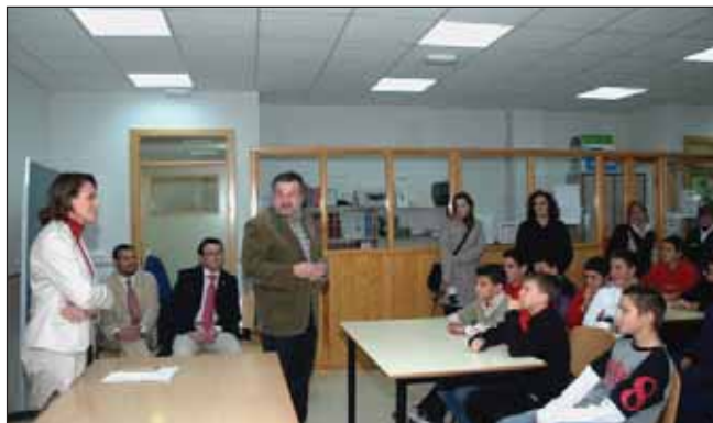
La consejera pidió a los escolares que luchan contra las desigualdades

situación existente antes de la aprobación de la Carta Magna en 1978. "Para que los más jóvenes conozcáis cómo ha mejorado nuestra sociedad en los casi treinta años de vigencia de la Constitución, y seáis conscientes de que no siempre se ha vivido en Castilla-La Mancha y en España como se vive ahora y que tenéis el deber de mantener lo que entre todos hemos conseguido", les dijo. La consejera animó a los estu-