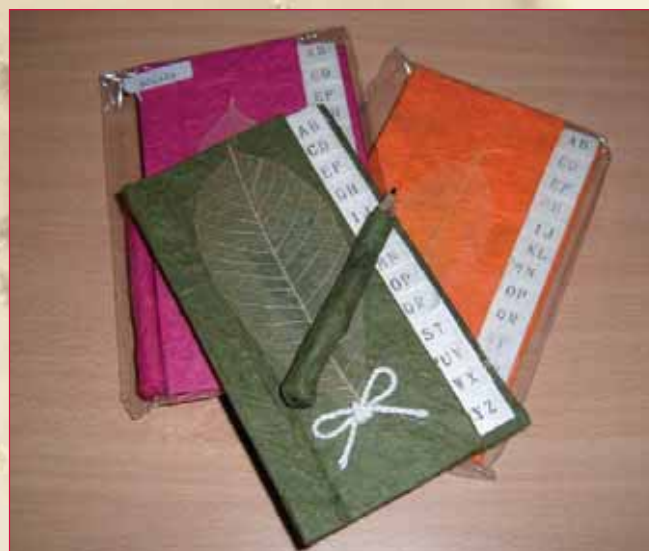
Libretas como estas se pondrán a la venta en la campaña de Comercio Justo en los centros educativos azudenses

ducción, esta organización utiliza como materias primas la arcilla, la madera, papeles locales y bambú. El 90 por ciento de su produc-