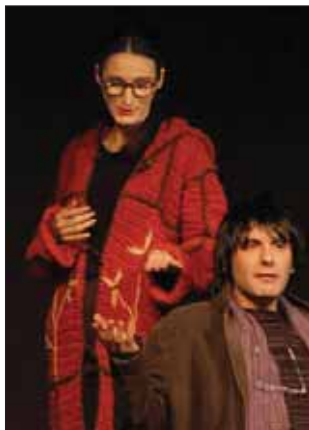
Un momento de la obra teatral “La cara más cara”, de la compañía Abril, incluida en el programa de actos del Día contra la violencia hacia las Mujeres

recuerda que el Centro de la Mujer y la Casa de Acogida son dos recursos públicos al servicio de las mujeres, en los que trabajan profesionales cualificados y donde las mujeres víctimas de violencia encuentran refugio, apoyo y asesoramiento.