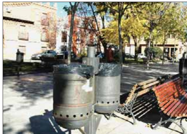
Estas papeleras de la plaza del General Vives van a ser sustituidas por otras de mayor capacidad

El Ayuntamiento ha anunciado que las antiguas papeleras instaladas en la plaza del General Vives van a ser sustituidas próximamente por otras de mayor capacidad. Este cambio responde a las quejas de ciudadanos y comerciantes que atribuían parte de la suciedad en la plaza a la escasa capacidad de las anteriores papeleras. Además, comerciantes y vecinos habían pedido al Ayuntamiento la reposición de las papeleras deterioradas en esta plaza.