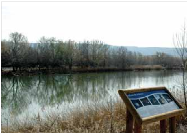
Imagen de archivo de una de las lagunas de la Reserva