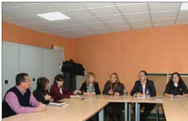
Un momento de la apertura de la mesa de trabajo, a la que asistieron la concejala de Servicios Sociales de Azuqueca y representantes de otros municipios de la comarca

El centro azudense, al que acuden también niños de otros municipios de la comarca, cuenta con atención especializada de logopedia, fisioterapia y estimulación temprana y psicología; en la memoria del servicio de este año se va a solicitar a la Junta la contratación de un psicomotricista.