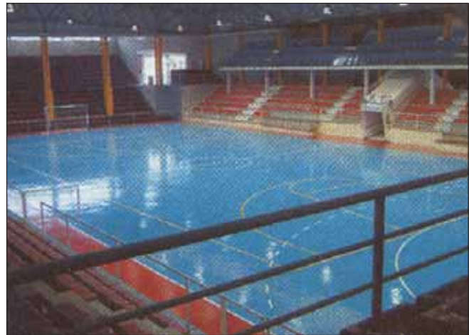
Imagen de una pista idéntica a la que llegará a Azuqueca en breve

Aunque al cierre de esta edición no se había cerrado