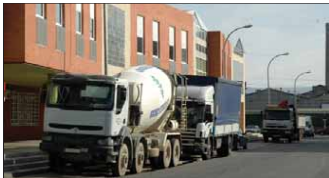
Imagen de archivo de varios camiones aparcados junto a El Foro, antes de que se prohibiera el estacionamiento de estos vehículos en la zona

Los Ayuntamientos de Azuqueca de Henares y Alovera, la Asociación Provincial de Empresarios de Transportes de Guadalajara (APETGU) y la Subdelegación del Gobierno han llegado a un acuerdo por el que se limitan cuatro zonas en los polígonos industriales de ambos municipios en las que podrán estacionar camiones y en las que las fuerzas de seguridad prestarán una especial labor de vigilancia. En el caso de Azuqueca, la zona 1 se sitúa a lo largo de la avenida de la Industria, desde la intersección con la avenida de la Barca hasta la intersección con la carretera de acceso a la A-2; la zona 2, en esta misma avenida, desde la intersección con la carretera de acceso a la A-2 hasta el final del límite municipal limítrofe con el de Alovera, continuación de la avenida Río Henares; y la zona 3, en las avenidas del Vidrio y de la Técnica, desde el