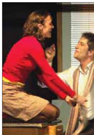
La segunda parte de la muestra comenzaba el 17 de noviembre con Titzina Teatre y la obra "Entrañas"