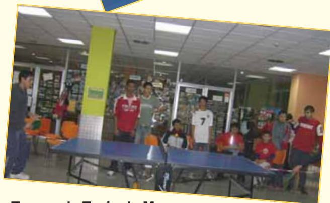
Torneo de Tenis de Mesa en la Sala de Juegos 09-11-07