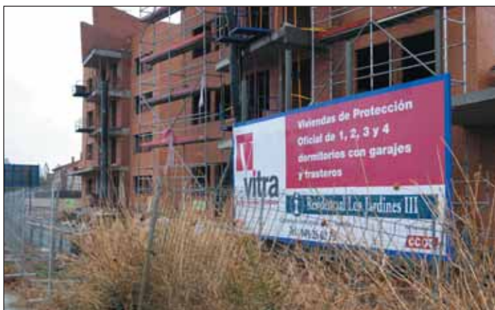
Imagen de archivo de una promoción anterior de viviendas protegidas construidas por la cooperativa Vitra en Azuqueca,

Una de las dos superficies adjudicadas, la ubicada en el sector SUR R4 (calle María Zambrano), tiene una extensión de 1.235,34 metros cuadrados, por los que la cooperativa deberá abonar al Ayuntamiento 801.668,89 euros. La segunda de las parcelas adjudicadas por el Pleno a Vitra, por 1.603.337,78