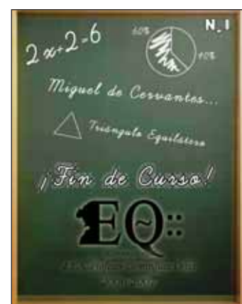
Portada del número 1 de "EQ"