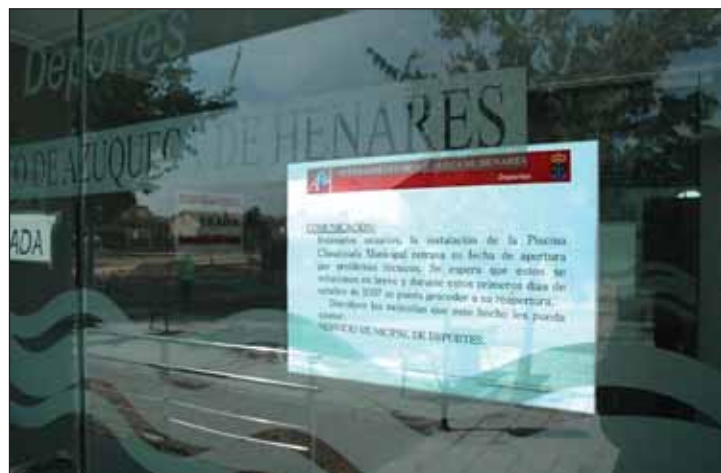
Un cartel, en la puerta de la Piscina informa a los usuarios de la piscina del cierre de la instalación "por problemas técnicos"

La piscina climatizada, que funciona desde hace dos años, fue construida por la Junta, por