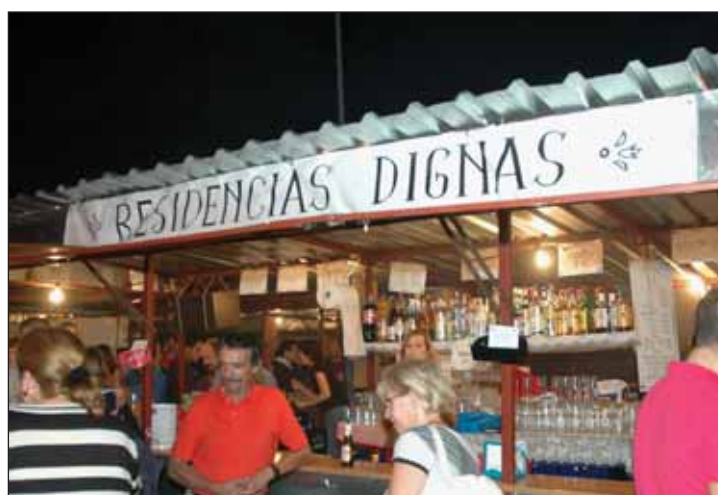
Chiringuito instalado por la asociación en el Recinto Ferial durante las fiestas