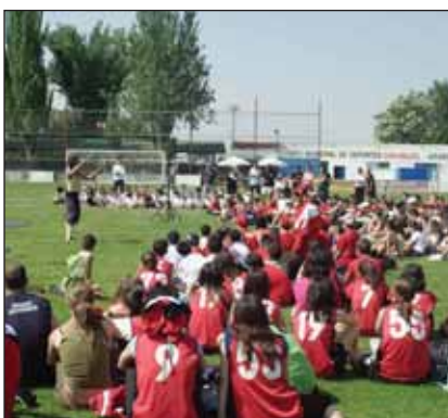
Clausura de las Escuelas Deportivas en la pasada temporada

Alrededor de un millar de niños están inscritos en alguna de las Escuelas Deportivas Municipales que van a funcionar en Azuqueca durante esta temporada. Además, la oferta de la concejalía de Deportes cuenta con 243 adultos inscritos en las modalidades reservadas para este sector de la población. La escuela con más alumnos es Tenis. La oferta para niños incluye aeróbic, ajedrez, atletismo, badminton, baloncesto, esgrima, fútbol sala, fútbol, gimnasia rítmica, karate, kajukenbo, patinaje, predeporte, psicomotricidad, tiro con arco voleibol y tenis. En el caso de los adultos, el menú deportivo incluye las disciplinas de aeróbic, aikido, esgrima, kajukenbo, patinaje, pilates, tiro con arco y tenis.