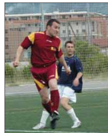
Imagen de archivo de un partido de la Liga Municipal de Fútbol 7

Por otra parte, el alcalde ha anunciado que durante los fines de semana habrá una ambulancia preparada para actuar en caso de que sea