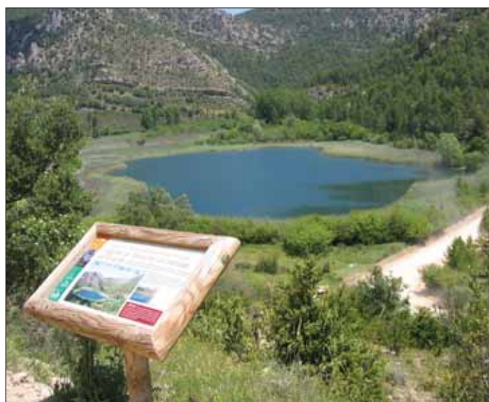
La última salida de campo organizada por Agenda 21 Local incluyó la laguna de Taravilla, en el Alto Tajo, en su recorrido

Las plazas están limitadas, dado que el acceso al Parque Natural requiere de