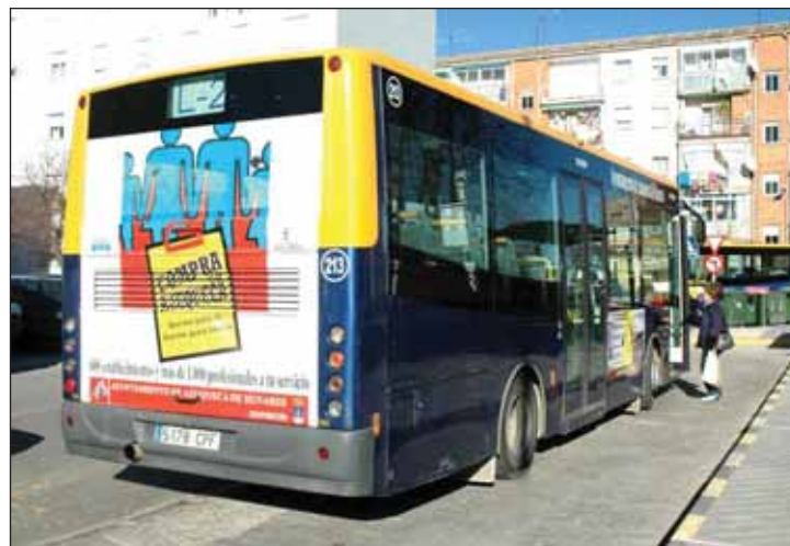
Uno de los autobuses que prestan servicio en Azuqueca