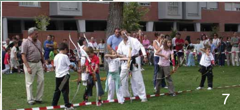
Foto 1: El CD Guadalajara se impuso por 2-0 al CD Azuqueca en el encuentro de fiestas. Fotos 2 y 3: Encuentros del Carrascosa Moreno y del Central Óptica durante la semana grande. Foto 4: Foto de familia del torneo de ajedrez. Foto 5: Torneo de Petanca. Foto 6: Mountain Bike en La Quebradilla. Foto 7: Exhibición de tiro con arco.