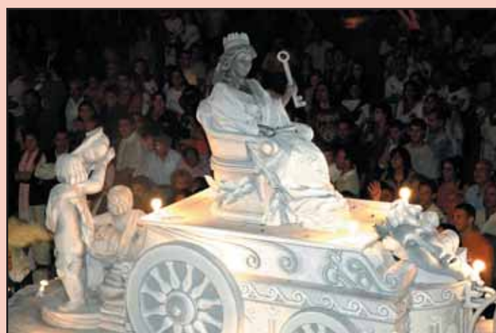
La carroza ganadora del desfile del año pasado, la diosa Cibeles de la peña El Cebollón