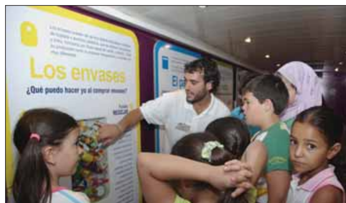
Arriba, un grupo de niños escucha las explicaciones sobre el reciclado de envases en el interior del autobús. Debajo, el Centro Itinerante aparcado junto al Ayuntamiento

Más información sobre la campaña de la Junta, en la