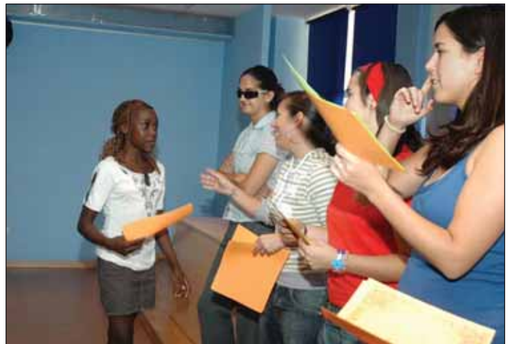
En la imagen superior, asistentes a la clausura de los talleres. Debajo, una de las participantes recoge su diploma

edición se desarrolló en las aulas del Centro Social).