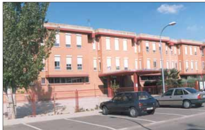
Arriba, el colegio Maestra Plácida Herranz; debajo, el IES San Isidro

El programa se aplicará de forma paulatina, de modo que se partirá de un curso y se irá extendiendo al resto en los años sucesivos.