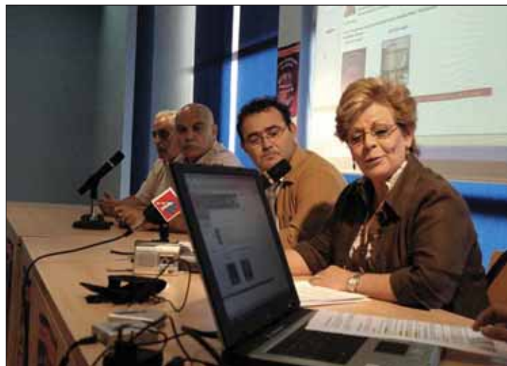
De derecha a izquierda, la concejala de Comercio, el alcalde y los ediles de Empleo y Obras e Infraestructuras, durante la presentación de la Guía de Comercios

Hasta el momento, son 450 los comercios incluidos en la Guía. "Esperamos -continúa la responsable municipal de Comercio- que la cifra vaya aumentando, puesto que además de a los comercios también está abierta a los autónomos prestadores de servicios con domicilio social en Azuqueca -desde fontaneros, electricistas, aboga-