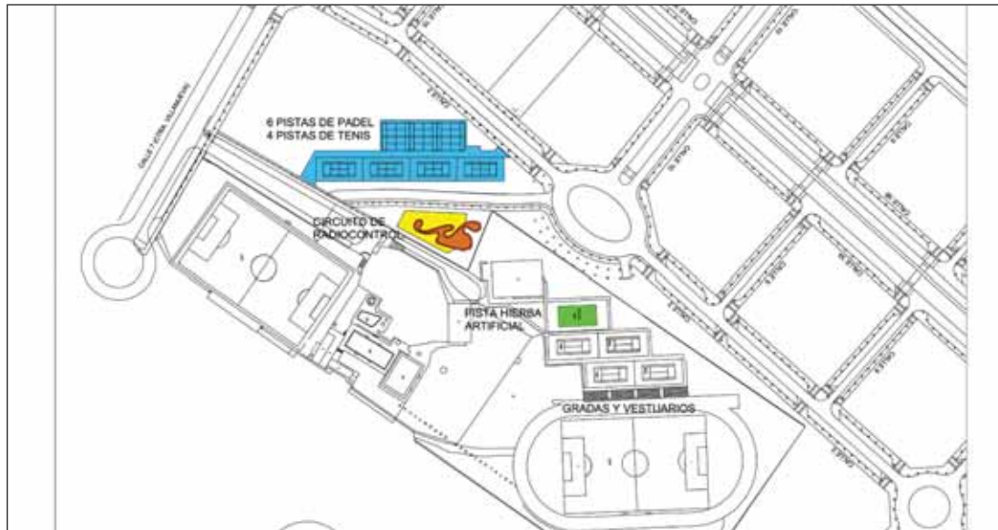
Plano del Complejo San Miguel, con la localización de las nuevas instalaciones deportivas