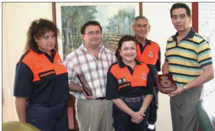
El alcalde y el concejal de Seguridad, junto a tres de los integrantes de la agrupación de voluntarios de Protección Civil