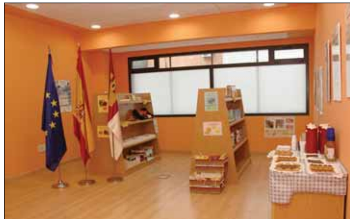
Interior del Centro de Formación del Consumidor de Azuqueca

En lo que a los juguetes se refiere, la edil ha anunciado que "otra de las próximas campañas que se realizarán desde la OMIC en el último trimestre de este año será una campaña específica de control e inspección de juguetes en establecimientos del sector y otros como bazares en los que también se comercializan". En este