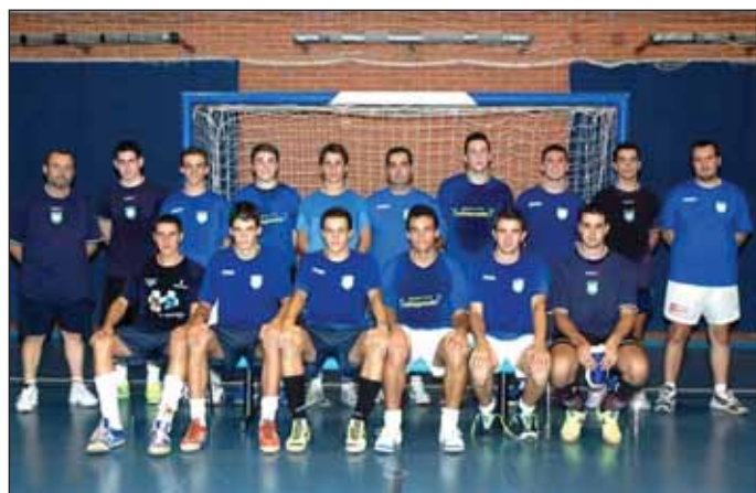
Los cadetes que la temporada pasada obtuvieron el título de Campeones de España se estrenan ahora en categoría Juvenil