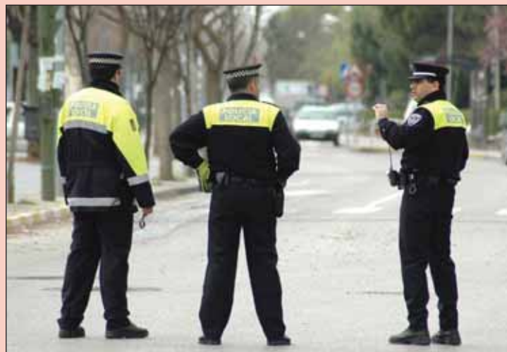
Imagen de archivo de tres agentes de la Policía Local