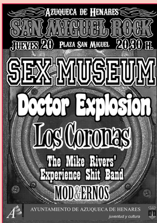
Cartel de la I edición del San Miguel Rock