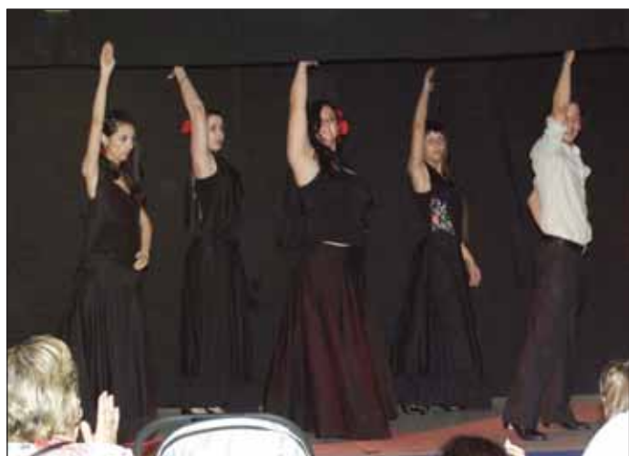
Exhibición del taller de flamenco durante las jornadas de Concentración, del pasado mes de junio

Una novedad de los talleres de esta convocatoria es la posibilidad de que los alumnos paguen todas las cuotas del curso al inicio de la temporada, con lo que se les aplicará un descuento de cinco euros por matrícula. El precio por trimestre es de 45 euros (130 euros para quienes opten por el pago único para todo el curso).