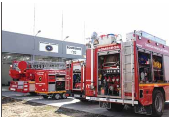
El vehículo para intervención y rescate en altura se sumará al resto de material del parque azudense

El vehículo de intervención y rescate en altura, que se sumará al resto de equipamientos del parque de Bomberos de Azuqueca supondrá una inversión de 419.000 euros. Dotado con un brazo extensible de 28 metros de longitud, facilitará los trabajos en edificios de gran altura, a los que hasta