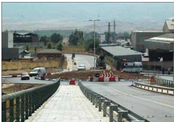
El nuevo vial enlaza con el paso elevado sobre la vía del tren a través de una rotonda en la avenida del Sur

La nueva calle atraviesa terrenos de los propietarios de la