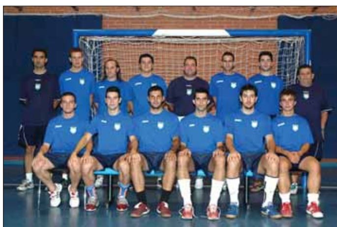
Equipo con el que el club azudense quiere conseguir este año el salto de categoría a división de Plata

Los cadetes, campeones de España, pasan a liga Juvenil