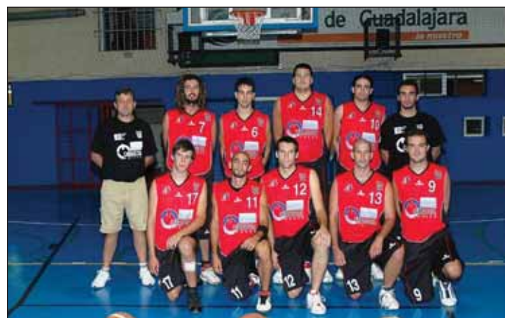
Los jugadores del Carrascosa Moreno, al inicio de la nueva temporada, en el polideportivo municipal