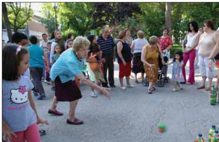
Una de las actividades organizadas con motivo del Día del Abuelo en el Parque de La Ermita