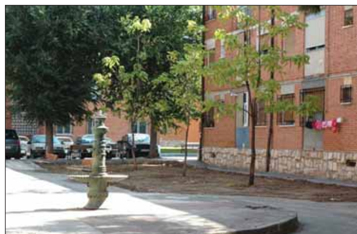
El barrio de Las Doscientas es uno de los más antiguos del municipio

refiere, únicamente se van a conservar los árboles en buen estado y que merecía la pena y se van a reacondicionar completamente estos espacios". "Además -continúa el edil- se va a aprovechar esta actuación para renovar las conducciones de agua y electricidad y para acondicionar entradas que permitan el acceso de vehículos de emergencias".