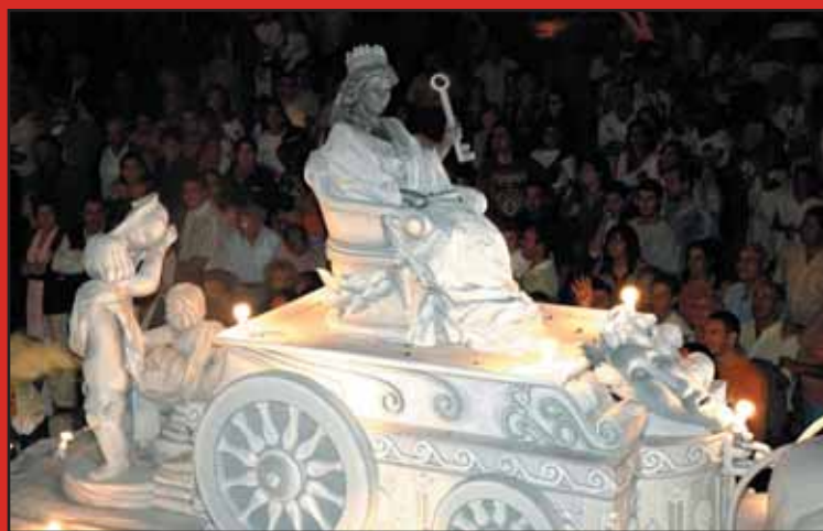
Cebollón "La Cibeles"