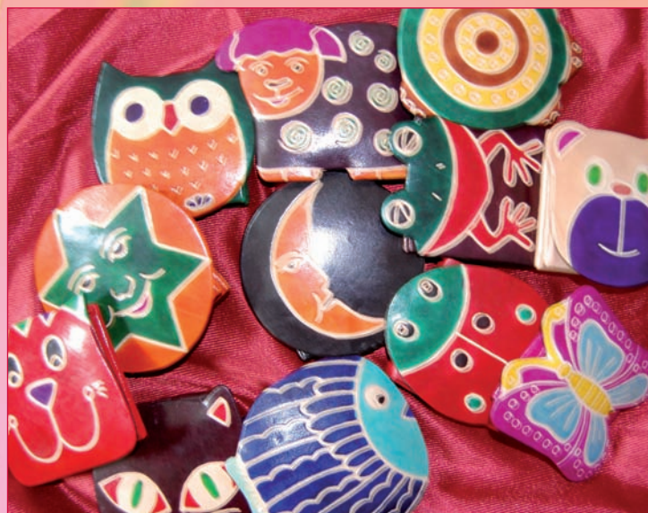
Los monederos de piel que se podrán a la venta en la campaña de comercio justo tienen diferentes formas y colores

Las propuestas organizadas desde DiDeSur de cara a la Navidad también incluye una sesión de cuentos del mundo, que se celebrará en el local que la ONG tiene en el edificio de El Foro el 16 de diciembre a partir de las 18.30 horas.