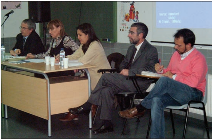
Un instante de la reunión en el Centro de Profesores

La Consejera de Educación acudió al Centro de Profesores para presentar el documento