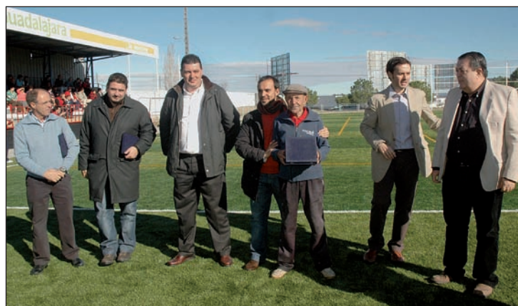
Imagen del encuentro que disputó el CD Azuqueca contra el Marchamalo

Este triunfo da nuevos ánimos al equipo que entrena Quique López, un equipo que, desde el inicio de la liga, sólo se ha impuesto a sus rivales en tres ocasiones (aunque una de ellas no cuenta debido a la retirada del Club Atlético Esquivias), ha empatado en cuatro y ha sumado seis derrotas. La