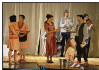
Teatro Defondo presentó en Azuqueca su espectáculo "Mucho ruido y pocas nueces" el 29 de noviembre