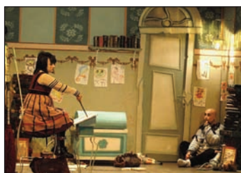
"Por el ojo de la cerradura" de la compañía Falsaria de Indias abrió el 1 de noviembre la XXV edición de la 'Espiga de Oro'