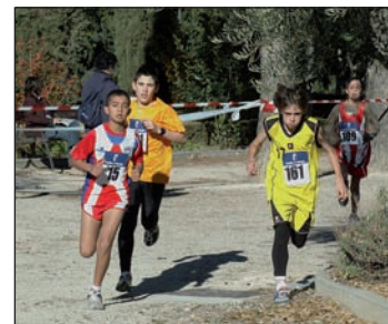
Diferentes momentos de la primera prueba del Campeonato Provincial de Deporte Base