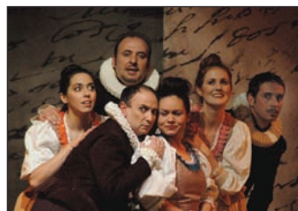
El domingo 16, el público disfrutó de "Basta que me escuchen las estrellas" de la compañía Micomicón