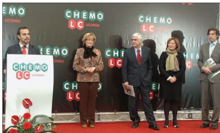
Empezando por la izquierda, el alcalde de Azuqueca, la consejera de Cultura, Turismo y Artesanía; el presidente de Castilla-La Mancha, la presidenta de la Diputación y el director general del Grupo Chemo

Esta empresa farmacéutica se ubica en el polígono Miralcampo de Azuqueca