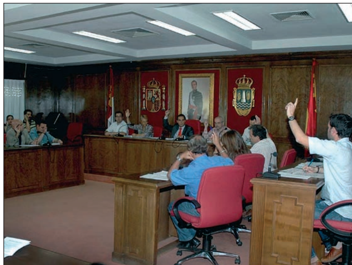
Imagen de archivo del Pleno del Ayuntamiento de Azuqueca

Según el texto, “los ayuntamientos han ido asumiendo competencias impropias que se están financiando con recursos municipales cuando deberían ser financiadas por otras administraciones”. Si a ello se une “una financiación insuficiente e injusta, decisiones como la retirada del IAE (Impuesto de Actividades Económicas) sin la compensación oportuna por parte del Estado y la creciente demanda social de servicios, se puede concluir que se ha llegado a una situación realmente límite”, tal y como recoge este plan de financiación.