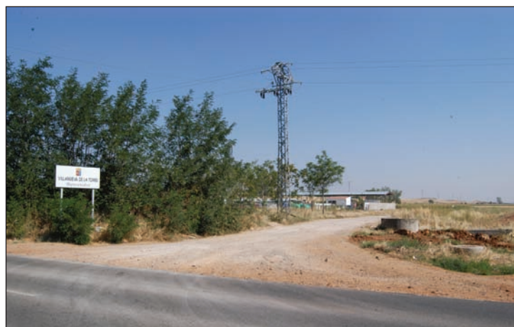
El nuevo depósito de vehículos abandonados se ubicará en una parcela junto al Punto Limpio de la carretera de Villanueva

Sobre el funcionamiento de este nuevo servicio, que se prestará en los ocho municipios integrantes de la Mancomunidad, la presidenta