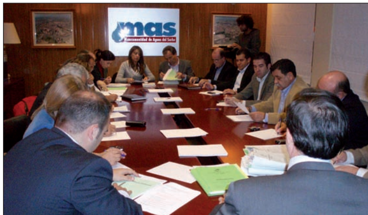
Imagen de la asamblea de la Mancomunidad de Aguas del Sorbe celebrada el 13 de noviembre

Una vez alcanzado este acuerdo, se inician los trámites para que esa incorporación sea efectiva. El texto ya ha sido remitido a la Junta de Comunidades de Castilla-La Mancha, que en un plazo máximo de un mes deberá dar el visto bueno. Después, los nuevos Estatutos deberán aprobarse en, al menos, cuatro ayuntamientos y en sesión plenaria. Sólo entonces, la Asamblea tomará razón del acuerdo y los seis