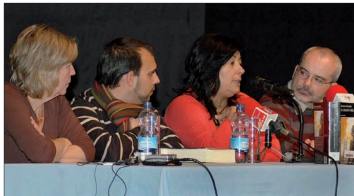
Empezando por la izquierda, la directora de la Biblioteca, el alcalde de Azuqueca, la escritora Almudena Grandes y el concejal de Cultura

La escritora charló con los asistentes sobre su última novela, 'El corazón helado'