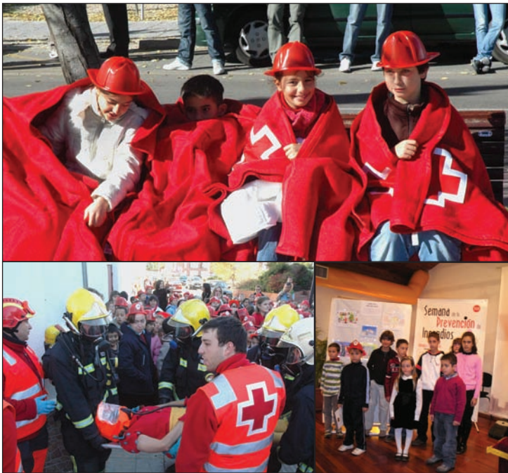
Arriba, varios instantes del simulacro. A la derecha, los alumnos premiados en el concurso de dibujo convocado entre los escolares

La Semana de la Prevención de Incendios celebrada en Azuqueca entre el 17 y el 21 de noviembre ha contado con la participación de 2.000 escolares. Era la primera vez que esta semana, organizada por la Diputación de Guadalajara, llegaba a Azuqueca y lo hizo con numerosas actividades, entre las que destacó la realización de un simulacro de incendios en la Casa de la Cultura, en el que participaron 300 escolares y un total de 20 efectivos de emergencia. La semana estuvo dirigida por los bomberos de parque azudense y en ella colaboraron Cruz Roja, Guardia Civil, Policía Local y Protección Civil. Como clausura, se entregaron los premios del concurso de dibujos, en el que participaron escolares de toda la