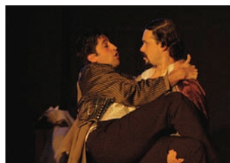
Peripécia Teatro cerró la muestra el 30 de noviembre con la obra "Novecientos, el pianista del océano"