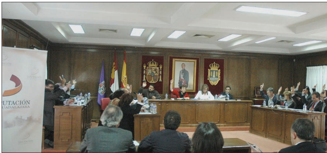
Un instante de la sesión plenaria de la Diputación celebrada el pasado 21 de noviembre en Azuqueca

Apoyo a la reforma del Estatuto de Autonomía de Castilla-La Mancha. — PSOE y PP presentaron en el Pleno de noviembre sendos acuerdos relacionados con el Estatuto de Autonomía de Castilla-La Mancha. Ambos mostraban su apoyo al texto, pero los primeros pedían “un pacto nacional del agua acordado por todos los españoles”, mientras que los segundos defendían que “el volumen de agua trasvasable se reduzca progresivamente hasta su definitiva extinción en 2015” y un aumento de la inversión anual del Estado en infraestructuras. El acuerdo del PP fue aprobado con los votos favorables de sus concejales, la abstención del PSOE y el rechazo de IU. Por su parte, el texto socialista salió adelante con el apoyo de sus ediles, la abstención del PP y el voto en contra de IU.