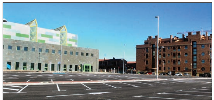
Arriba, imagen de las cortinas motorizadas en el polideportivo de grandes eventos. Abajo, aparcamiento exterior

140 vehículos y 2 autobuses, así como de la barrera verde que va a separar el polideportivo de la gasolinera y el taller que se encuentran a uno de sus lados, están a punto de finalizarse". En este caso, la