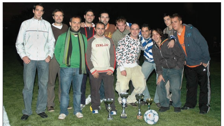
Los ganadores de la pasada Liga Municipal de Fútbol 7 posan con sus trofeos en el nuevo campo

Coincidiendo con el estreno del nuevo campo, el mismo