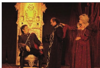
El escenario del Centro Cultural recibió el 15 de noviembre la visita de Factoría teatro y su 'Hamlet, por poner un ejemplo'