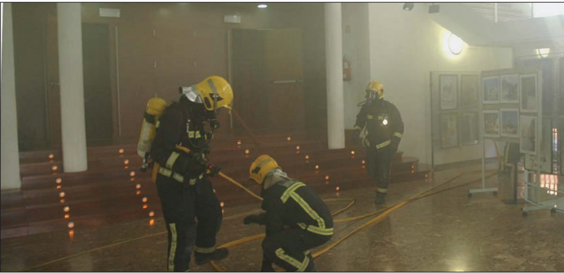
El simulacro de incendio en la Casa de la Cultura fue una de las actividades con mayor participación

Sólo en el simulacro de incendio en la Casa de la Cultura participaron unos 300 alumnos y 20 efectivos de emergencia