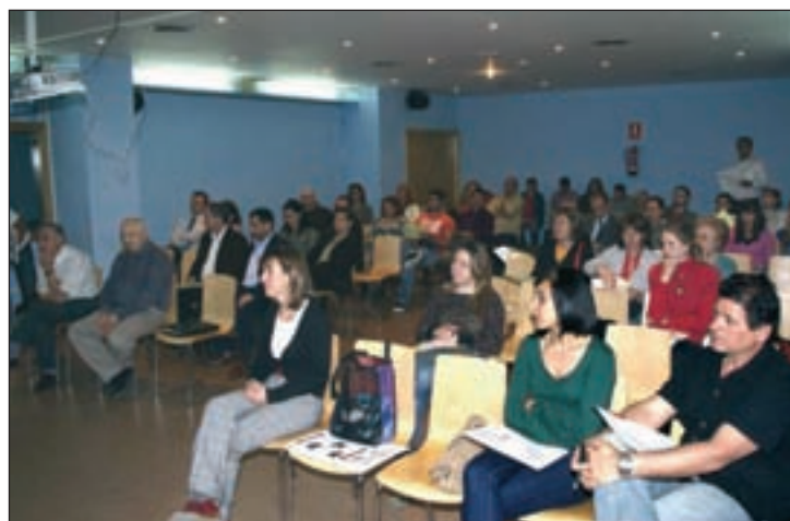
Imagen de archivo de una reunión de comerciantes de Azuqueca con el Ayuntamiento, en vísperas de la celebración de la II Feria del Comercio Local y la Artesanía, el 29 de abril

actuación. “Todos los comerciantes de Azuqueca –adelanta la edil– podrán beneficiarse de las actuaciones incluidas en el Plan, aunque en el documento hemos seleccionado las dos zonas que mayor concentración de establecimientos comerciales y de servicios tienen: la primera sería el centro urbano tradicional y la segunda el área comprendida entre el bulvar de las Acacias, la avenida de la Alcarria, la de Guadalajara, la calle Cuenca y el barrio de Castilla”.