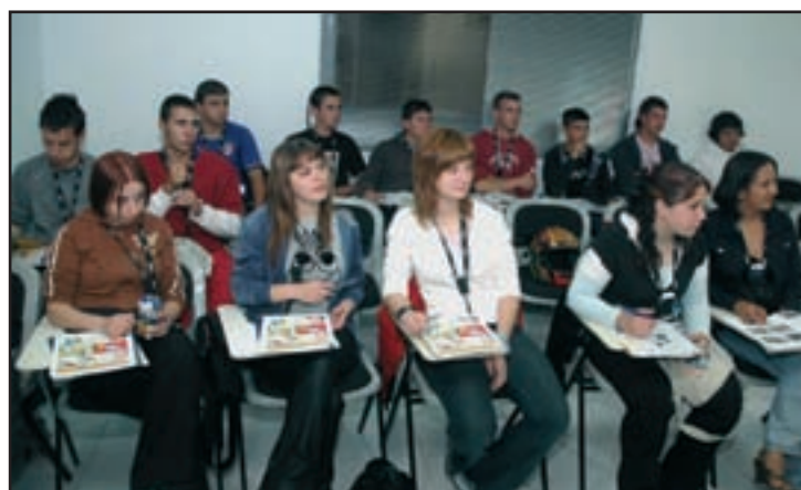
Los alumnos del grupo, el primer día del curso

El curso supone una inversión de 15.000 euros, aportados por la Junta de