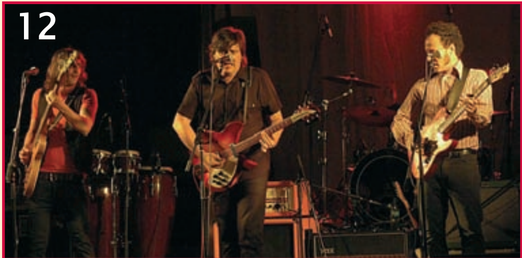
La música puso el broche de oro a las jornadas – Un concierto en la plaza San Miguel fue el broche final de las jornadas Concentra-Acción de este año. El cabeza de cartel fue el grupo ‘Los Imposibles’ (foto 12), una de las bandas más talentosas del Madrid de los 90, que encandilaron al público azudense. Tres grupos locales fueron los encargados de telonear a la banda de ‘El Lagarto’. Fueron Ébola (foto 12), Mod&Ernos (foto 13) y Paff Boom’s (foto 14) que, junto a ‘Los Imposibles’ ofrecieron a los presentes un concierto de más de cuatro horas de duración. Sin duda, la música en Azuqueca goza de buena salud.