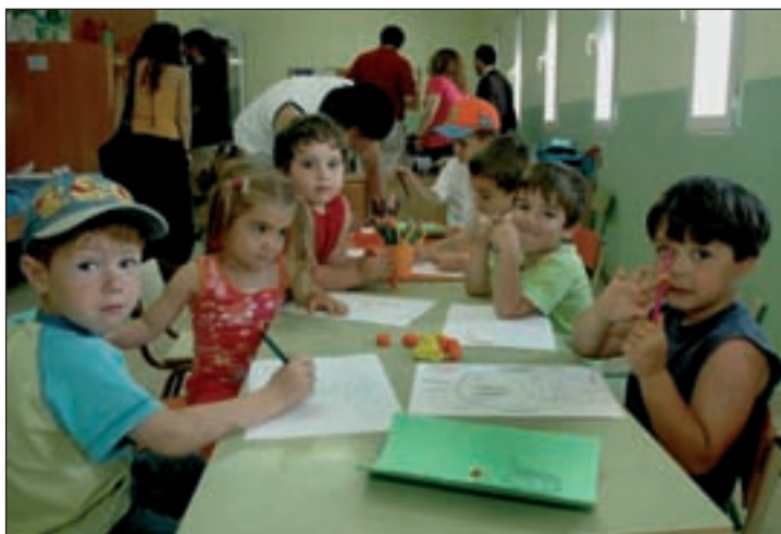
El alcalde y la concejala de Educación visitaron el campamento de la granja escuela el 26 de junio

A la oferta de campamentos urbanos se une el programa de atención a la infancia, que se lleva a cabo durante todo el verano en las instalaciones del colegio Siglo XXI y en el que participan 205 niños y niñas. En la atención de los pequeños trabajan 22 mujeres, contratadas a través de los planes