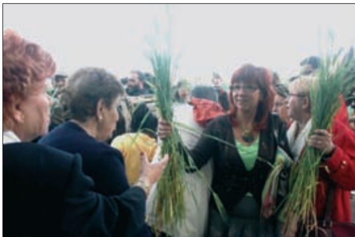
Imagen de la Fiesta de La Espiga de este año

Durante el Pleno en el que se aprobó la solicitud de Interés Turístico Provincial para