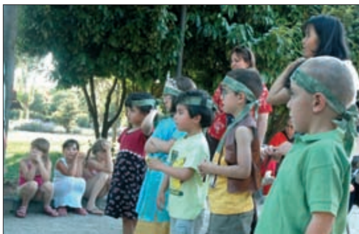
Los niños de la Ludoteca Municipal, La Luna, celebraron su fiesta de fin de curso un año más en el parque de La Quebradilla. Debajo, a la izquierda, la fiesta de los talleres de discapacidad. A la derecha, la de los mayores