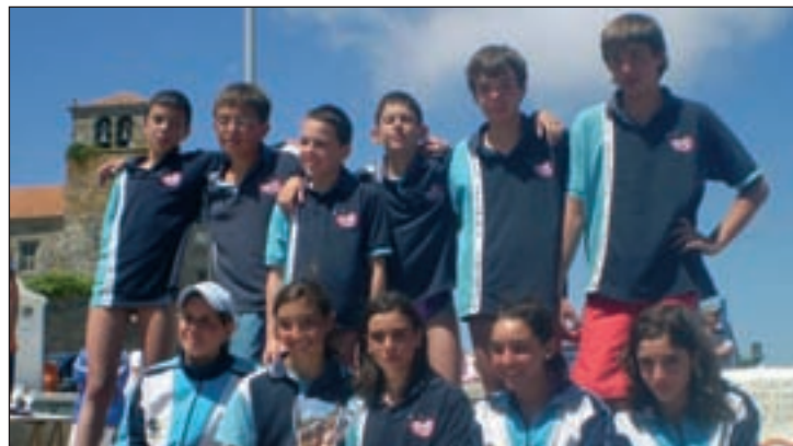
Foto de familia de los integrantes del equipo del Club Alcarreño de Socorrismo