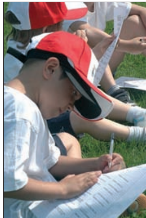
Uno de los alumnos de las Escuelas Municipales, eligiendo los nombres de las calles