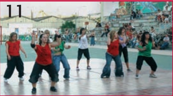
El taller de cómic e ilustración (foto 10) y el de hip-hop (foto 11) ofrecieron exhibiciones de las técnicas aprendidas a lo largo de todo el año. Además, ofrecieron la posibilidad de participar y conocer mejor estas disciplinas a todos los jóvenes que pasaron por El Foro.