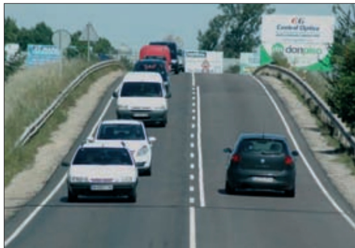
La entrada a Azuqueca por la N-320 fue uno de los lugares donde se instalaron dispositivos para contabilizar vehículos

El trabajo de campo desarrollado en junio ha consistido en la toma de datos manual y mecánica del aforo de vehículos en una docena de puntos del municipio. Se instalaron dispositivos para contabilizar vehículos en las entradas y salidas del municipio y en zonas con tráfico intenso, como las intersecciones de la N-320 con la carretera de Alovera (plaza de Asia), el entorno de la plaza de la Constitución o el cruce de las avenidas de Alcalá y Escritores. Además, se realizaron encuestas a los conduc-