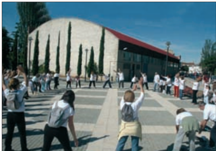
Participantes en la jornada, realizan ejercicios de calentamiento en la plaza del polideportivo de la carretera de Alovera

Incluidas en la II Jornada de Ejercicio Físico, organizada por el Ayuntamiento azudense