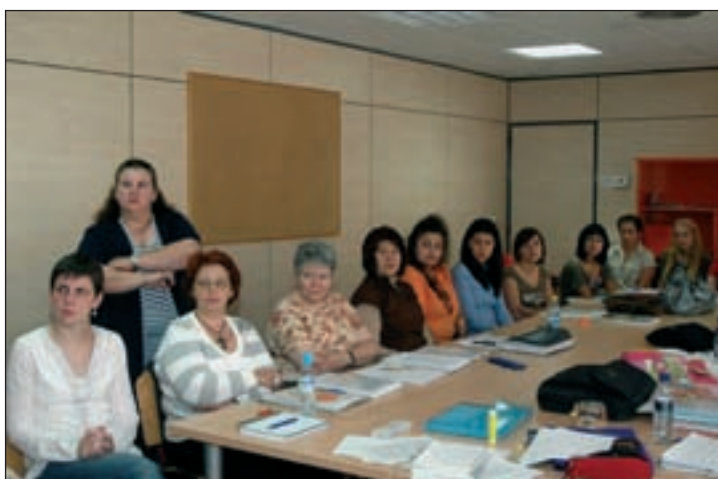
Reunión preparatoria del programa de Atención a la Infancia