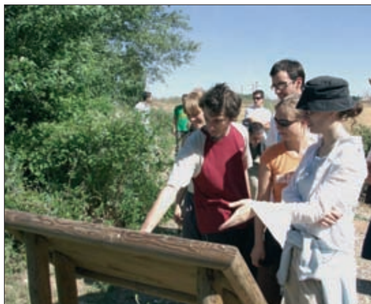
Participantes en el Campo de Trabajo del año pasado, frente a uno de los paneles informativos ubicados en la Reserva

El Ayuntamiento, en colaboración con la Junta, ultima el programa de actividades paralelo, en el que participarán los jóvenes del Campo. "Por supuesto, hemos previsto que los participantes tengan la oportunidad de visitar