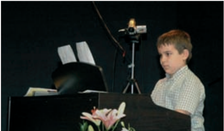
Arriba, exposición de los alumnos de Pintura. Debajo, uno de los alumnos de música, en la exhibición de final de curso

Para niños de 7 a 10 años, acompañados de un familiar adulto