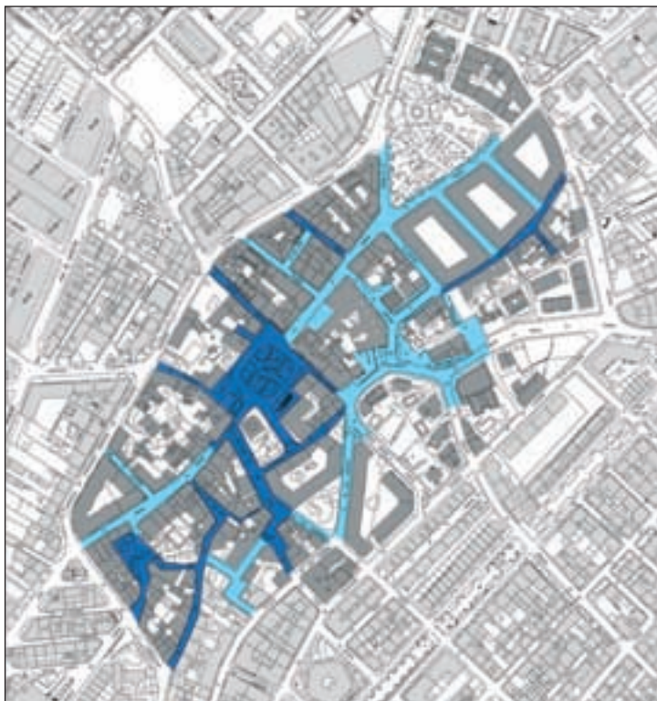
En azul oscuro, tramos del casco que tendrán plataforma única para peatones y vehículos; en azul claro, viales que completarían un área uniforme