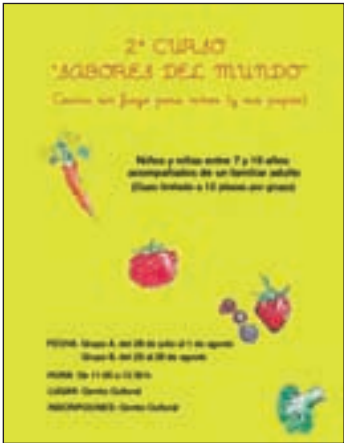
Cartel de promoción del curso

Las plazas –12 por curso– se adjudicarán por orden de inscripción y la matrícula es gratuita. “Aunque se trata de un