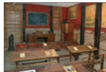
Algunos objetos de la exposición

hizo coincidir con la graduación de los cerca de 200 alumnos de Bachillerato, 4º de la ESO; Garantía Social, Ciclo Medio de Farmacia; Ciclo Medio de Electricidad y Ciclo Superior de Prótesis que han completado sus estudios en el centro.