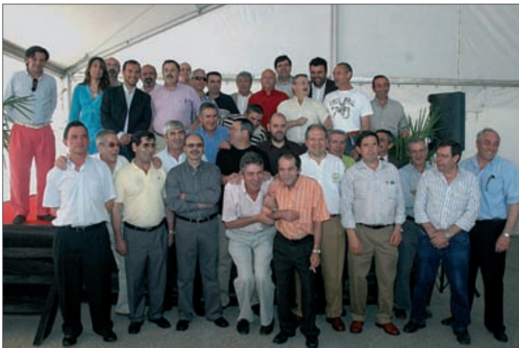
Foto de familia de los trabajadores homenajeados, junto a responsables de la fábrica y del Ayuntamiento de Azuquerra, entre ellos el alcalde y los concejales de Promoción Económica y Hacienda

Coincidiendo con el 40 aniversario de la fábrica