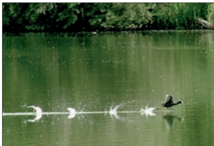
Un ave, sobre la superficie de una de las lagunas de la Reserva