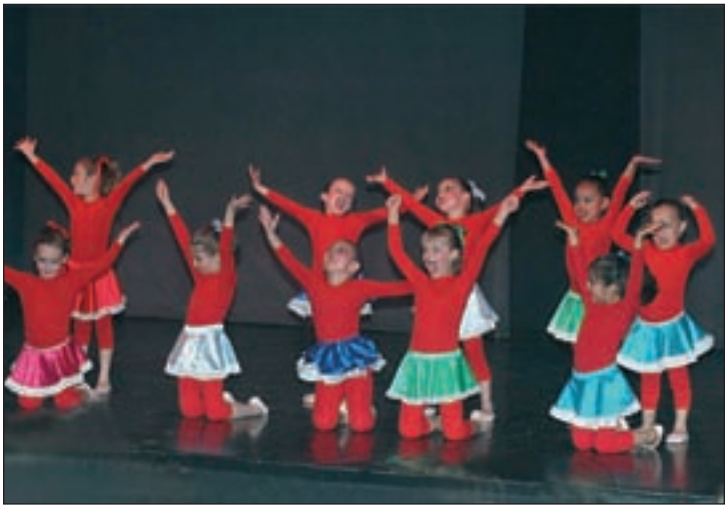
Exhibición de fin de curso de uno de los grupos de danza de los Talleres Municipales