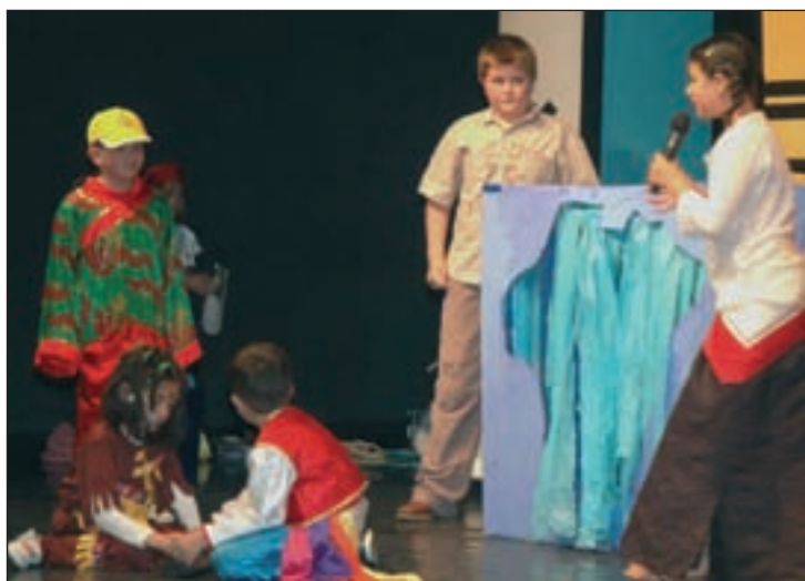
Los más pequeños no faltaron a la ya tradicional cita con los cuentos.

El camerunés Inongo fue el contador invitado