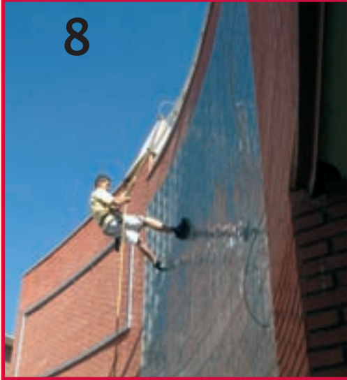
Las paredes de El Foro sirvieron para que los jóvenes practicasen rapel (fotos 8 y 9). Diversión y descarga de adrenalina con todas las medidas de seguridad.