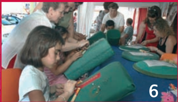
1.-Exhibición del taller de Funky; 2.- 130 jóvenes participaron en el torneo de fútbol tiki-taka; 3, 4, 5 y 6.- Actividades programadas por las asociaciones del municipio.