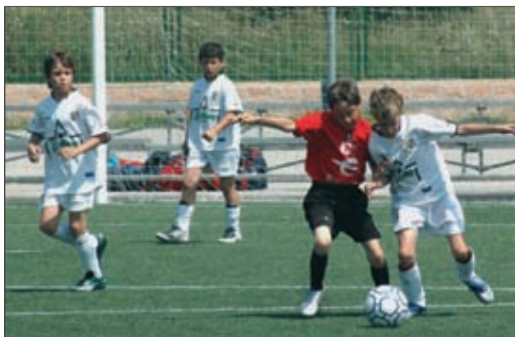
Una jugada en uno de los encuentros del Torneo