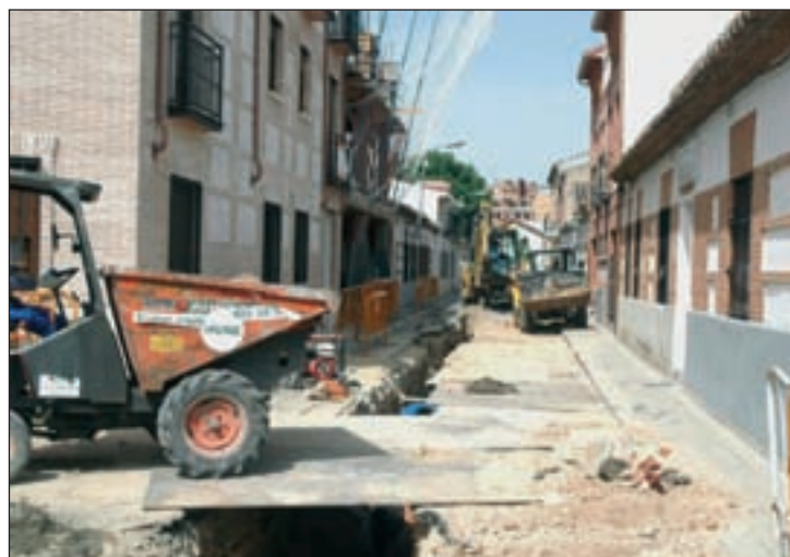
Trabajos en la calle Moraleja