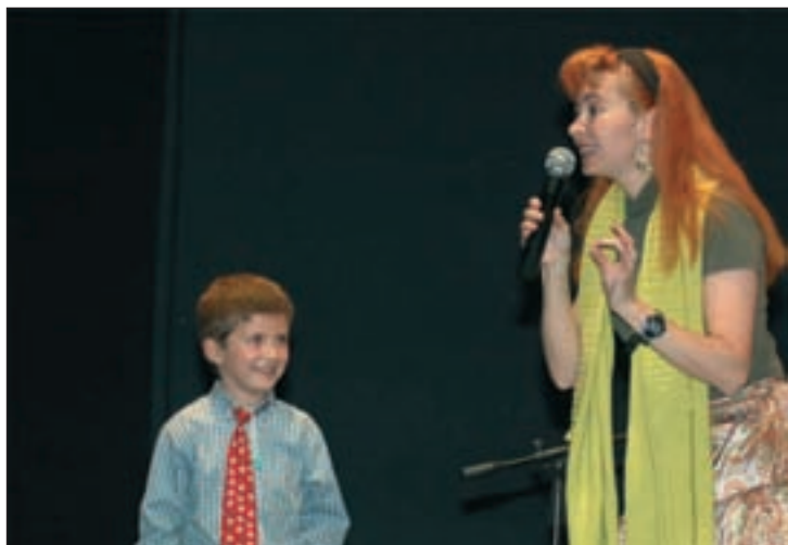
Una de las participantes en el maratón, durante la narración de su cuento

invitado fue el camerunés Inongo Vi Makomé, que acercó a los presentes a las tradiciones africanas.