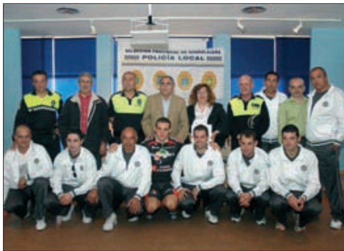
Foto de familia de los integrantes del equipo de la provincia de Guadalajara, junto a representantes de los Ayuntamientos de Azuqueca de Henares y Cabanillas del Campo

"Además de estas medallas, se han sacado buenos resultados en deportes como tiro policial, donde el nivel esta vez ha sido altísi-