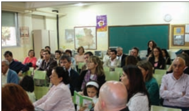
Varios de los asistentes

Es una iniciativa pionera en Guadalajara, según la delegada de Educación