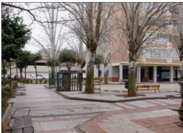
En la imagen superior, plano que detalla la zona en la que se van a llevar a cabo estas obras de remodelación. Abajo, aspecto que muestra la Plaza de Castilla en la actualidad.