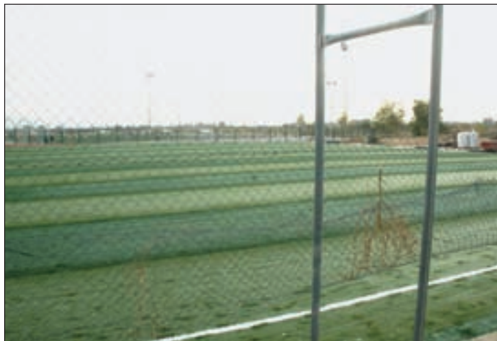
El campo de fútbol 7 está listo para acoger la liga municipal en la que participan 75 equipos.