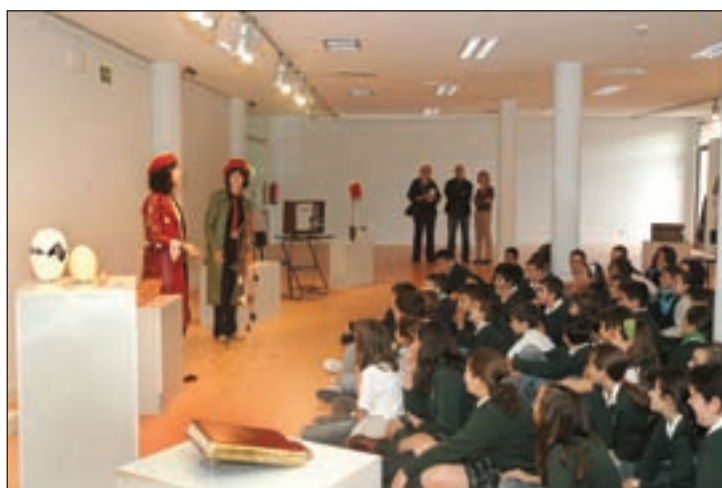
Un momento de la visita guiada a la muestra de la Casa de la Cultura 'Artilugios para contar historias'