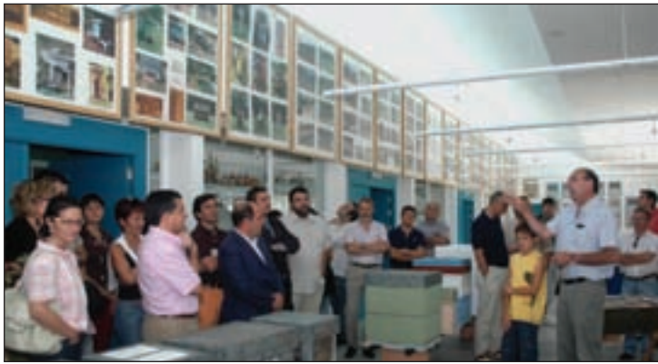
El aula apícola está en la calle San Pablo s/n

Se trata de unas 150 fotografías aproximadamente, en 17 paneles expositores