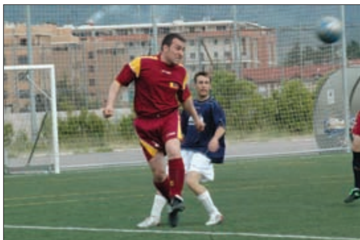
La liga de fútbol siete ha celebrado ya sus primeros encuentros entre las categorías A,B y C

Los grupos A,B y C empezaron el 18 de octubre y los grupos D, E y F, el 9 de noviembre