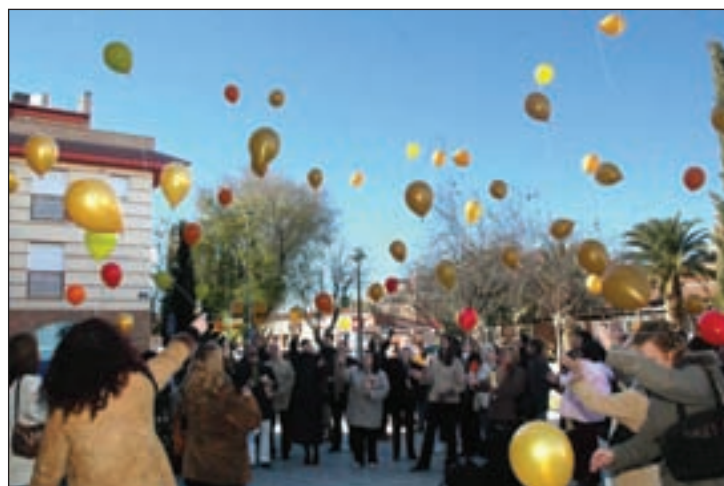
El año pasado se conmemoró el Día Contra la Violencia de Género con una multitudinaria suelta de globos en la plaza de la Casa de la Cultura

Otro de los actos programados es una jornada de sensibilización, que organiza la asociación 'Mujeres por las Mujeres, Juntas Podemos' y con la que tratarán de trasla-