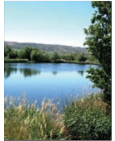
Imagen de Archivo de la reserva no migratorio hacia ambientes más cálidos.

Precisamente, el mes de octubre ha sido una buena fecha para visitar la reserva ornitológica, pues es la época en la que muchas aves la utilizan como un alto en su cami-