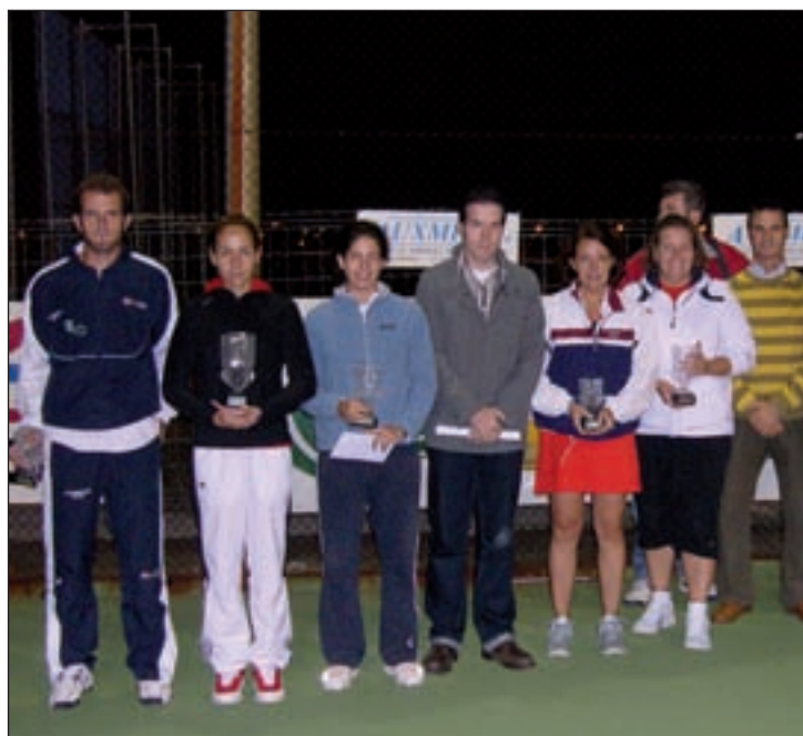
Algunos de los finalistas del Open de Otoño de Tenis