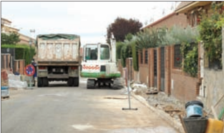
Aspecto actual de una de las calles de La Paloma