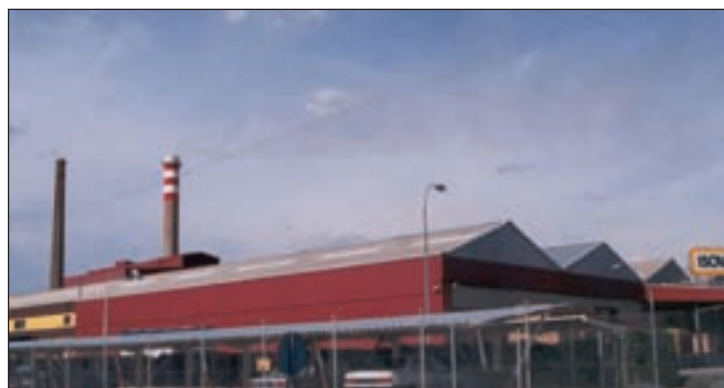
La fábrica de Isover está en el polígono, junto a la autovía.

El pasado lunes 20 de octubre, 13 personas de la localidad empezaron a trabajar para el Ayuntamiento en 10 proyectos, a través de contratos de tres meses de duración a jornada completa. Esta iniciativa está subvencionada por la Junta con 33.735 euros, mientras que el Ayuntamiento aporta 8.104,06 euros.