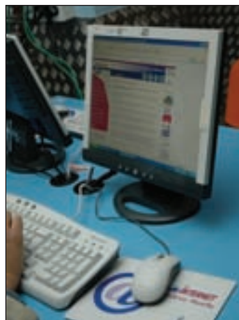
El Aula de Internet del Centro Cultural dispone de 30 equipos.

La oferta se compone de tres propuestas. Todas ellas