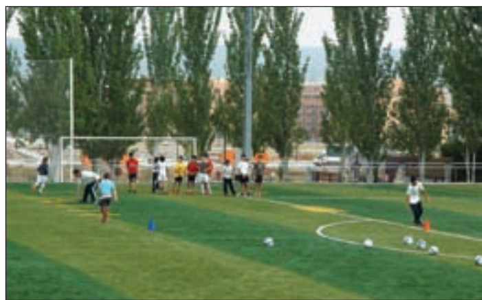
Aspecto actual del campo de fútbol tras la instalación del césped

tendrán que acudir entre el 27 de octubre y el 7 de noviembre a la tienda Deporte y Vida, situada en la avenida de Federico García Lorca. "El objetivo es doble: se trata de equipar a las escuelas, a la vez que se promociona la única tienda de deportes que existe en la localidad, en colaboración con el Plan de Dinamización del Comercio puesto en marcha por el Ayuntamiento", señala Escudero, quien indica que desde la Concejalía, se informará de manera pormenorizada a los alumnos de cada una de las escuelas.