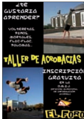
Cartel del nuevo taller

Los interesados ya pueden inscribirse y recibir más información en la Oficina Municipal de Información Juvenil (OMIJ),