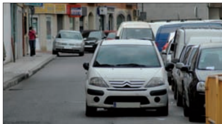
El nuevo servicio de grúa de la Mancomunidad pretende acabar con los problemas provocados por los vehículos mal estacionados

Para establecer la cuantía de las tasas por el servicio de grúa, la Mancomunidad ha realizado un estudio comparativo entre los precios fijados en otros municipios cercanos como Guadalajara, Alcalá de Henares y Madrid. A partir de estos datos, "hemos hecho una media y hemos fijado cobrar por retirada 75 euros, lo mismo que cuesta el desplazamiento de la grúa, mientras que la estancia en el depósito tendrá un coste de 10 euros por día", puntualiza