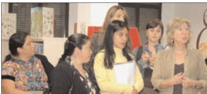
Una delegación de Guatemala visitó en octubre la Biblioteca Municipal