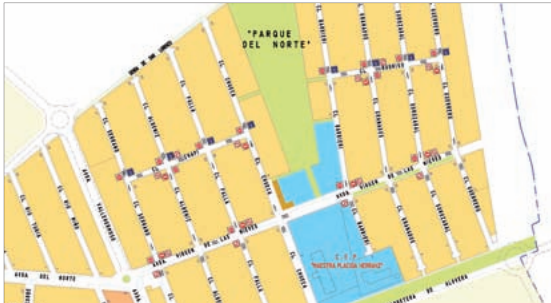
Plano con los cambios de circulación introducidos en las calles del barrio de Vallehermoso