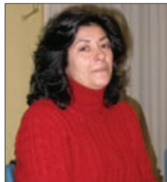
La escritora Almudena Grandes

Grandes cumple así la promesa que realizó en octubre de 2006, cuando acudió al bautizo de las remodeladas instalaciones del Centro Cultural. En ese acto se impulsó, además, el nombre de esta escritora a la Biblioteca en agradecimiento por su disponibilidad para compartir su tiempo con los miembros de