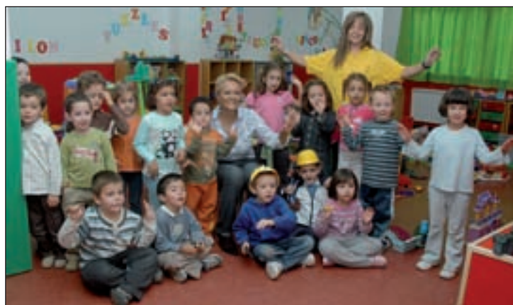
La Ludoteca persigue la educación en valores a través del juego

La responsable municipal detallaba que "para la adecuación del local se han necesitado 40.000 euros; en personal se invertirá de aquí a final de año, unos 30.000 euros y, en cuanto a equipamiento, se destinarán unos 10.000 euros al mobiliario, cifra a la que hay que sumar el gasto en la adquisición del material necesario para la gestión del Centro y para las actividades que se van a impulsar con los chicos".