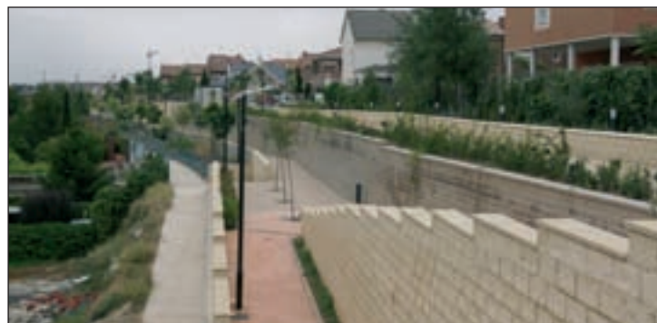
Parque de El Lavadero, donde el Ayuntamiento va a colocar tres zonas de juegos infantiles

El concejal también ha explicado que se están terminando los trabajos en la zona de juegos infantiles ubicada en la avenida del Ferrocarril, justo detrás del edificio de El Foro. "Hemos