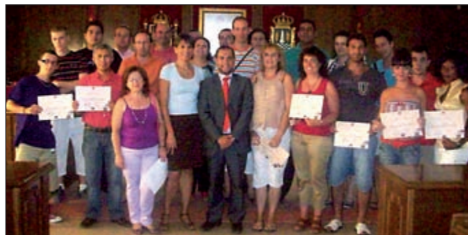
Foto de familia con el alcalde de los recién diplomados en los cursos de operador de carretillas, atención al cliente e informática