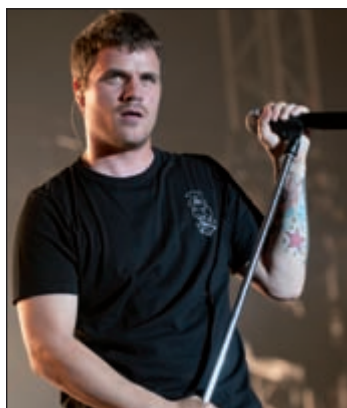
Dani Martín, cantante de El Canto del Loco, en plena actuación

Al cierre de esta edición de AZUCAHICA, más de 3.700 personas ya habían adquirido su entrada para ver en directo a la banda que lidera Dani Martín. Las localidades están a la venta en la tienda Musicalia de Azuqueca (carretera de Alovera, 12), el Centro Comercial La Dehesa de Alcalá de Henares, Discos López de Guadalajara y a través de Servicaixa. Tienen un precio de 20 euros, aunque para los menores de 8 años el acceso al recinto será gratuito.