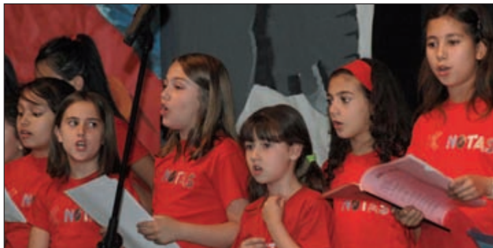
Como novedad, este año se han incorporado las clases de coro

“Por ahora, ya son 433 los antiguos alumnos que han renovado su matrícula, pero falta conocer la cifra exacta de nuevas incorporaciones”, señala el edil. Al cierre de este AZUCAHICA, estaba previsto que el plazo para que los alumnos de nueva admisión, que son más de 270,