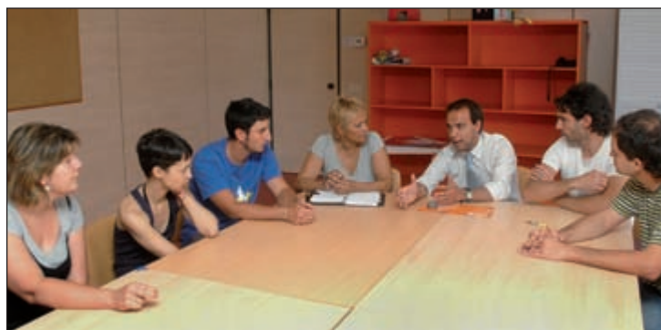
El alcalde de Azuqueca y la concejala de Servicios Sociales se reunieron en julio con el equipo de técnicos del PRIS para intercambiar ideas