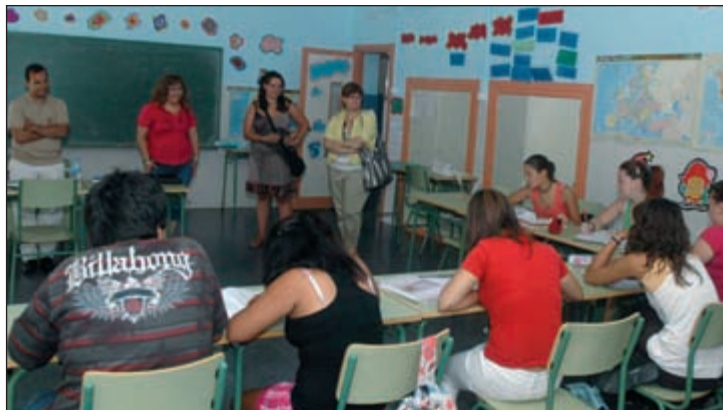
El alcalde de Azuqueca, junto a la concejala de Educación y dos representantes de la Dirección General de Participación e Igualdad de la Consejería de Educación, en la visita que realizaron el 18 de agosto a los alumnos de este programa

Las clases se dirigían a alumnos de tercer y cuarto curso de la ESO que tuviesen alguna asignatura suspensa, así como a aquellos estudiantes que se estuvieran preparando las pruebas de acceso a los ciclos formativos de grado medio. Cada participante recibió entre una y cuatro horas diarias de apoyo académico en función de las materias que tuviera pendientes. "Matemáticas, Inglés y Lengua y Literatura fueron las asignaturas que