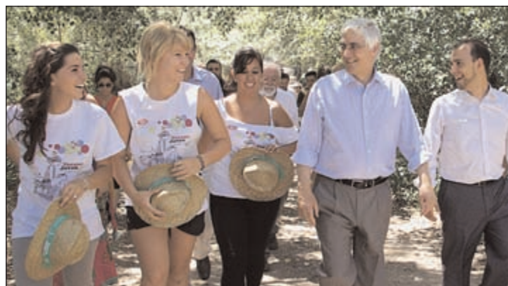
El presidente de Castilla-La Mancha y el alcalde de Azuqueca, junto a tres voluntarias

Por tercer año consecutivo, la Reserva Ornitológica Municipal albergó un campo de trabajo internacional, que se desarrolló del 11 al 31 de julio y contó con 23 voluntarios procedentes de Alemania, Polonia, República Checa, Francia, Reino Unido y España, en concreto, de Castilla-La Mancha, Castilla y León, Andalucía y País Vasco. El presidente de Castilla-La Mancha, José María Barreda, visitó este enclave natural para conocer de primera mano el desarrollo del Campo de Trabajo. Barreda intercambió impresiones con los voluntarios que a su vez le mostraron algunos de los esfuerzos