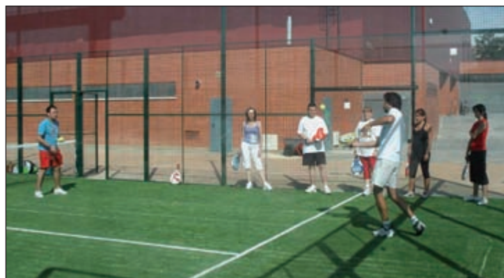
Las clases de pádel del Azuverano han sido las más solicitadas del programa registrando un total de 145 alumnos

En cuanto a la actividad con mayor demanda ha sido el pádel con 145 alumnos puesto que "Azuqueca disponía por primera vez de instalaciones para su práctica con la apertura de tres pistas, junto al polideportivo de la calle Poeta Manuel Martínez (más información en la página 27)", concluyó el concejal azudense.