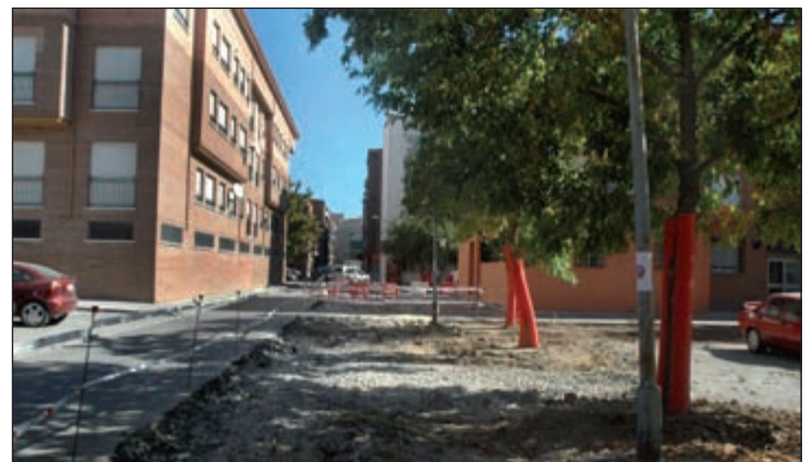
La calle de San Isidro, en el barrio de la Estación, donde ya han comenzado los trabajos de remodelación