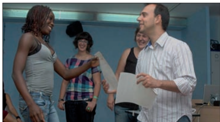
Una de las participantes recoge su diploma de manos del alcalde

Este taller tenía un doble objetivo. "Por un lado, parte de la mañana se dedicaba a apoyo escolar para que los participantes repasaran las materias en las que necesitaban mejorar. Por el otro, también se potenciaba su tiempo de ocio organizando diferentes actividades como manualidades o juegos", explica la responsable municipal del área.