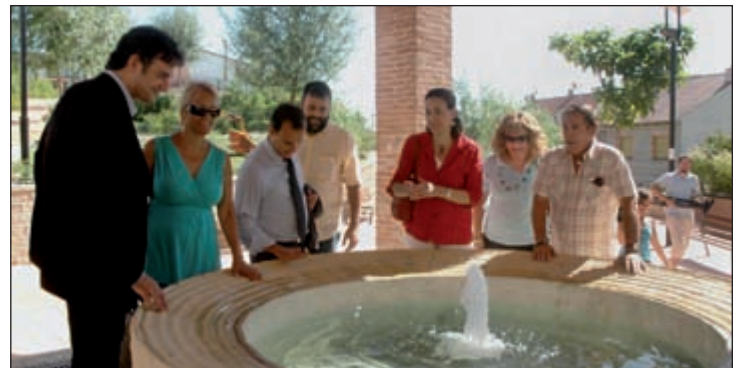
La consejera (de rojo), junto al alcalde y varios ediles, durante su visita al barrio de El Vallejo

Según establece el Plan Funcional, el proyecto deberá contemplar, entre otras dependencias, un Área de Asistencia General y otra de Pediatría, una zona de atención urgente y, distintas unidades de apoyo. También dispondrá de un Bloque de Actuación Médica Especial y servicio de Fisioterapia y extracción de muestras.