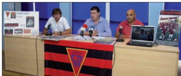
El entrenador, el presidente y el secretario general del Club Deportivo Azuqueca, en la presentación de la temporada 2009/2010

Por otra parte, el equipo femenino jugará la próxima