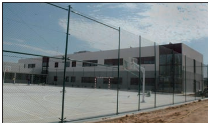
Fachada del nuevo colegio de Azuqueca

"En cuanto a las obras, son los propios centros los que nos