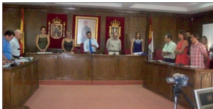
Parte de la corporación guarda un minuto de silencio al inicio del Pleno para condenar el asesinato de Eduardo Puelles ocurrido el 19 de junio a manos de ETA y el posterior atentado contra la casa cuartel de Burgos del 29 de julio

En el proyecto de ampliación se prevé dotar a la piscina de una zona de aguas activas de, al menos, 200 metros cuadrados; de una zona terapéutica y de tratamiento de 100 metros cuadrados, y la reforma y ampliación de los vestuarios, que pasarán de ocupar los algo menos de 100 metros cuadrados actuales a 200. Esta ampliación, valorada en 1.400.000 euros, se materializará en la parcela aledaña a la piscina, que tiene una superficie de 760 metros cuadrados edificables, y será asumida por la empresa adjudicataria, que también se hará cargo del equipamiento de las salas, presupuestado en 230.000 euros. El responsable municipal de Deportes ha resaltado que en el pliego de contratación se establece que la empresa adjudicataria deberá garantizar que los trabajadores actuales de la piscina que sean subrogados deberán conservar sus condiciones actuales de trabajo. "Ningún trabajador municipal