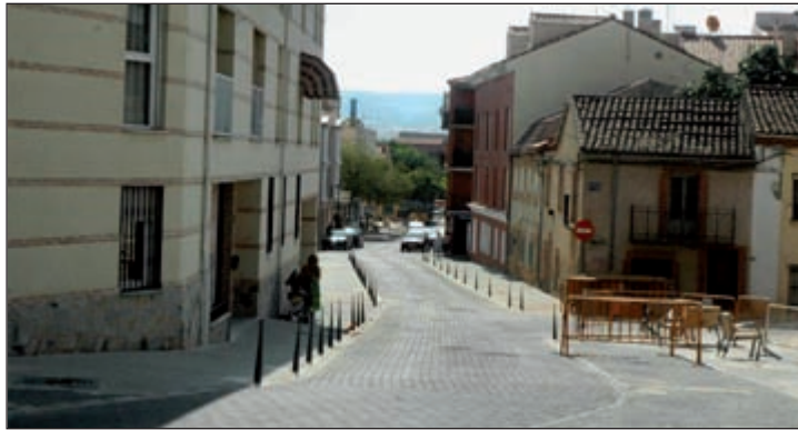
La 'Plataforma Única' en el cruce de las calles Mayor y Tejar