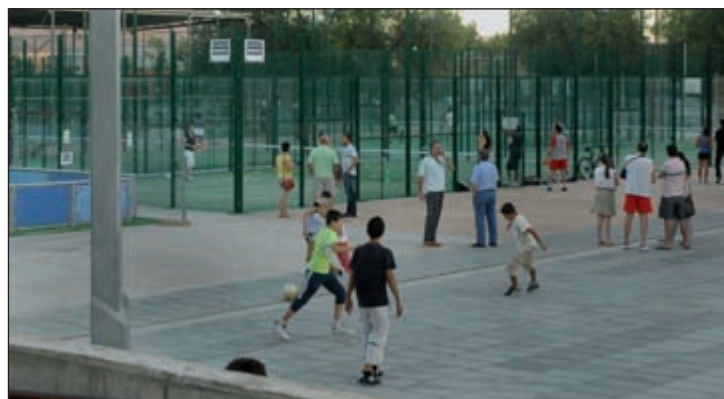
Las pistas de pádel se completan con otra multideportiva y dos canchas de baloncesto