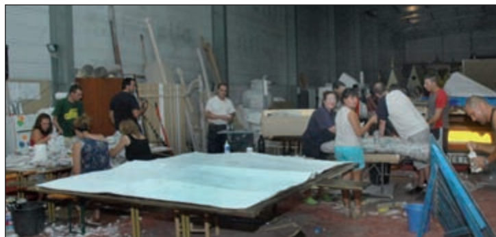
Los peñistas han trabajado durante más de dos meses en las carrozas

El domingo 20, a las 21 horas El XXXIV desfile de carrozas se celebrará el domingo 20 de septiembre, a las 21 horas. A él invitó el alcalde a todos los vecinos, así como a personas de otras localidades, al tiempo que afirmó que, en base a su última visita a las naves donde trabajan los peñistas, “esta edición el desfile va a superarse y a alcanzar todas las expectativas”.