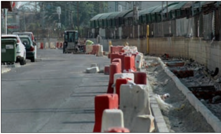
Esta actuación permitirá estacionar a ambos lados

La calle pasa a tener sentido único de circulación