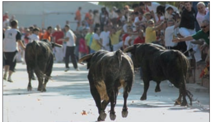
Encierro celebrado en 2008 en las Fiestas de Septiembre de Azuqueca

“Todos los encierros se van a celebrar por la mañana.