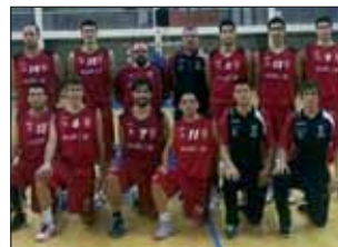
Plantilla del ALZA Básquet Azuqueca

El Alza Básquet Azuqueca se enfrenta a los últimos partidos de liga con el objetivo de sumar dos victorias y permanecer la próxima temporada en EBA. Para ello, tratarán de superar al CB San Isidro, en su cita del 5 de mayo en Tenerife, y aún necesitarían otra victoria o ante el Meridiano o ante el Quintanar, ambos situados en puestos de 'play-off' en la clasificación. De cara a estos últimos encuentros, el equipo