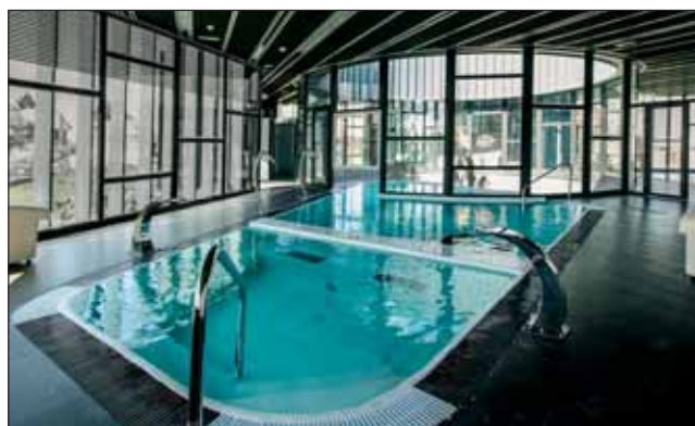
La segunda piscina de la nueva instalación cuenta con un circuito de hidroterapia completo.

el edil. Según detalla la empresa, este nuevo espacio consta de dos áreas diferenciadas: una piscina de 1,45 metros de profundidad y una zona de balneario. Esta última, compuesta por una segunda piscina, consta de un circuito completo de hidroterapia formado por dos cuellos de cisne, dos cascadas, dos camas de burbujas, dos asientos de burbujas, chorros subacuáticos y una zona de piscina exterior con burbujas. Otro espacio está destinado a las duchas, que ofrecen tratamientos diferenciados de hidroterapia y cromoterapia. El balneario cuenta también con un baño