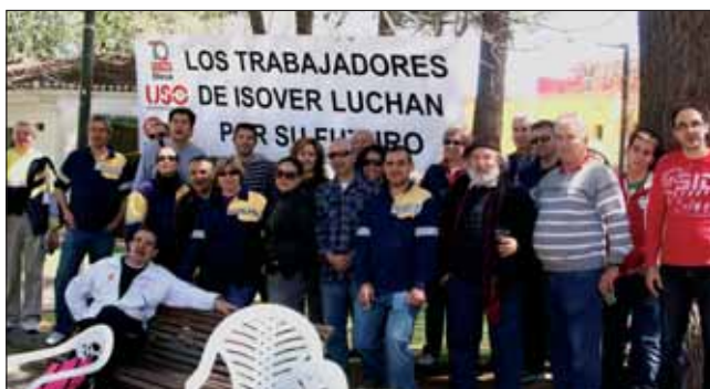
Trabajadores de Isover durante una comida celebrada en el Parque de La Constitución para visibilizar sus reivindicaciones laborales

Los trabajadores apoyaron el 24 de abril el principio de acuerdo sobre el Convenio