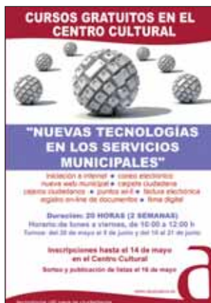
Cartel promocional de los cursos

El plazo de inscripción en los cursos está abierto hasta el día 14 de mayo, en la Casa de la Cultura y, si el número de inscritos superara el de plazas ofertadas (quince por grupo), se hará un sorteo el día 16 de mayo y, a continuación se publicarán las listas.