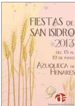
Cartel de las fiestas

La Fiesta de la Espiga, de Interés Turístico Provincial (15 de mayo); la concentración de rondas y la muestra en la Casa de la Cultura, así como el Día del Caballo (sábado 18); el Día de la Bici y la concentración motera (domingo 19) serán las actividades con más parti-