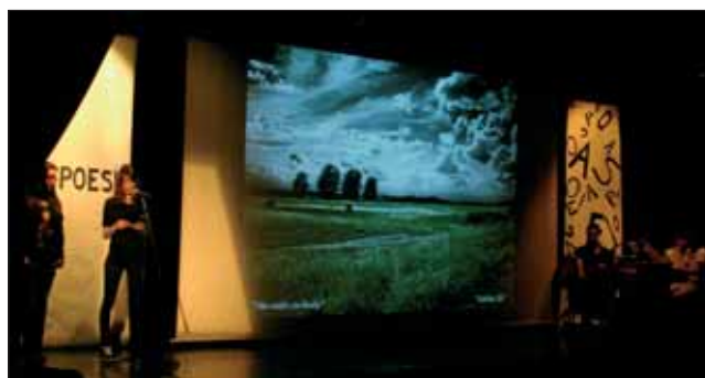
Más de un centenar de alumnos participaron en el maratón poético