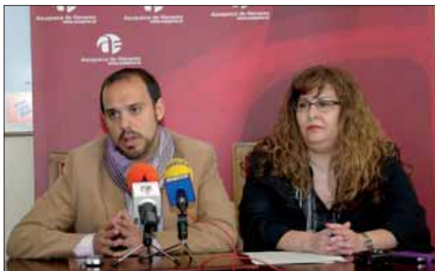
El alcalde y la concejala de Educación, en la presentación del programa

La comisión técnica que ha estado trabajando en la puesta en marcha del programa ha detectado 187 niños con carencias alimentarias, distribuidos entre los siete colegios del municipio. "Han sido los tutores, el profesorado de los centros y los servicios sociales municipales quienes han realizado este