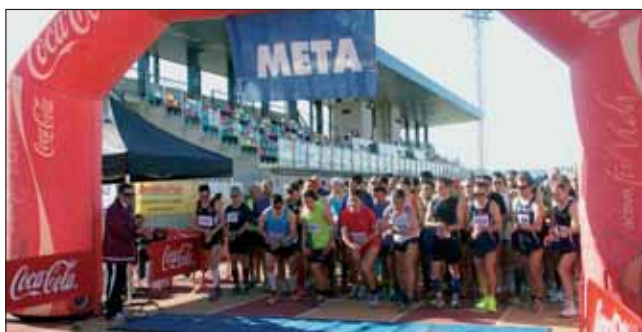
Salida multitudinaria desde la pista de Atletismo