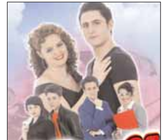
Cartel de 'Grease'

El sábado 11 de mayo, a las 19 horas, llega a Azuqueca el espectáculo musical 'Grease', en un montaje del Grupo Ritmo Musical. Las entradas, que se podrán adquirir una hora y media antes del comienzo de la función en taquilla, además de en los cajeros ciudadanos y a través de la web municipal tie-