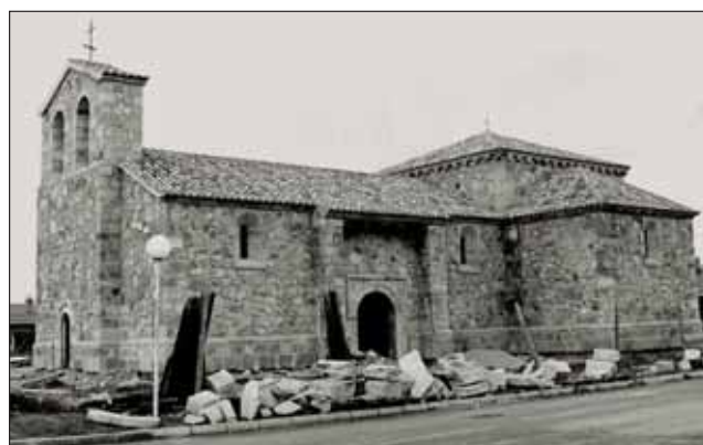
Imagen de marzo de 1987, de la iglesia reconstruida en Asfain

El proyecto de reconstrucción de la iglesia en Asfain comenzó en verano de 1983, aunque las piedras estaban acopiadas en Azuqueca desde hacía algún tiempo, según confirma el entonces párroco, Antonio de Gregorio. En marzo de 1984, se celebró