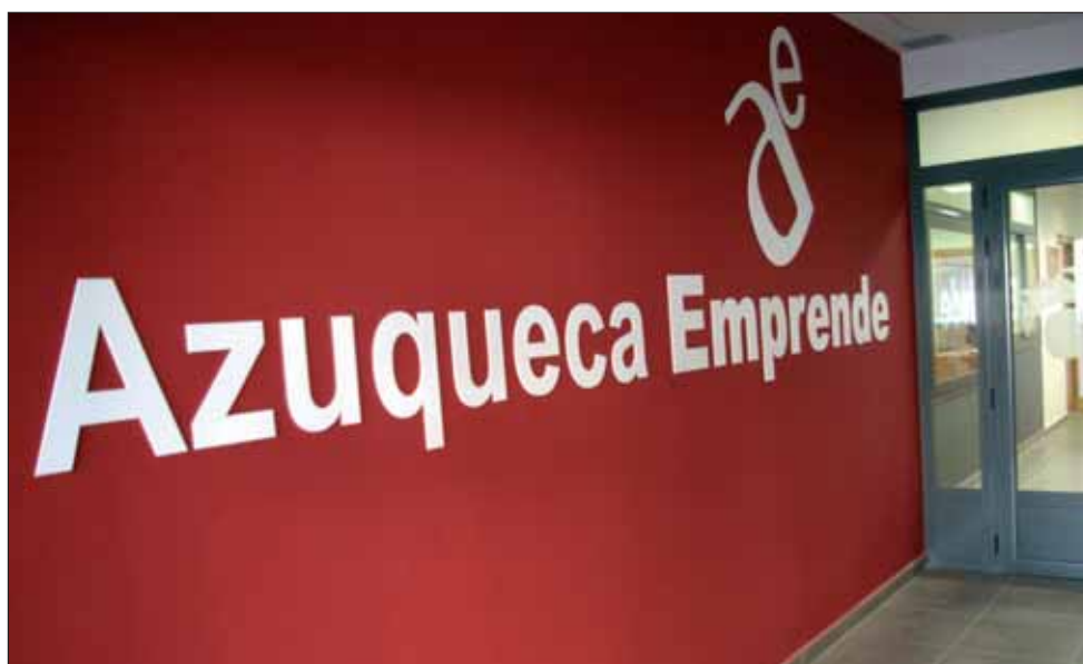
El Centro de Empresas se encuentra en Avenida de los Escritores, 10 y 12

El Centro de Empresas 'Azuqueca Emprende' es desde hace seis meses un servicio municipal, integral y público, cuyo objetivo es apoyar e impulsar la actividad emprendedora, empresarial y comercial. Combina unas instalaciones totalmente equipadas con apoyo técnico y personalizado