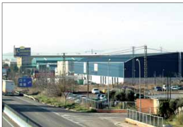
Las instalaciones deportivas podrán ubicarse en vías con acceso desde la autovía y desde el casco urbano de Azuqueca

“Se trata de abrir la puerta a la implantación de gimnasios y otras instalaciones deportivas, como pistas de pádel, que pueden encajar en las naves industriales sin uso”, señaló el concejal, que aclaró que las actividades se podrán desarrollar en ciertas vías de suelo industrial con acceso desde el casco y desde la autovía y que la modificación de la ordenanza “sólo afecta a los usos