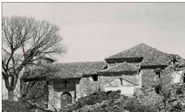
La iglesia, en su ubicación original, en Alcorlo, antes de su traslado

"Hubo vecinos que colaboraron en el traslado, haciendo portes de piedras, y muchos echaron una mano en las obras también", relata, agradecido, el sacerdote.