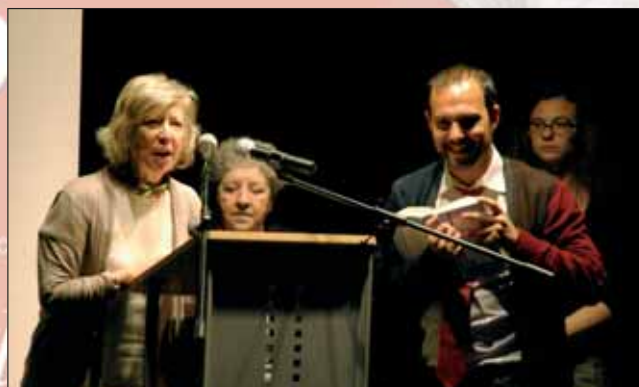
En primer plano, la directora de la biblioteca y el alcalde, durante la lectura de El Quijote, organizada por el Círculo de Bellas Artes

La Casa de la Cultura acogió diversos actos en torno al Día del Libro, al que también se sumó la comunidad educativa