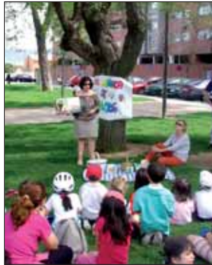
Primera sesión del BiciCuento

Por otra parte, el programa familiar 'Una merienda de cuentos', dirigido a niños de