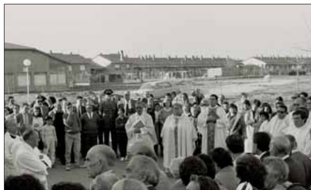
Acto celebrado en marzo de 1988 para inaugurar la iglesia en Azuqueca