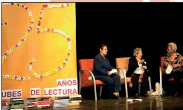
Integrantes de los clubes de Lectura durante el homenaje '25 años compartiendo lectura'