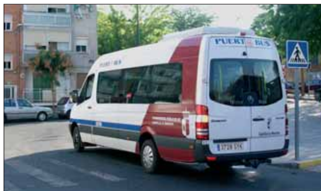
Un vehículo del Astra en la Estación de Azuqueca