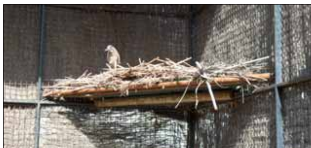
Uno de los ejemplares de martinete, instalado en la Reserva azudense.

Un ave de ojos rojos, de la familia de las garzas y de hábitos crepusculares. - El martinete es un ave migratoria, que llega a estas latitudes en primavera y se marcha tras la cría. De tamaño medio y de la familia de las garzas, este pájaro de hábitos crepusculares y nocturnos muestra como elemento más llamativo unos ojos de color rojo intenso y tres largas plumas que le nacen en la nuca.