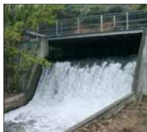
Imagen de Beleña, el pantano que abastece a la MAS, desembalsando