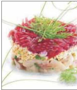
Las tapas tienen que ser diseñadas para la ocasión