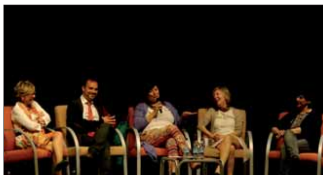
La autora (en el centro de la imagen, flanqueada por el alcalde y la directora de la biblioteca y dos integrantes de los clubes de lectura), el pasado 23 de abril en la Casa de la Cultura de Azuqueca

R.- He visto a sus integrantes crecer en aplomo, en seguridad, en autoestima y en satisfacción. Creo que los clubes de