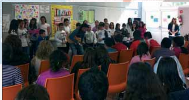
Acto de lectura de poemas protagonizado por la comunidad educativa.