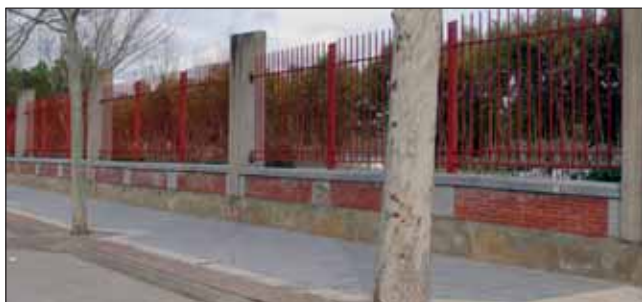
Uno de los quioscos irá en la entrada del parque de La Quebradilla.

Por otra parte, continúa el procedimiento administrativo iniciado por el Ayuntamiento para adjudicar la gestión de la cafetería de la Casa de la Cultura.