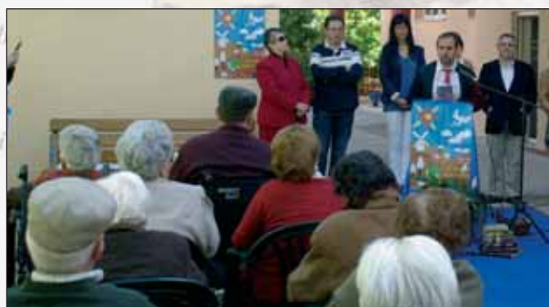
Usuarios de Las Acacias participan en El Día del Libro. – En el Centro de Día Las Acacias se leyó el libro 'El río que nos lleva' del escritor recientemente fallecido José Luis Sampedro, en el marco de los actos de conmemoración del Día del Libro.