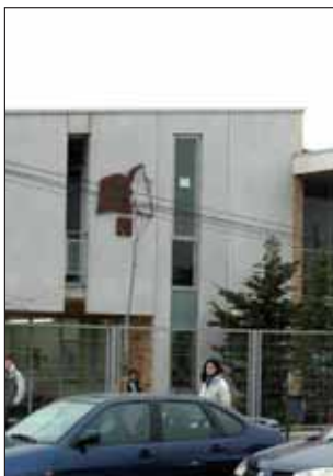
La EMIA comparte instalaciones con el IES Domínguez Ortiz

Los interesados deben dirigirse a la secretaria de la Escuela, ubicada en el instituto Profesor Domínguez Ortiz.