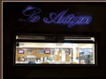
LA ANTIGUA 1: Avd. Torrelaguna 11 · Tel. 949 261 376 Azuqueca de Henares

Servicio de reparto diario a hostelería y empresas