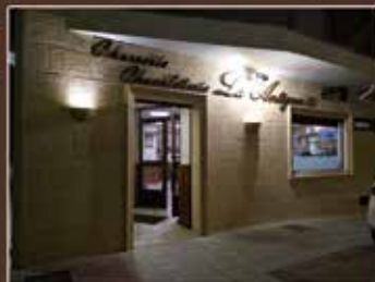
LA ANTIGUA 2: C/ Río Sorbe nº 2 (antiguo bar Diamante) Tel. 949 87 57 01 · Azuqueca de Henares