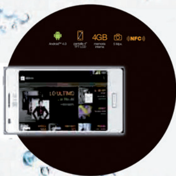
LG Optimus L5

Promoción Válida en: Tienda ORANGE Azuqueca de Henares Av. Constitución N°10 19200 - Azuqueca de Henares Guadalajara.