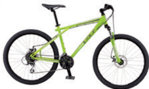
GT Aggressor 1.0 2013