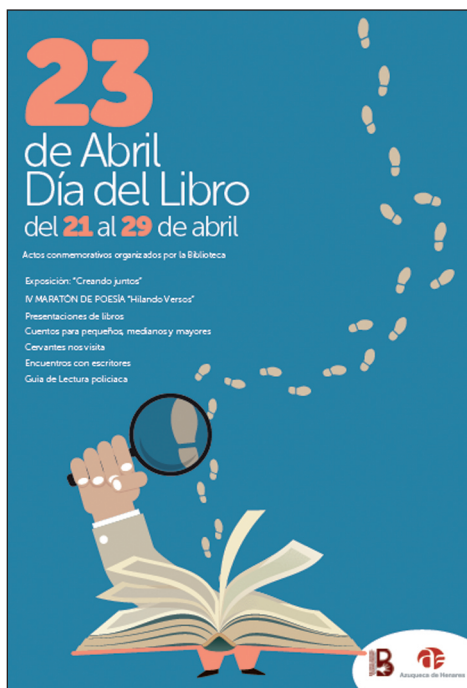
Cartel del Día del Libro

El programa municipal del Día del Libro, que se desarrolla entre el 21 y el 29 de abril, incluye la exposición ‘Creando juntos’, la cuarta edición del Maratón de Poesía ‘Hilando versos’, así como presentaciones de libros, sesiones de cuentos, una conferencia sobre Cervantes y encuentros con escritores. También se ha preparado una guía de lectura policíaca, que ofrece una selección de títulos y materiales de la