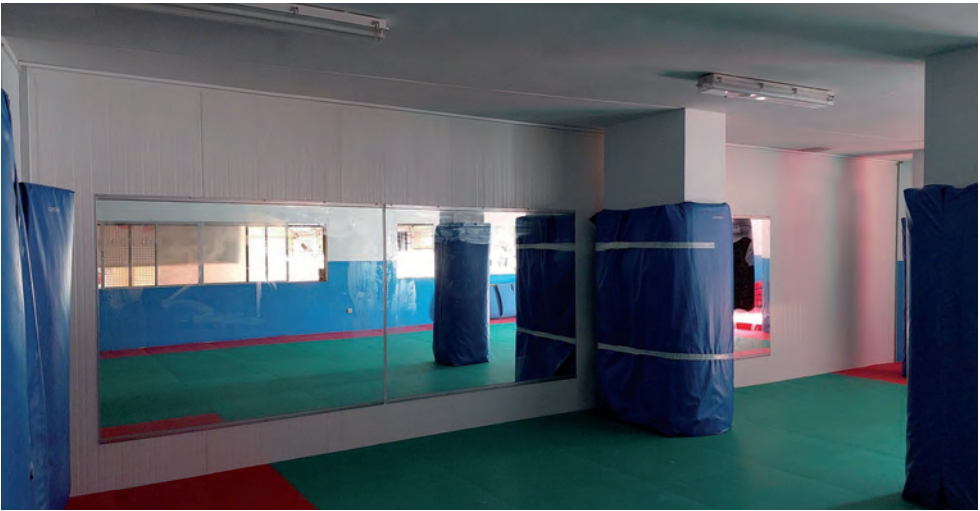
Imagen del gimnasio, con los espejos instalados recientemente

El edil añade que esta actuación “se suma