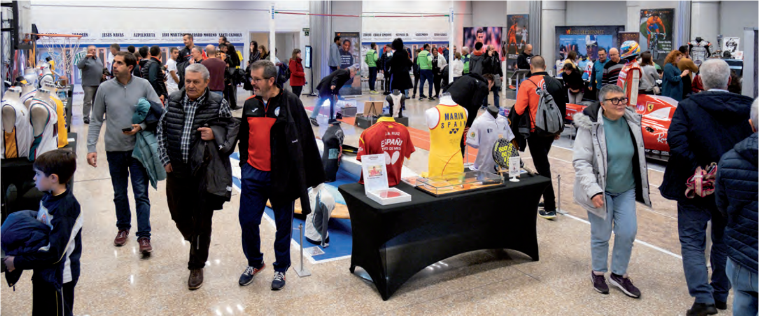
Vista general de una de las salas de la exposición ‘Leyendas del Deporte’ instalada en el Espacio Joven Europeo