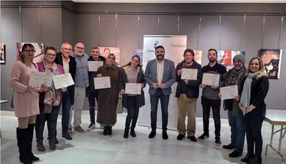
Participantes en el RECUAL que ha finalizado, junto al alcalde y los concejales Europa y de Igualdad

La subvención de la Junta para el programa ha sido de 97.767,36 euros y los alumnos han obtenido el Certificado de Profesionalidad de revestimientos continuos de la construcción, tras completar 960 horas formativas y de