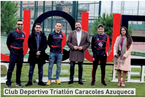
Club Deportivo Triatlón Caracoles Azuqueca