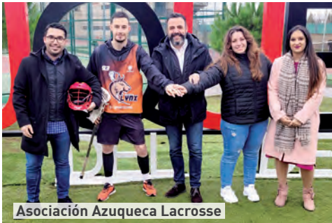
Asociación Azuqueca Lacrosse