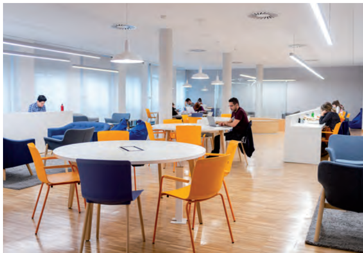
Imagen de archivo de la sala de estudio en la planta baja de la Casa de la Cultura

En el caso de la convocatoria de máster o postgrado, se contempla una ayuda del 10 por ciento del coste total y hasta un máximo de 800 euros. Como requisitos, entre otros, era necesario ser titular de la Tarjeta Ciudadana, estar en posesión del título de Licenciado o Diplomado universitario, Bachillerato o Formación Profesional de Grado Medio o de Grado Superior y estar matriculado en algún curso de máster o postgrado en el momento de presentar la solicitud. Para la concesión de las becas, se atendió al orden de presentación y se valoró la renta familiar per cápita , con preferencia a las rentas más bajas.