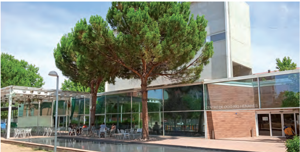
El Centro de Ocio Río Henares acogerá la oficina itinerante de renovación del DNI

Si se trata de un cambio de domicilio, hay que