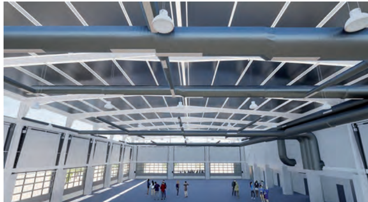
Recreación del interior del futuro edificio