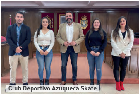
Club Deportivo Azuqueca Skate

➤ Con el apoyo a la práctica de lacrosse, tenis, tiro con arco, triatlón, gimnasia y patinaje