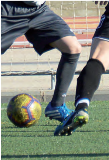
Imagen de archivo de un partido de la Liga Municipal de Fútbol 7

La fase final se ha programado en dos fines de semana: el 4 y 5 de febrero y el 13 y 14 de mayo. En cuanto al sorteo de cuartos, “no se podrán enfrentar entre sí los primeros clasificados de cada grupo ni del mismo grupo”, aclara