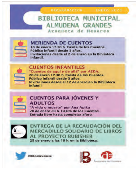
Cartel con la programación de enero

Además, el día 25, se hará el acto de entrega al proyecto Bubisher de la recaudación obtenida en el mercadillo de libros organizado por la Biblioteca y los clubes de lectura. En esta ocasión, se recaudaron 1.484 euros que se destinarán a acercar la lectura a la población de los campamentos de refugiados saharauis. •