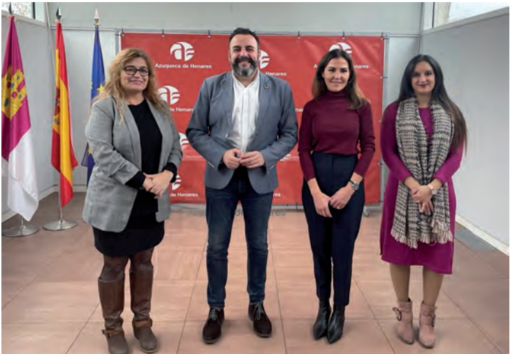
Responsables municipales y la presidenta del Colegio de Farmacéuticos, tras la firma del convenio

sumidores de cinco o más medicamentos de forma crónica y que no estén institucionalizados en un centro sociosanitario. Los farmacéuticos de Azuqueca preparan la medicación sólida que debe tomar cada paciente, de acuerdo con la pauta prescrita por su médico, en un dispositivo similar a un blíster de comprimidos identificado con los logotipos del Ayuntamiento de Azuqueca de Henares y del Colegio Oficial de Farmacéuticos de Guadalajara. La toma de la medicación está claramente identificada en estos envases con los días de la semana y los diferentes momentos del día (desayuno, comida, cena y noche). Se trata de envases de un solo