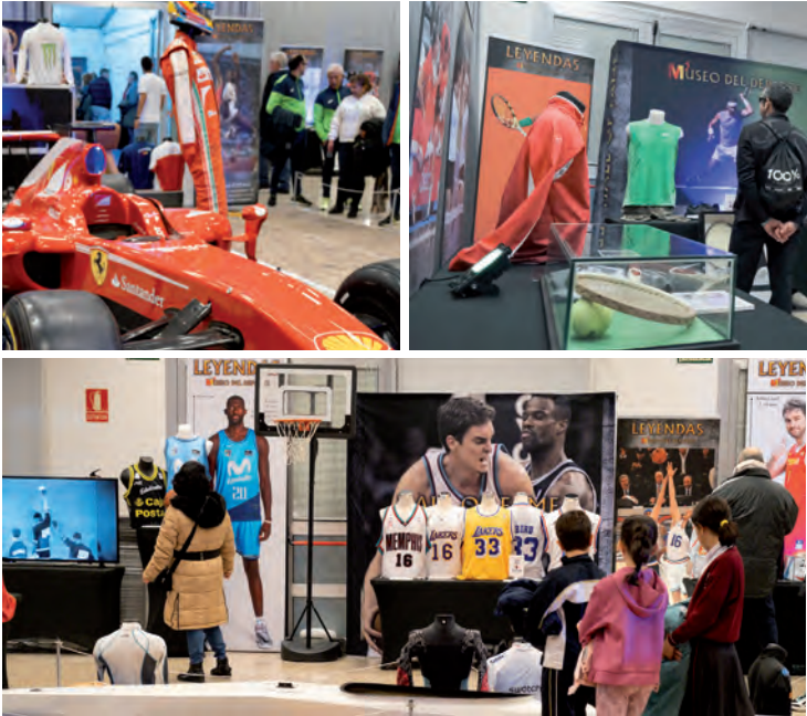
Detalle de algunos de los materiales y deportes de la muestra