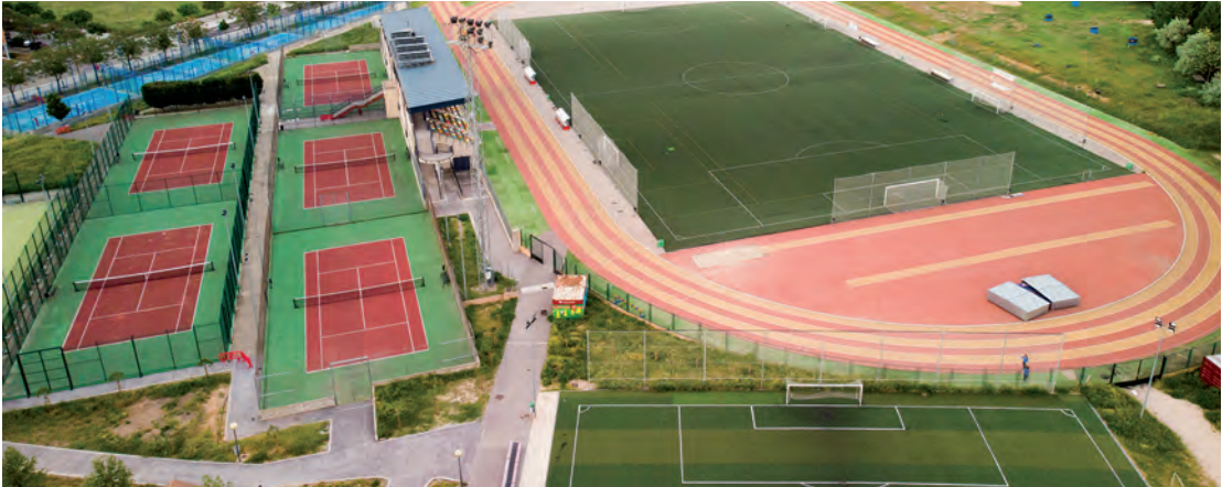
Vista aérea de archivo de las instalaciones del San Miguel

En la adjudicación se han previsto también los trabajos previos (protección de la pista de atletismo mientras se realizan las obras, retirada de los materiales actuales o preparación de las superficies, entre otros), así como los posteriores a la instalación del nuevo césped (marcaje de los campos según la reglamentación exigida por la Real Federación