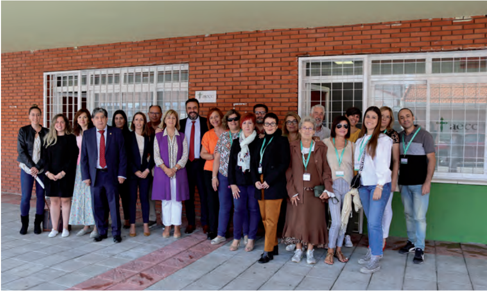
Representantes del Ayuntamiento y de la Asociación, frente a la sede, el pasado mes de octubre