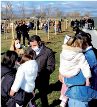
Imagen de archivo de una plantación realizada en enero de 2022

De cara a la nueva temporada del programa municipal ‘En Azuqueca, nace un bebé, nace un árbol’, el Ayuntamiento ha adjudicado por un importe de 36.138,54 euros, impuestos incluidos, el contrato del suministro de árboles y de los servicios de plantación a la empresa Paisajes Sostenibles S.L.