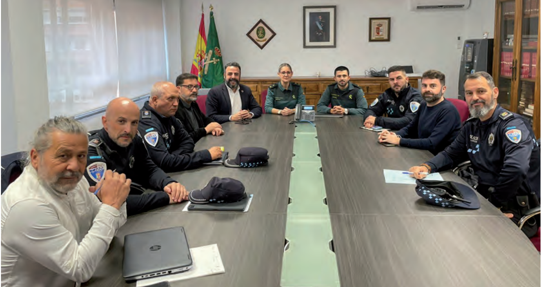
Un momento de la reunión para informar sobre la operación MEL que desarrolla la Guardia Civil en los municipios de Azuqueca de Henares, Alovera, Cabanillas del Campo y El Casar

Descenso de delitos en un 18 por ciento El primer edil se mostró satisfecho por los resultados obtenidos