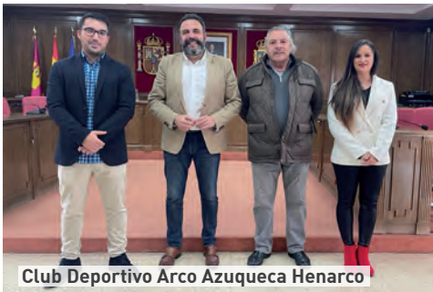
Club Deportivo Arco Azuqueca Henarco