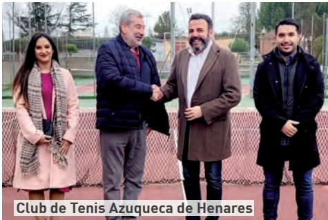
Club de Tenis Azuqueca de Henares