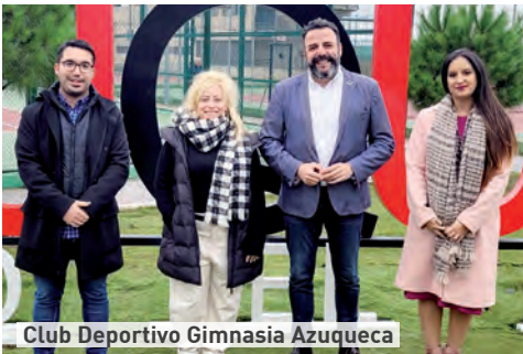
Club Deportivo Gimnasia Azuqueca