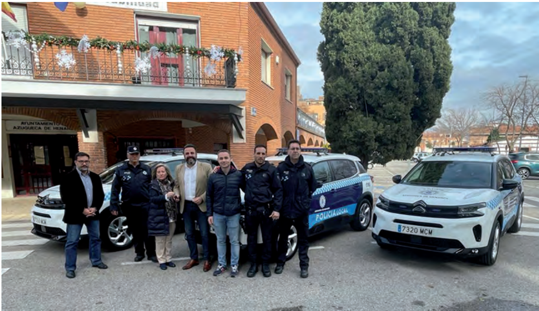
Responsables municipales, de la Policía Local y del concesionario, junto a los tres nuevos vehículos, a la puerta del Ayuntamiento