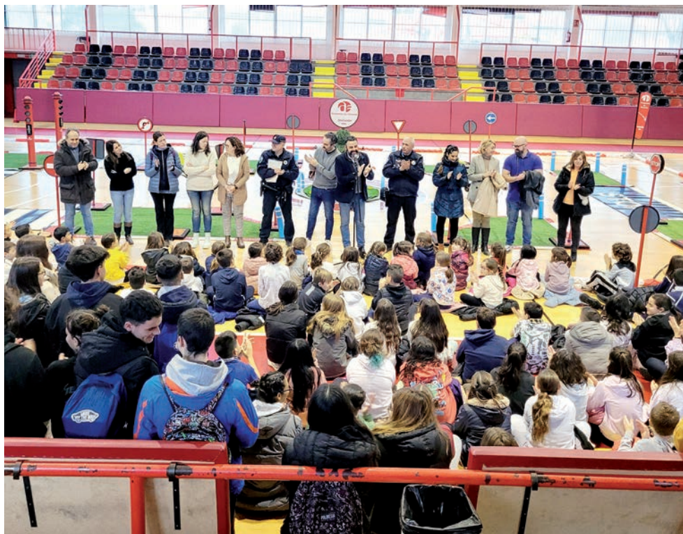
El programa se presentó el 17 de enero, en el polideportivo municipal de La Paz

En el marco del programa para fomentar el uso de la bicicleta, se van a desarrollar las actividades englobadas en 'Azuqueca se mueve en bici' . "Desde el Ayuntamiento apostamos por una movilidad sostenible, tratando de reducir los desplazamientos en vehículos privados", destaca el regidor, que anima a las y los estudiantes a utilizar la bicicleta en sus desplazamientos. Blanco recuerda que "los autobuses urbanos de Azuqueca son gratuitos para cualquier persona, con el fin de facilitar la movilidad sostenible".