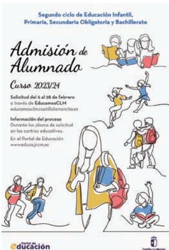
Cartel del proceso de admisión de alumnado 2023/2024

Las solicitudes tendrán que ser presentadas, preferentemente,