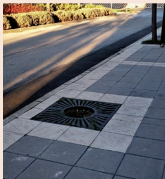
Un alcorque vacío