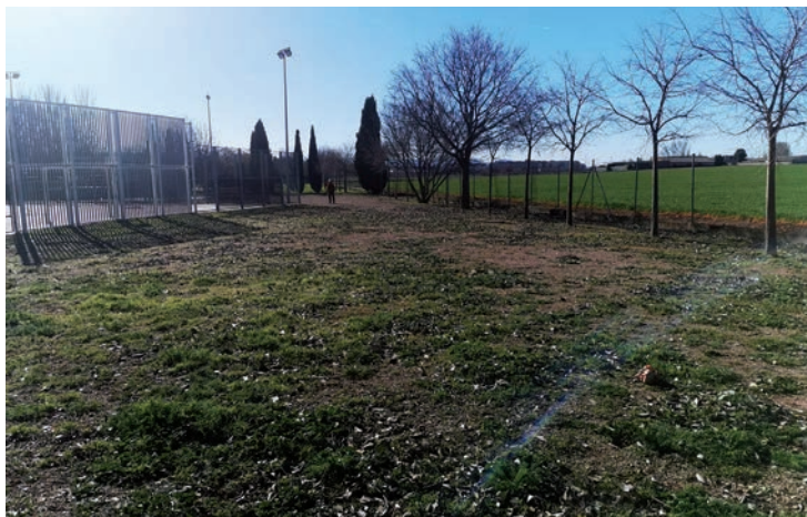
Zona del parque del Norte donde se acondicionará el espacio canino

➤ En una superficie de 1.000 metros cuadrados, se instalará un circuito, bancos y una fuente