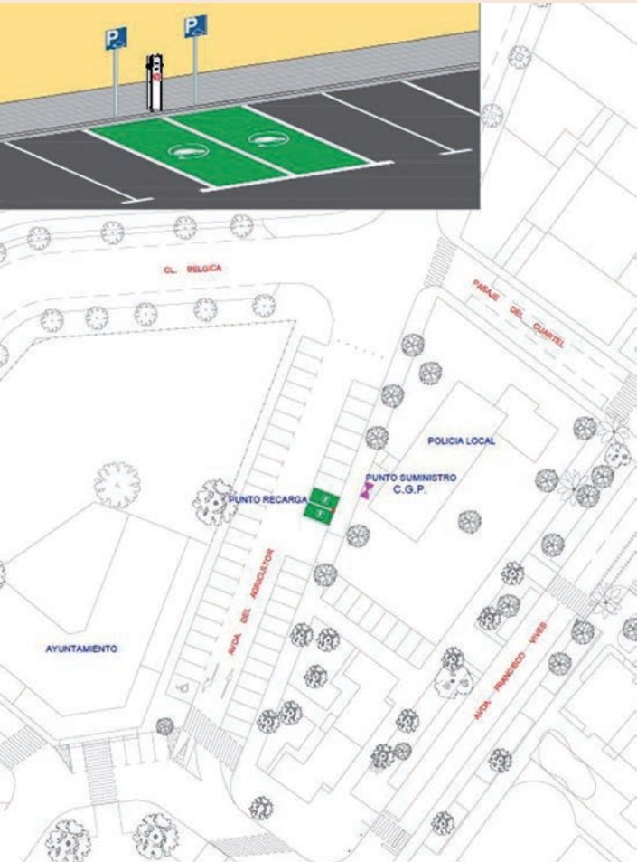
Plano de la ubicación del punto de carga de vehículos eléctricos que va a instalar el Ayuntamiento. En la parte superior, simulación del cargador

El edil explica que ahora se pone en marcha la licitación de la instalación únicamente. “La gestión de cobros por el uso y el mantenimiento del punto se sacarán a licitación posteriormente”, adelanta. •