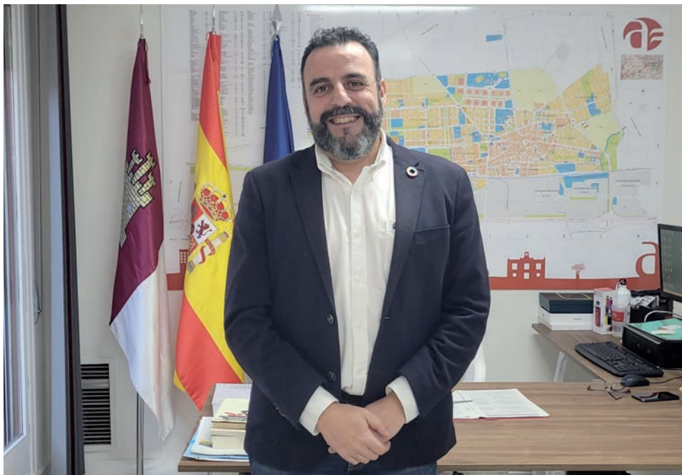
El alcalde, en su despacho del Ayuntamiento

El año 2022, ha terminado con numerosos proyectos puestos en marcha por el Ayuntamiento de Azuqueca y ha sido especialmente favorable en materia de creación de empleo. El alcalde, también responsable de Economía y Hacienda, asegura que la situación económica es buena y que a lo largo de la legislatura se han podido afrontar inversiones importantes que transformarán la ciudad.