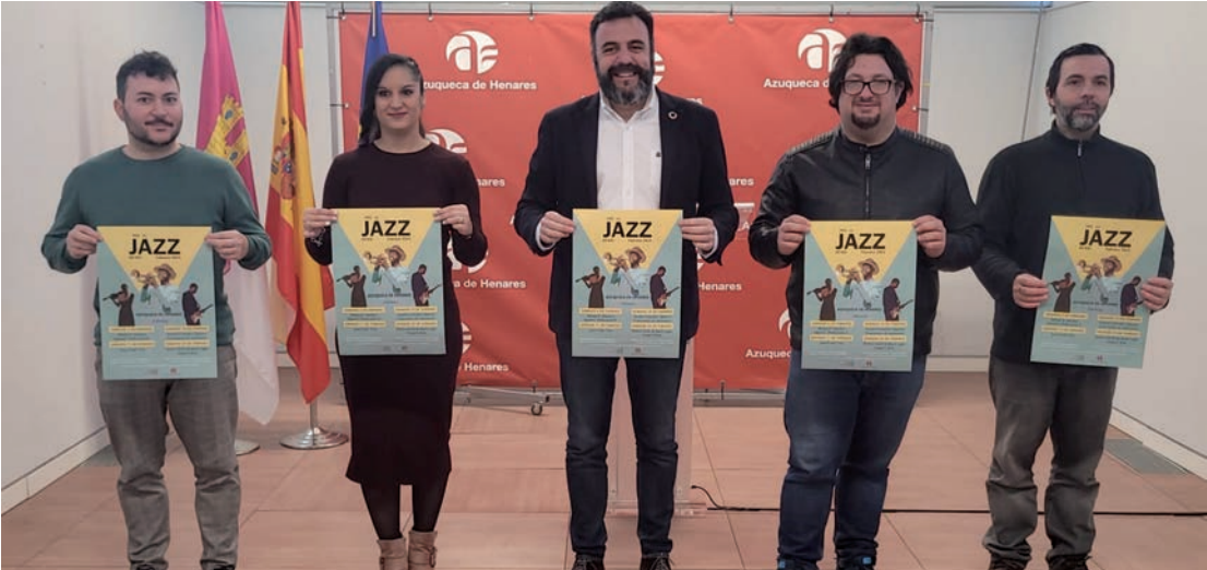
El alcalde, flanqueado por los concejales y los trabajadores del área municipal de Cultura, durante la presentación del Mes del Jazz, el pasado 23 de enero