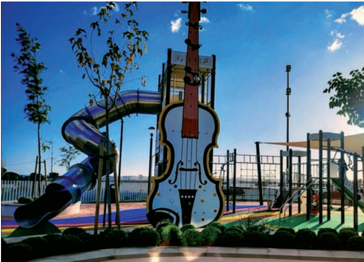
Un violín será el elemento central del área de juego de la plaza de La Rioja