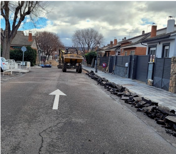
Imagen de la calle Altamira, durante las obras

El Ayuntamiento adjudicó las obras por 154.846,54 euros a la empresa OPS, que pidió “en noviembre una ampliación de plazos por los problemas en la actuación en la calle Almendros, donde se produjo la rotura de varias acometidas”, detalla el concejal de Ciudad Sostenible, Antonio Expósito. •