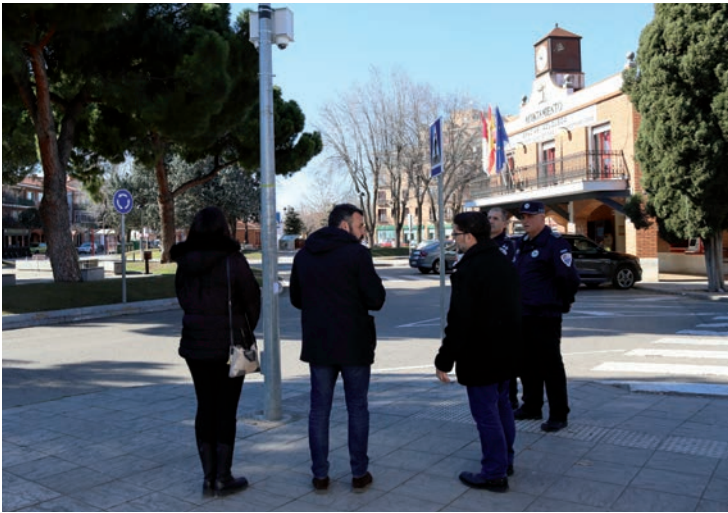
Cámara instalada en el entorno de la plaza de La Constitución y del Ayuntamiento