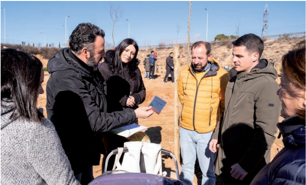
El alcalde, junto a la concejala de Innovación Urbana y el edil de Ciudad Sostenible, muestra la placa de identificación de uno de los árboles plantados el 22 de enero en el paseo de la Estación

“Pusimos en marcha esta iniciativa en el año 2017 para aumentar el número de árboles de Azuqueca, al tiempo que contribuimos a crear ciudad porque vinculamos estas plantaciones con bebés, a cuyas familias se entrega el denominado título de enraizamiento que une árbol con el niño o la niña”, recuerda el regidor. “Ya hemos plantado más de 4.700 árboles y, con ello, se ha mejorado la calidad medioambiental del municipio”, detalla José Luis Blanco, quien destaca que el Ayuntamiento fue reconocido el pasado año 2022 con el premio Escoba de Plata concedido por