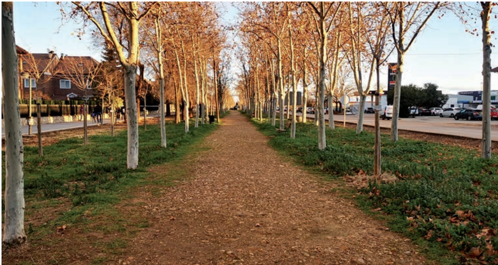
Imagen actual de la zona en la que se va actuar