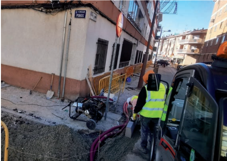
Trabajos en la avenida de Guadalajara, esquina con la calle Pobos

tan importante para la economía y la vida en la ciudad, con el objetivo no sólo de que se mantenga, sino que pueda seguir creciendo”, insiste el primer edil.