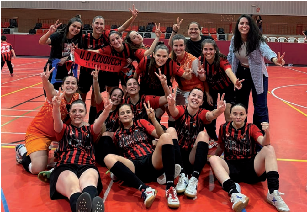
El equipo femenino de la UD Azuqueca FS celebra el ascenso.