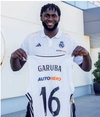
Garuba posa con la camiseta del Real Madrid.

El Real Madrid C.F. comunicó el 20 de agosto el fichaje de Usman Garuba, vecino de Azuqueca de Henares, para las próximas tres temporadas, hasta el 30 de junio de 2027. El ala-pívot afronta así una segunda etapa en el club blanco después de jugar tres temporadas en la NBA, la máxima competición del baloncesto de Estados Unidos, en concreto, con los Houston Rockets (2021 a 2023) y los Golden State Warriors (2023/2024).