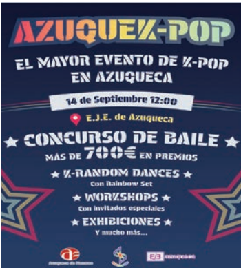
Cartel promocional de la actividad

El concurso de baile suma un total de 38 inscripciones -el plazo para participar estuvo abierto entre el 20 de julio y el 16 de agosto- y dispone de dos categorías: Individual y Grupal. Está previsto que las actuaciones comiencen a las 17 horas y concluya a las 19 horas (una hora por modalidad). Se han establecido dos premios y una mención especial por categoría por un importe de 150 euros, 75 euros y una tarjeta regalo de 30 euros en Individual y de 300, 150 y tarjeta de 50 euros en Grupal.