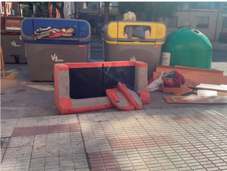
Depositar muebles, enseres o voluminosos junto a los contenedores provoca problemas de limpieza

Aumento de la vigilancia y sanciones de hasta 1.500 euros De manera complementaria a este llamamiento al civismo, la Policía Local va a intensificar