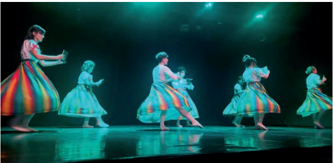
Imagen de archivo de la actuación de fin de curso del taller municipal de Danza

En el periodo de preinscripción, se recibieron cerca de 400 solicitudes para una oferta que incluye clases de danza, interpretación, guitarra clásica y flamenca y jardín musical, guitarra moderna, piano y flauta travesera, piano moderno y teclado, batería, canto, artes plásticas infantil y juvenil, dibujo para adultos, pintura libre para adultos, procedimientos pictóricos, lenguajes e investigación pictórica, escultura, cerámica, manualidades, cestería y restauración de muebles y objetos etnográficos. •