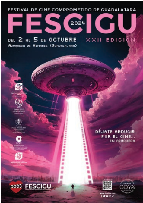
Cartel del Festival

Sección Requetecortos. Compuesta por 14 cortos de ficción y animación de no más de seis minutos, esta sección se ha programado para el sábado 5 de octubre, antes de la Gala de Clausura y entrega de los Premios Picazo. Los premios los otorga el público.