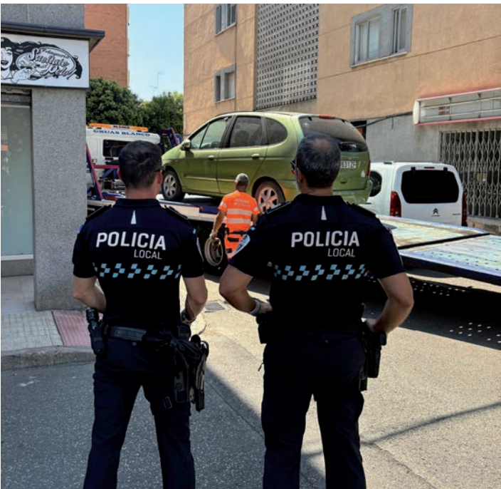
La grúa retira un vehículo abandonado en la vía pública de Azuqueca en presencia de la Policía Local