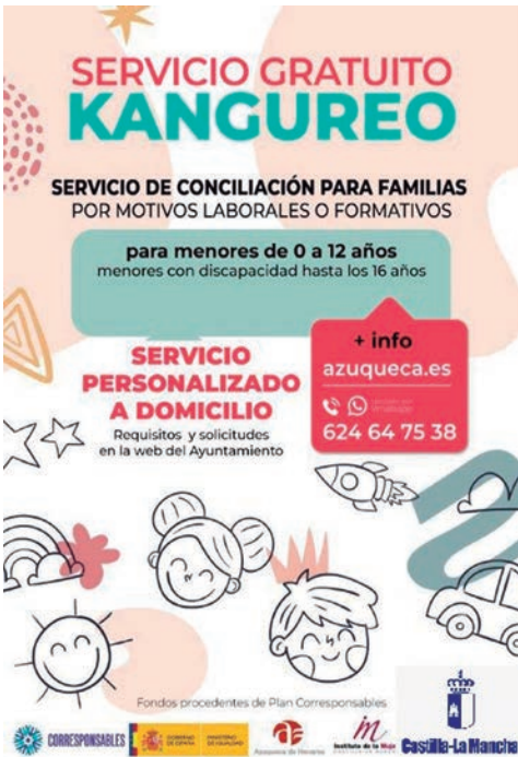
Cartel informativo del servicio Kangureo del Ayuntamiento de Azuqueca

Este año, el Servicio de Kangureo en Azuqueca empezó a prestarse en abril y está previsto que se mantenga hasta octubre. En estos primeros cuatro meses de funcionamiento de 2024, han sido atendidos más de 40 menores.