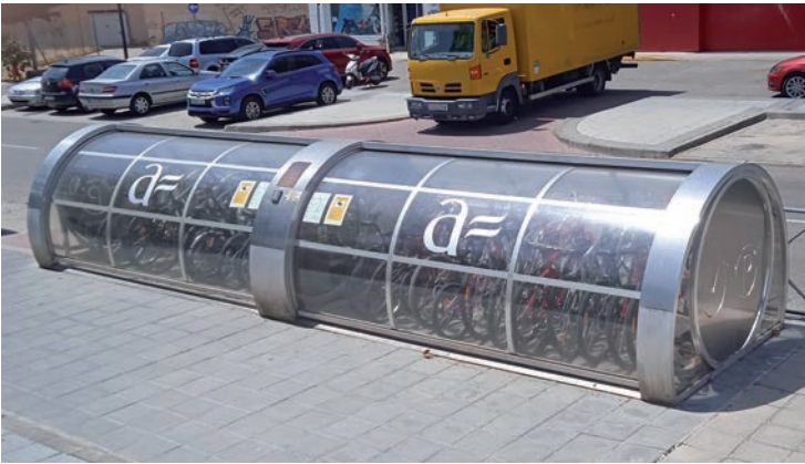
El aparcamiento cubierto de bicicletas se ubica en el paseo de la Estación, junto a la estación de tren

“Este aparcamiento cubierto, situado junto a la estación de tren, forma parte de las herramientas de promoción de la movilidad sostenible en Azuqueca de Henares y el objetivo del Ayuntamiento es que funcione de manera correcta y ofrezca un servicio adaptado a las necesidades de las