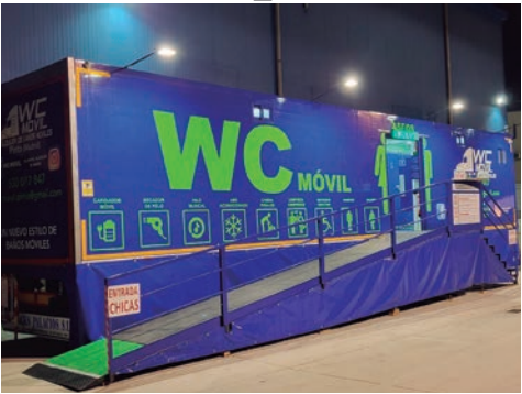
Volverán a instalarse los denominados aseos De Luxe

Como en los últimos años, se van a instalar cuatro camiones de aseos públicos de alta calidad (De Luxe). “Habrá uno en el Recinto Ferial, otro en las proximidades de las carpas de las peñas ubicadas junto al Ferial, un tercero