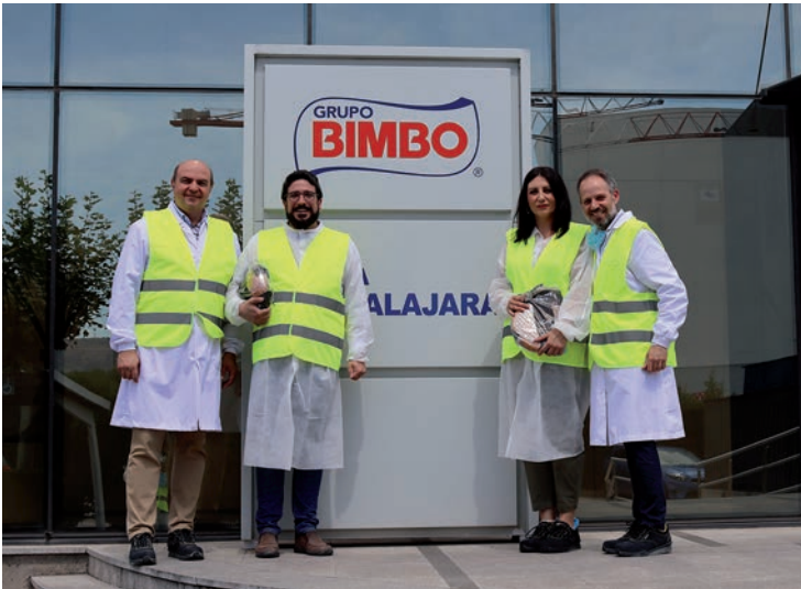
Los responsables municipales y de la empresa, a la entrada de fábrica Bimbo en Miralcampo

Los responsables de Grupo Bimbo informaron de las últimas mejoras incorporadas a la producción, como la instalación de paneles solares destinados a autoconsumo y la mejora del sistema de depuración propio con la implementación del proceso biológico al proceso físico-químico con el que ya contaba la planta.