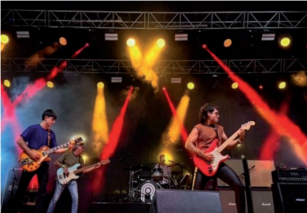
Concierto de Volvoreta en el festival Candil Rock del pasado 22 de junio.

El equipo femenino de la Unión Deportiva Azuqueca Fútbol Sala y el grupo musical Volvoreta recibirán la placa de Populares del Año 2024 de las Fiestas de Septiembre el viernes 13 de septiembre en un Pleno extraordinario que comenzará a las 19 horas, en Salón de Plenos del Ayuntamiento de Azuqueca de Henares. La sesión, como es habitual, está abierta al público y pueden asistir todas las personas que lo deseen. Además, los Populares participarán el sábado 14 en la apertura oficial de las Fiestas de Septiembre con el pregón y el posterior chupinazo desde las 21:30 horas en el balcón del Ayuntamiento.