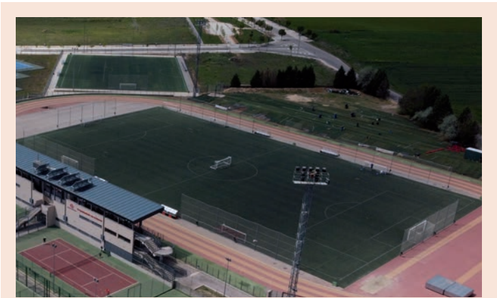
Los partidos de la Liga Municipal de Fútbol 7 se juegan en los campos del complejo San Miguel