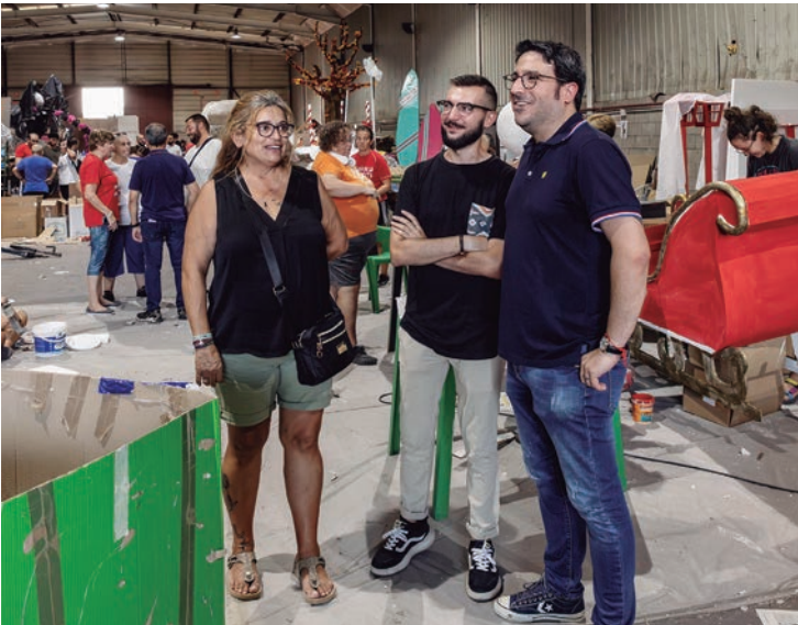
De izquierda a derecha, la concejala de Fiestas, el concejal de Sostenibilidad y el alcalde, durante la visita a las naves donde se prepara el Desfile