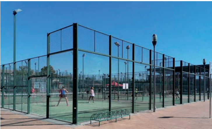
Imagen de archivo de las pistas de pádel del polideportivo Arroyo del Vallejo

Más información, en la oficina del Servicio Municipal de Deportes (SMD), ubicada en el polideportivo Ciudad de Azuqueca (c/ Ana María Matute, s/n), en el número de teléfono 949 27 75 28 y en el correo electrónico smdl@azuqueca.es . •