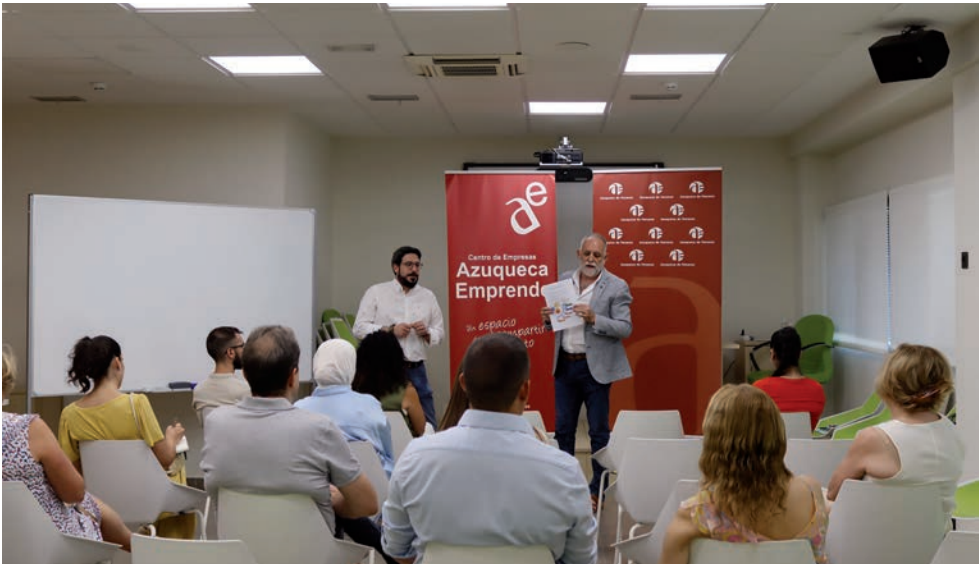
Un momento de la reunión, celebrada en el Centro de Empresas Azuqueca Emprende

En este sentido, el delegado provincial señaló que es el momento de decidir las familias profesionales del Centro Integrado de Azuqueca, “aunque sin cerrar puertas de cara a