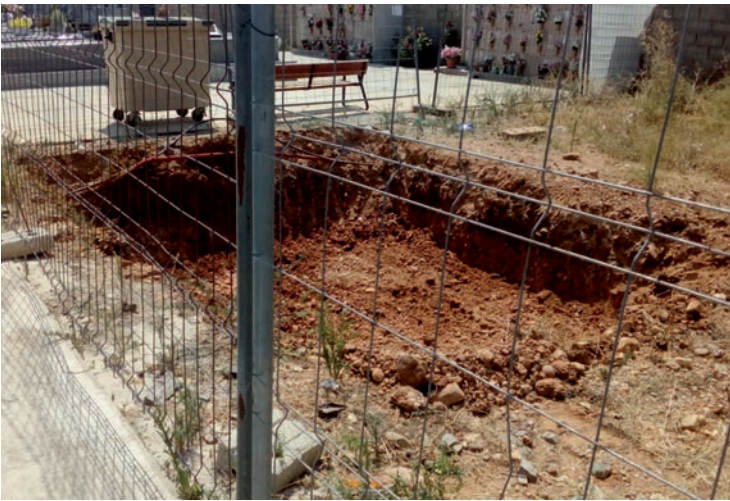
Los trabajos ya han comenzado

La intervención supone una inversión municipal total de 65.457,09 euros, y consiste, por un lado, en el acondicionamiento de media manzana en el campamento, incluyendo las calles de