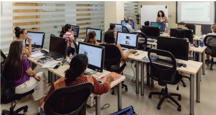
Dos imágenes de la visita de la concejala al curso