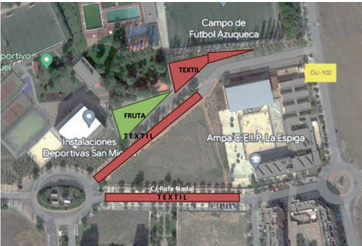
Distribución de los puestos en la ubicación temporal del mercadillo

ambas actividades y, por ello, se suspendía el mercadillo durante dos semanas, pero el año pasado optamos por el traslado, con muy buena acogida tanto por parte de los vendedores como de los vecinos y vecinas”, añade. En la nueva ubicación del complejo San Miguel, se mantiene la numeración de los puestos, así como los horarios de funcionamiento: de 7:30 a 9 horas, instalación; de 9 a 14 horas, venta y, de 14 a 15 horas, recogida. La edil azudense insiste en que “la limpieza se debe mantener durante toda la jornada y, si al recoger, la zona queda sucia se pueden imponer sanciones