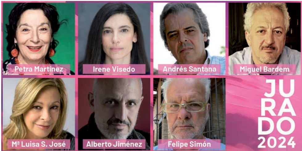
Integrantes del jurado del FESCIGU, que se celebrará en Azuqueca

Tras asistir a las proyecciones, se propone a los centros “retomar la experiencia vivida”, a través de unas fichas didácticas que se podrán descargar desde la página web del Festival ( www.fescigu.com ) con material para trabajar en las aulas sobre estos cortometrajes, “reforzando el aprendizaje, y fomentando el debate y asimilación de ideas y valores”.