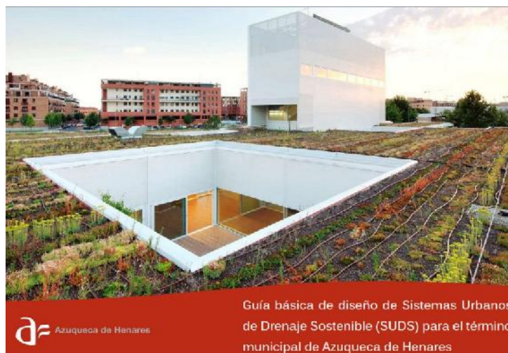
Guía básica de diseño de Sistemas Urbanos de Drenaje Sostenible (SUDS) para el término municipal de Azuqueca de Henares