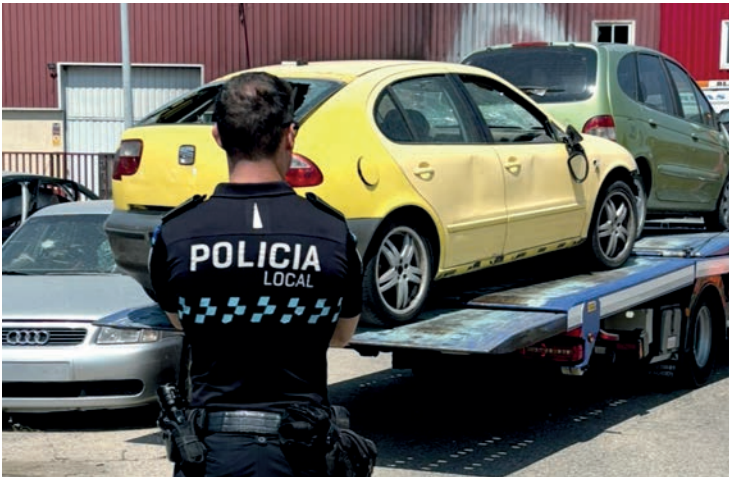
Retirada de un vehículo abandonado en la vía pública