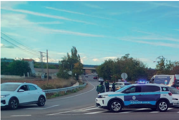
Imagen de archivo de un dispositivo de Seguridad establecido en Azuqueca

A tenor de las cifras publicadas por Interior, entre enero y