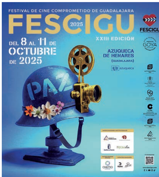
Cartel del Festival

Sección Oficial. Se proyectarán en tres sesiones 21 cortometrajes “de gran variedad temática y estilística”, según la organización. Compiten por los principales premios del festival y podrán optar además