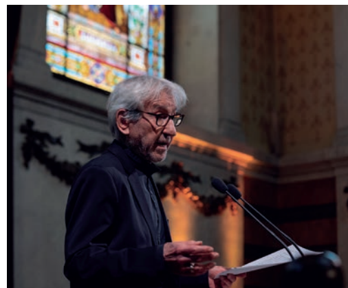
José Sacristán, en una imagen de la Real Academia Española, del pasado 29 de abril.

José Sacristán Turiégano nació en Chinchón (Madrid) en 1937. Sus primeros papeles los interpretó en el teatro aficionado y enseguida se incorporó al mundo del cine, donde sus éxitos estuvieron ligados inicialmente al denominado "landismo", el grupo de ac-