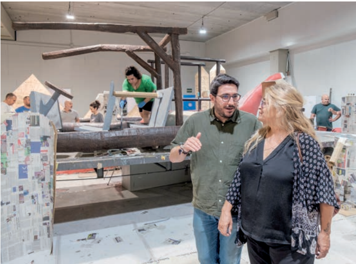
Visita a la nave cedida a las Peñas Públicas por el Ayuntamiento para la construcción de las carrozas.

Tras salir de la calle Río Henares, el desfile seguirá por la carretera de Alovera y las avenidas de Torrelaguna y de Francisco Vives hasta la plaza de La Constitución, donde se dará a conocer la decisión del jurado y se entregarán los premios. •