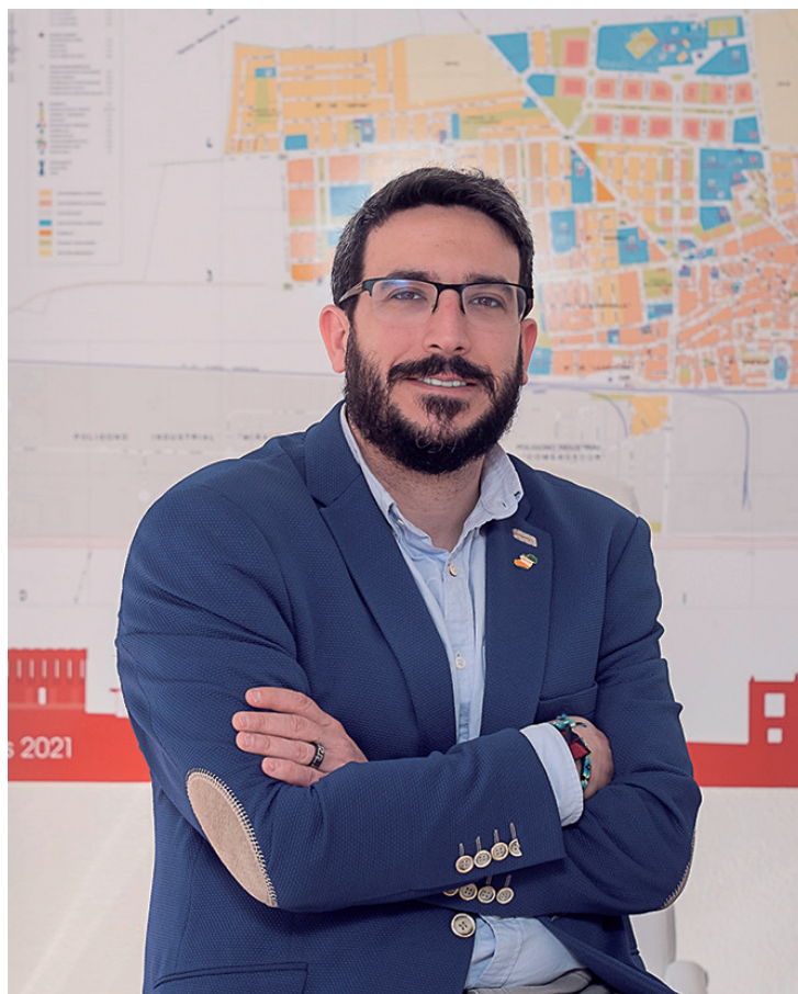
Miguel Óscar Aparicio, alcalde de Azuqueca de Henares

El alcalde azudense muestra su agradecimiento a todas las personas que trabajan para que el “programa de fiestas sea una realidad”, en referencia a “empleados municipales, a las peñas, a las asociaciones, a la Policía Local, a Protección Civil, a la Guardia Civil y a todos los que de una forma u otra ponéis vuestro granito de arena”. •