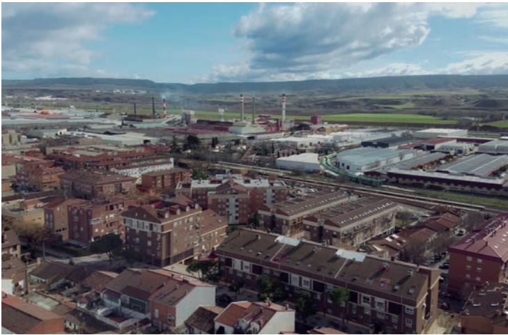
Imagen aérea de Azuqueca, con la zona industrial al fondo

media de España, pero siempre es necesario hacer esfuerzos para seguir mejorando las cifras y, lo que es más importante: lo que hay detrás: familias y personas que mejoran su situación, su bienestar, a través del trabajo”, añade el regidor, al tiempo que asegura que “estos datos responden al esfuerzo y al trabajo diario de los vecinos y vecinas, pero también a la gran labor que realizan las empresas de Azuqueca porque, sin sus ganas de invertir, esto no sería posible”. “Tenemos nuestras puertas siempre abiertas para atender los planteamientos de nuestras empresarias y nuestros empre-