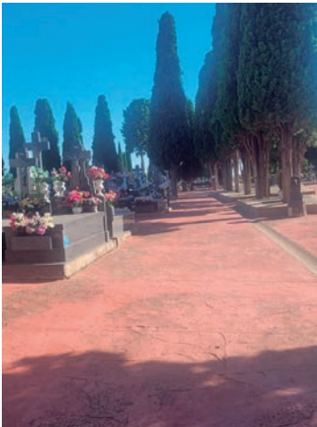
Una de las calles del cementerio