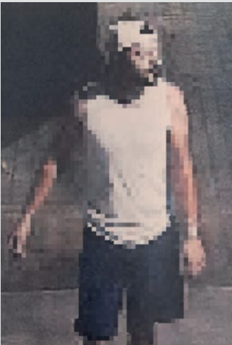
Imagen del autor de actos vandálicos en el bulevar de Las Acacias grabada por el sistema de videovigilancia

“Estos tres casos demuestran la eficacia del sistema de videovigilancia urbana, que se ha consolidado como una herramienta esencial para la labor diaria de la Policía Local”,