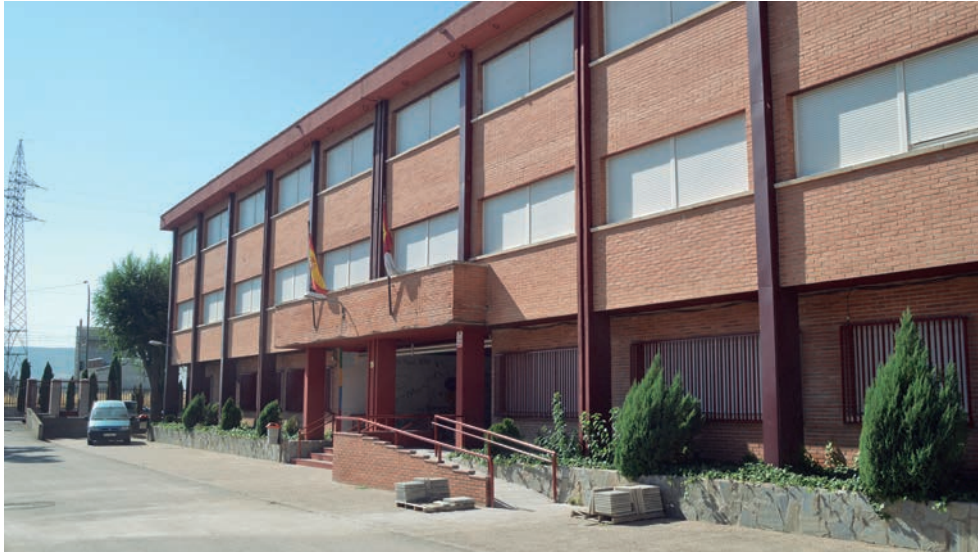
Imagen de archivo del CEIP Virgen de La Soledad

Por otra parte, se están tramitando mejoras y compra de materiales para las escuelas infantiles municipales, por un importe que ronda los 50.000 euros. Se ha adjudicado ya la instalación de un toldo para el edificio de