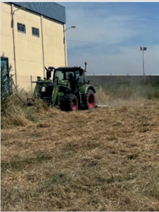
Desbroce en una parcela privada