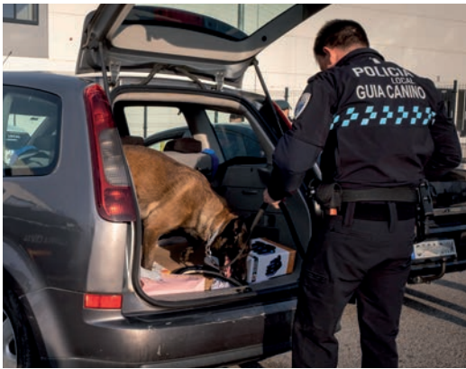
Imagen de archivo de un control de la Policía Local con apoyo de la Unidad Canina

El Ayuntamiento de Azuqueca de Henares publicó el 7 de agosto la convocatoria de la primera prueba del proceso selectivo para cubrir 10 plazas de Policía Local. “Iniciamos así la fase definitiva para incorporar diez nuevos agentes y reforzar la plantilla municipal e ir adaptándola a las necesidades actuales de la ciudad”, explica el alcalde, Miguel Óscar Aparicio. “La tramitación se ha demorado en el tiempo por distintas razones, pero ya hemos dado el primer paso para poder aumentar el número de policías en Azuqueca”, señala. El regidor azudense destaca “el compromiso y la dedicación” de la Policía Local. “Contamos con un cuerpo preparado y pionero en distintas áreas como la Unidad Canina, que desarrolla una labor fundamental en el control del menudeo de drogas; la Unidad de Drones, que ayuda en la vigilancia y el seguimiento de eventos o incidentes, o la figura de la Agente Tutor, que sirve de enlace y apoyo en la comunidad educativa”, repasa Miguel Óscar Aparicio. En esta primera prueba, se valorará la aptitud física de las personas candidatas -más de 350- y se desarrollará los días 11 y 12 de septiembre, a partir de las 9 horas, en la pista de atletismo del complejo San Miguel. “Debido al gran número de participantes, ha sido necesario habilitar dos jornadas y crear dos grupos”, aclara la concejala de Recursos Humanos, Piedad Agudo. Según recoge la convocatoria, “los aspirantes deberán