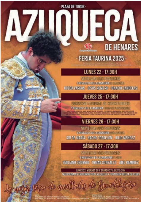
Cartel de la Feria Taurina

Las tarifas del abono de la Feria Taurina, con entrada para las tres novilladas, son las siguientes: general sin recortes, 40 euros; general con recortes, 45 euros, para peñistas, pensionistas y jubilados, 30 euros sin recortes y 35 euros con recortes. Las entradas individuales costarán 18 euros (general) y 15 para pensionistas y jubilados. Las localidades para los recortes, en venta anticipada, costarán 10 euros, en taquilla, 12, y para menores de 2 a 11 años, 5 euros (anticipada y en taquilla).