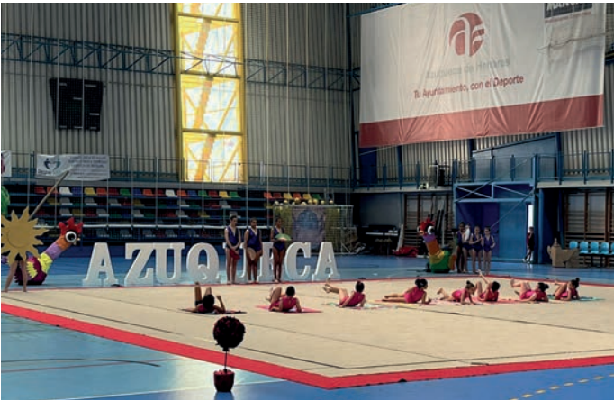
Escuela Municipal de Gimnasia Rítmica

Las actividades disponibles para adultos son Esgrima, Karate, Pádel, Patinaje, Pilates, Taichi, Tenis, Tiro con arco y Yoga.