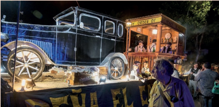
El Catre: “Peaky Blinders”