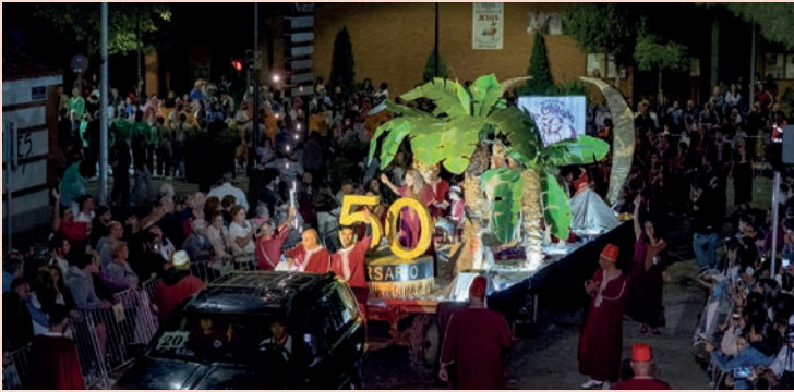
La Chilaba: "Camello especial 50 aniversario"