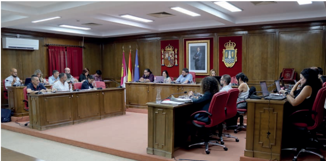
Un momento de la sesión ordinaria del Pleno del Ayuntamiento de Azuqueca de Henares celebrada el 2 de octubre