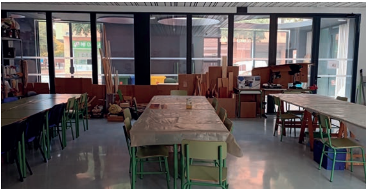
Interior de una de las aulas del Centro de Artes de Azuqueca, con los materiales preparados para el curso de los talleres municipales