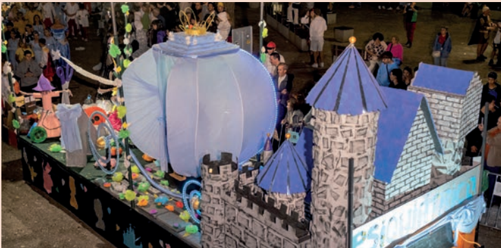
El Psiquiátrico: "Cenicienta"