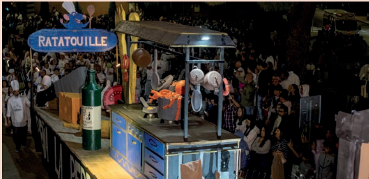
La Perrera: “Ratatouille”