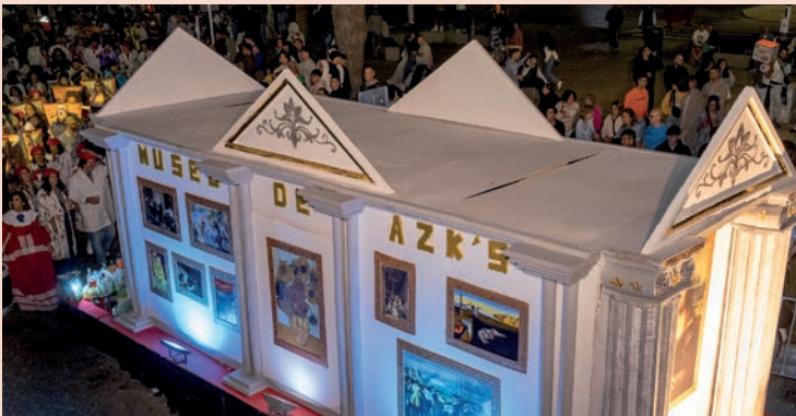
Azikuékanos: “Museo itinerante”