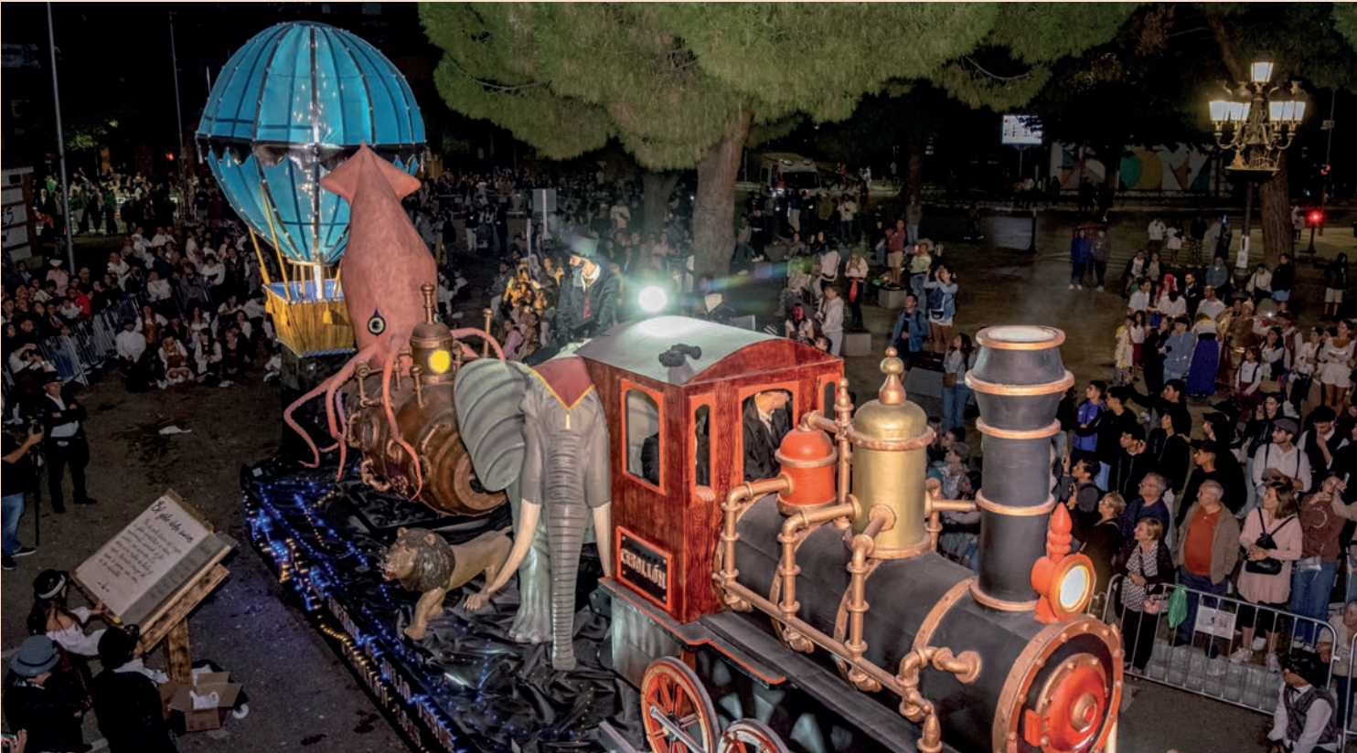
La Peña Pública El Cebollón se alzó con el primer puesto del Desfile con “Los sueños de Verne”.

> También se premiaron los diseños de El Bollo, Chupichusky’s, Las Torres y La 22