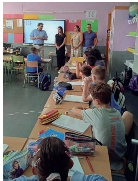
El alcalde y la concejala entregaron el material en una de las aulas de La Paloma

Bajo el lema “Nuestra ciudad, nuestro mundo”, tanto la agendas como los cuadernos incluyen varias páginas en las que se describe Azuqueca, se repasan los recursos municipales educativos y deportivos -información sobre las escuelas infantiles, la Escuela Municipal de Idiomas y la UNED, además del calendario escolar-, se presentan las actividades de la Biblioteca Municipal Almudena Grandes y la Casita de los Cuentos, los talleres del área de Cultura y las Escuelas Deportivas Municipales, se informa del programa