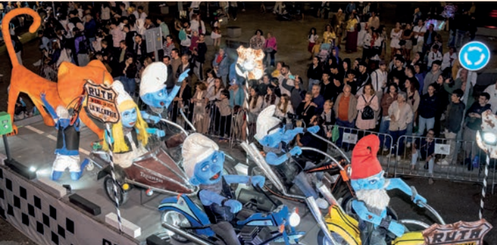
La Funeraria: “Pitufiruta”