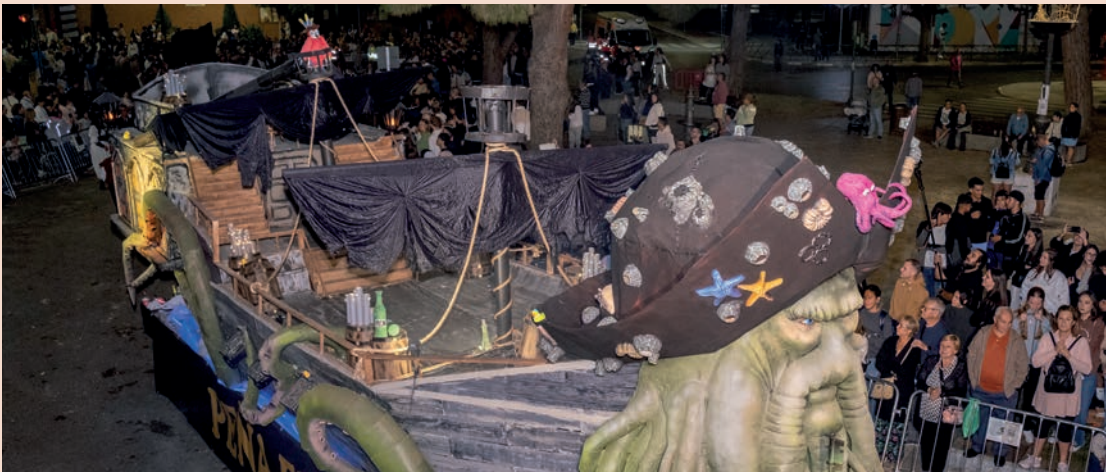
La Peña Pública El Bollo, finalista con la carroza titulada “Piratas del Caribe”

Coincidiendo con la entrega de premios, Susana Girón dará una charla. Girón es experta universitaria en Fotografía y Artes Visuales, trabaja con medios como New York Times o El País , y ha recibido numerosos premios y reconocimientos.