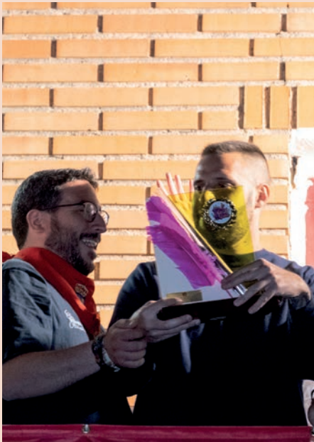
A la izquierda, cohete de inicio del Desfile; a la derecha, premio para la peña El Cebollón