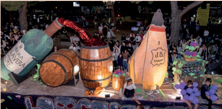
La Calavera: “La carroza del vino”