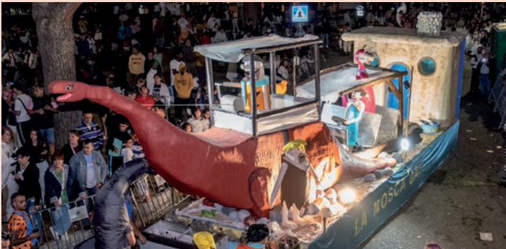
La Mosca'Gao: "Los Picapiedra"