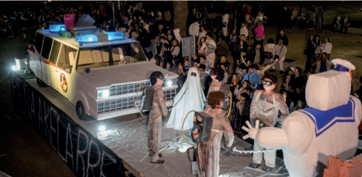
El Akelarre: “Cazafantasmas”