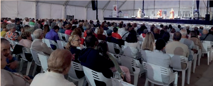
Presentación de la Asociación Flamenca de Azuqueca de Henares