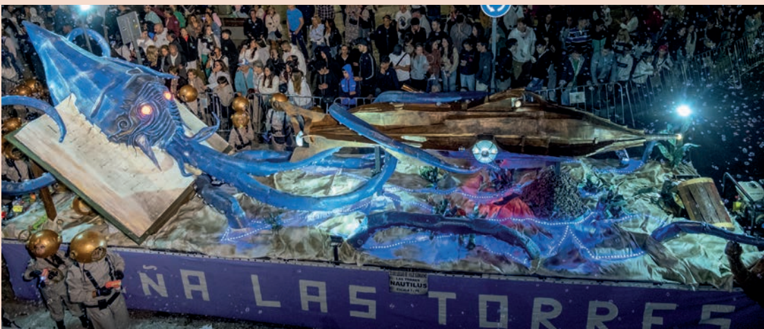
La Peña Pública Las Torres, finalista con la carroza titulada “20.000 leguas de viaje submarino”