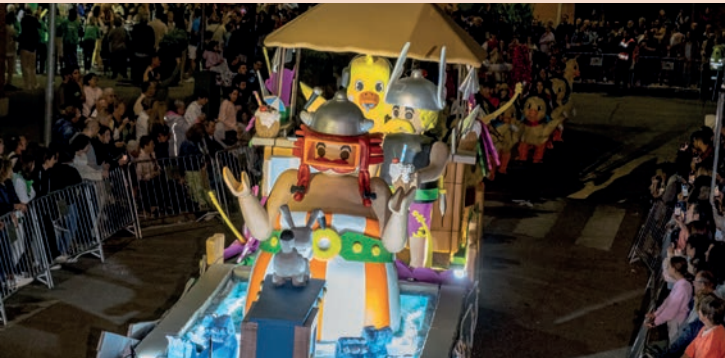
El Trébol: “¡Al agua patos! Digo... ¡al agua galos!”