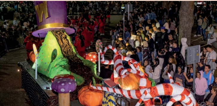
Los Dalton: “Charlie y la fábrica de chocolate”