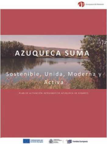
Imagen identificativa del PAI