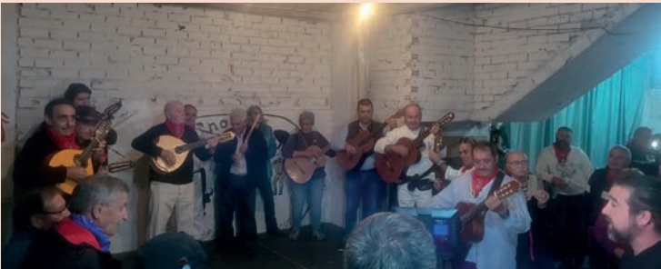
Ronda de los Casaos