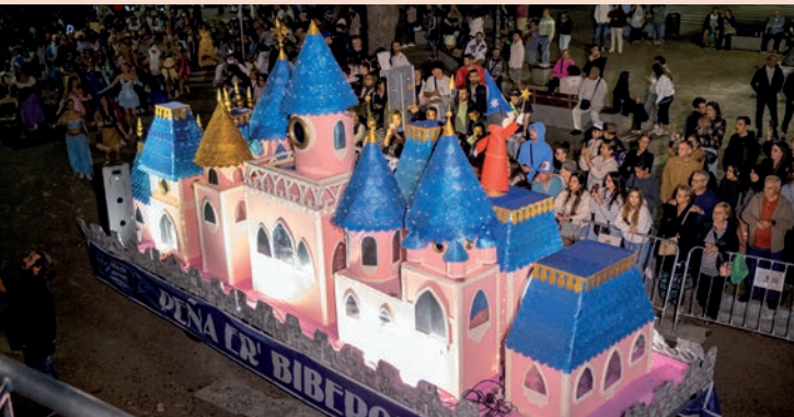
Er'Biberon: “Disney World”