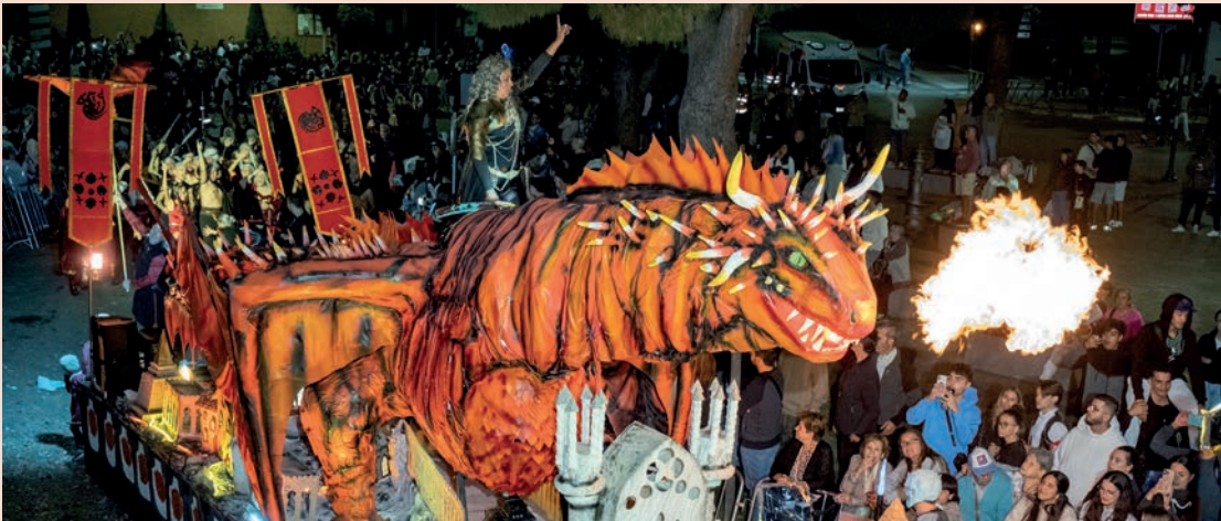
La Peña Pública Chupichusky's, finalista con la carroza titulada “Casa de Dragones”