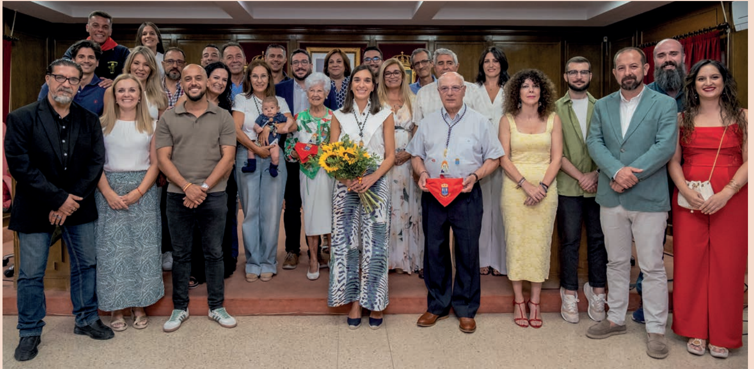
Los Populares del Año y la corporación municipal, tras la entrega de los reconocimientos.

> Este reconocimiento se concedió por unanimidad en la sesión extraordinaria del 19 de septiembre y a propuesta de las Peñas Públicas y del Ayuntamiento