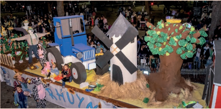
La Rhuyna: "La granja"