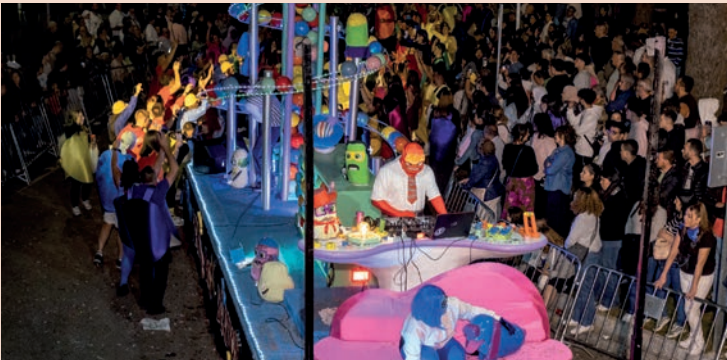
Los Bravos: "Del Revés"