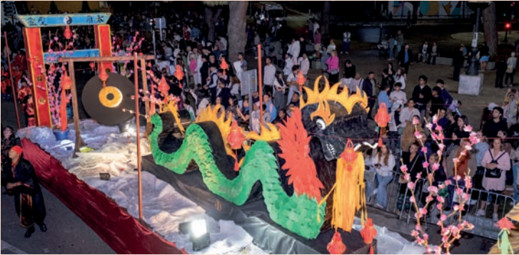
El Palike: "China"