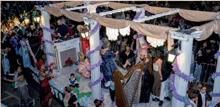
La Amistad: “Los Bridgerton. El salón de baile de la reina Carlota”