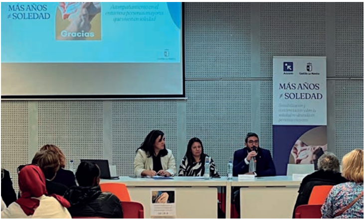
En las jornadas intervinieron la consejera de Bienestar Social (en el centro de la imagen) y del alcalde (a la derecha)

“Hay mucha gente que por distintas circunstancias se encuentra sola y hay que luchar contra esa falta de compañía”, dijo el regidor azudense. “Estas jornadas dan ideas para que estas personas puedan vivir mucho mejor y tener distintas opciones sobre la