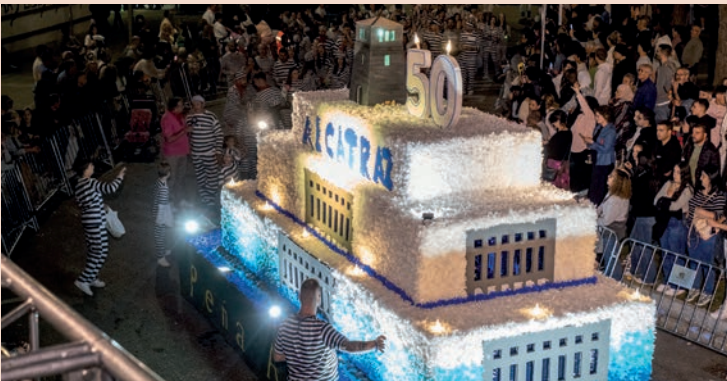
Alcatraz: "Tarta 50 aniversario"