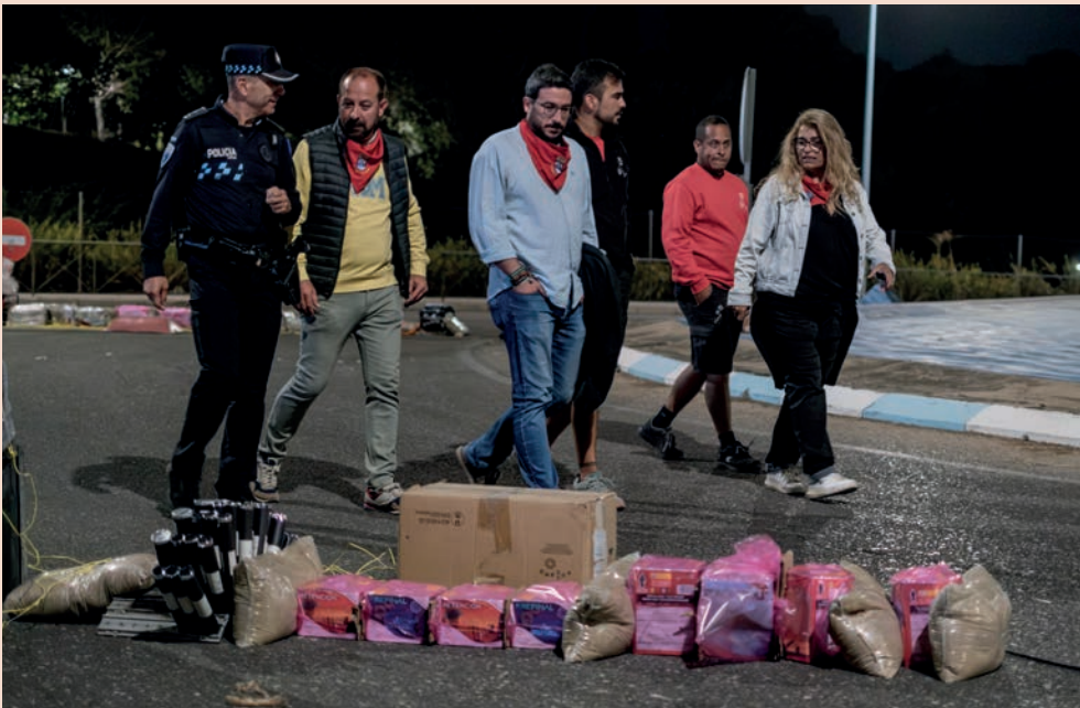
El alcalde, la concejala de Fiestas y el edil de Seguridad revisan, junto con Policía Local y responsables de la empresa, el montaje de los fuegos artificiales del fin de fiesta.

El alcalde insiste en el “altísimo nivel” de los diseños participantes en la 48ª edición del Desfile de Carrozas, Fiesta de Interés Turístico Regional. “Siguen siendo una de las grandes señas de identidad de nuestras fiestas”, de las que, entre los más de 200 actos programados, también destaca los conciertos de Hevia y Serafín Zubiri, acompañados por la Banda de Gaitas de la Casa de Asturias y la Banda de Música de Azuqueca, respectivamente; el festival CLM Suenan, de la mano del Gobierno Regional y con “el mejor indie nacional”, y los “momentos emocionantes de homenaje y recuerdo a El Portu, Kako y Félix París, presidente de la Hermandad Virgen de la Soledad”.