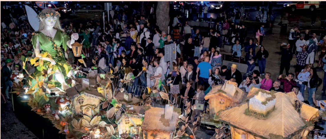
La Peña Pública La 22, finalista con la carroza titulada “Duendes y hadas, un mundo de fantasía”