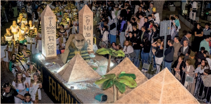
El Felpudillo: "Egipto"