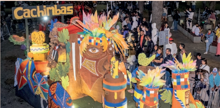
Los Cachimbas: "Selva africana"