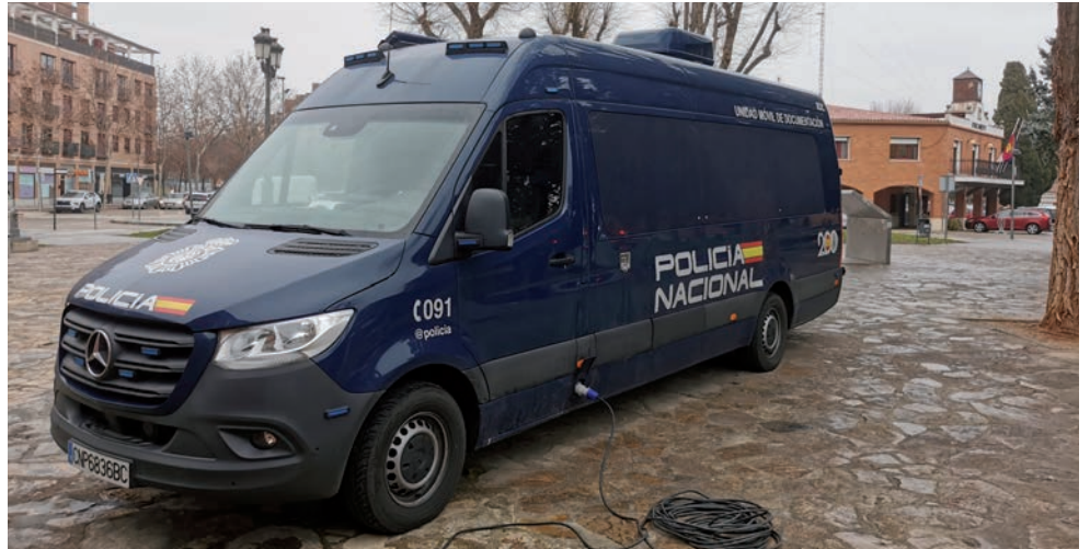
Imagen de archivo de la visita del VIDOC a Azuqueca el pasado mes de enero

El VIDOC, que se instalará en la plaza de La Constitución, en las proximidades del Ayuntamiento, permite la tramitación, emisión y entrega del DNI y pasaporte de manera instantánea. En cuanto a las tasas, la expedición del DNI cuesta 12 euros, aunque es gratuito en caso de renovación por cambio de filiación y/o domicilio, para miembros de familia numerosa y para menores de 14 años integrados en una unidad de convivencia que solicite