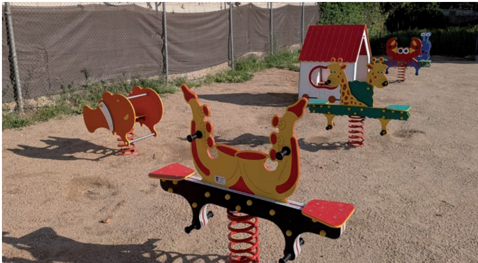
Nuevos columpios instalados en el CEIP Maestra Plácida Herranz

> También ha instalado nuevos elementos de juego en las Escuelas Infantiles municipales