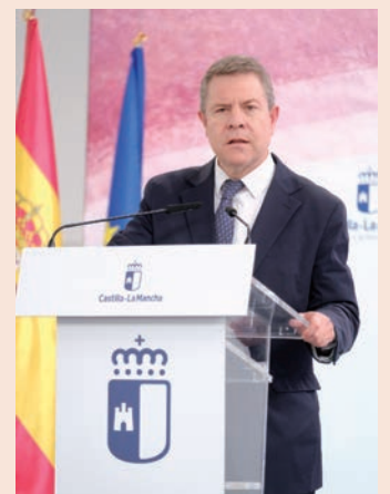
Un momento de la intervención del presidente de Castilla-La Mancha

García-Page también avanzó la firma inminente -en la semana siguiente a la celebración de la feria, según detalló- de la renovación del convenio para ampliar la prestación de la ayuda a domicilio en Azuqueca y con una dotación económica