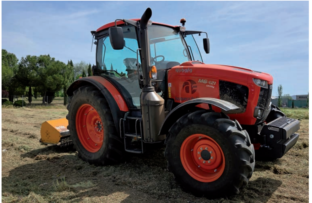
El nuevo tractor adquirido por el Ayuntamiento de Azuqueca

Con la entrada en servicio de este vehículo, el Departamento de Jardinería pasa a contar “con una máquina multiusos equipada con desbrozadora frontal, una desbrozadora de martillos tipo Orec y desbrozadoras de hilo, con la que se van a realizar trabajos de