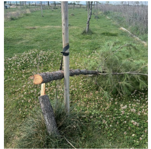
Dos de los pinos talados en el acto vandálico

“Es un gran daño medioambiental, porque, entre otros beneficios, los árboles ayudan a combatir la contaminación atmosférica, refrescan el ambiente y proporcionan hábitat a otras especies”, enumera. “Pero también genera un importante perjuicio económico al malograr la inversión realizada y requerir una nueva inversión para retirar los árboles cortados, preparar la tierra y proceder al replazo de los árboles”, concluye. •