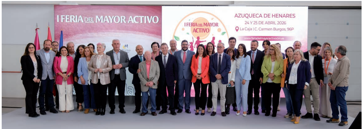
En el centro, el presidente de Castilla-La Mancha y el alcalde de Azuqueca de Henares, junto a otras autoridades locales, provinciales y regionales, al acabar el acto de inauguración de la feria.

> El presidente de Castilla-La Mancha y el alcalde inauguraron esta cita, que se desarrolló el viernes 24 y el sábado 25 de abril