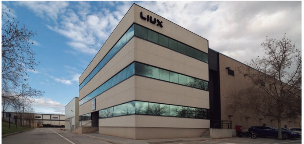
Imagen exterior de las instalaciones de LIUX en Azuqueca

Según los datos hechos públicos cuando se dio a conocer el proyecto, la instalación de LIUX en Azuqueca, que ocupa 6.000 metros cuadrados en el polígono Miralcampo, supondrá una inversión de 30 millones de euros en los próximos cinco años. Se estima que se generarán alrededor de 500 puestos de trabajo, 185 de ellos directos y el resto, indirectos.